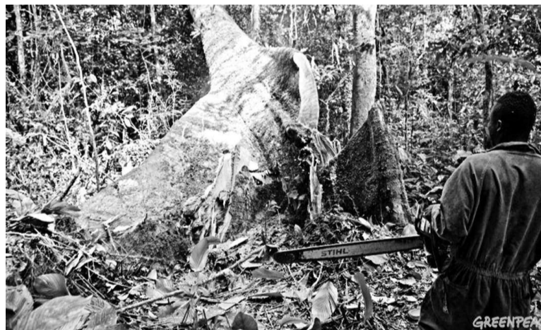
Coupe de bois

La saisie de ce bois, pourtant interdit d'ex-