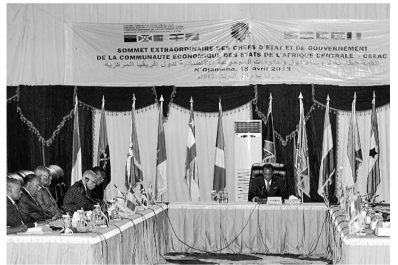
Les chefs d'État et de gouvernement pendant le sommet de Ndjamenena

Le chef de l'État, le Premier ministre, les ministres du gouvernement de transition, le président et les membres du bureau du Conseil national de transition (CNT) sont exclus des prochaines élections.