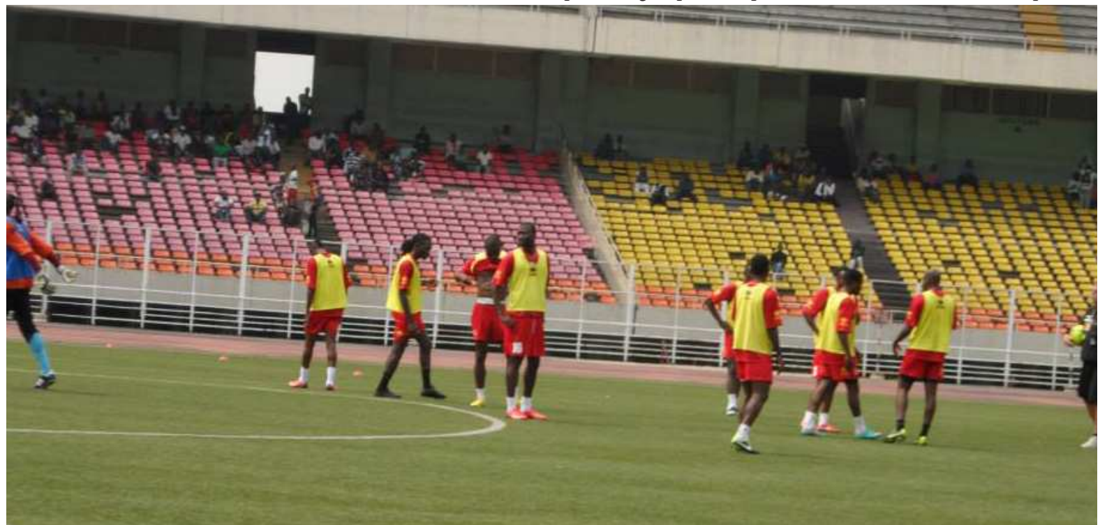
Les Léopards à l'entraînement au stade des Martyrs

Mais cette première participation a laissé un goût d'inachevé avec l'élimination dès le premier tour de la CAN 2013 en Afrique du Sud, l'organisation de la compétition passant désormais en année impaire. Claude Le Roy a soutenu que les Léopards étaient en terre sud-africaine pour apprendre. Toutefois, un pays comme le Cap-Vert, qui fêta sa première qualification en phase finale, a accédé au deuxième tour. Le deuxième objectif du technicien français, et aussi le plus important, était la qualification pour la phase finale de la Coupe du Monde