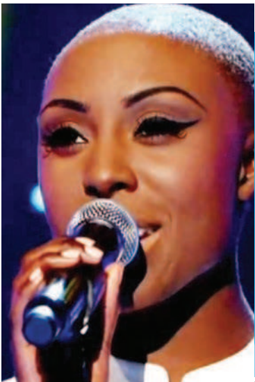
LAURA MVULA : CHANTEUSE