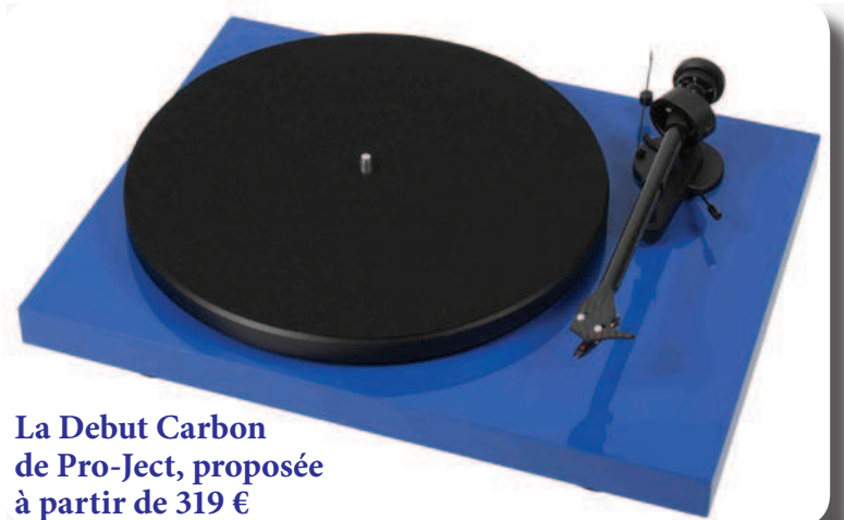
La Debut Carbon de Pro-Ject, proposée à partir de 319 €

Avec le retour en grâce des vinyles, le marché des platines est à nouveau en plein essor. Des premiers prix à 196 800 FCFA (300 €) aux modèles de luxe à plus de 65,6 millions FCFA (100 000 €), toutes sont des concentrés de nouvelles technologies et de design épuré. On craque !