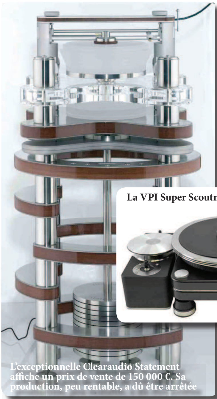
L'exceptionnelle Clearaudio Statement affiche un prix de vente de 150 000 €. Sa production, peu rentable, a dû être arrêtée