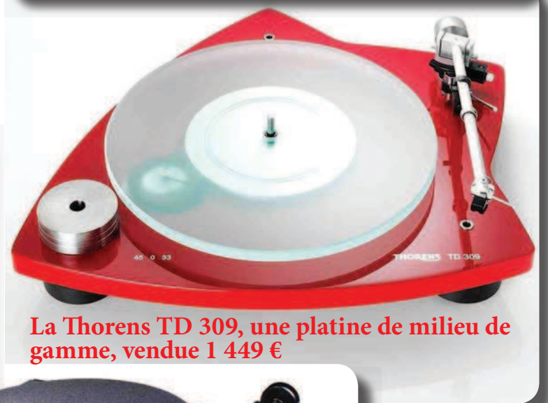
La Thorens TD 309, une platine de milieu de gamme, vendue 1 449 €