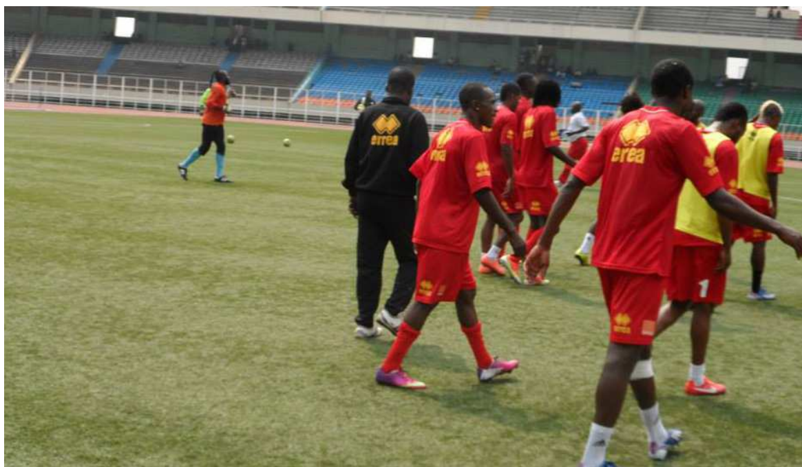
Les Léopards préparent le match contre les Lions indomptables du Cameroun au stade des Martyrs