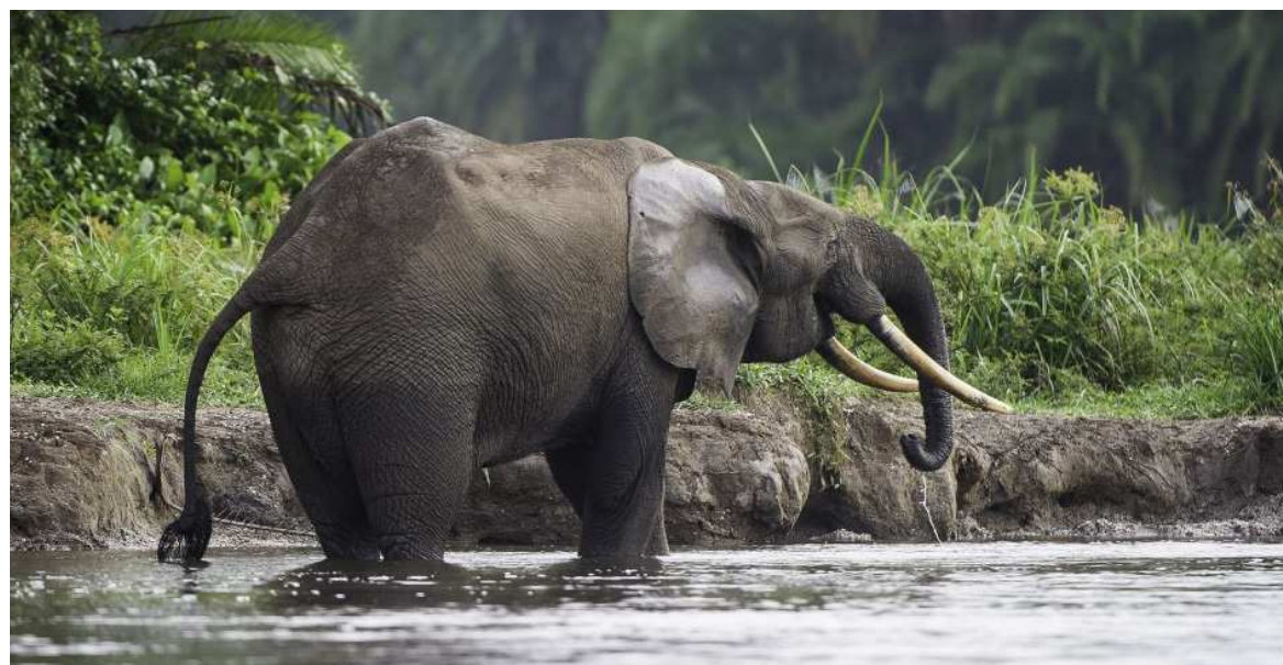
La parc d'odzala

environ 50 millions de touristes dans le monde. De récentes estimations prédisent qu'en l'an 2020 ce chiffre sera en nette augmentation, jusqu'à atteindre 1,6 milliard de personnes qui se déplaceront à travers le monde pour des raisons professionnelles, pour chercher du travail, pour affaires, ou encore pour les loisirs. Plus de 200 millions d'emplois directs et indirects seront créés grâce à ces mouvements.