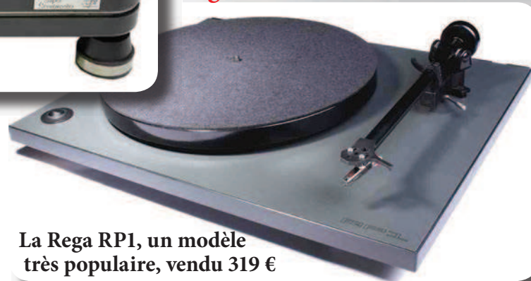
La Rega RP1, un modèle très populaire, vendu 319 €