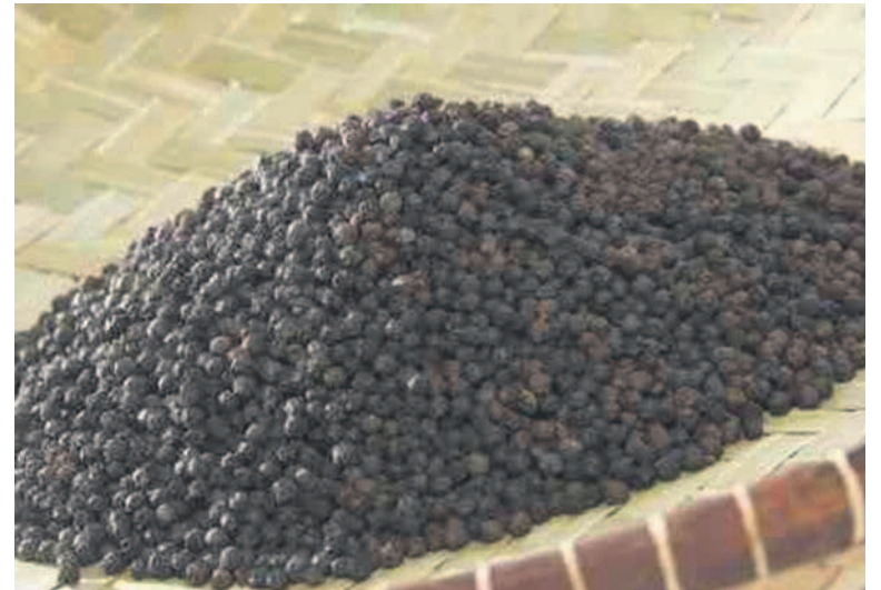
Les graines de poivre noir

soleil lorsqu'il est arrivé à maturité. C'est quand il est rouge (mûr) qu'il devient noir en séchant. En cuisine, au Congo, il est utilisé pour relever les plats – poisson, viande, légumes (saka-saka) – en apportant un léger goût pimenté. Mais en dehors de ses atouts culinaires, le poivre noir est utilisé dans le domaine de l'aromathérapie, une médecine douce qui emploie ce condiment pour traiter ou prévenir certaines maladies. Également bénéfique en huile de massage, le poivre a aussi des propriétés antidépressives. Selon les scientifiques, il aiderait à combattre le cancer du sein grâce à un composé naturel, la pipérine du poivre noir. Ce dernier, propriété aux multiples vertus, contribuerait à ce que la curcumine soit plus efficace dans le combat du carcinome mammaire ou cancer du sein. Un autre des bienfaits connus est qu'il favoriserait la digestion.