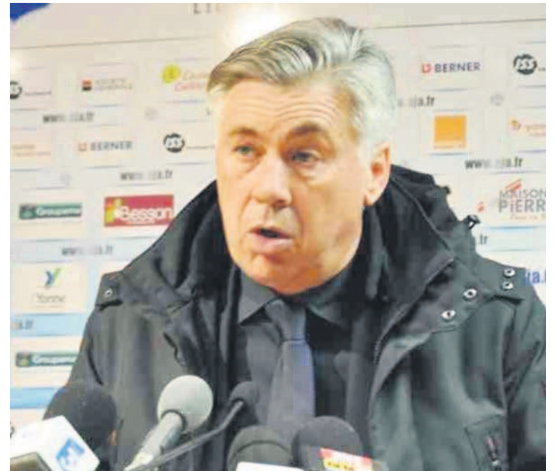
Sous contrat jusqu'en juin 2014, Carlo Ancelotti souhaite à tout prix quitter le PSG pour rejoindre le Real Madrid.

Si le Real reste dans l'indécision, le FC Barcelone a choisi de maintenir sa confiance en Tito Vilanova, dont la saison a longtemps été perturbée par sa lutte contre son cancer. L'ancien adjoint de Pepe Guardiola pourra jouir du renfort de la pépite Neymar, dont l'association avec Messi pourrait être explosive (dans tous les sens du terme), pour essayer de