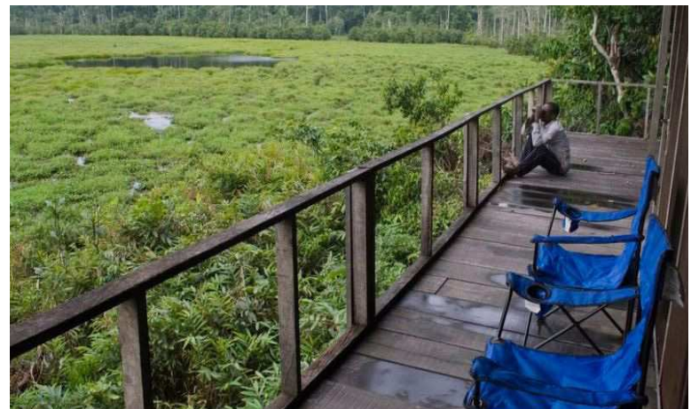
Le parc nouabale-ndoki

veut dire un retour aux valeurs fondamentales de cohabitation, avec l'environnement comme modèle, pour redynamiser l'économie africaine. On ne peut pas baser notre tourisme sur l'industrialisation, comme cela se fait dans d'autres parties du monde. Le système doit fonctionner de manière rigoureuse et réfléchi. Il est extrêmement important que l'Afrique sache valoriser son patrimoine culturel et paysager. » Ce modèle de tourisme met aussi l'accent sur la transformation du comportement des citoyens