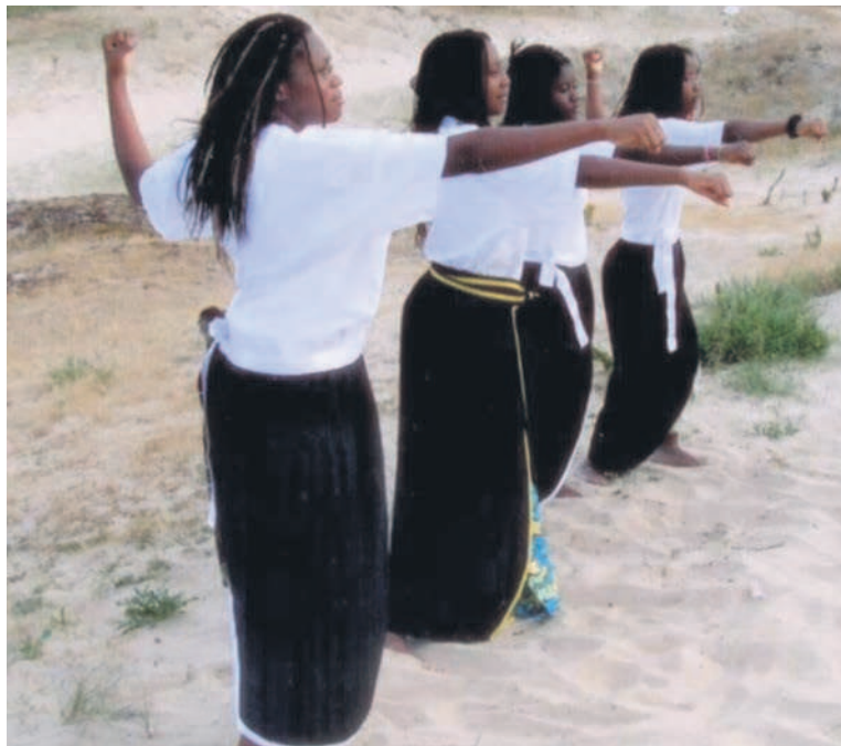
Une vue des boxeuses

1986, cet art martial avait le statut d'association affiliée à la Fédération congolaise de karaté et arts martiaux affinitaires (Fécoka-Ama). Cette affiliation a duré vingt-cinq ans. Le 24 mars 2013, la boxe des pharaons rénovée se détachait de la Fécoka-Ama pour devenir une fédération à part entière dont le