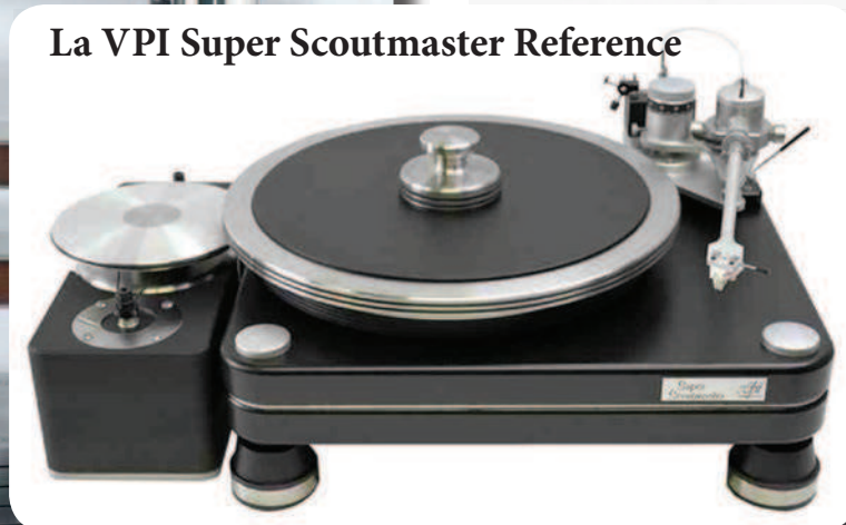
La VPI Super Scoutmaster Reference