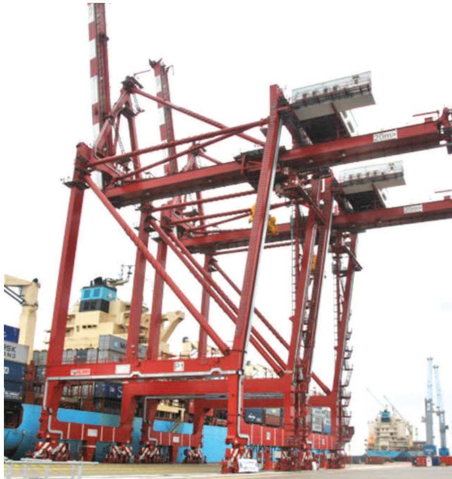
Les deux portiques

Avec la dernière phase des travaux d'extension qui sera achevée en 2036, Congo Terminal disposera de 38 ha de terre pleines (contre 17 ha d'aujourd'hui) et 1500 mètres de quais dont 800 mètres pour l'accueil des navires à très fort