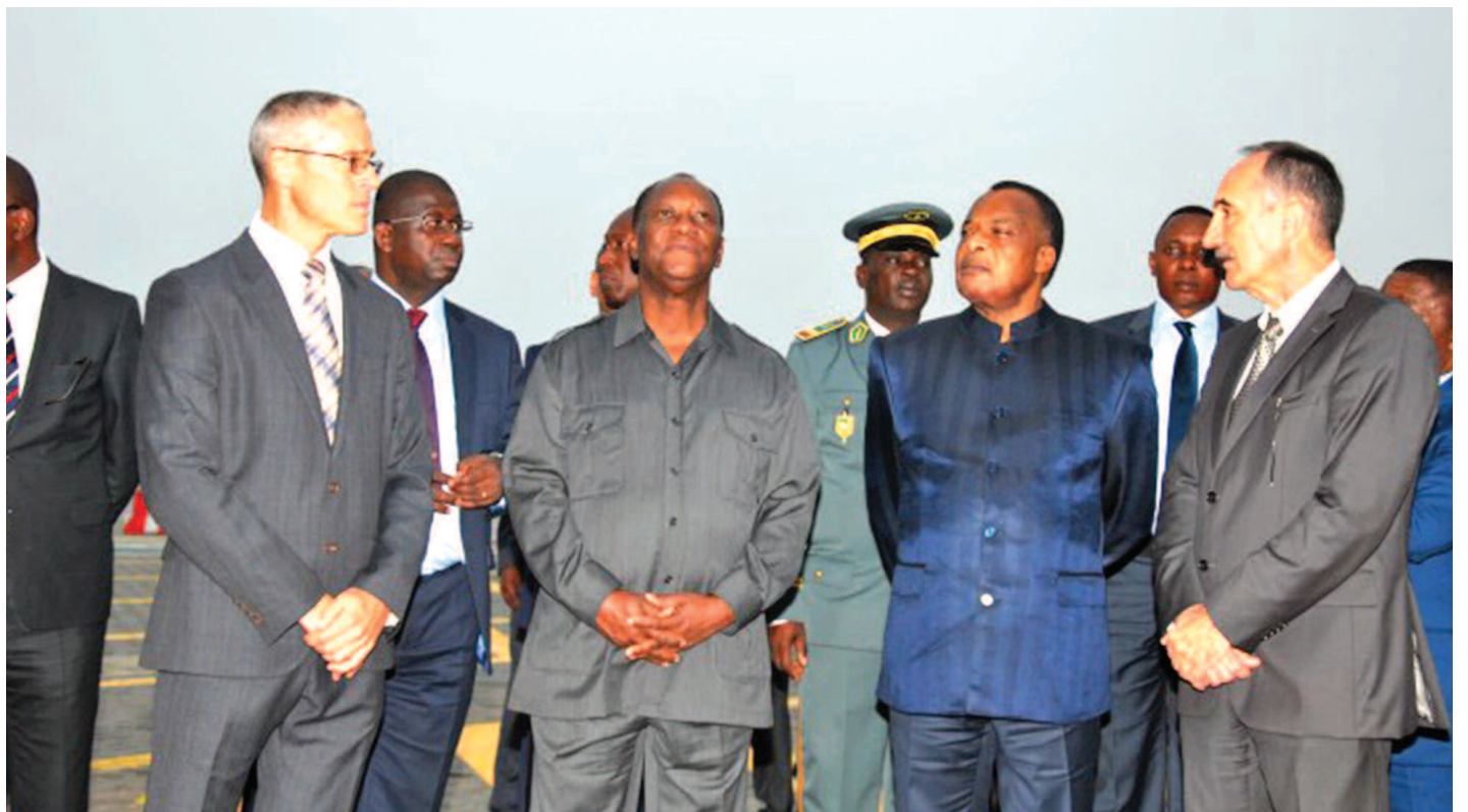
Les présidents Denis Sassou N'Guesso et Alasane Ouattara visitant les installations de Congo Terminal

Les investissements consentis par le Groupement Bolloré ont pour stratégie commerciale d'attirer au plus vite le plus grand nombre de transbordements, accompagner la progression du trafic national et favoriser le développement des trafics de transit. Ceci, a pour conséquence immédiate, la forte croissance du trafic Hinterland, l'amélioration des dessertes (routes, chemin de fer) entre Pointe-Noire et Brazzaville, le dévelop-