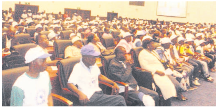
Les participants à la cérémonie de célébration de la Journée de l'enfant africain

Dans son message rendu public à cette occasion, le gouvernement s'est engagé à mobiliser toutes les ressources nécessaires pour aboutir à terme, à l'éradication progressive et effective de ces pratiques. « Pour être plus efficaces, les efforts doivent venir de l'intérieur de la culture qui les vit. C'est pourquoi, l'engagement de tous est sollicité afin de promouvoir les valeurs culturelles positives », a indiqué le ministre des Affaires sociales, de l'action hu-