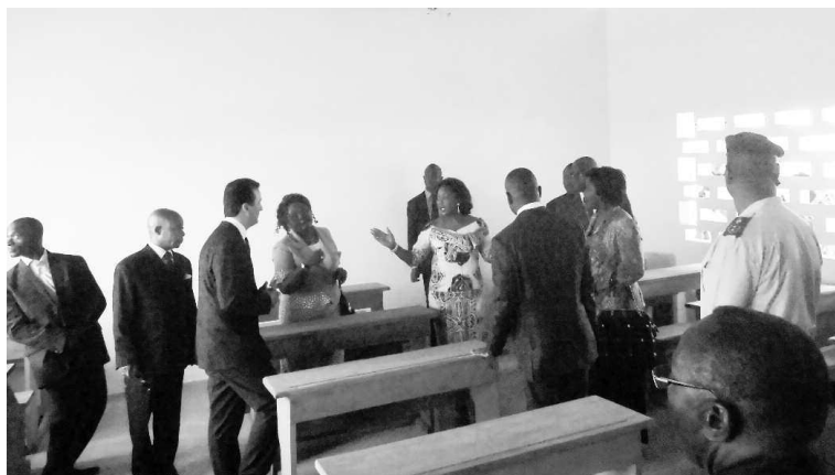
La visite guidée des salles de classe

Pour le directeur administratif et financier de cette société, l'école Marie-Madeleine exprime « la volonté inébranlable de celui qui se préoccupe aujourd'hui de moderniser son pays (le président Denis Sassou N'Guesso). C'est dans ces conditions que s'inscrit la présente réalisation pour accompagner cette politique salutaire devant permettre à nos chers enfants de Vindoulou de disposer d'une école de proximité au lieu de parcourir plusieurs dizaines de kilomètres pour se rendre dans les établissements scolaires lointains ».