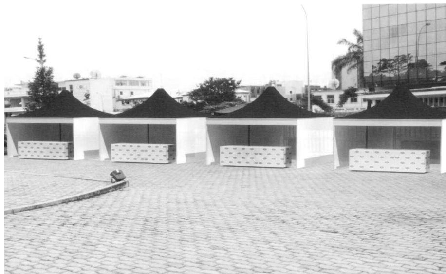
Présentation du village du savoir

Dans le souci de susciter cette envie de naviguer aux étudiants congolais,