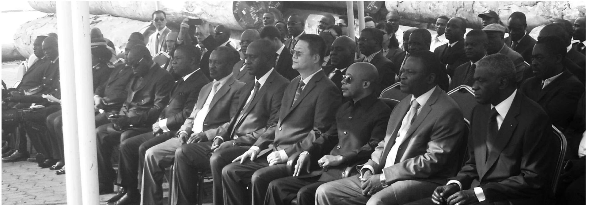
La tribune officielle lors de la réception du bateau Vela