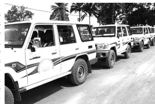
Un échantillon des véhicules

« Ces moyens de locomotion nous donne une certaine autonomie pour le