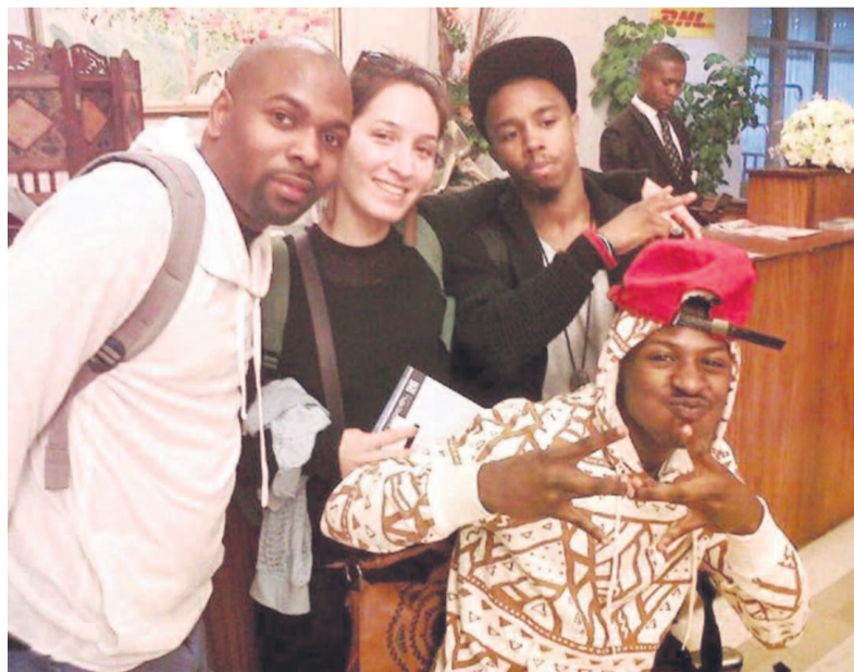
Les membres du groupe Rennie Harris puremovement