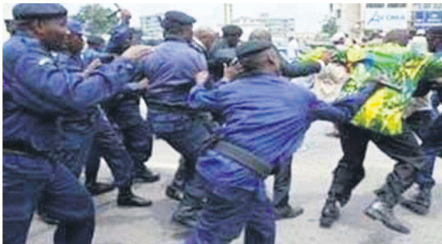
Échauffourées entre policiers et supporters à la sortie du stade des Martyrs

Plusieurs blessés et des dégâts matériels considérables, c'est le bilan des graves incidents survenus lors du derby de Kinshasa entre V.Club et DCMP.