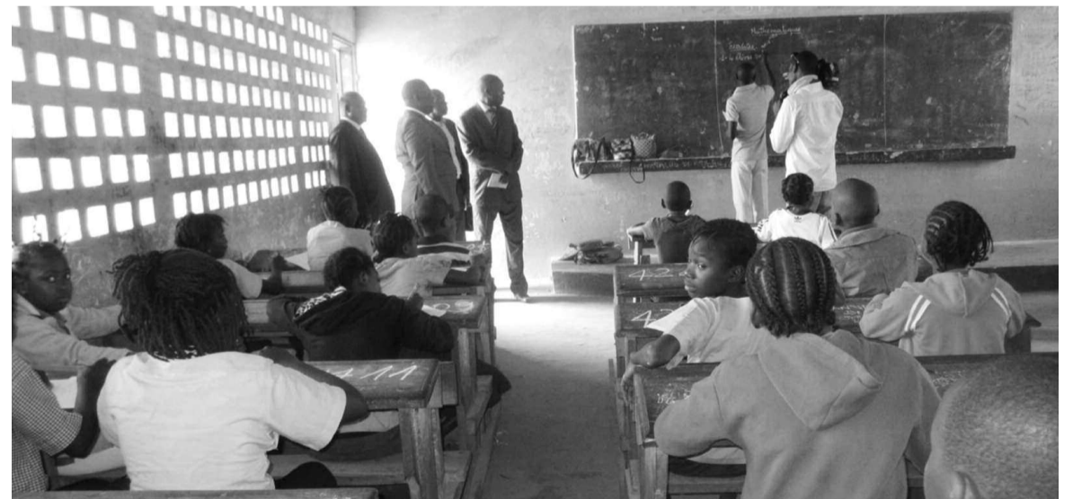
Lancement des épreuves

l'école conventionnée Ndaka Soussou et Conférence nationale dans l'arrondissement 3 Tié Tié, l'école 8 février à Loandjili et le collège Emmanuel Dadet Damongo à