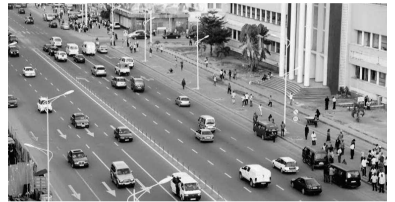
Le passage clouté et les signalisations sur le Boulevard du 30 juin

La Commission nationale de prévention routière (CNPR) s'est dite déterminée à moderniser la circulation routière dans le pays. Cela, avec l'utilisation du matériel de sécurisation de la nouvelle technologie. Pour le président national de la CNPR, Willy Vale-Manga, qui l'avait indiqué le 24 juin, « aucune route ne sera muette ». Cela signifie, à l'en croire, qu'aucune route du pays ne sera sans signaux. Dans cette décision, la CNPR s'est résolue de rendre fluide la circulation notamment sur les avenues de la ville Kinshasa dont la plupart ont été modernisées.