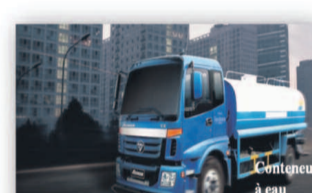
Citerne à eau