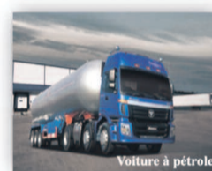
Voiture de pétrole