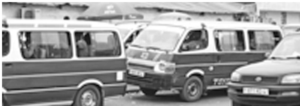
Des minibus de transport public à Brazzaville.

La Fédération syndicale des professionnels du transport du Congo (FÉSYPTC), a procédé le 19 juillet à la visite de quelques parkings de Brazzaville. L'opération qui obéit à la lutte contre le phénomène dit de « demi-terrains » permet aussi d'évaluer le travail accompli par les régulateurs placés dans ces lieux.