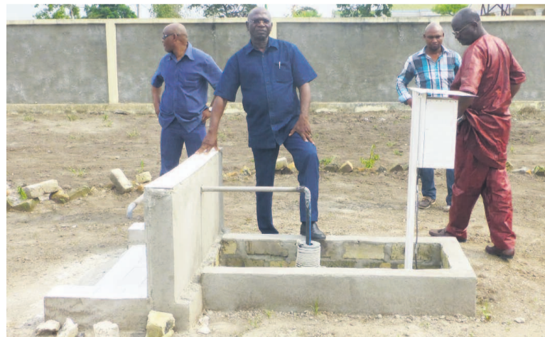
Un forage en construction à Epéna

À quelques jours du terme de son mandat, le président du Conseil départemental de la Likouala a effectué une visite de terrain dans sa circonscription administrative pour se faire une idée du travail accompli. En cinq ans, une soixantaine d'ouvrages d'intérêt communautaire ont été réalisés dans les sept districts que compte le département. Ce bilan n'est pas à la hauteur