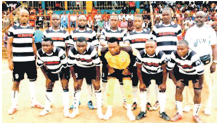
Bukavu Dawa du Sud-Kivu