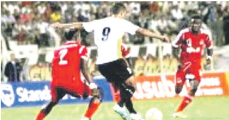
Une vue du match Entente Sétif contre Mazembe

De la première période de cette rencontre officiee par l'arbitre gambien Omar Saleh,