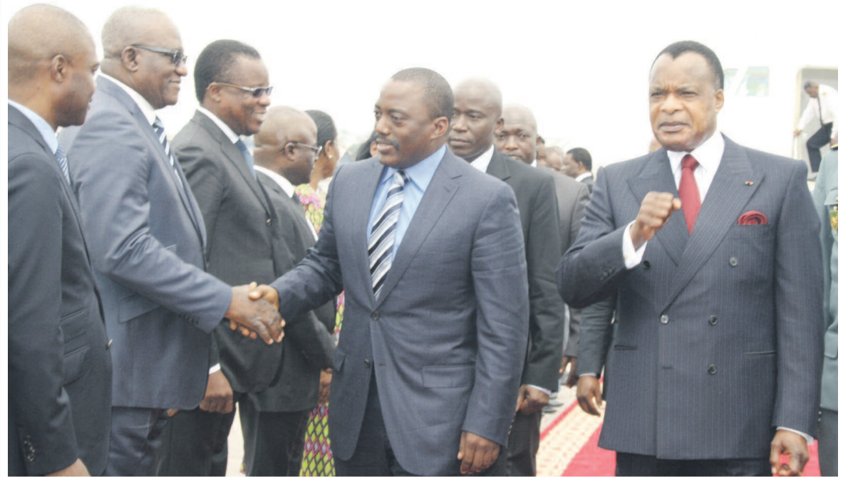
Le président Joseph Kabila saluant les membres du gouvernement congolais à l'aéroport de Brazzaville, le 19 juillet.

Le chef de l'État congolais, Denis Sassou N'Guesso, s'est dit, vendredi, à l'occasion de la visite de travail d'une journée de son homologue de la République démocratique du Congo (RDC), Joseph Kabila, à Brazzaville, disponible pour assurer la médiation dans les concertations nationales réclamées par l'opposition de ce pays au cas où les autorités de ce pays le solliciteraient.