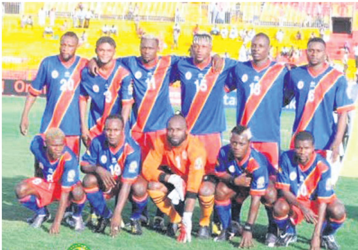
Les Léopards locaux attendus à Dolisie par les Diables Rouges du Congo Brazzaville

Vainqueurs par deux buts à un au match aller le 7 juillet au stade des Martyrs de Kinshasa, les Léopards sont astreints à préserver cette avance afin d'obtenir leur qualification. Et la tâche ne s'annonce pas facile au regard du match aller déjà très disputé. Selon le programme, la délégation congolaise devrait traverser le fleuve le 25 juillet