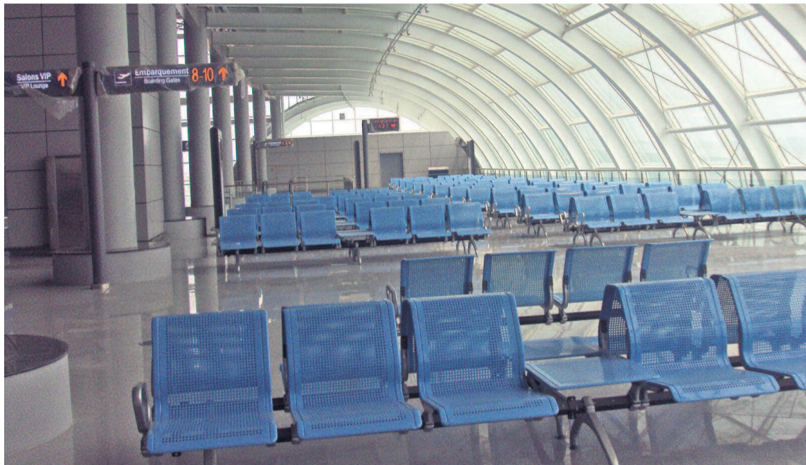
L'inauguration prévue le 11 août

Le ministre de l'Aménagement du territoire et de la Délégation