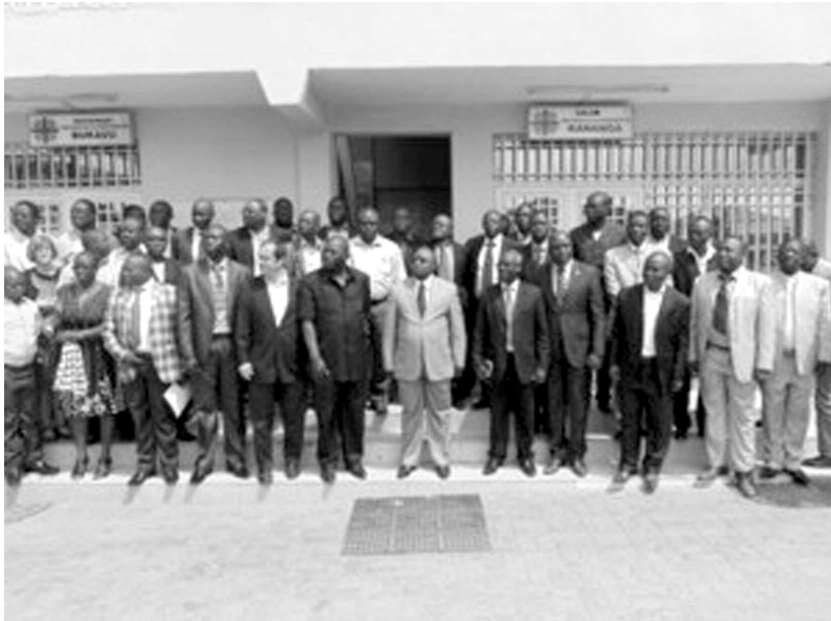
La photo de famille de participants à la réunion d'évaluation des JNV à Caritas

Durant quatre jours, les médecins inspecteurs provinciaux, les médecins chefs de zones, les médecins coordonateurs provinciaux, le conseil national des ONG de la santé, les agences onusiennes et les ONG internationales agissant dans le secteur de la santé vont devoir réfléchir