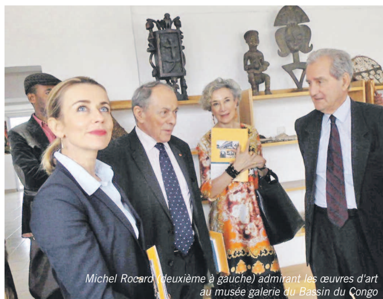
Michel Rocard (deuxième à gauche) admirant les œuvres d'art au musée galerie du Bassin du Congo