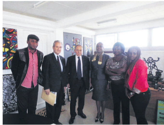
Le personnel du musée galerie du Bassin du Congo avec Michel Rocard et la délégation l'accompagnant

Invité à signer le livre d'or de la Galerie du Congo, l'ancien Premier ministre y a écrit ces quelques mots : « J'ai beaucoup admiré cette extraordinaire collection. Bravo, bonne chance pour l'enfantement du musée qu'elle mérite. » L'ancien Premier ministre socialiste était accompagné de la directrice