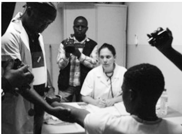
Les médecins recevant un patient qui n'a généralement pas accès aux soins de santé payants