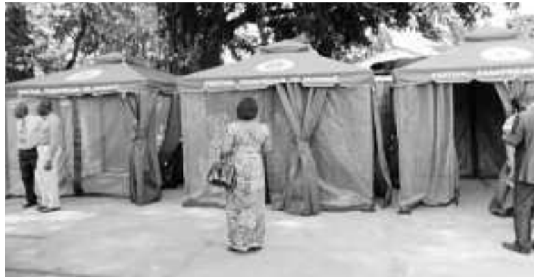
Les stands nouvellement réceptionnés

Le ministre de la Culture et des arts, Jean-Claude Gakosso, a réceptionné, le 23 juillet, quarante stands qui serviront à l'installation du Marché africain de la musique (Musaf), dont le site, cette année, était la cour de l'École de peinture de Poto-Poto.