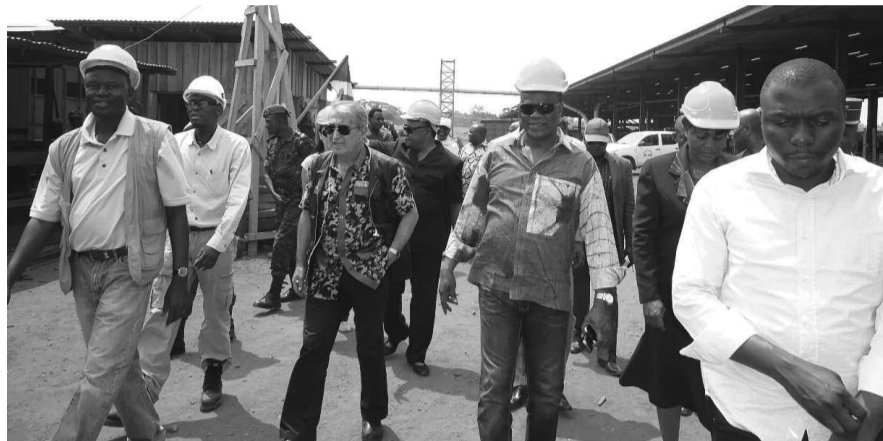
Le ministre Henri Djombo (au centre) visitant les installations de CIB-Olam.

trouve au niveau du logiciel de traçabilité des bois entre le Congo et l'Union européenne. »