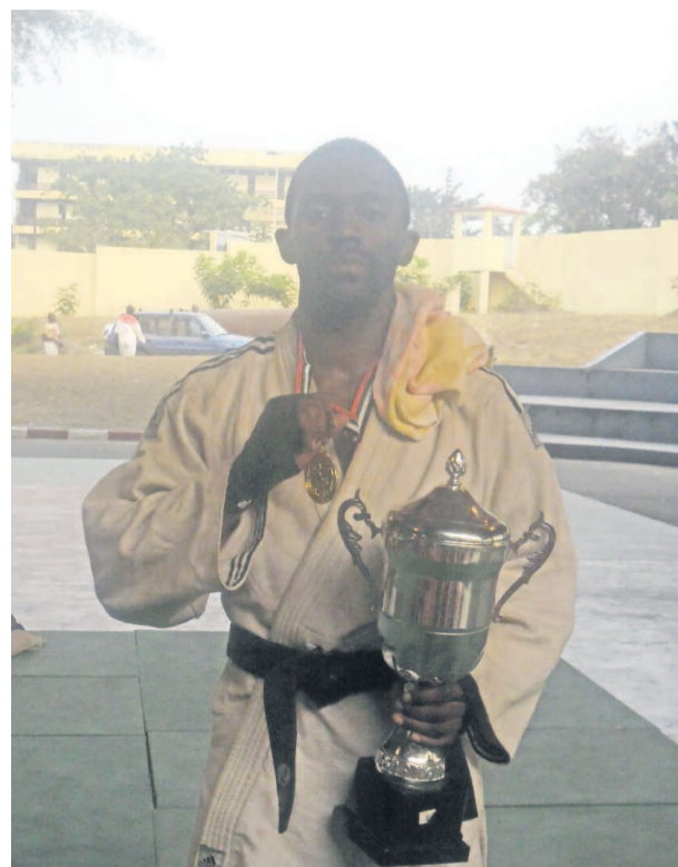
Fred Mvouta superchampion de ju-jitsu du Congo.