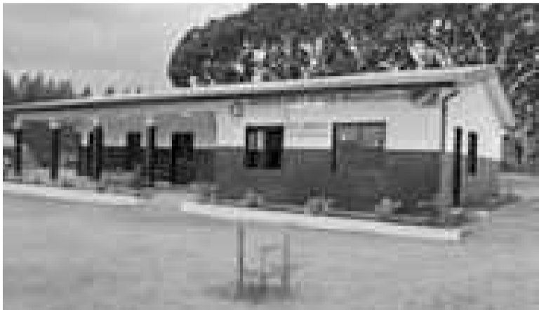
Le CSI Malassi-Laurent du village Tchissoko (Kouilou)

tés : l'implication directe de la population locale dans le processus de gestion du projet et la conduite des travaux, et le financement dudit projet à partir de l'argent généré par les résidus de bois qu'EFC a mis à la disposition de la population locale après prélèvement des rondis d'eucalyptus pour les transformer en charbon de bois, perches et fagots de bois. « Ce sont ces fonds restitués par EFC aux populations locales qui ont permis de financer ce centre