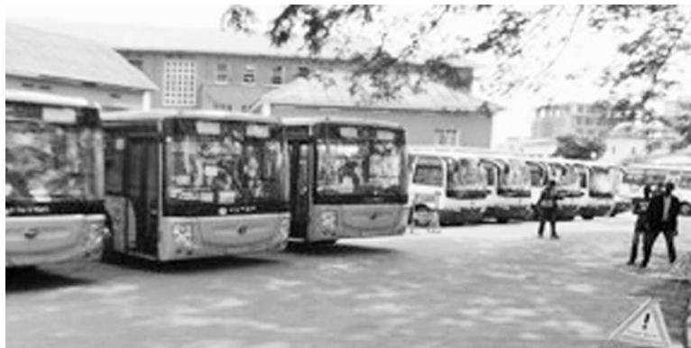
Des bus acquis par le gouvernement provincial de Kinshasa

Les bus et minibus lancés sur les artères kinoises, note-t-on, consti-