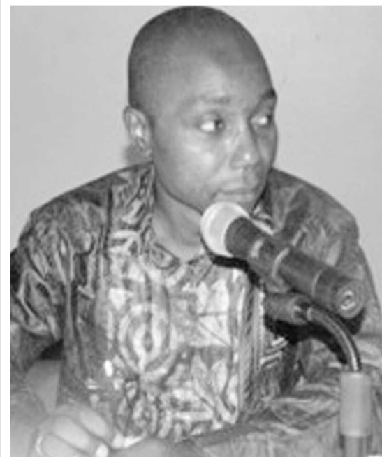
Le Dr Faustin Chenge

Ouverte le 5 août dans la salle de réunion du Programme national de lutte contre le sida par le directeur adjoint du cabinet du ministre de la Santé publique, le Dr Faustin Chenge, la rencontre, organisée par le Programme national de promotion des mutuelles de santé (PNPMS), a pour objectif de doter le pays d'un document de politique nationale sur la couverture universelle aux soins de santé et les outils de gestion indispensables.