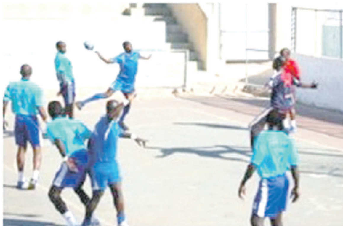
Vue d'un match de handball masculin

La 30 e Coupe du Congo de handball a démarré le 3 août au terrain de handball du stade des Martyrs de Kinshasa. En match d'ouverture en version masculine, l'équipe de Ruwe de Kinshasa a écrasé Panique de Kananga (Kasaï occidental) par cinquante buts à onze. Et Scorpion de Kinshasa a nettement battu Hironnelle, un autre club de la capitale, par quarante-deux buts à vingt-sept. En version féminine, Mikishi de Lubumbashi (Katanga) a été sans pitié face à la formation de Lion de la Tribu de Juda d'Idiofa (Bandundu) par cinquante buts à six. La deuxième journée du 4 août, Nuru de Lubumbashi (Ka-