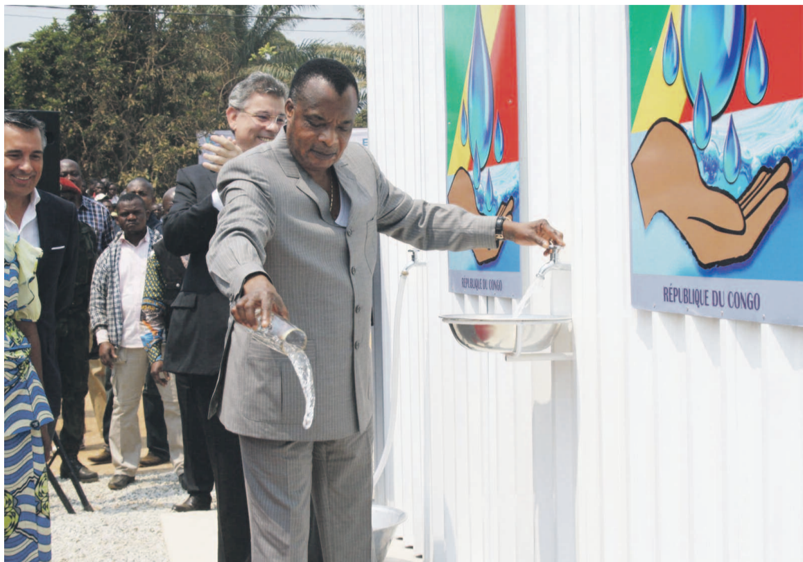
Le chef de l'État lançant le projet Eau Pour Tous devant un forage d'expérimentation.

Le projet prévoit la construction d'un forage pour les villages de moins de 300 habitants, un à deux forages pour les villages de 300 à 1 000 habitants, deux à trois forages pour les villages de 1 000 à 3