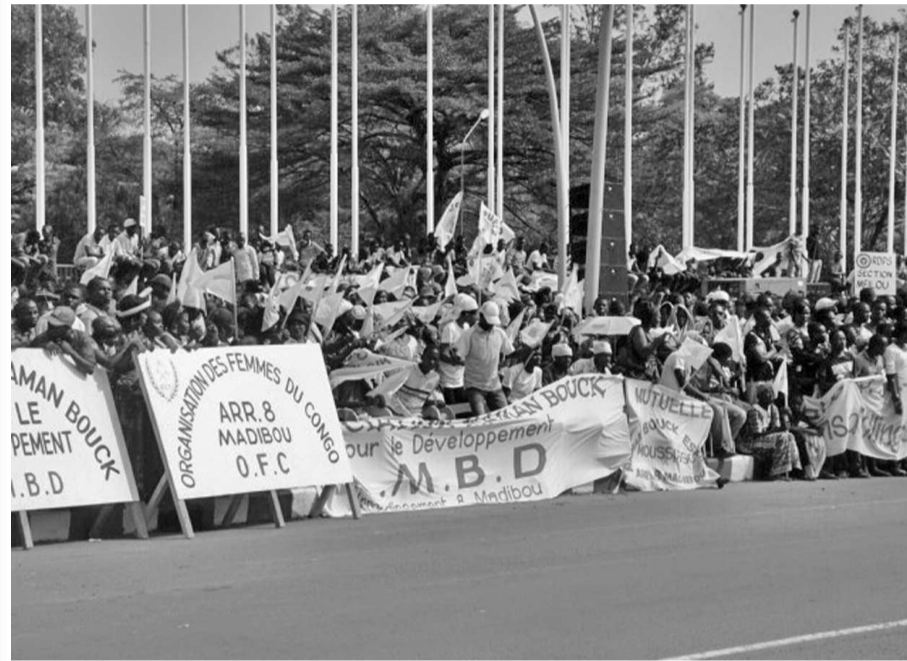
La foule lors du meeting

leurs de l'action du président et leurs complices contre les conséquences néfastes de leurs manœuvres sur les liens séculaires de fraternité et de coopération qui existent entre les peuples congolais et français. Nous dénonçons l'ingérence manifeste d'une certaine justice française aux méthodes néocolonialistes dans les affaires intérieures du Congo. Nous dénonçons également l'entreprise pernicieuse et répétée de certains médias