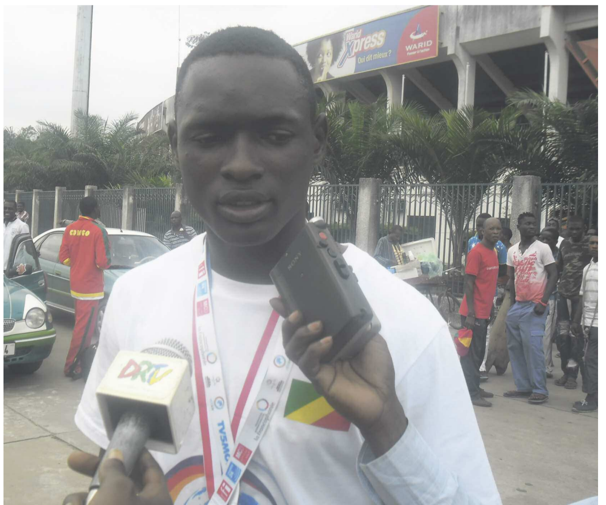
Obassi Meilleur buteur de la compétition