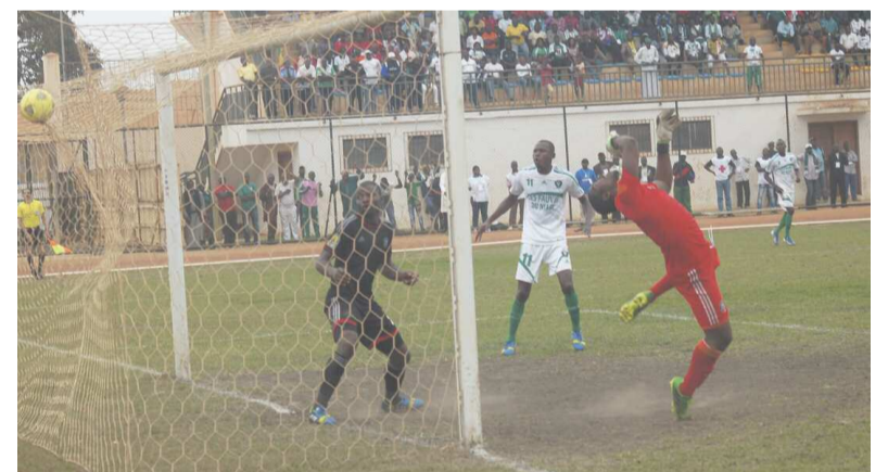
Le but qui a réhabilité les chances de qualification des Léopards

En battant le 14 septembre sur sa pelouse l'une des meilleures équipes du groupe, Orlando Pirates, sur un score étrié d'un but à zéro, l'AC Léopards de Dolisie a lui aussi montré qu'on l'avait enterré un peu vite. Après deux défaites consécutives subies face aux tenants du titre, les Fauves du Niari ont su rebondir en