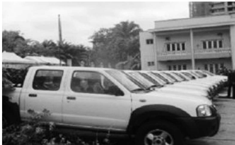
Une vue des véhicules réceptionnés

Présidant cette cérémonie le week-end dernier, le Premier ministre, Augustin Matata Ponyo, a déclaré avoir