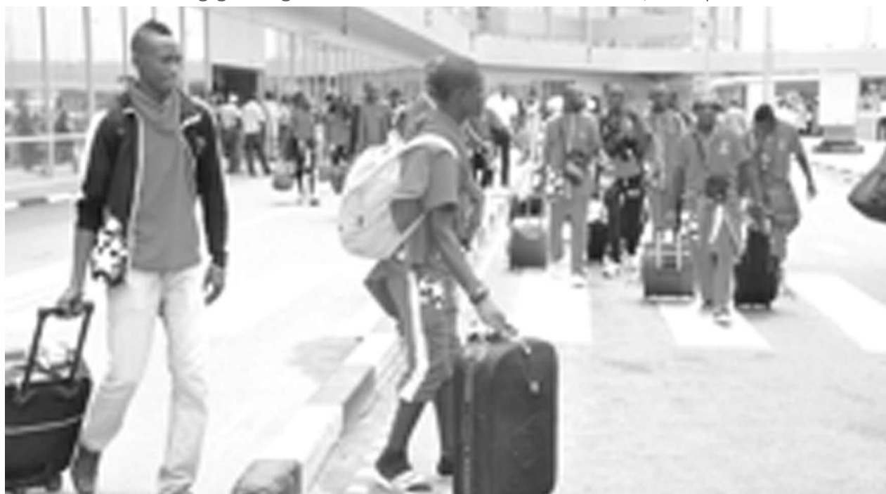
Arrivée à Lagos de l'équipe Airtel Jeunes Talents Congo Brazzaville

«A travers ce tournoi, Airtel permet à de nombreux