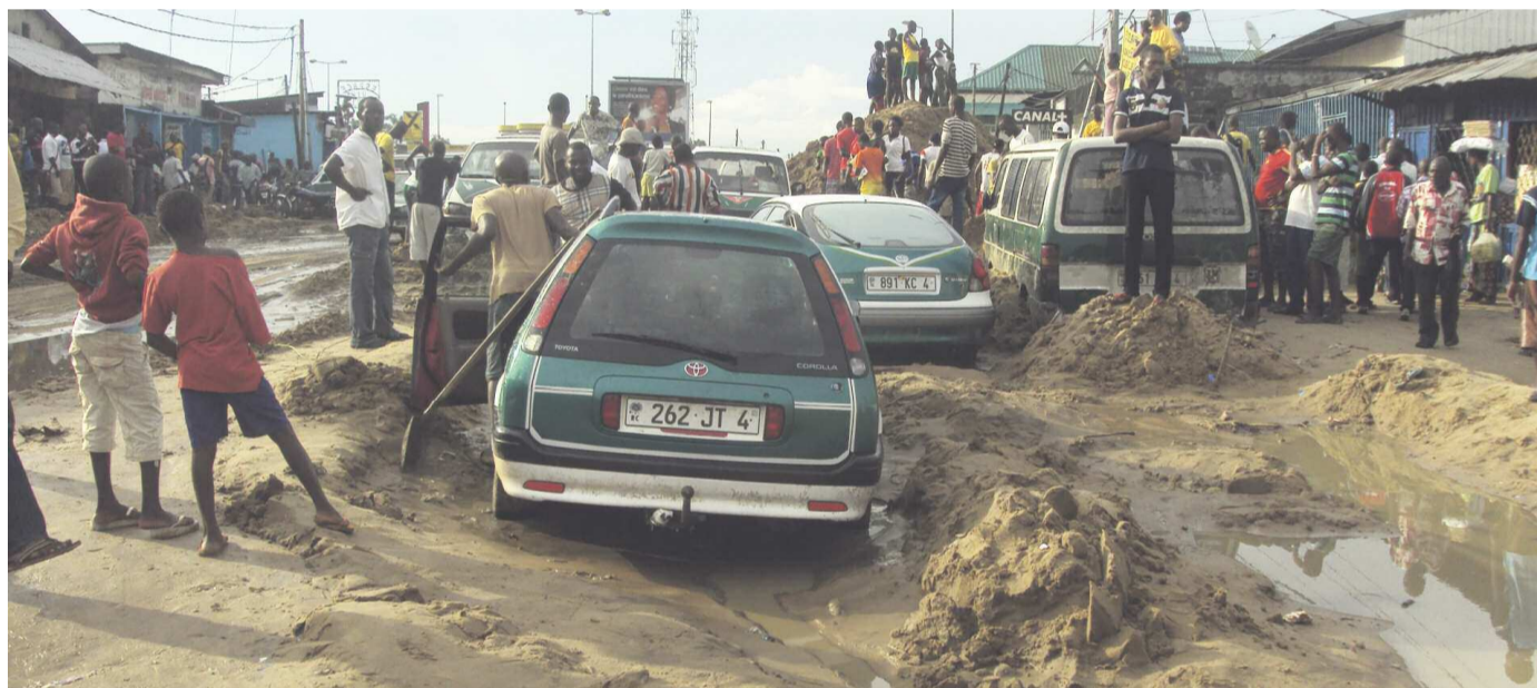
Une chaussée envahie de sable au pont de Mikalou, un quartier précaire de Brazzaville

Le directeur des opérations de la Banque mondiale pour les deux Congo a annoncé, le 17 septembre à Brazzaville, l'appui de son institution à un programme d'aménagement des rivières, des voiries urbaines et des centres de santé de Brazzaville et Pointe-Noire.