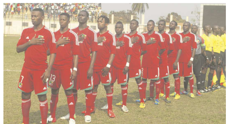
Les Diables rouges logés dans le même groupe avec le Ghana, la Libye et l'Éthiopie.

Le tirage au sort de la phase finale du Championnat d'Afrique des Nations Afrique du sud 2014 a été effectué hier au Caire en Égypte. À l'issue de ce tirage, les Diables rouges locaux sont logés dans la poule C et joueront leurs matchs du premier tour contre les sélections ghanéenne, libyenne et éthiopienne. Les Léopards de la RD Congo qui figurent parmi les favoris de la compétition se retrouvent quant à eux dans la poule D, avec le Gabon, le Burundi et la Mauritanie.