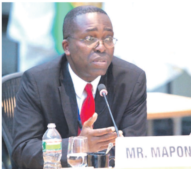
Le Premier ministre Matata Ponyo