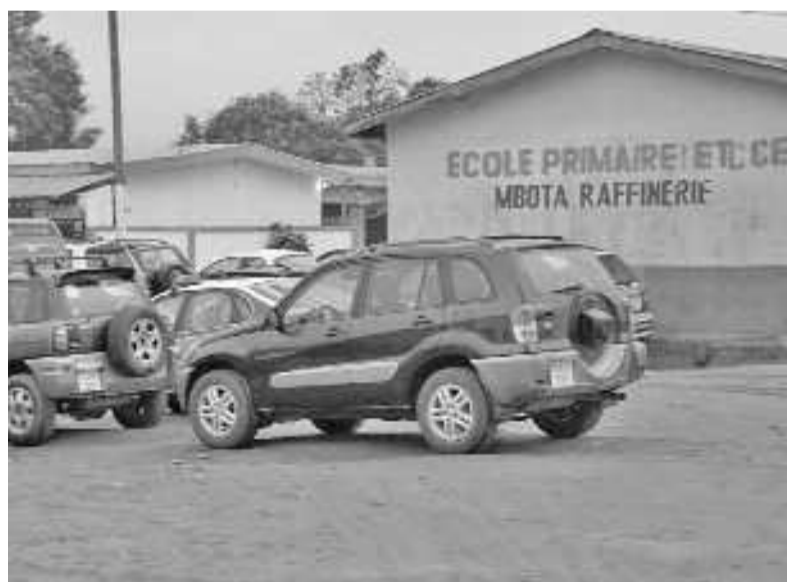
L'école primaire et le collège de Mbota-Raffinerie à Mongo-Mpoukou