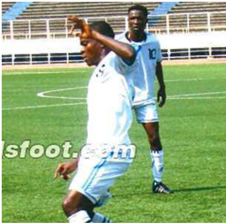
Un joueur de Shark XI FC au cours d'un match au stade des Martyrs

Premier qualifié pour le tour final du championnat national de football, le club champion de l'Entente provinciale de football de Kinshasa (Epfkin) et vainqueur de la coupe superchampion de Kinshasa évoluera dans le groupe B en compagnie de l'AS V.Club, du Daring Club Motema Pembe, du SC Rojolu, de Sanga Balende de Mbuji-Mayi, de Muungano du Sud-Kivu, de Tshinkunku du Ka-