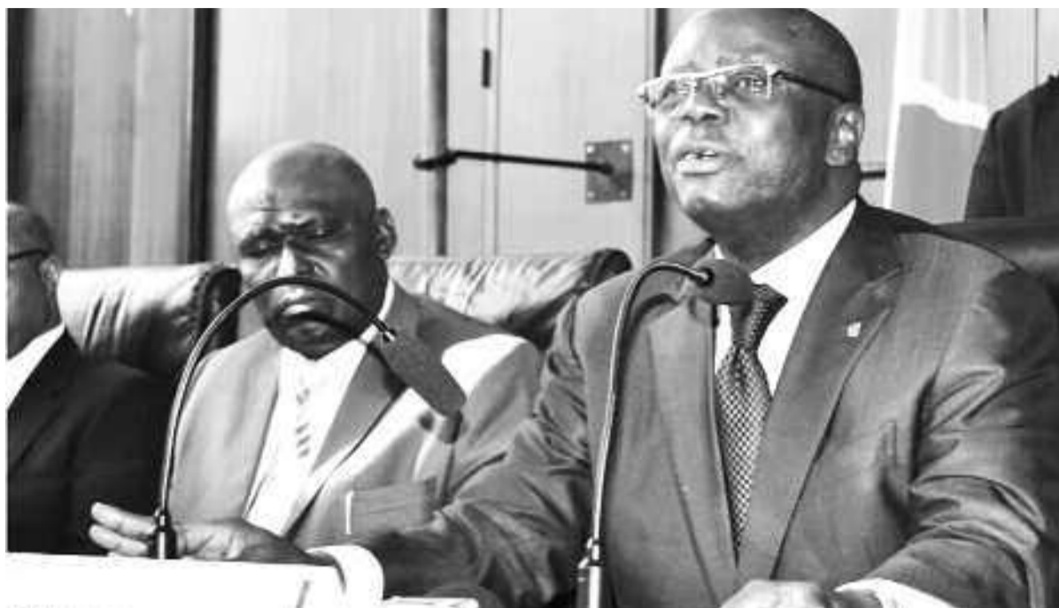
Le gouverneur André Kimbuta, en avant plan, et le vice-gouverneur Clément Bafiba

Cette rencontre de rabat a tourné autour de la décentralisation et a permis la prise des résolutions qui seront appliquées par les différents membres. Ces assises ont été mises à profit par le gouver-