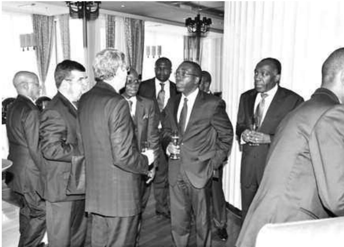
Matata Ponyo en discussion avec le secteur privé de la RDC (archives)

Durant quatre jours, soit du 8 au 11 octobre, les officiels congolais auront à convaincre les investisseurs américains, pour la plupart spécialisés dans les secteurs de l'agro-industrie et du transport ferroviaire, des opportunités de réaliser des investissements en RDC. Chicago est une ville américaine stratégique pour le pays engagé sur la voie de la reconstruction de ses infrastructures. En effet, elle abrite les sièges des grandes sociétés, dont Caterpillar et Boeing. L'on a cité aussi la société John Deere qui a livré les tracteurs agricoles attribués à plusieurs organisations dans le cadre de la mécanisation de l'agriculture.