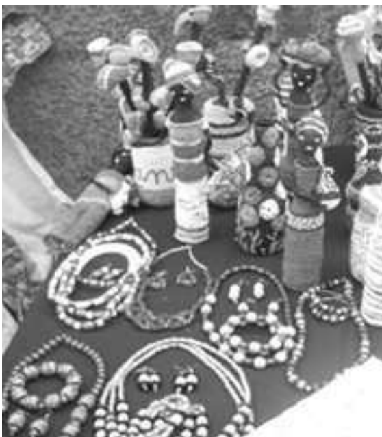
Les créations de Leslie.

Au nombre des projets que caresse la jeune créatrice, on peut citer la construction d'un centre de formation. Ne disposant pas d'un atelier adapté, elle ne peut pas encadrer un nombre important de filles. Un