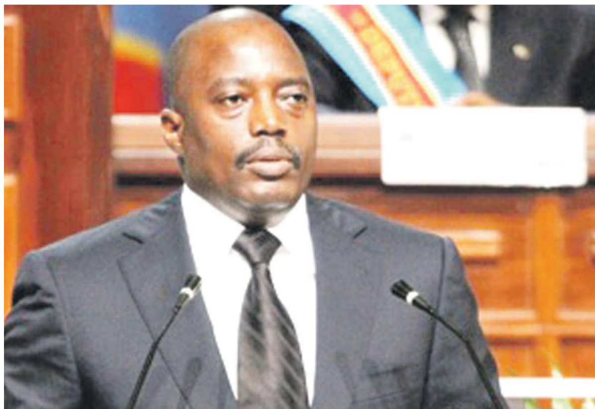
Le président Joseph Kabila

C'est ce jeudi 10 octobre que la page des concertations nationales, dont les travaux ont pris fin le 5 octobre après la réception par le chef de l'État des recommandations issues des états généraux, sera définitivement tournée. Eu égard à la pertinence des résolutions prises dans le cadre de ces travaux lesquelles vont toutes dans le sens de booster la dynamique de paix et du développement en RDC, l'on ose croire que Joseph Kabila ne pourrait que les entériner.