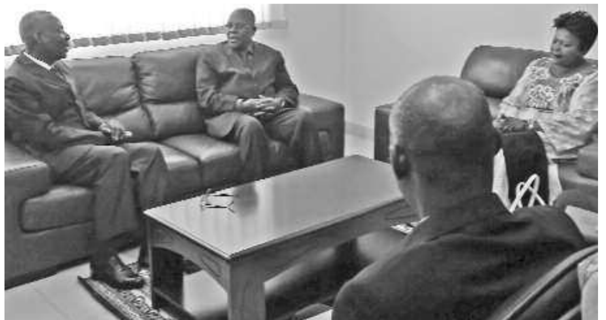
Florent Ntsiba s'entretenant avec Bounandélé Koumba

Le ministre du Travail et de la Sécurité sociale, Florent Ntsiba, a échangé le 17 octobre à Brazzaville, avec son homologue de la République centrafricaine, Bounandélé Koumba, sur les questions touchant le monde du travail et la sécurité sociale.