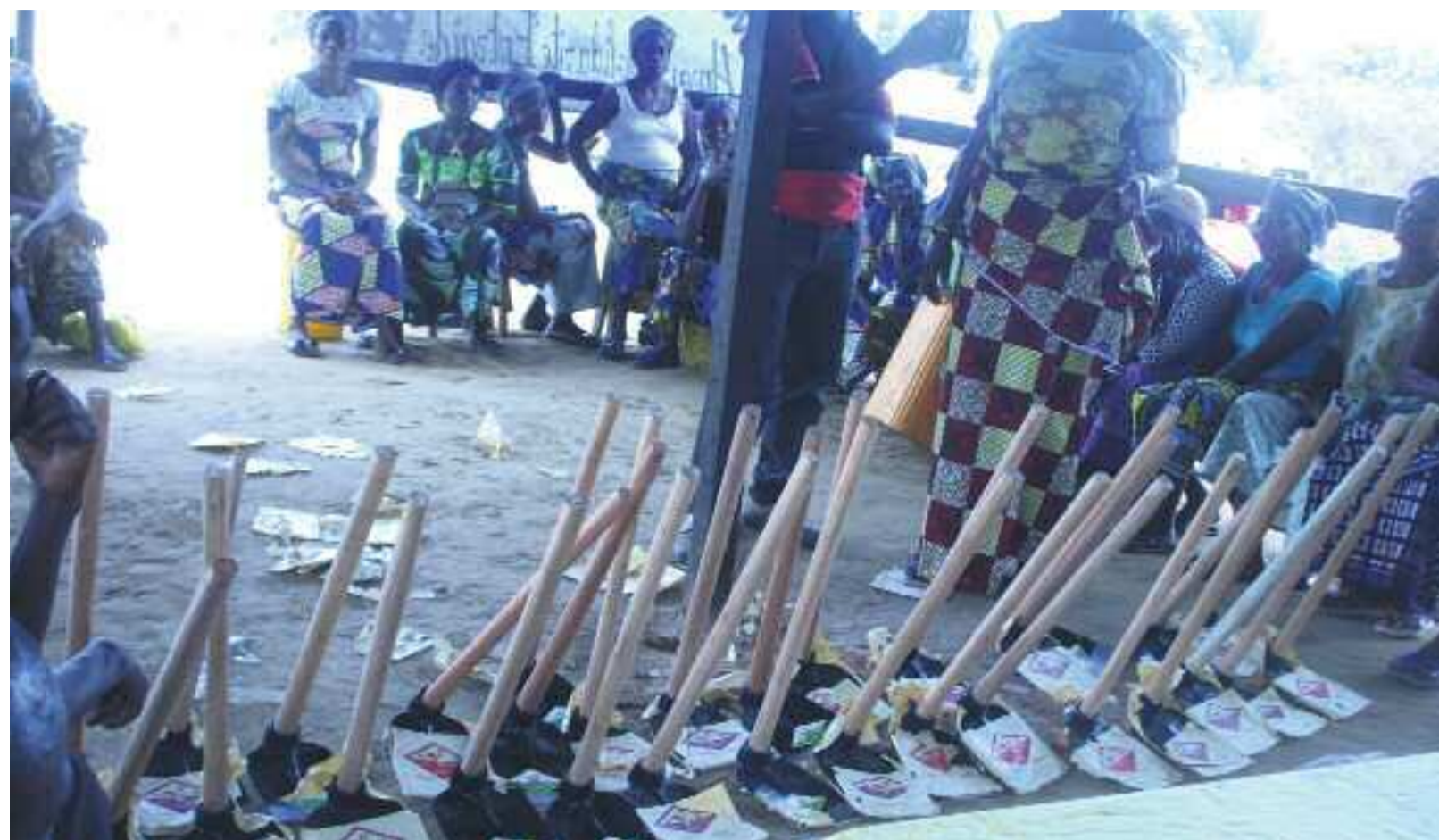
Le don de la directrice à l'association de Louvenza. "adiac

D'après la directrice départementale, « Le choix du village dépend non seulement des moyens dont dispose notre direction et de la rotation que nous faisons chaque an-