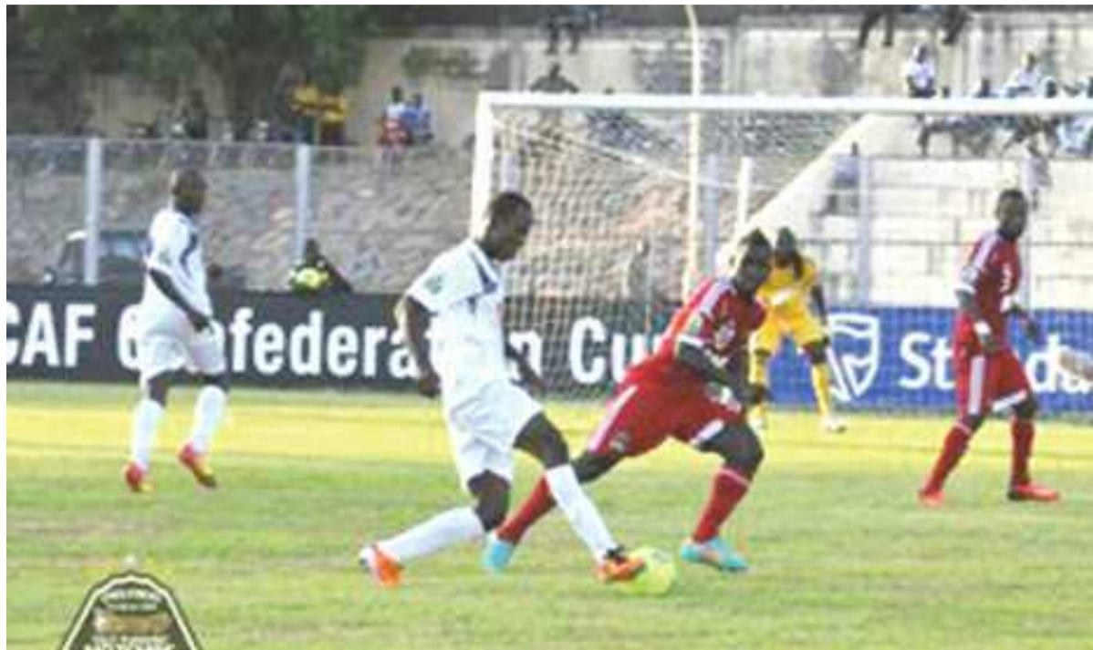
Vue du match aller Stade Malien contre Mazembe à Bamako