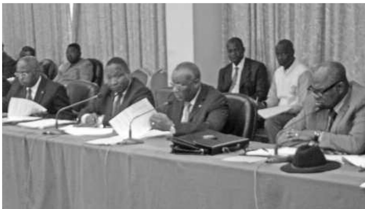
Les parlementaires