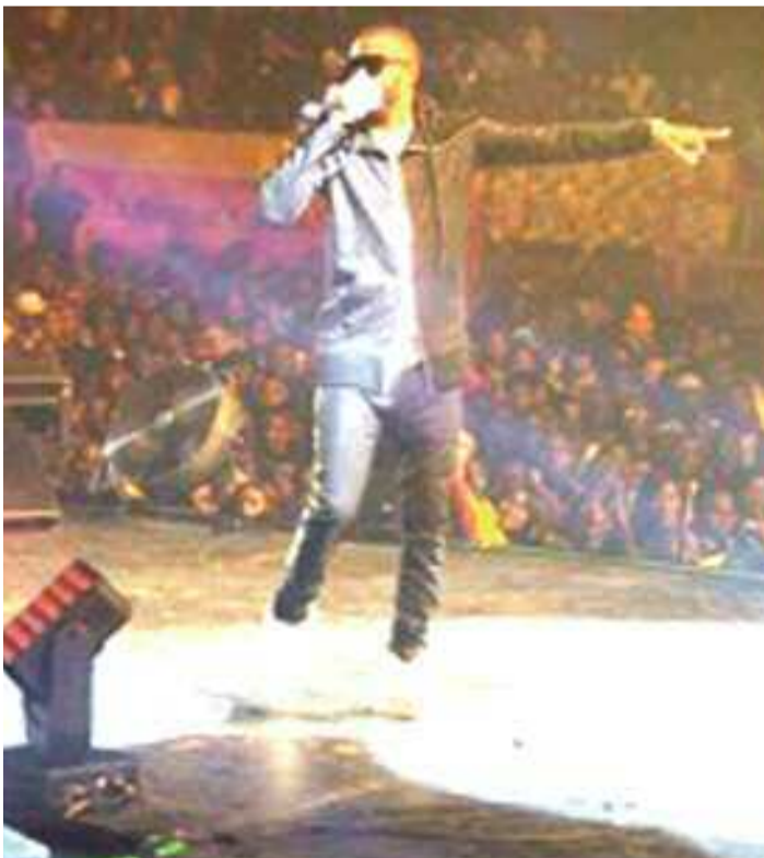
Fally Ipupa sur le podium de Bercy lors du concert de Youssou Ndour

Notons Fally Ipupa s'est récemment produit au Palais omnisport de Bercy sur invitation de l'artiste sénégalais Youssou Ndour qui faisait son grand retour sur la scène. Les deux artistes avaient organisé des séances de répétition à Paris en prélude à ce grand spectacle. L'album Power a été mis sur le marché depuis le 5 avril dernier. Des chansons comme