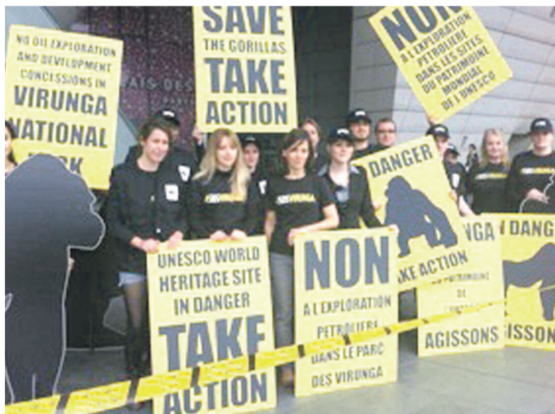
Une action menée contre l'exploration pétrolière dans les Virunga/ que nous nous opposons à une telle activité », a-t-il expliqué.