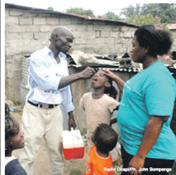
Les vaccinateurs administrant deux gouttes de vaccin polio oral aux enfants

Comme le pays vient de réitérer cet exploit, il est donc capital de renforcer la surveillance pour éradiquer totalement cette maladie invalidante de l'enfance du territoire national. Et le seul moyen pour éliminer cette maladie demeure la vaccination