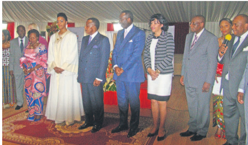
La photo de famille après l'ordination