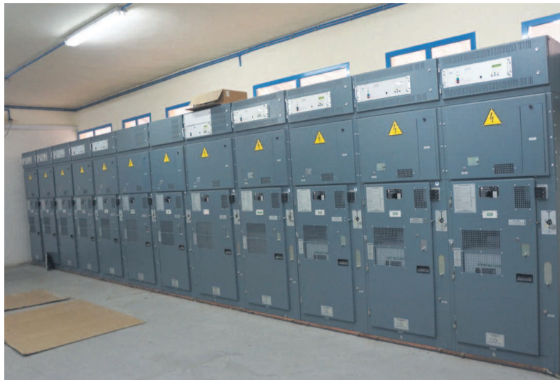
Vue intérieure du transformateur électrique de Songolo

« Comme vous pouvez le constater vous-mêmes, ce transformateur n'a jamais pris feu comme cela est spéculé par certains internautes à travers des réseaux internet », a indiqué l'un des responsables de la délégation qui accompagnait le directeur départemental.