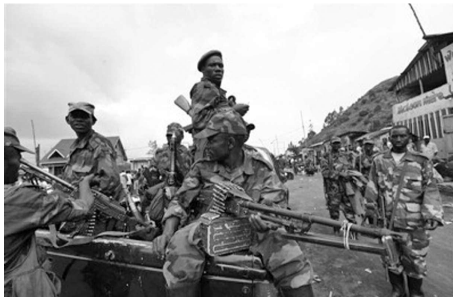
Les rebelles du M23

À l'étape de Kibumba reprise depuis le samedi, les Fardc, qui étaient en plein ratissage des positions du M23 au niveau des grottes situées dans les environs de la zone appelée « Trois Antennes », ont découvert deux fosses communes dans cette localité du Nord-