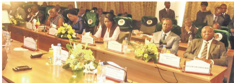
Les participants à la grande commission mixte

Les ministres des Affaires étrangères du Congo, Basile Ikouébé et du Rwanda, Louise Mushikiwabo ont paraphé dix accords de coopération au terme de la 3ème grande commission mixte des deux pays qui s'est tenue du 7 au 9 novembre à Brazzaville.