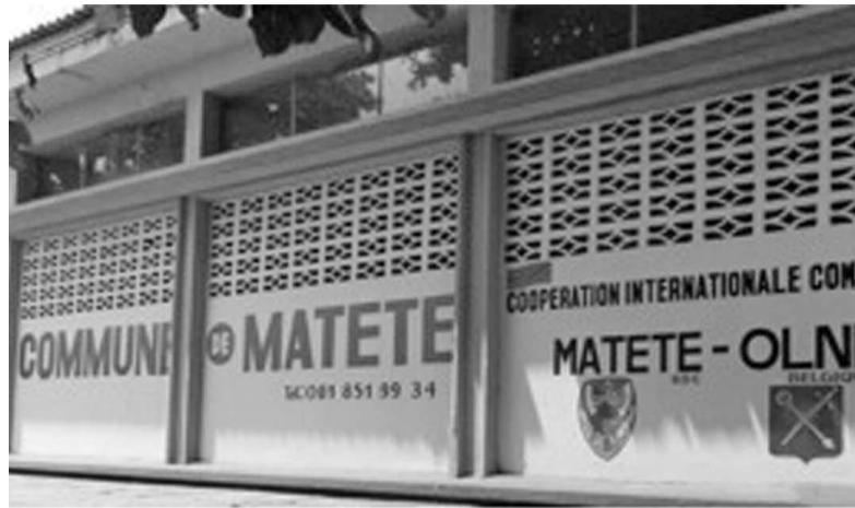
La maison communale de Matete décorée aux couleurs du partenariat avec Olne

Les deux responsables communaux ont étalé devant la communauté mate-toise le programme de partenariat pour les deux prochaines années. Le premier volet de ce plan vise la construction des bureaux de treize quartiers de Matete ainsi que la modernisation de l'administration et le renforcement des capacités de ses animateurs. Alors que le second volet concerne la réhabilitation de l'électricité de la maison communale. Cette dernière sera, en effet, pourvue des panneaux solaires et de convertisseur pour suppléer aux problèmes de son alimentation en énergie électrique. D'autres aspects de ce programme seront développés, ont-ils fait savoir, selon les besoins et les disponibilités. Mais le bourgmestre d'Olne a