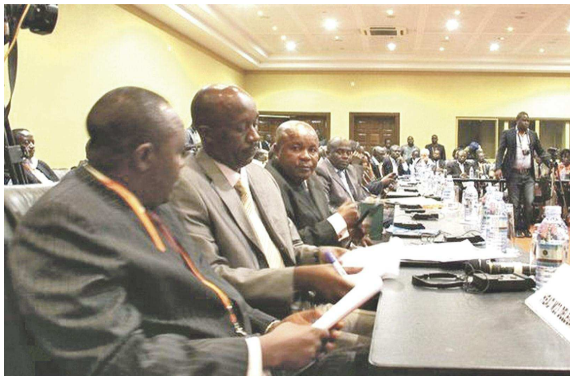
La délégation du M23 aux pourparlers de Kampala

Le gouvernement ougandais a annoncé vendredi dernier que l'accord de paix entre le gouvernement et le M23 serait signé ce 11 novembre à Kampala. Les deux parties ont, en effet, harmonisé leurs vues sur onze clauses du projet d'Accord leur soumis par la facilitation ougandaise. Dans l'une des clauses, le M23 prend l'engagement formel de renoncer définitivement à la lutte armée, même si cela avait déjà été entériné dans le communiqué publié le 5 novembre par son président. Le gouvernement, pour sa part, ne ménagera aucun effort pour « faciliter et rendre irréversible la matérialisation » dudit accord.