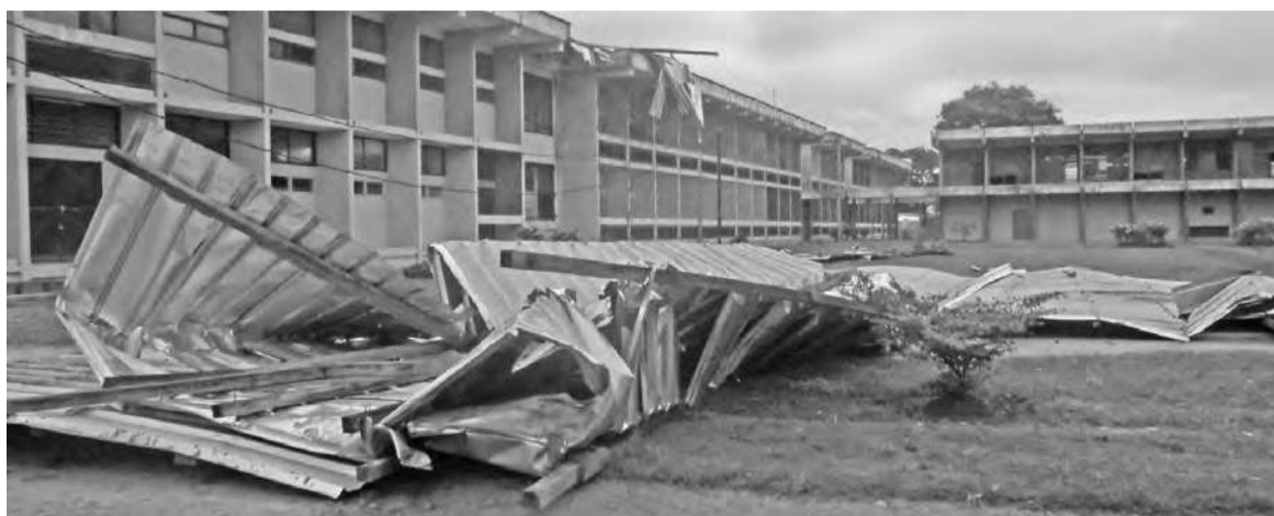
La toiture de l'ENS au sol