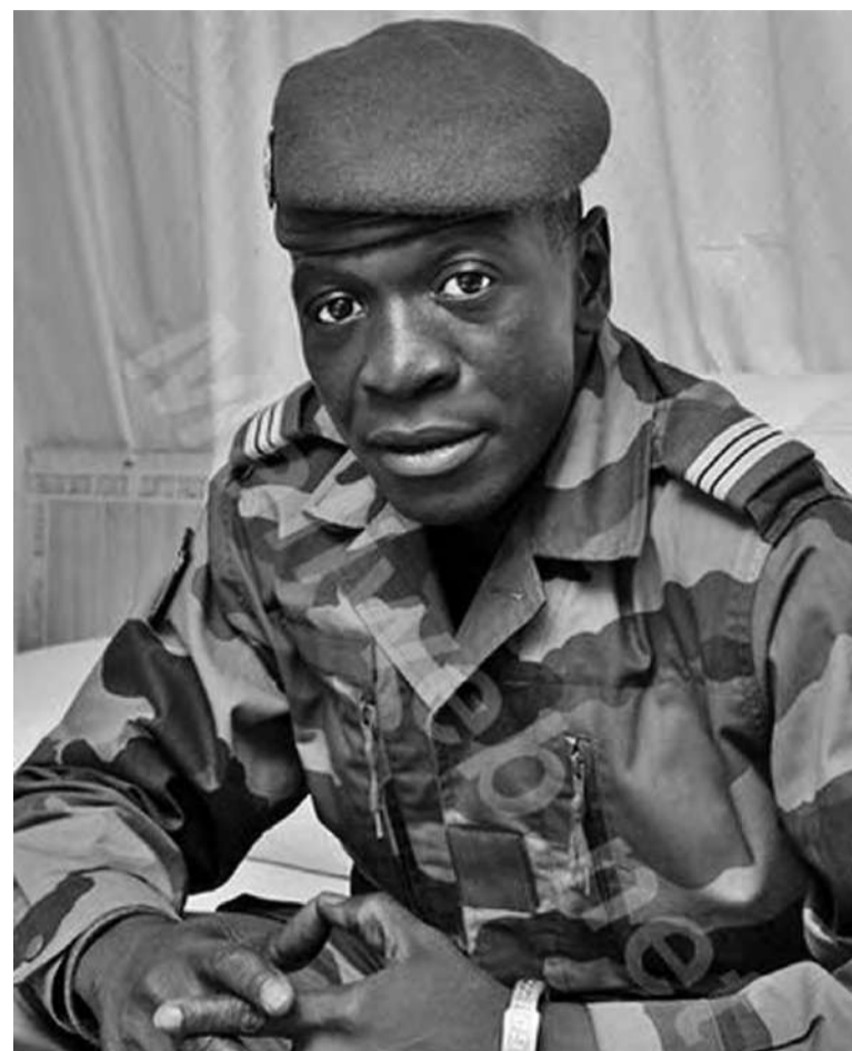
Le général Amadou Sanogo

Des analystes estiment qu'à la suite de l'audition d'Amadou Sanogo, son éventuelle inculpation dans cette affaire n'est plus à exclure compte tenu des crimes (assassinats, exécutions sommaires, tortures) et autres faits graves dont il est présumé être l'auteur. Certains Maliens parlent même de l'existence de fosses communes voire de charniers qui