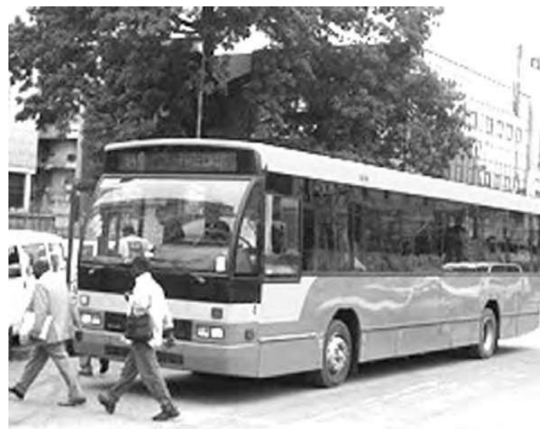
Un bus de l'ex société Stuc en stationnement

charroi par l'acquisition de nouveaux bus est patente. C'est dans ce cadre qu'il faut situer la réception, le 9 novembre dernier, d'un nouveau lot de trente bus par les autorités de la société de transport public Transco. S'il y a des communes qui se réjouissent déjà abondamment du bienfait des bus de la Transco, il y en a d'autres qui se demandent de plus en plus si ces bus arriveront quand même un jour chez elles. Les habitants de la périphérie ouest de Kinshasa, précisément ceux habitant les quartiers Matadi Kibala, Mitendi et Benseke, se plaignent et se considèrent toujours comme les éternels