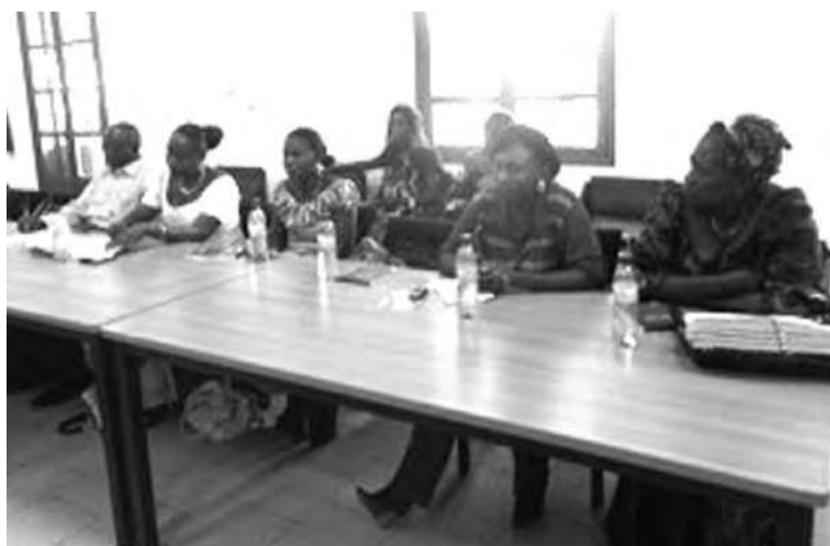
Vue de quelques participants à l'atelier

En effet, les acteurs de la commune de Kisenso ont aussi émis leur souhait sur ce que devrait être la ville de Kinshasa pour qu'elle soit appelée "ville sûre".