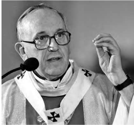
Le pape François