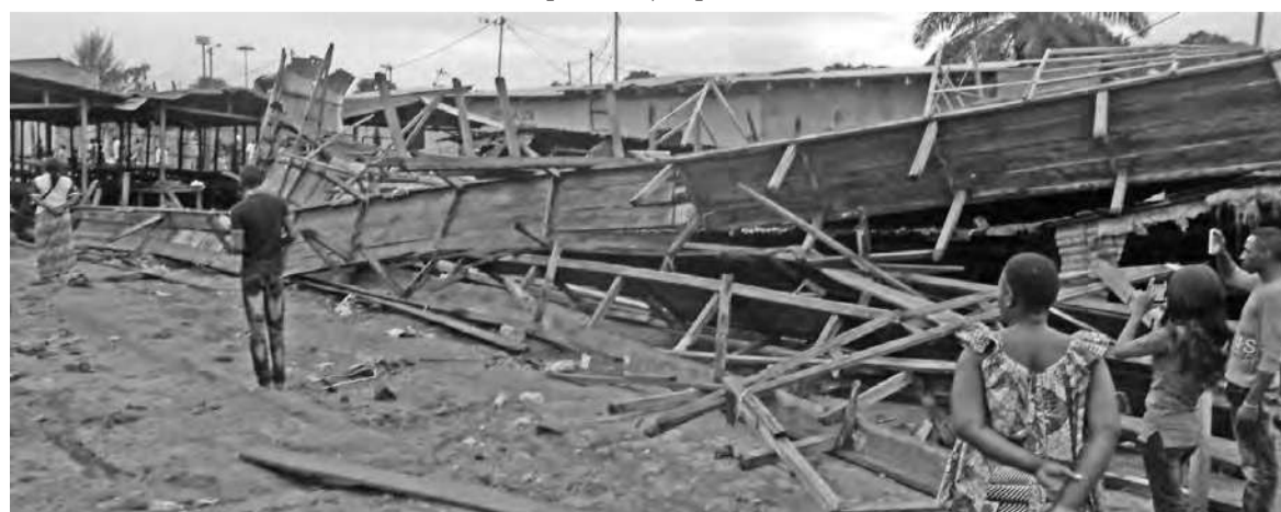
Les étalages sous lesquels la vendeuse est morte

samba-Débat, de Diata dans le premier arrondissement n'a pas été épargnée. Ici, deux bâtiments ont perdu leurs toits, emportés par le vent. Il s'agit des bâtiments de quatre salles de classe chacun. Une situation qui va impacter sur le bon déroulement des cours.