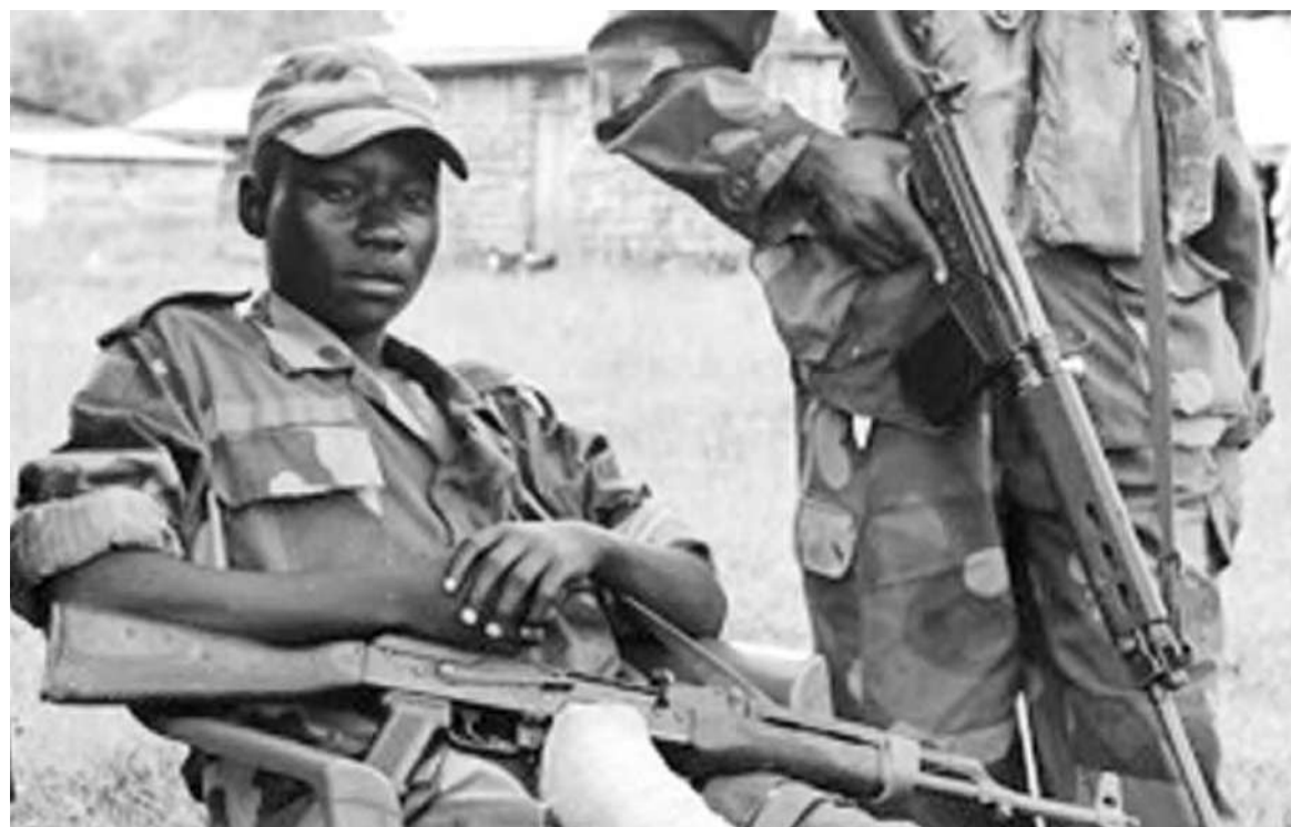
Un enfant soldat en RDC

Pour l'Unicef, tout le monde a la responsabilité de « rendre visible l'invisible », que ce soit les gouvernements, qui doivent promulguer et faire respecter des lois interdisant la violence à l'égard des enfants ou les simples citoyens qui refusent de garder le silence lorsqu'ils sont témoins de maltraitance ou la soupçonnent. De l'avis de cette agence onusienne, la violence à l'égard des enfants prend bien des formes, y compris la violence familiale, les abus sexuels ou