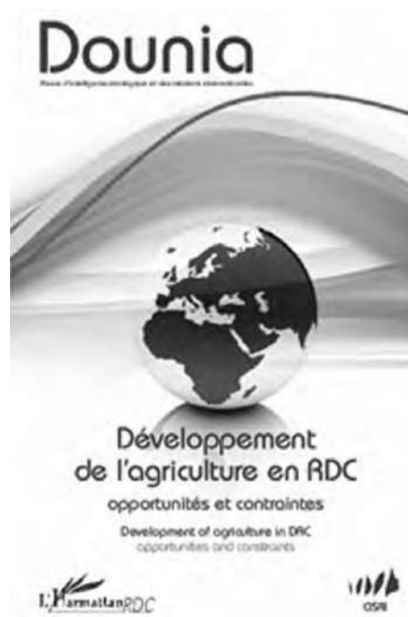
La couverture de Développement de l'agriculture en RDC opportunités et contraintes

Les auteurs qui livrent ici un point de vue fort réaliste de la situation, abordent les différentes contraintes et opportunités relatives à la productivité, à la réduction de la pauvreté et à la nutrition. Ce, en tenant compte