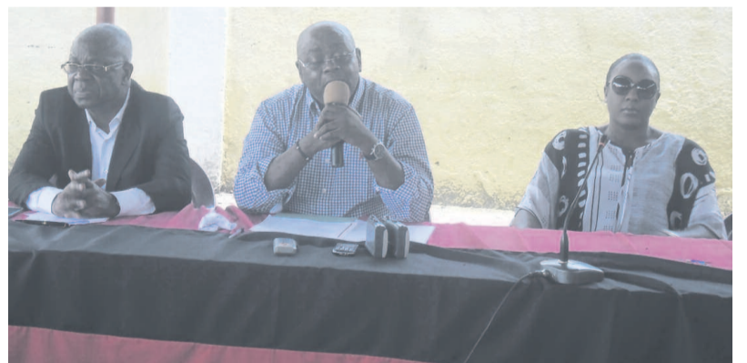
Le président de Cara entouré des membres de conseil d'administration

avoir réalisé un tel succès en Coupe d'Afrique des champions ou Ligue africaine des champions dans sa nouvelle version. En 1975, l'équipe s'est arrêtée en quarts-de-finale. Les Rouge-et-Noir étaient sortis de la compétition en huitièmes-de-finale, en 1976, 1983 et 1985. C'est en Coupe des vainqueurs de coupe que le club a été moins performant puisqu'en 1982, le représentant congolais s'est arrêté au premier tour. Même résultat en 1993. Récemment en 2009, Cara était éliminé au