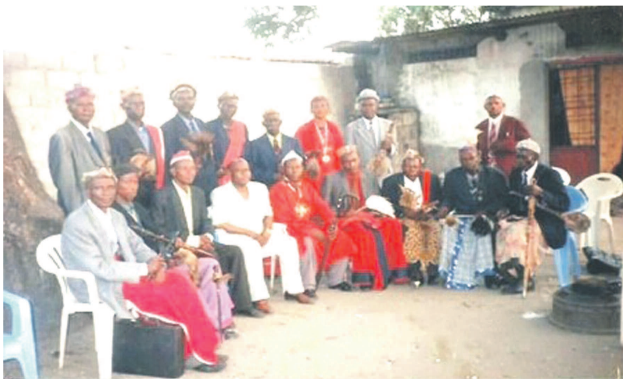
*Les Chefs coutumiers membres du RENADECO

Les filles et fils de la République démocratique du Congo viennent de traverser une période de forte turbulence. À la querelle de légitimité des institutions s'est ajoutée la guerre qui a sévi à l'Est du pays, particulièrement dans la province du Nord-Kivu. À l'occasion des concertations nationales organisées à Kinshasa du 07 septembre au 05 octobre 2013 à l'initiative du Président de la République Joseph Kabila, des voix avaient été préalablement entendues de toute part pour solliciter la médiation du président Denis Sassou N'Guesso, chef d'État de la République du Congo.