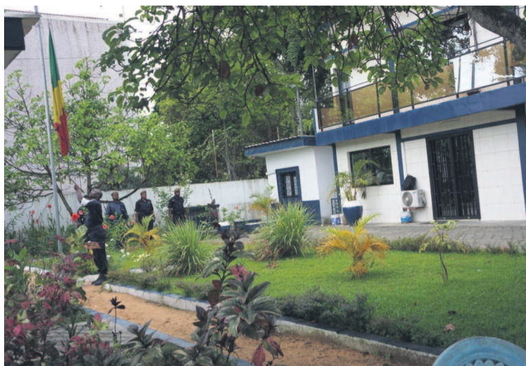
Cérémonie de levée du drapeau national à la direction départementale de la police de Pointe-Noire et du Kouilou

Ainsi, pour cette direction, les symboles de la République, comme le drapeau du pays, l'hymne national, la devise du pays, le sceau et autres armoiries, sont des signaux forts qui caractérisent la vie des institutions d'un État. En effet, manifestant l'intérêt de cette initiative pour la police, le colonel Gaëtan Victor Oborabassi, directeur départemental de la police au Kouilou et à Pointe-Noire, a expliqué que l'objectif de cette initiative était de transformer les comportements des policiers dans les deux départements. « Les couleurs nationales doivent être levées chaque lundi matin au siège départemental de la police. Cette cérémonie doit être suivie du récitation de l'hymne national, la Congolaise », a-t-il déclaré. Le déroulement de la cérémonie est rendu possible grâce à une