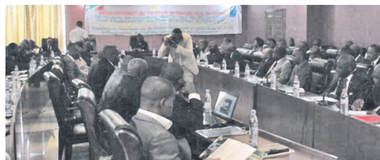
Les participants aux travaux de validation du plan de développement du Tourisme