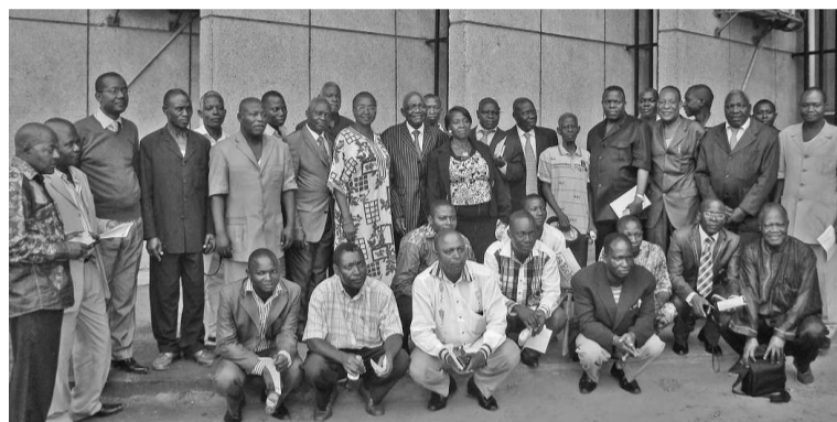
Photo de famille des membres du Cercle des sages de Yamba

sages de Yamba se veut un cadre de concertation, de dialogue et d'unité des filles et fils du district. Selon son président, cette association représente une nouvelle dynamique en vue de créer des synergies fonctionnelles visant à fortifier les paramètres du développement dans les domaines de l'éducation, de la santé, de l'eau et de l'assainissement, des routes, de l'agriculture, etc.