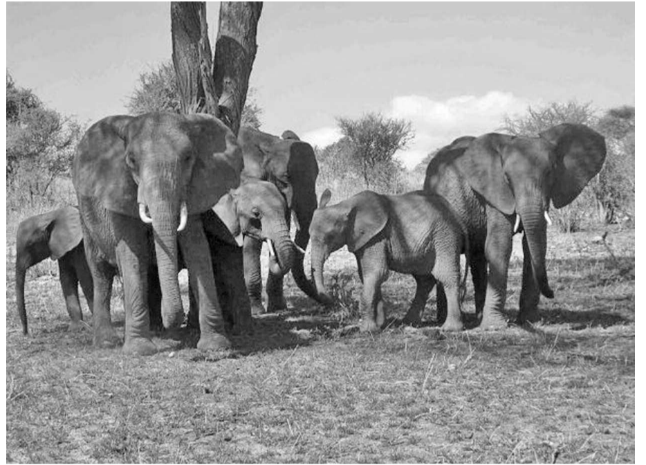
Un demi-million d'éléphants sont tués en Afrique