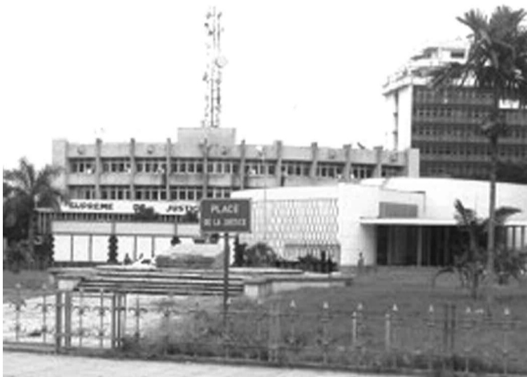
Le bâtiment de la CSJ

L'Acaj, qui a profondément déploré la violation de la disposition légale par la CSJ, a rappelé que le serment n'est pas une simple formalité mais un préliminaire indispensable de l'entrée en fonction des magistrats et la condition rigoureuse de la validité des actes et jugements auxquels ils concourent. « Avant de prêter le serment, les magistrats ne peuvent pas siéger valablement », a souligné cette ONG. Pour l'association, « c'est ainsi que dans le dossier PGR Tshimanga contre Talangai et consorts, la CSJ avait jugé que la prestation de serment confère au magistrat la qualité pour