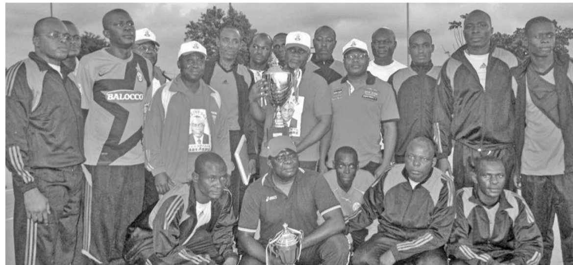
Kinda-Odzoho posant avec le vétéran de l'année 2013 "adiac"

L'équipe des vétérans de Brazzaville s'est adjugée son deuxième trophée consécutif du tournoi des vétérans le 1er décembre au stade Enrico Mattei de Pointe-Noire, en battant les vétérans Ebéba de la ville capitale, deux sets à un.