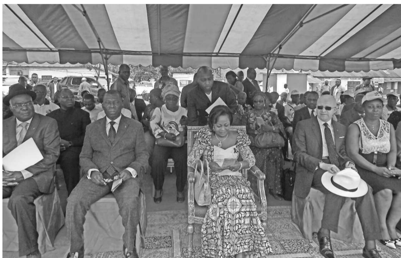
Antoinette Sassou N'Guesso entourée des ministres François Ibovi et Thierry Mougalla

« système sanitaire devra assurer à coup sûr la sécurisation totale de la chaîne de contrôle de production, d'approvisionnement, de distribution ainsi que la disponibilité géographique du médicament partout et son accessibilité géographique du médicament à peu de frais », a-