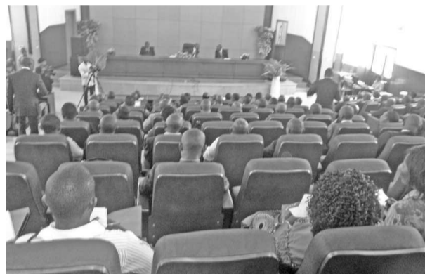
Les membres du comité lors de la session

Depuis le 4 août 2013, date du lancement officiel des opérations de collecte des données du RAS, sur toute l'étendue du territoire national, le Comité de suivi n'a pas encore