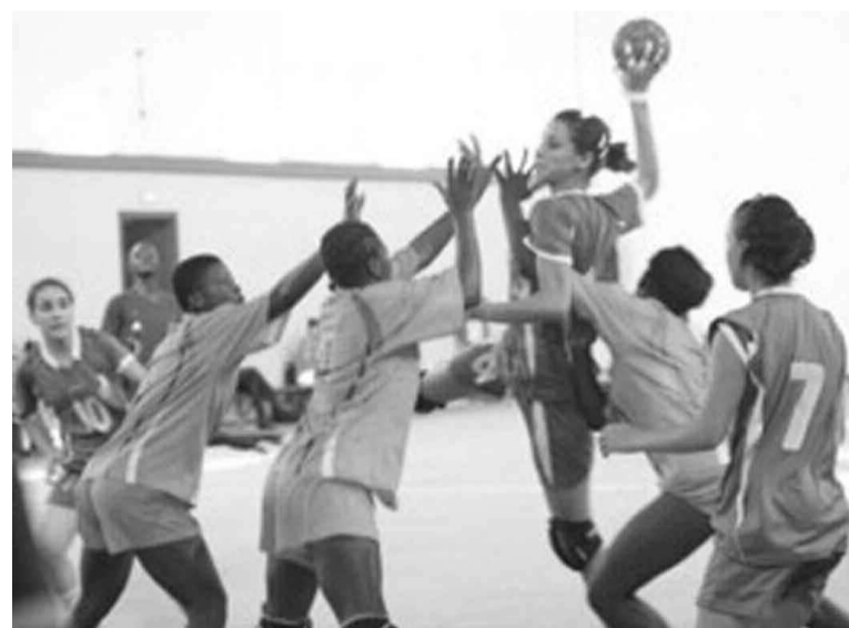
Vue d'un match de handball dame