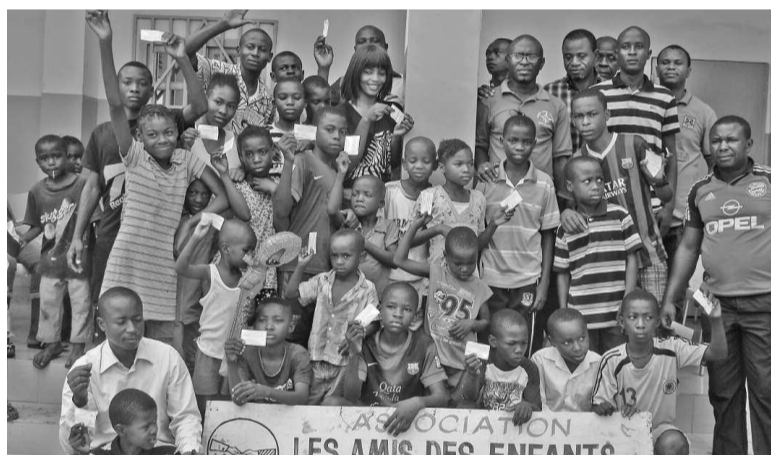
Les enfants du quartier 67 Talangai.