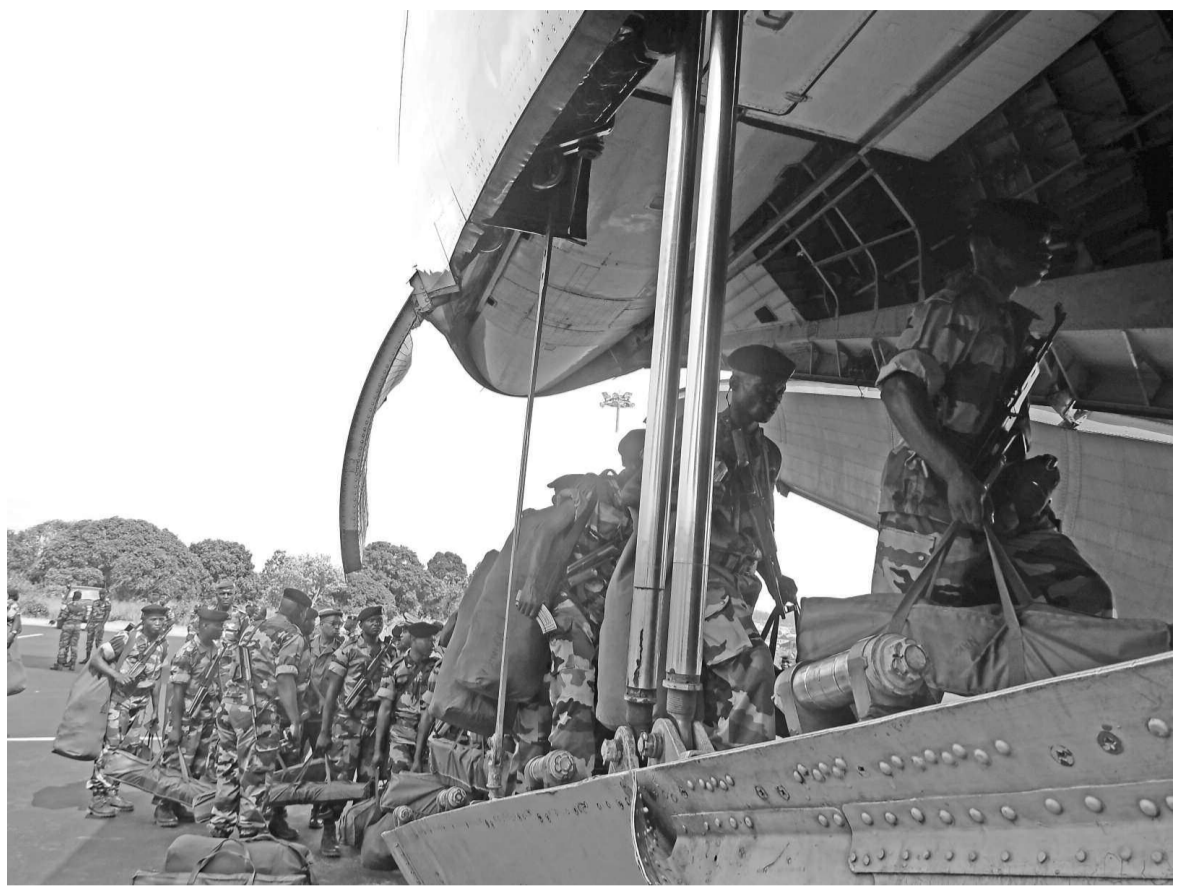
L'embarquement dans l'avion

fier de contribuer à la pacification de la Centrafrique. « Soldats de la paix, faites en sorte que partout où vous serez, dans les missions que vous aurez à accomplir, que vous ayez toujours l'envie, le besoin de bien faire par rapport aux ordres et aux instructions qui vous seront données. Pour notre part, nous appelons de tous nos vœux l'éternel Dieu des armées pour qu'il vous inspire, vous fortifie et vous protège