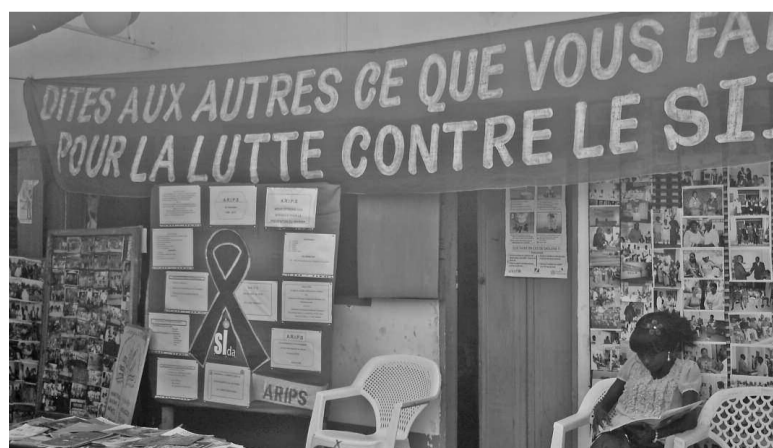
L'exposition organisée par l'Arips à l'occasion de la Journée mondiale de lutte contre le sida

L'ONG à caractère social et d'action humanitaire organise par ailleurs des causeries éducatives, des séances de responsabilisation des parents et des ateliers d'éveil des parents dans les