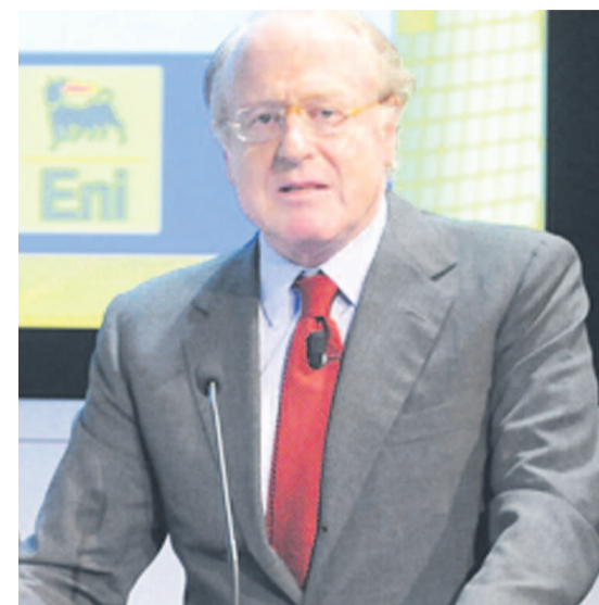
Paolo Scaroni, administrateur délégué du géant pétrolier italien ENI

Vous avez dit « liberté religieuse » ? Chacun, apparemment, l'entend à l'aune de ses propres intérêts. L'Organisation de la coopération islamique (OCI) s'est déclarée « choquée et consternée » par les informations faisant état de la décision du gouvernement angolais d'interdire l'islam et de démolir les mosquées du pays. Il appelle l'ONU et l'Union Africaine à agir « avec fermeté » face à cette décision qui constitue « une violation flagrante des droits de l'homme et des libertés fondamentales ». On sait, depuis, que le gouvernement a démenti cette volonté et tenté de clarifier sa position, mais la polémique a rebondi de plus belle lorsque des communautés musulmanes ont confirmé s'être