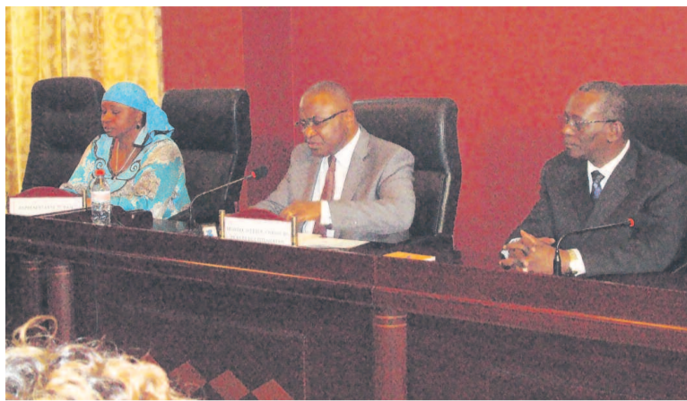
Le présidium des travaux

À travers cet atelier, la mission a démontré que les deux piliers essentiels sont confirmés, à savoir : l'appui à la sécurité alimentaire à travers les transferts sociaux en vue d'une assistance alimentaire des ménages pauvres et l'alimentation scolaire à travers les cantines scolaires ; et l'appui du Pam au Congo pour élaborer tout le dispositif de réponse pour faire face aux catastrophes naturelles. Ainsi, une autre recommandation a porté sur la liaison entre les cantines scolaires et le filet de sécurité. Le repas servi à l'école est un transfert qui améliore la situation