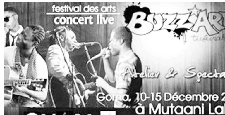
« Buzz'Art Tufurahi » se veut un outil de pacification

L'événement est organisé par Mutaani Label, une maison de production basée à Goma.