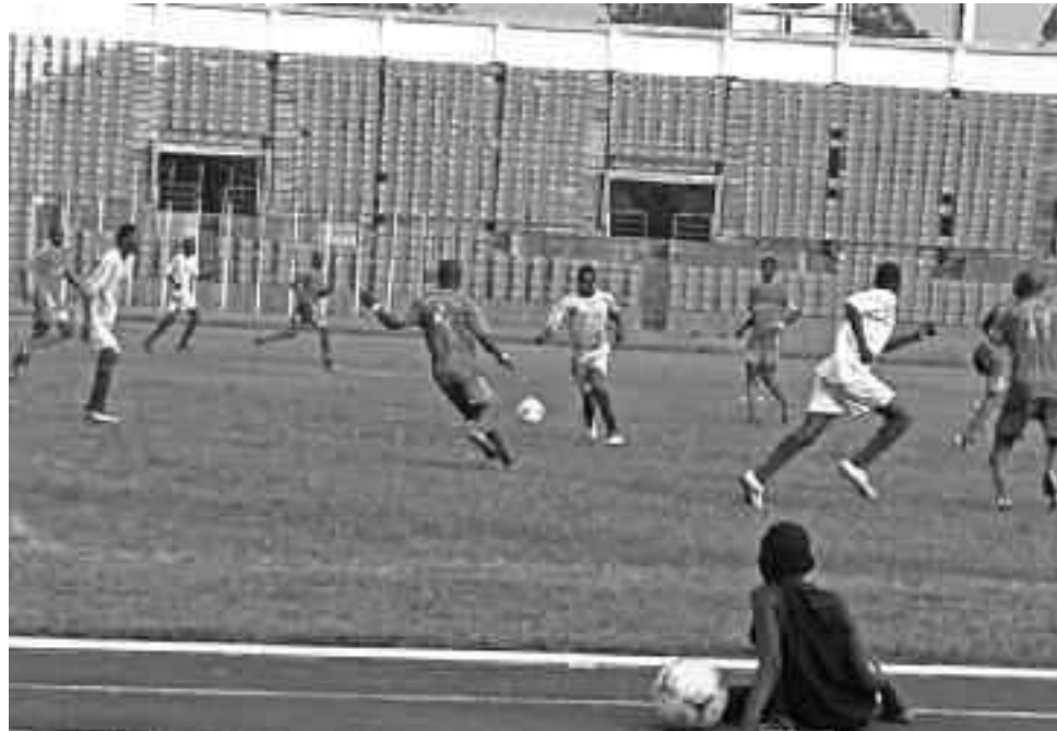
Une phase de jeu de la rencontre.