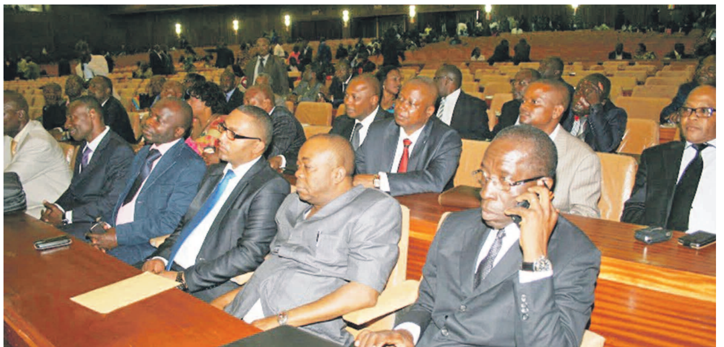
Des députés nationaux en plénière