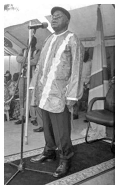
Le président de l'Udps, Étienne Tshisekedi