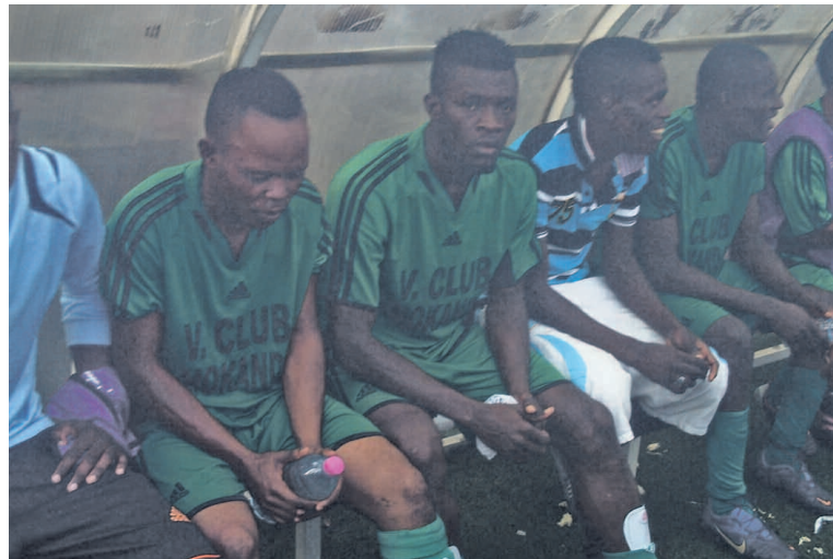
Les joueurs de V. Club savourant leur victoire.