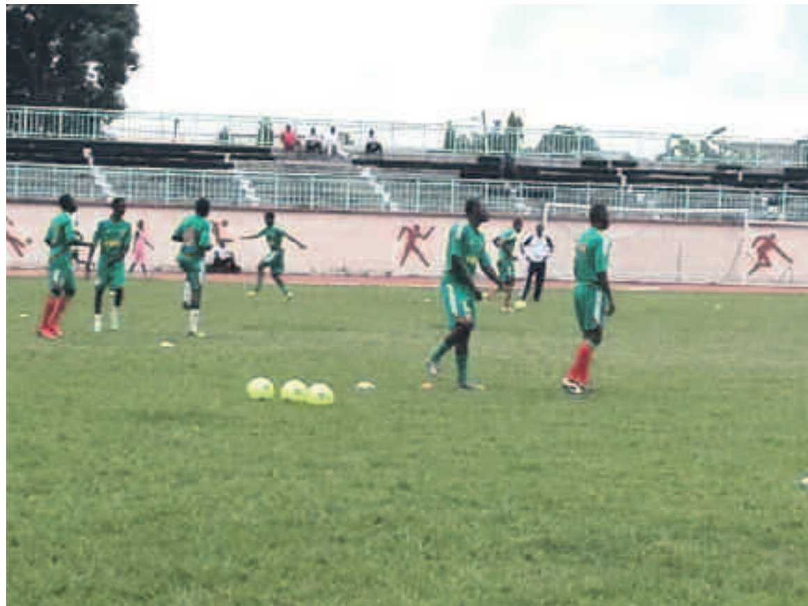
Les Diables rouges à l'entraînement.