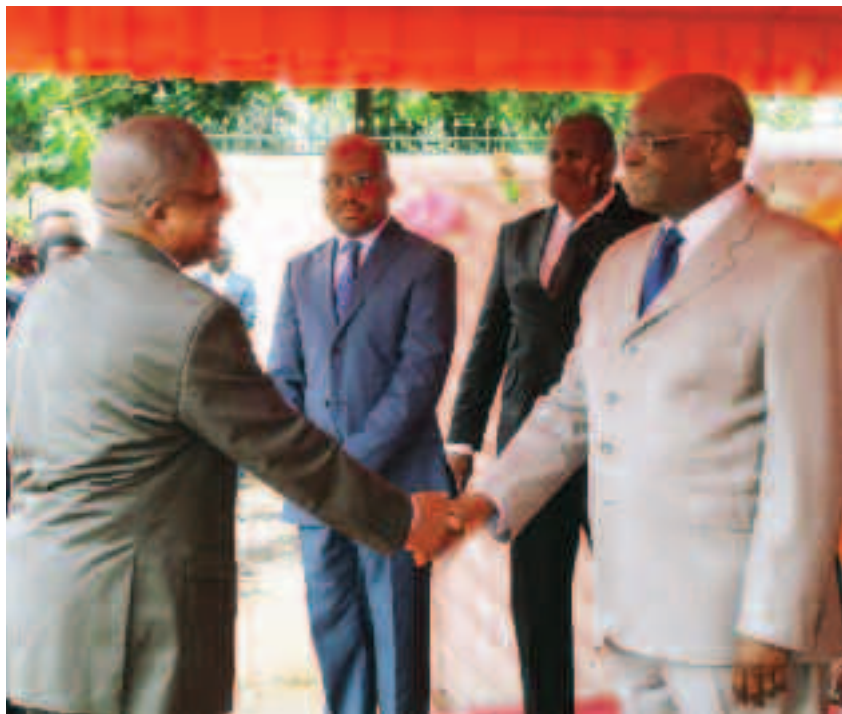
La présentation des vœux (© DR).

ration de couverture en latérite des 4 000 km de routes ouverts dans les départements de la Li-