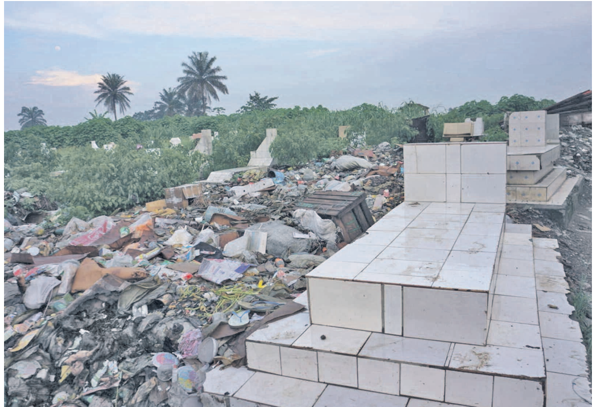
Le cimetière transformé en décharge.

Situé dans le quatrième arrondissement de la ville, Loandjili, l'ancien cimetière public de la ville océane ressemble aujourd'hui à un dépotoir à ciel ouvert en raison de l'incivisme des populations environnantes.