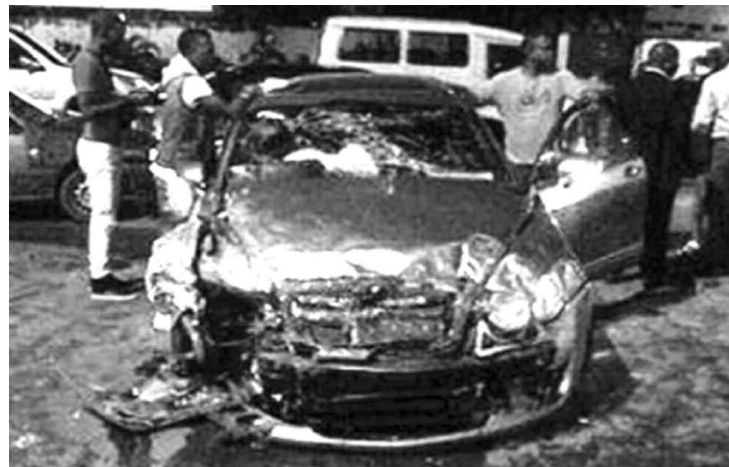
La Bentley de Fally Ipupa au sortir de l'accident

Les inconditionnels des réseaux sociaux, particulièrement Facebook, eux avaient déjà trouvé de l'apaisement à la lecture du message posté par la star la même soirée. Cependant, sur sa page, il était men-