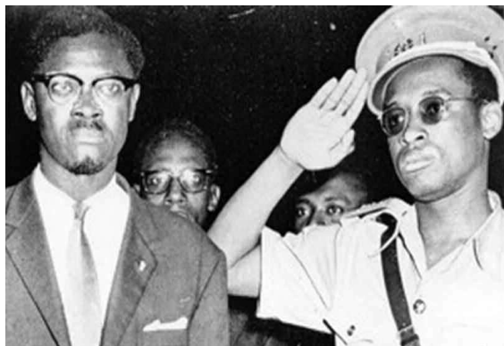
Patrice Lumumba et Mobutu Sese Seko

Ces documents retracent la politique étrangère des États-Unis envers le Congo de la proclamation de l'indépendance jusqu'aux premières années du régime Mobutu. Une période troublée marquée par les tentatives de secession des provinces du Katanga et du Kasai, qui faillirent priver la toute jeune République de l'ensemble de ses ressources minières, et l'ascension au pouvoir du général Mobutu Sese Seko dans lesquels les puissances occidentales, États-Unis en tête ont joué un jeu trouble sur fond de rivalité avec la puissance ennemie d'alors l'URSS (la Russie). La première partie de l'ouvrage revient sur la période allant de 1960 à 1963 et révèle l'influence omniprésente des politiques secrètes du gouvernement américain dans le pays nouvellement indépendant visant à installer un régime occidental et limiter l'influence soviétique. La deuxième partie de l'ouvrage, qui couvre 1964-1968, retrace la poursuite des programmes d'action politique clandestins menés par les États-Unis.