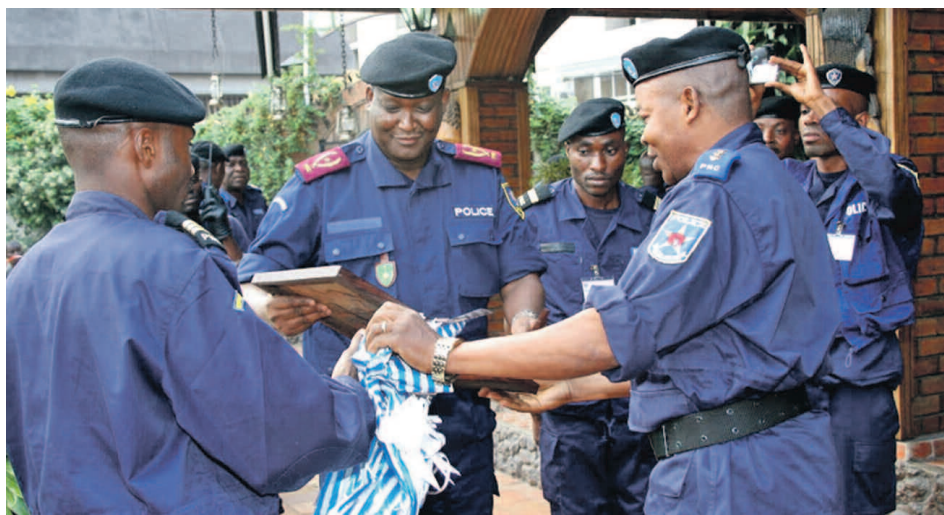
Le général Charles Bisengimana lors de la cérémonie d'échange des vœux avec les policiers à Kinshasa.

Le recrutement de nouveaux effectifs entre dans le cadre de la poursuite de la réforme de la police et fait également partie des stratégies de lutte contre l'insécurité dans le pays, a expliqué le nouveau commissaire général de la police au cours de la cérémonie organisée vendredi dernier en guise de sa prise de fonction. La Police nationale congolaise (PNC) vient de procéder au recrutement d'au moins 7000 nouveaux policiers à travers le pays, a révélé le général Charles Bisengimana. Plus de 2000 policiers ont été recrutés à Kinshasa et 500 autres dans chaque province, a-t-il indiqué tout en soulignant qu'ils bénéficieront d'une formation dans divers sites retenus à travers le pays. Toutefois, le succès de cette action reste tributaire de ce que le gouvernement mettra comme moyens à la disposition de la PNC car, comme l'a indiqué le nouveau patron de la police, « quelle que soit leur niveau de formation, si les policiers ne sont pas équipés, ils ne sauront pas faire grand chose ».