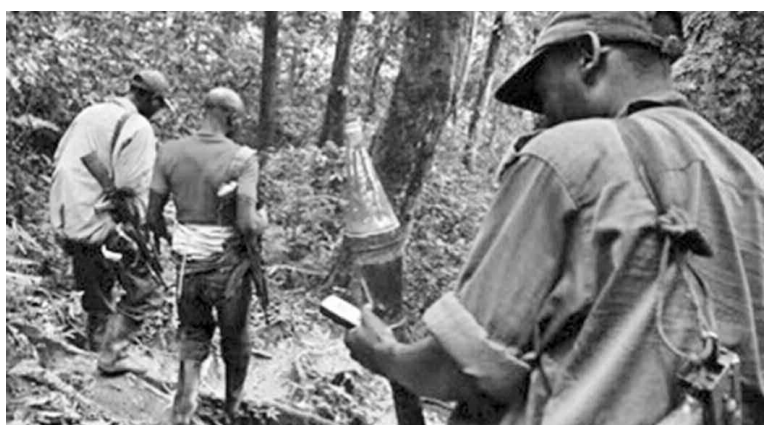
Des éléments des FDLR à l'est de la RDC

En Province Orientale, et précisément dans la ville de Kisangani, le comité de sécurité provincial a maille à partir ces derniers temps avec les criminels et autres pyromanes. Après les échauffourées enregistrées le 2 janvier suite aux repréailles des unités de la garde républicaine contre des jeunes gens accusés d'avoir ta-