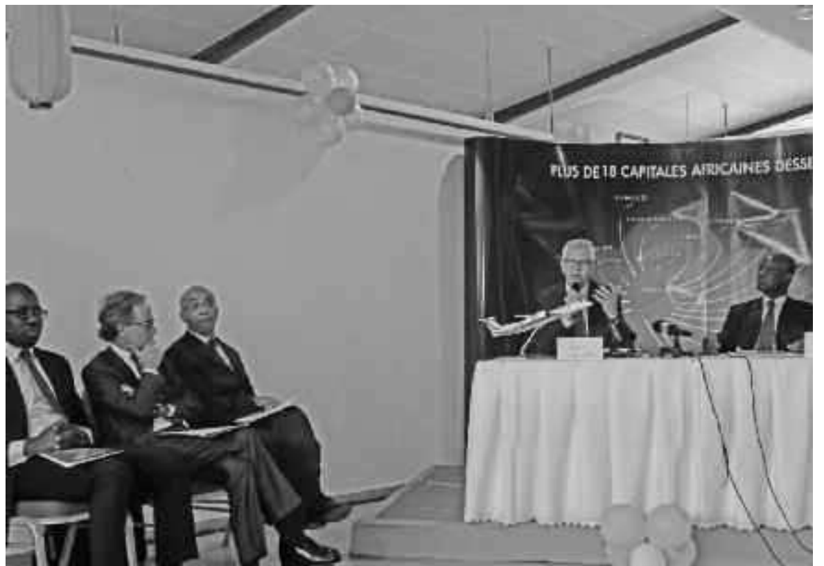
Le directeur général et le président du conseil d'administration d'Air Côte d'Ivoire animant la conférence de presse.

L'État ivoirien actionnaire principal Air Côte d'Ivoire a été créée en mai 2012 à l'initiative de l'État Ivoirien qui en reste l'actionnaire majoritaire à 65%. Air France, qui est un partenaire technique, participe pour sa part à hauteur de 20% pendant que le groupe privé ivoirien Golden détient 15%. « L'État a promis de nous aider à pérenniser l'activité. Il va nous accompagner dans l'augmentation de notre capital. Il pourra se désengager dans deux ans au plus