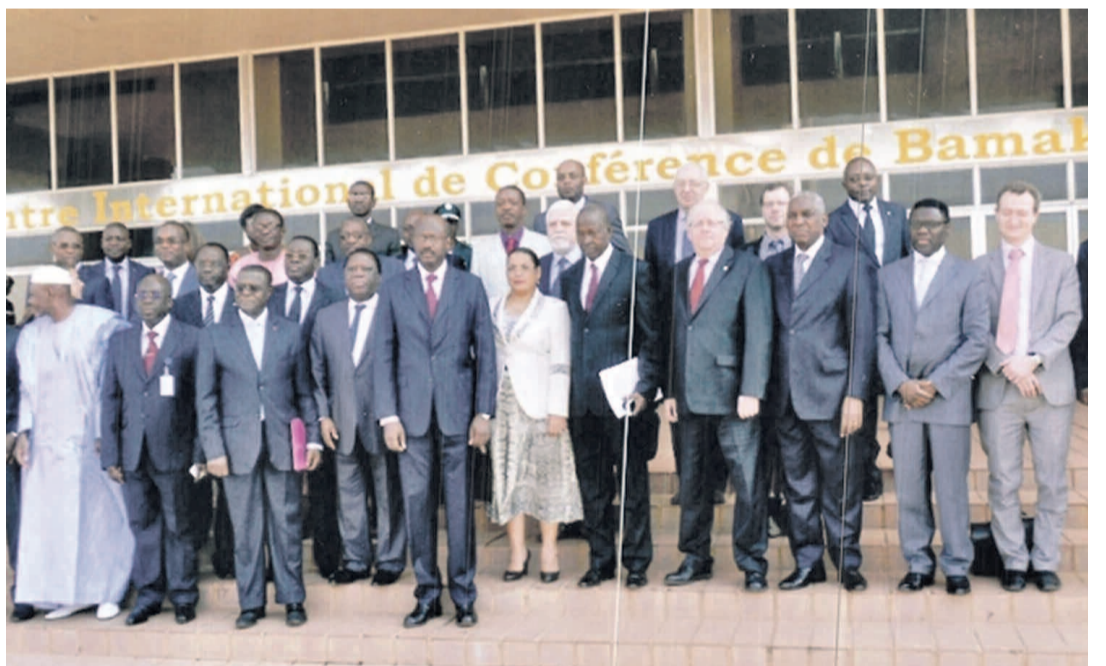
Photo de famille des participants aux travaux de Bamako avec le Premier ministre du Mali