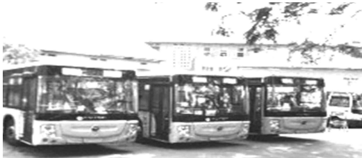
Les bus 207, sur le boulevard du 30 juin

risque. Si on nous y empêche, on va carrément changer des lignes », a souligné un conducteur de ces bus. Mais, sur le terrain, à ce premier jour, les éléments de la police n'ont pas semblé avoir eu les ordres d'empêcher ces véhicules