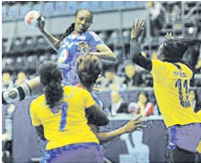
Les handballeuses de la RDC contre les Françaises au championnat du monde en Serbie

Cette défaite n'a pas de conséquence sur l'objectif des Léopards dames qui se sont tout de même