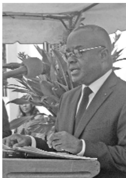
Le ministre de l'Enseignement supérieur, Georges Moyen

Le 20 janvier, lors de la cérémonie de vœux avec ses collaborateurs, le ministre de l'Enseignement supérieur, Georges Moyen, a souligné que les projets non réalisés en 2013 appelaient de la part de l'université Marien-Ngouabi notamment, une attention accrue de son rôle leader, de modèle dans l'encadrement de qualité optimale des ressources humaines censé porter précisément tous ces projets. Ainsi, pour rendre plus visibles les objectifs assignés à l'université,