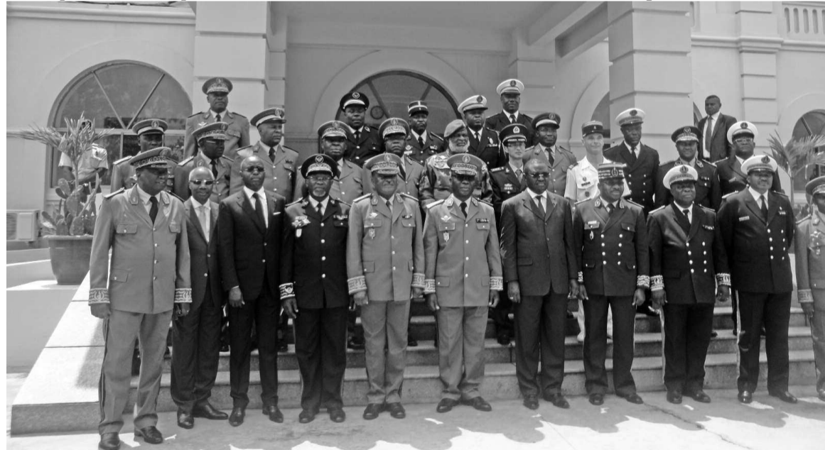
Le ministre avec les membres du haut commandement des FAC et de la Gendarmerie nationale

aux nouvelles menaces, aux conflits futurs, et affirmer le crédit de nos armées par une participation active aux missions tant sur le plan national qu'interna-