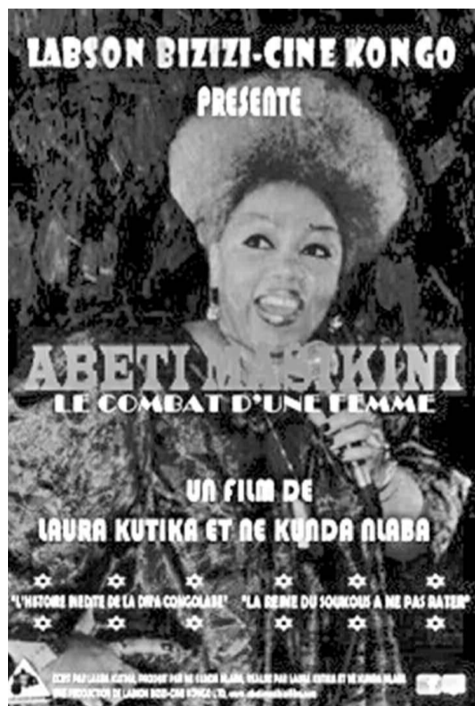
Une affiche du film

Par ailleurs, font savoir les auteurs, ce documentaire évoque également les droits de la femme, car Abeti Masikini, qui combinait vie familiale et