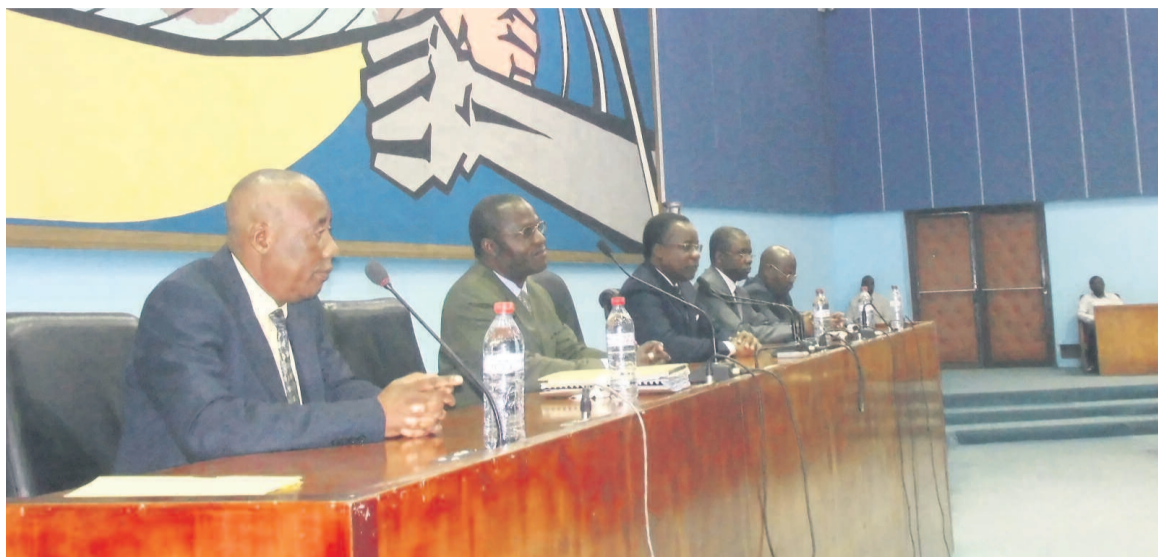
Une vue de la tribune

Selon l'article 3 de l'avant-projet de loi, l'Agence de planification a pour mission, entre autres, de délimiter et d'organiser les services publics, les zones prioritaires, les