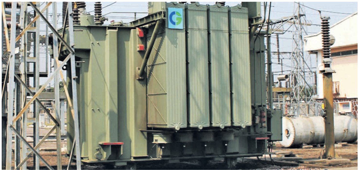
Un transformateur de la Snél au poste de distribution du courant électrique à Bandalungwa