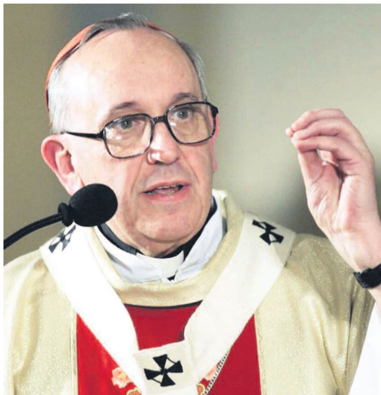
Le pape François

Le chef de l'Église catholique rappelle, au Forum économique mondial de Davos, que la richesse doit servir le monde, pas le gouverner