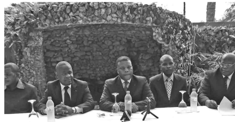
Les membres du nouveau collectif de l'opposition