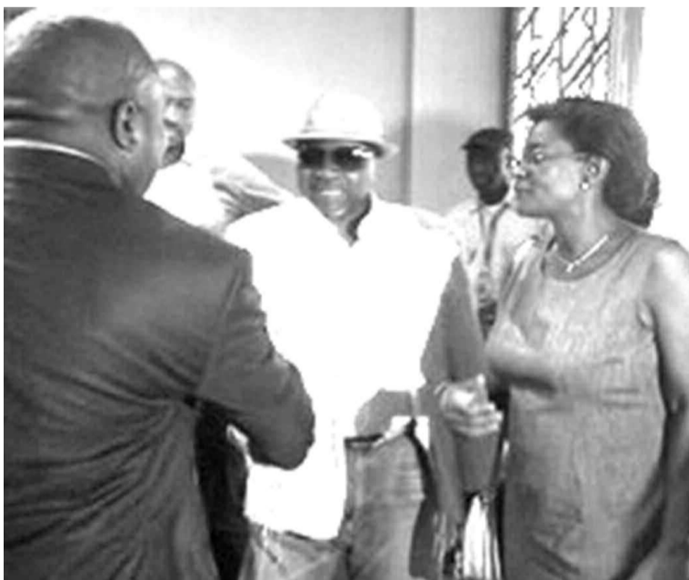
Papa Wemba accueilli par les organisateurs du concert à Conakry

vous allez voir », a promis un des musiciens. Pour sa part, apprend-on, Papa Wemba a promis de donner le meilleur de lui-même afin de satisfaire son public guinéen qui ne l'a plus vu sur scène depuis plusieurs années. Indigo Pub, structure qui organise ce concert n'a pas lésiné sur les moyens afin de faire du show de Papa Wemba un événement exceptionnel. Plusieurs posters géants annonçant le concert sont affichés le long de grandes artères de Conakry. Annoncé dans un premier temps à la veille des festivités de fin d'année, le concert avait finalement été reporté pour le 31 janvier. Pour rappel, après son concert de Guinée, le patron de Viva la Musica sera en concert