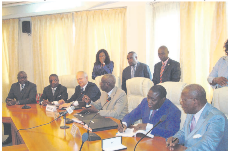
La signature des documents d'exploitation.