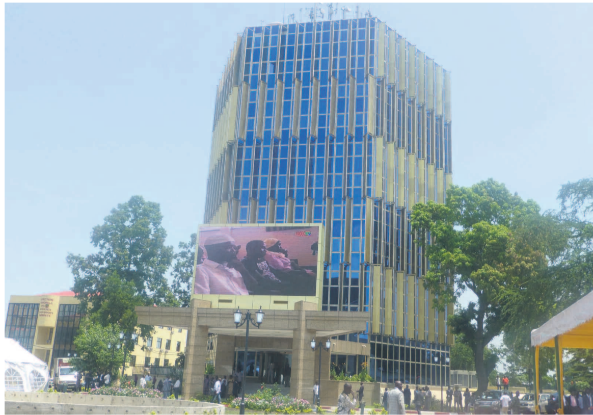
Le ministère du Plan et de l'Aménagement du territoire

teurs des objectifs précis, chiffrés pour certains, à atteindre absolument : avancer systématiquement avec les travaux de construction de la route lourde Pointe-Noire — Brazzaville dans son tronçon Dolisie-Brazzaville ; construire un peu de plus de 350 km de routes bitumées supplémentaires,