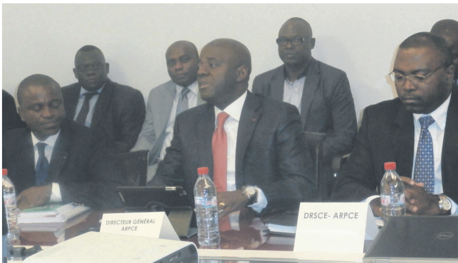
La direction de l'ARPCE lors de la rencontre avec les opérateurs de la téléphonie mobile, le 30 janvier

L'Agence de régulation des postes et télécommunications électroniques (ARPCE) a enjoint Airtel et Mtn Congo, deux principales sociétés de la téléphonie mobile, à tout mettre en œuvre pour améliorer la qualité de leurs réseaux d'ici à la fin du premier trimestre de cette année.