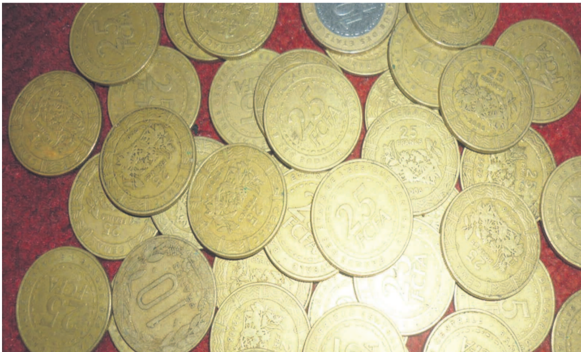
La petite monnaie se fait de plus en plus rare.

« Les pièces de monnaie n'ont jamais été aussi rares. On se demande où elles sont passées, car cela freine les achats pour ceux qui n'en ont pas », s'est plaint une vendeuse du grand marché de Pointe-Noire, ce mercredi 29 janvier.