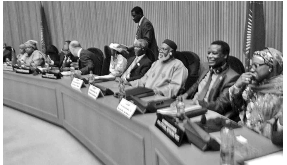
Le présidium de la réunion du CPS le 29 janvier 2014.