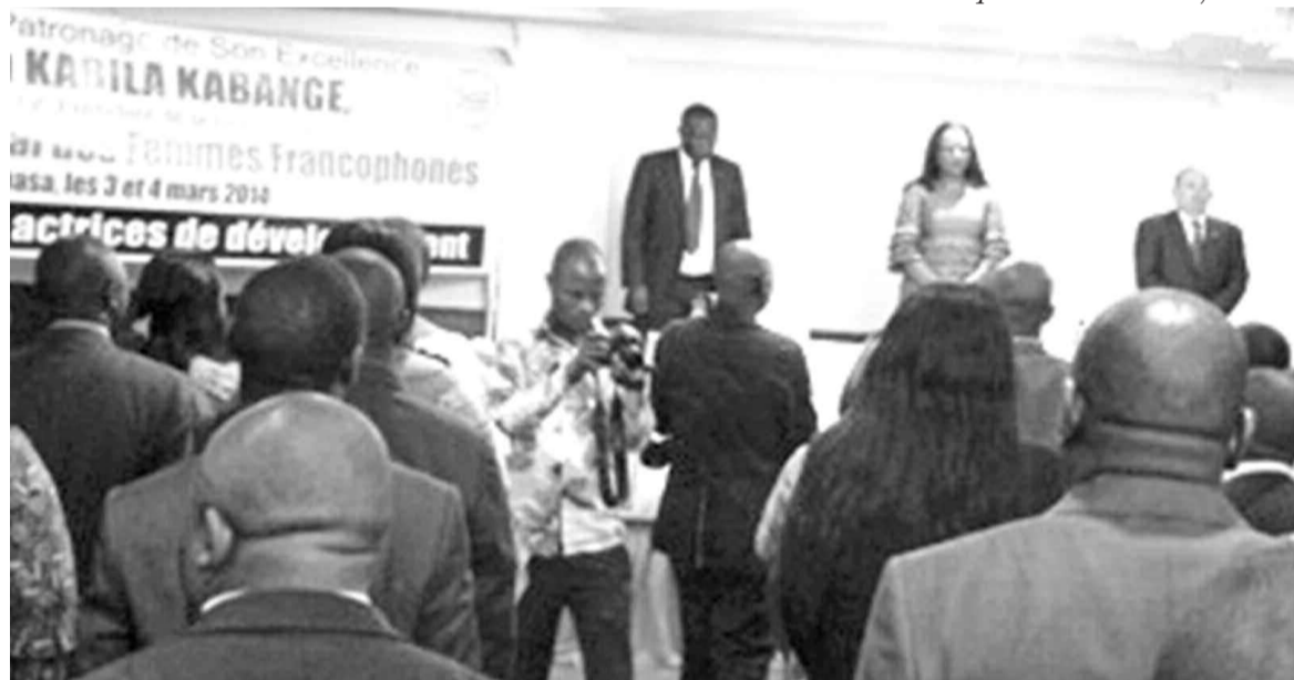
Une vue de la salle lors du point de presse