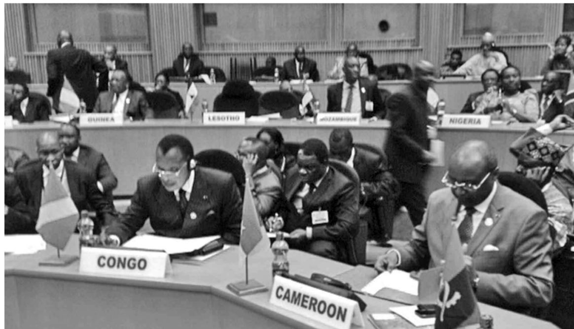
Une vue des délégations à la réunion du CPS le 29 janvier 2014.