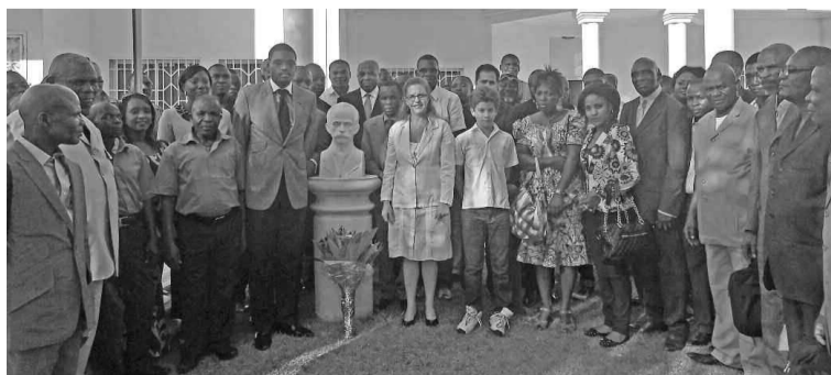
La photo de famille devant le buste de José Martí