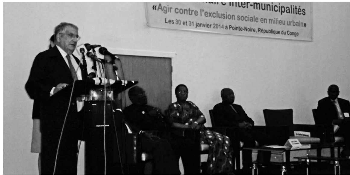
Le présidium lors de la cérémonie d'ouverture du séminaire.

Il s'agira, au cours de ce séminaire, d'échanger sur le phénomène des enfants en situation d'exclusion sociale favorisée par l'urbanisation incontrôlable des métropoles africaines à l'origine de la détérioration du cadre de vie traditionnel, et aussi de réfléchir sur les mécanismes devant contribuer à lutter contre son