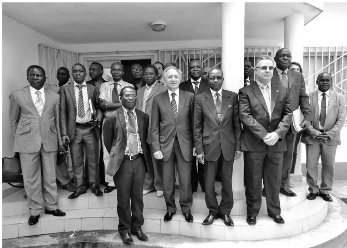
La photo de famille de la réunion de lancement du Paramed à Brazzaville.

«Ce projet est donc un maillon solide de la chaîne de formation, à l'instar du séjour d'étude à Cuba de cinq cents jeunes élèves