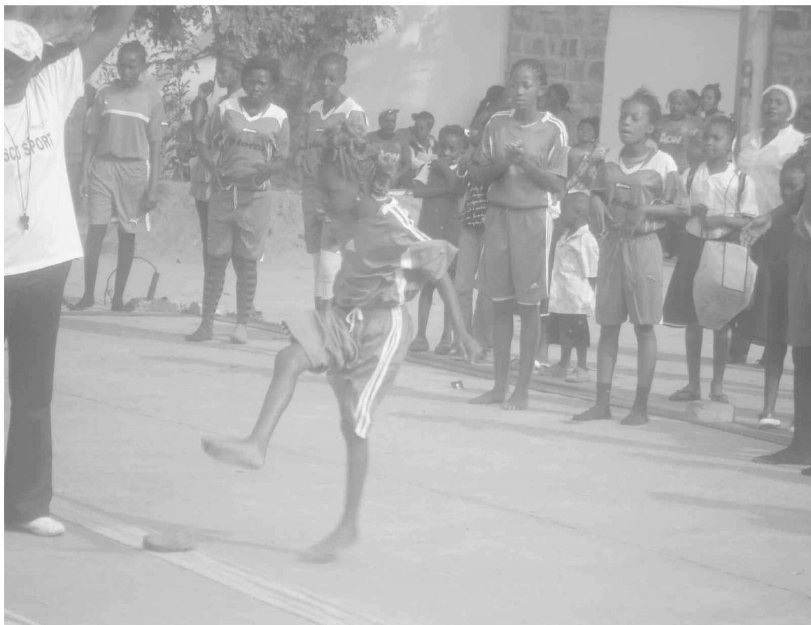
Une rencontre de nzango

Dans les rencontres de nzango, deux équipes de onze joueuses s'affrontent pendant 50 minutes. Elles sont disposées en deux rangées, se faisant face