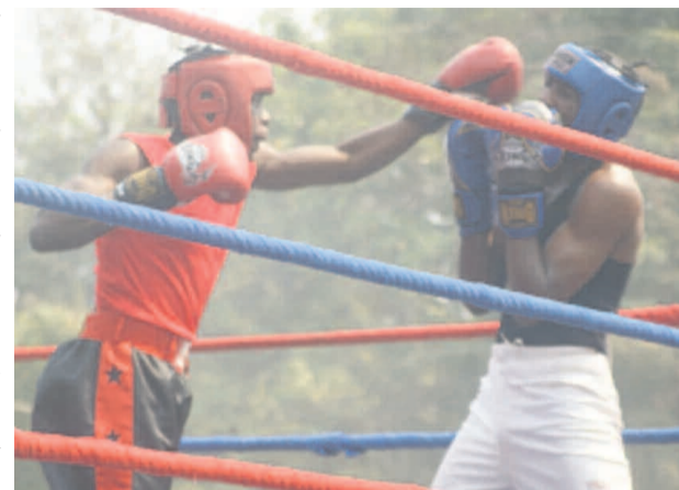
Un combat de boxe amateur organisé par la ligue de Brazzaville.

Seule la boxe amateur est autorisée aux Jeux olympiques. Les adversaires ont l'obligation de porter des gants, des chaussures sans pointe ni talon, une culotte à mi-cuisse, une coquille protectrice, un protège-dents, un casque protecteur et un maillot léger sans manche. Le ring doit mesurer 6 mètres de côté au maximum et 4,90 m de côté au minimum avec trois cordes en chanvre 2 cm au minimum et 3 cm de diamètre au maximum, entourées de plastique ou d'étoffe. Les cordes doivent être placées à 30 cm des poteaux entourant le ring et les coins sont rembourrés de la base au sommet du poteau par un coussin de cordes de protection. La première corde se situe à 40 cm, la seconde à 80 cm et la dernière à 130