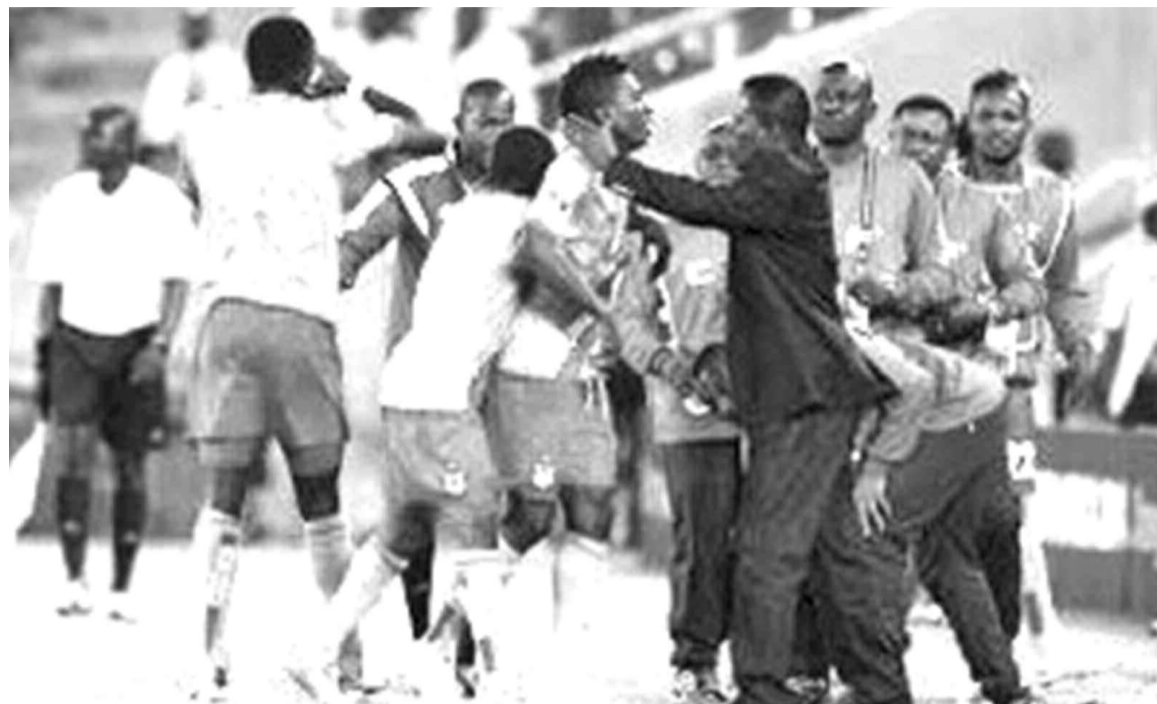
Les Léopards locaux de la RDC au Chan 2014

Les Léopards locaux de la RDC ont regagné le pays le 29 janvier, en provenance de Johannesburg en Afrique du Sud où ils ont pris part à la 3e édition du Championnat d'Afrique des Nations (Chan). Les joueurs évoluant dans les clubs du Katanga sont arrivés à Lubumbashi le 28 janvier, et ceux de Kinshasa le 29 janvier. La RDC n'a pas dépassé le cap des quarts de finale de cette compétition de la Confédération africaine de football réservée aux sélections nationales composées des joueurs évoluant dans leurs championnats nationaux respectifs. Les poulains de Santos Mwitubile ont été battus à ce stade de la compétition par les Black Stars du Ghana par un but à zéro. La RDC a partagé le groupe D avec la Mauritanie, le Gabon et le Burundi. Elle avait gagné son premier match contre la Mauritanie par un but à zéro, une réalisation de Ngoy Emomo sur penalty, avant de per-