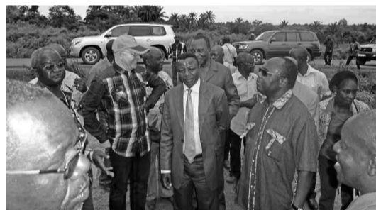
La délégation visite les chantiers

Les rues poussiéreuses de Sibiti présentent peu à peu un nouveau visage. Bien qu'aucun kilomètre, ou presque, ne soit encore bitumé, le drainage effectué par des engins pour mieux délimiter les avenues offre à la ville un nouvel éclat. Place de la Concorde, dans le centre de Sibiti, l'avenue qui abritera le défilé militaire et civil, est déblayée, en attente des travaux d'envergure. Les boutiques sont alignées mais l'on aperçoit encore des habitations en déliquescence. Certaines seront expropriées, rapportent des membres du comité de suivi qui s'attardent à cet endroit pour un échange avec les autorités locales sur les emplacements de tel ou tel édifice. Pour cette première visite des chantiers, le Comité de suivi de la municipalisation accélérée de la Lékoumou est presque au complet. Son président, le ministre Thierry Mougalla, était accompagné d'un certain