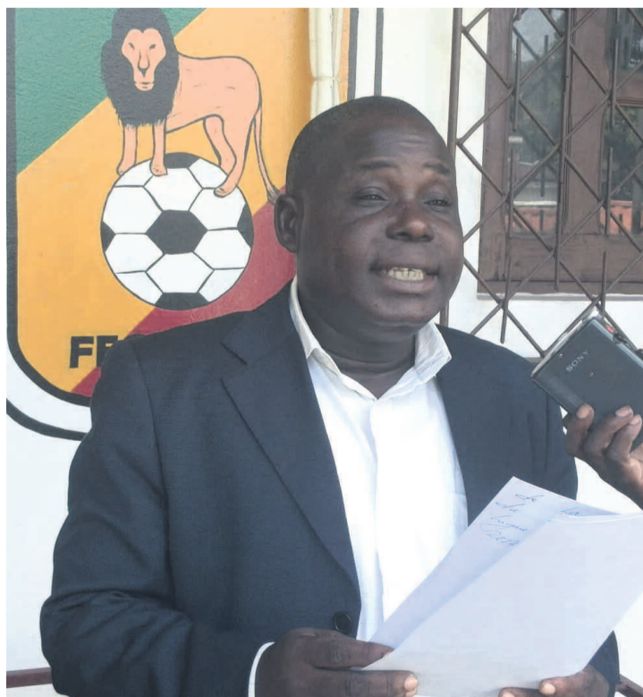
L'un des membres de la Fécofoot lisant le communiqué final