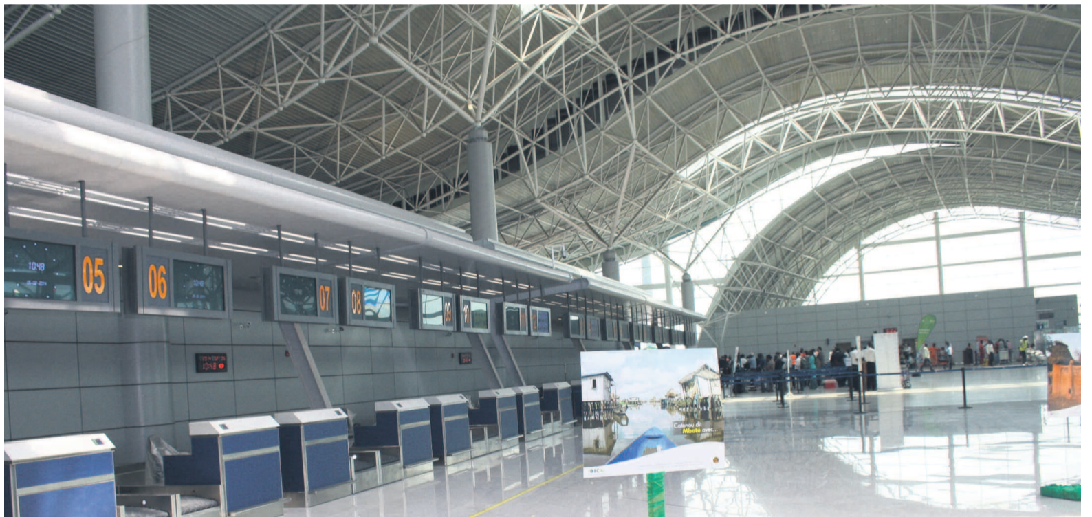
L'intérieur de l'aérogare