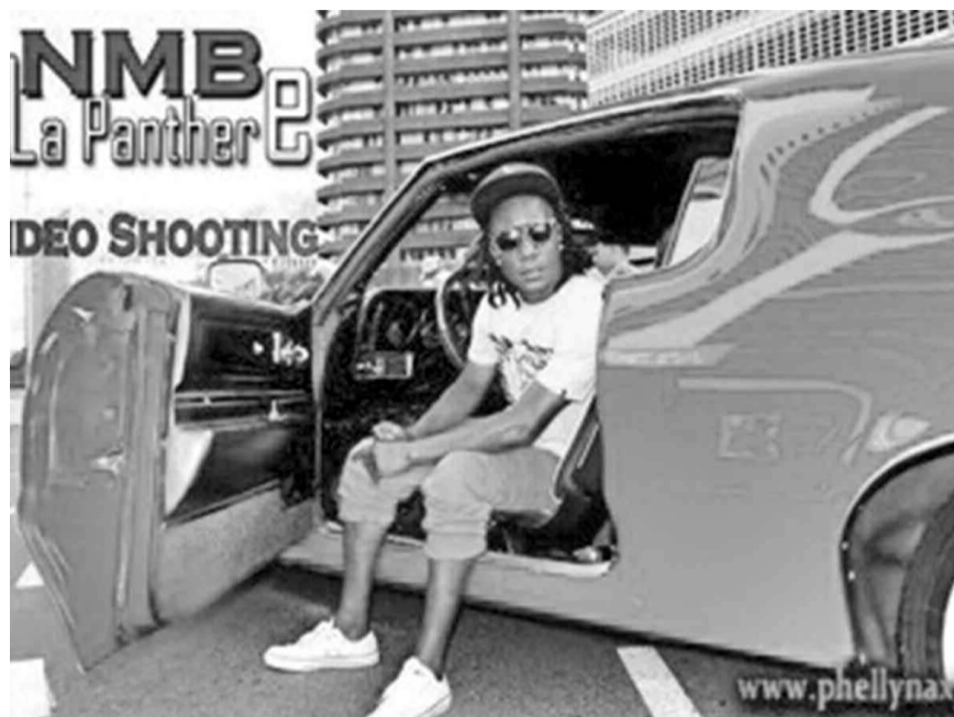
NMB dans un extrait de la vidéo d'Identity

Demeuré dans l'ombre deux ans, après le très médiatisé concert Peace in Africa show, NMB entend à nouveau faire parler de lui. Prévu de manière significative, son retour après son séjour non encore à terme en Afrique du Sud, ce qui explique d'ailleurs mieux l'usage fréquent de l'anglais dans ses œuvres. C'est le cas notamment avec Identity en featuring avec un Marley, fils de feu Ziggy Marley, un des titres du prochain opus dont l'ex-