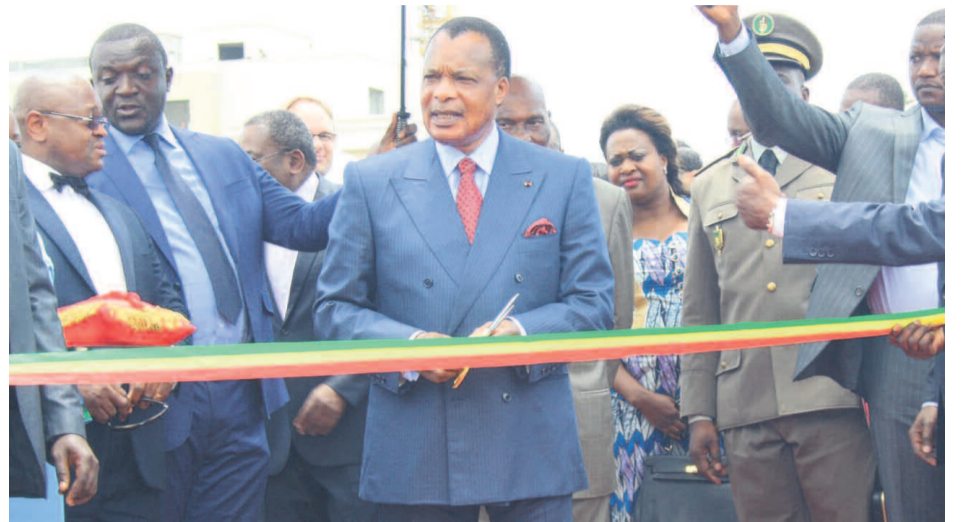
La coupure du ruban par Denis Sassou N'Guesso.

Le ministre des Transports et de l'Aviation