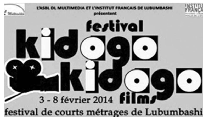
Le festival se présente sous forme d'un concours de courts métrages

Pour sa part, l'Institut français de Lubumbashi / Halle de l'Étoile est un instrument de coopération et de culture qui œuvre pour la diversité culturelle, en obéissant à une triple vocation : la mise en valeur des expressions artistiques et culturelles lushoises, katangaises et congo-