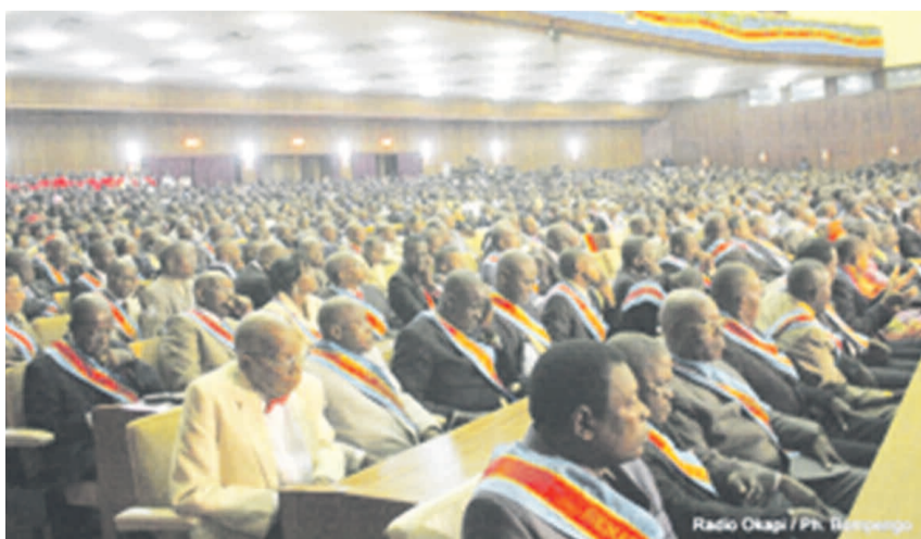
Des députés et des sénateurs réunis en congrès