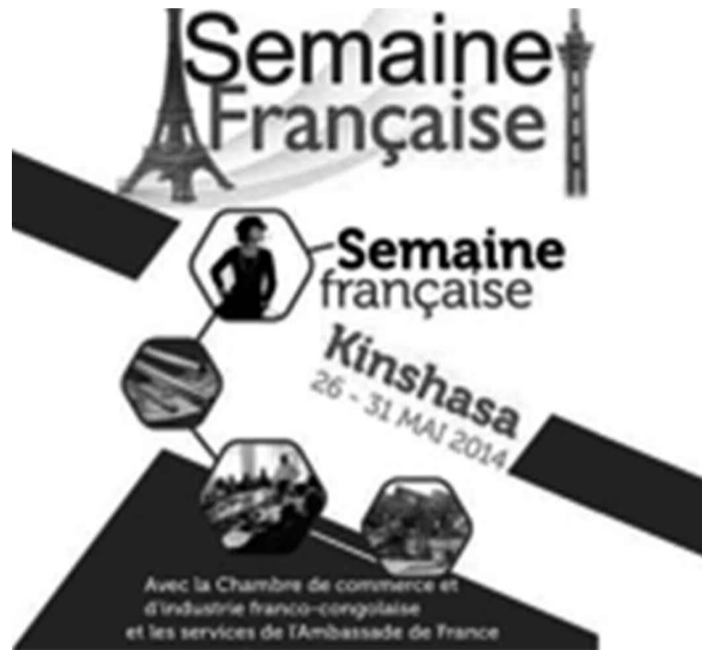
La Semaine française vise à consolider les relations économiques entre la RDC et la France

La manifestation se veut être un temps fort dans les relations franco-congolaises. À cette occasion, apprend-on, des stands en espaces ouvert ou fermé permettront aux entreprises de présenter leurs produits et/ou services. La semaine française à Kinshasa, selon les organisateurs, vise à renforcer la présence française au sein de l'espace économique congolais; appuyer et protéger les investissements des entreprises françaises; accompagner leur installation en RDC et rapprocher les communautés d'affaires en facilitant la mise en relations entre partenaires potentiels. Les institutionnels, la société civile, les cadres et décideurs, les professeurs et étudiants sont conviés à participer à cette Semaine française et à découvrir des entre-