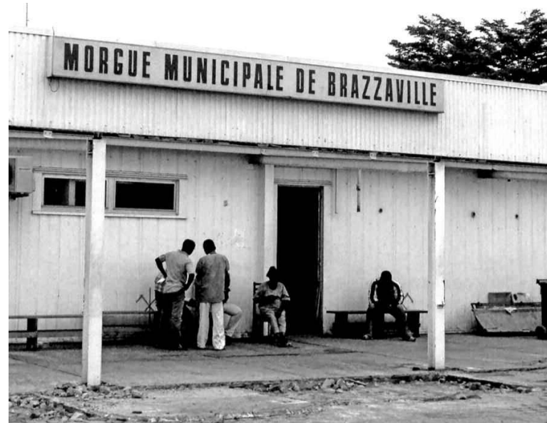
La morgue municipale de Brazzaville vidée en début d'après-midi