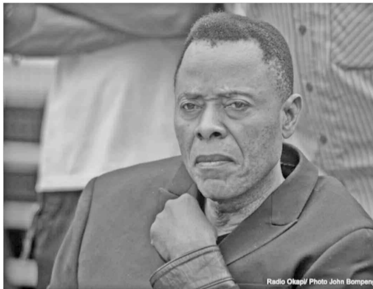
Le musicien King Kester Émeneya

André Kimbuta a coupé court à toutes les rumeurs qui ont circulé sur les funérailles de cet artiste qui n'appartenait plus à sa famille ni à la RDC, grâce à ses œuvres,