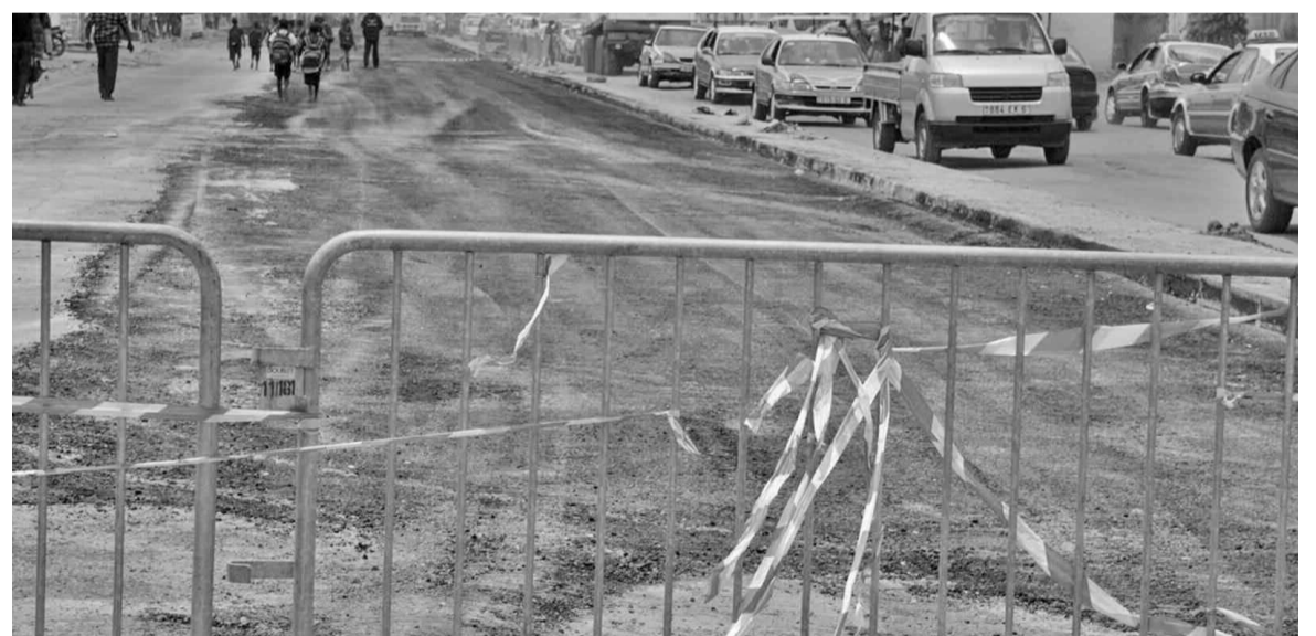
L'avenue Jacques-Opangault.

Débutés en mai 2013, les travaux de réhabilitation de l'avenue Jacques-Opangault s'exécutent au ralenti. D'où l'impatience qui grandit chez les populations de la ville océane.