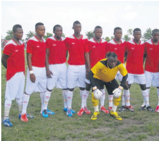
AS Nika de Kisangani

Le championnat national de football a repris ses droits de manière effective après les rencontres retour des compétitions africaines interclubs de football. Et les choses semblent changer au cours de la manche retour. C'est le cas par exemple du match de zéro but partout, le 19 février, au stade Lumumba de Kisangani (Province Orientale) entre la formation locale de l'AS Nika et l'ogre du football national, le TP Mazembe, en match retard de la 9e journée du groupe A de la Division 1. Au stade Tata Raphaël, Rojolu a signé sa deuxième victoire en battant Shark XI FC. TC Elima de Matadi a enfoncé encore un peu plus le CS Makiso, battu par zéro but à un. Le week-end sera marqué par les deux derbys du pays, notamment V.Club contre Daring Club Motema Pembe dans le groupe B et Mazembe face à Lupopo dans le groupe A.