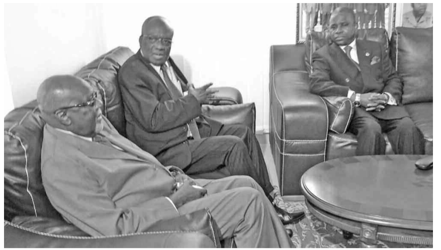
Les délégations lors de l'entretien.

Au cours de l'entretien, les deux partis ont passé en revue leur coopération, manifestant le désir de signer, au moment opportun, un accord dans ce domaine. Cet accord, a déclaré le responsable angolais, permettra de réchauffer les relations entre les deux partis, les deux gouvernements et les deux peuples. Profitant de leurs échanges, les deux délégations se sont rappelé les moments où le MPLA était basé à Brazzaville et bénéficiait de la solidarité du peuple congolais et de son gouvernement. Le responsable angolais a profité de cette rencontre pour remercier le gouvernement du Congo pour cette solidarité qui a fait que l'Angola puisse être indépendant et a permis au MPLA de le diriger. La nouvelle forme de coopération qui sera mise en place, a souli-