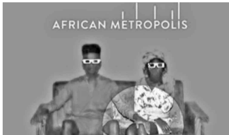
Le logo du projet