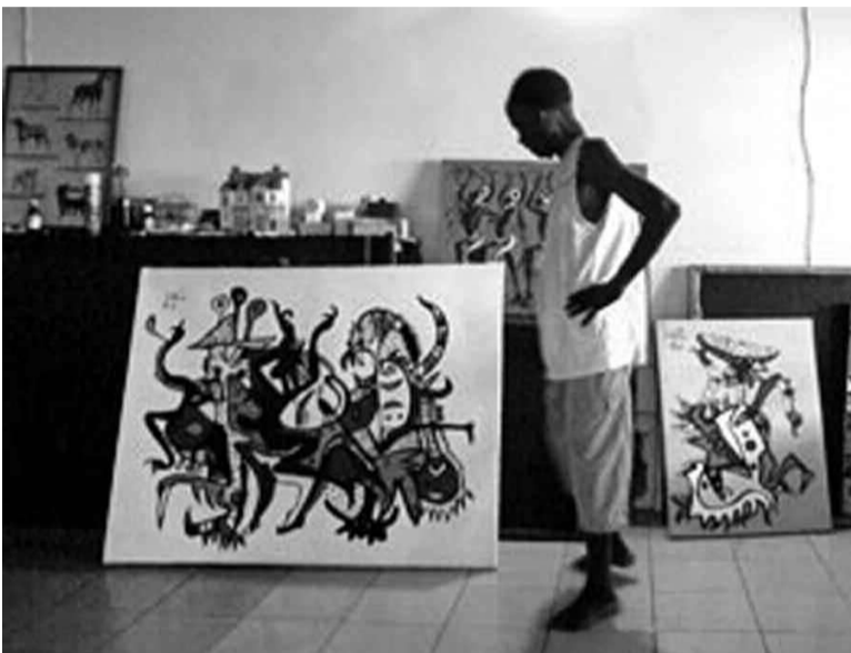
L'artiste dans son atelier