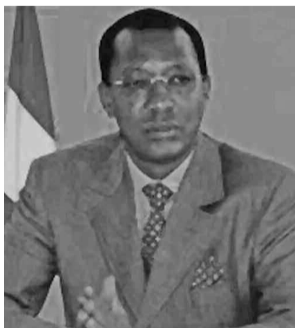
Idriss Déby Itno

Alors que la situation humanitaire est dramatique en Centrafrique, le Pro-