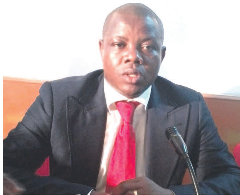
Guy Noel Titov, modernisateur du nzango

de l'imagination de Jean Samba, a connu quasiment le même parcours. Toutefois, la fédération nationale de cette discipline a vu le jour bien avant celle de nzango. La campagne de préparation des Jeux à l'échelle nationale et internationale a été lancée. Jean Samba a d'ailleurs souligné quelques simi-