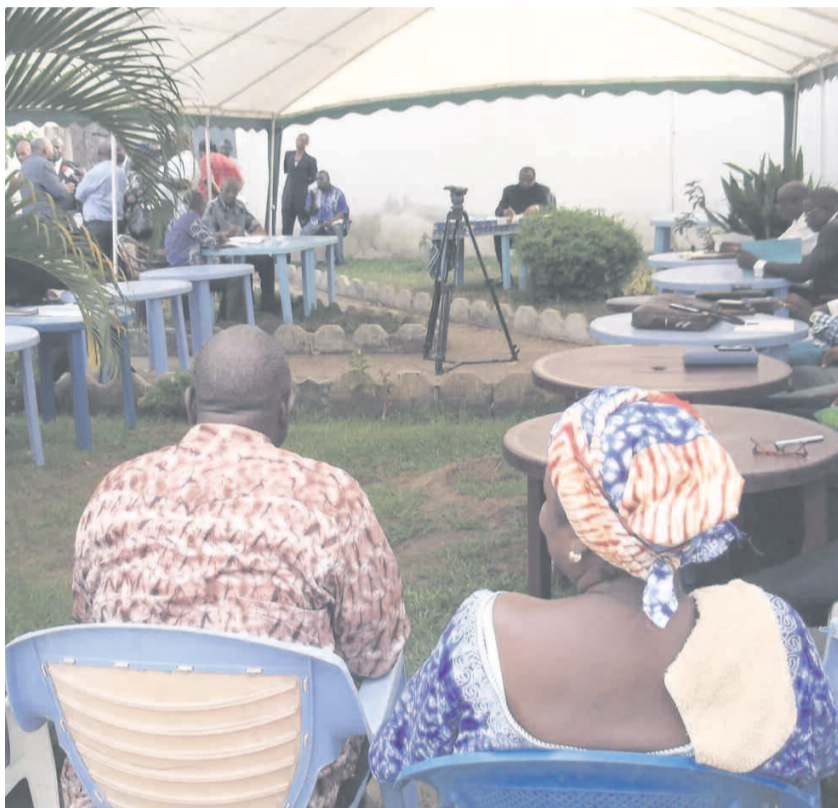
Les membres du bureau exécutif national lors de la réunion

un palliatif irréfutable à la fraude par l'achat des bulletins ou des candidats concurrents au sortir des bureaux de vote. Il est aussi une solution avérée au déséquilibre, à l'absence ou à l'insuffisance des bulletins de certains candidats comme on l'a souvent déploré dans les