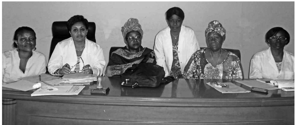
Le présidium des travaux de l'assemblée générale.