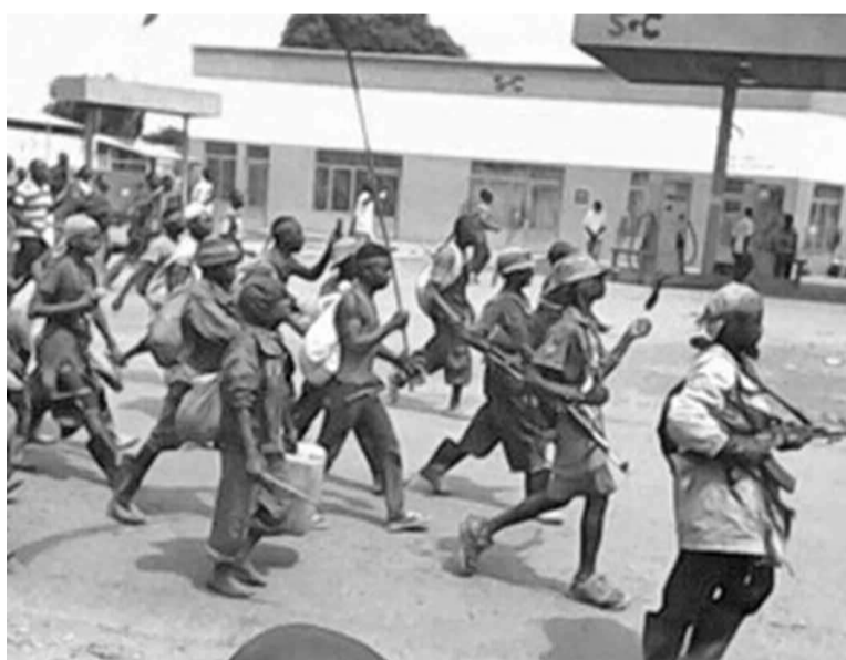
Une attaque des Bakata Katanga sur la ville de Lubumbashi

Dans cette réaction, ces évêques ont également fustigé « l'approvisionnement en armes et munitions dont bénéficient les miliciens,