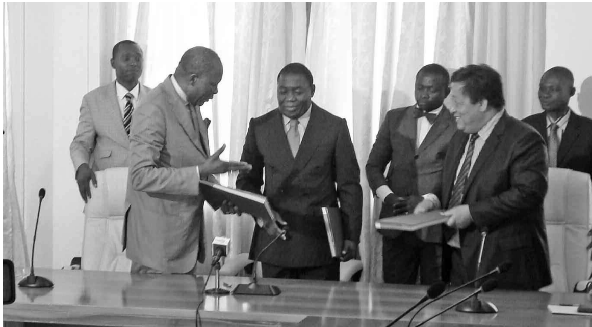
Échange de parapheurs entre les deux parties

«Après sept ans d'effort, notre société, Lulu de Mine, a exporté 1 100 tonnes de minerais de zinc et de plomb en février 2014. Cette exportation repré-