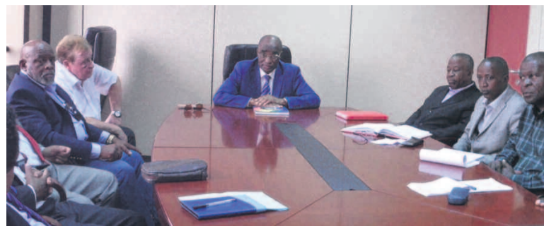
Bernard Tchibambéléla s'entretenant avec la délégation d'hommes d'affaires allemands.

Le projet présenté au ministre de la Pêche et de l'Aquaculture, Bernard Tchibambéléla, le 21 février à Brazzaville, consistera à créer de grandes fermes modernes d'aquaculture de poissons au Congo dans le but d'augmenter considérablement l'offre halieutique.