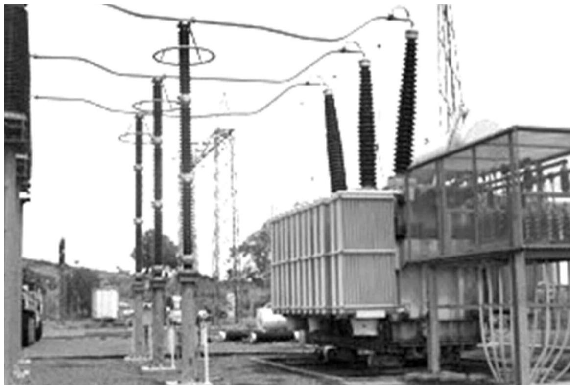
Un centre de transformation du courant électrique de la Snél

Pour Éric Mbala, la Snél qui est butée à ce problème est obligée d'adapter la consommation au niveau de sa production actuelle. « Le déficit est énorme évidemment et le pro-