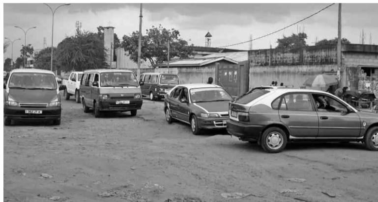
Le phénomène ne touche pas que les transporteurs en commun

Montez dans un taxi, un autobus ou embarquez simplement dans la voiture d'un ami, vous ne ferez pas un kilomètre sans qu'une injure ne soit distribuée. Personne n'est épargnée par ce comportement, qui n'est pas que le propre des transporteurs en commun, car même des personnes dignes de considération versent dans ce travers dès qu'elles montent au volant.