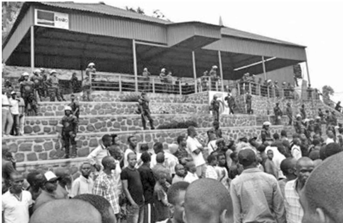
La place de l'Indépendance peu avant les échauffourées du 20 février

Les incidents survenus le 20 février à Bukavu lors du meeting annulé de Vital Kamerhe sur fond de dispersion des manifestants à la place de l'Indépendance continuent d'alimenter la chronique de ces dernières heures. Alors qu'à Nyirangongo, Goma, Beni et Butembo où il est passé, rien de tel n'a été déploré, son itinéraire a cependant été gâchée à l'étape de Bukavu, son fief. Déjà la veille, le maire de la ville avait, dans un communiqué diffusé sur l'antenne provinciale de Radio télévision nationale congolaise (RTNC) et à la Radio Maendeleo, annoncé la décision de l'autorité provinciale de délocaliser la manifestation de l'UNC de la place de l'Indépendance au stade de la Concorde dans la commune de Kadutu. Les travaux de réhabilitation en cours effectués sur le site étaient brandis comme justification à cette décision qui ne rencontrait nullement l'assentiment des responsables de l'UNC. Ces derniers avaient vite rejeté la décision estimant que le stade de Kadutu ne pouvait contenir tous leurs partisans qui pouvaient facilement aller autour de dix mille personnes voire plus !