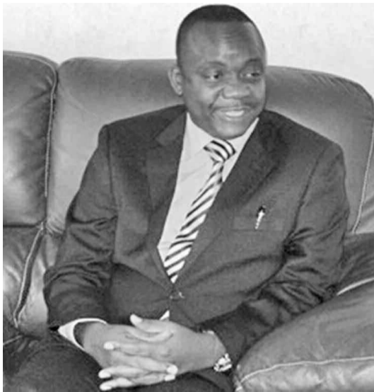
Le ministre de l'Économie et commerce, Jean Paul Nemyato

L'adhésion de la RDC à la zone de libre-échange du Marché commun de l'Afrique orientale et australe - Common Market for Eastern and Southern Africa (Comesa) n'est plus qu'un secret de polichinelle. Le décor est enfin planté pour rendre effective cette réalité. Lors du 16e sommet de l'organisation tenu à Kampala en Ouganda en décembre 2012, la RDC qui assurait la deuxième vice-présidence avait levé l'option de prendre une part active dans cette institution sous-régionale. Aujourd'hui, le pays de Joseph Kabila tient à matérialiser ce vœu en accueillant le 17e sommet des chefs d'État et de gouvernement du Comesa. Et d'ailleurs, un projet de loi portant adhésion de la RDC à la zone de libre-échange du Comesa est à pied d'œuvre. Le ministre de l'Économie et commerce et celui des affaires étrangères travaillent d'arrache-pied pour finaliser ce texte de loi et le transmettre pour adoption aux deux