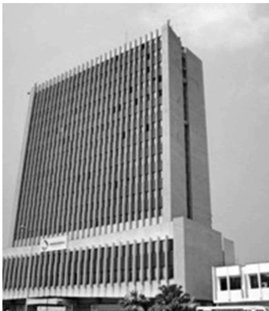
Siège administratif de la Régideso