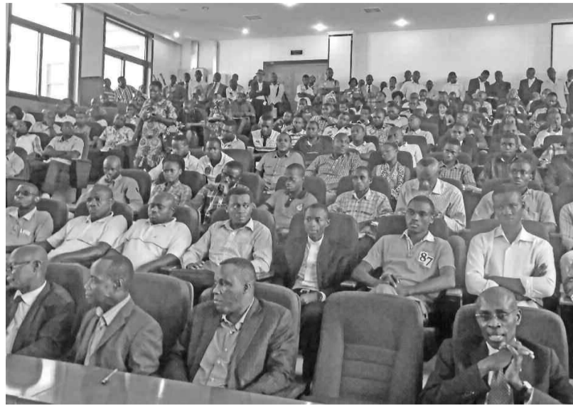
Les participants.

La dernière journée de ces rencontres a été consacrée aux jeunes engagés dans les associations, les mouvements et réseaux de jeunesse de la société civile que le ministre qualifie d'acteurs de terrain. Ils étaient venus nombreux à la préfecture de Brazzaville pour débattre avec le ministre. « Nous ne voulons plus qu'il y ait des gens qui se sentent exclus et d'autres qui décident à leur place.