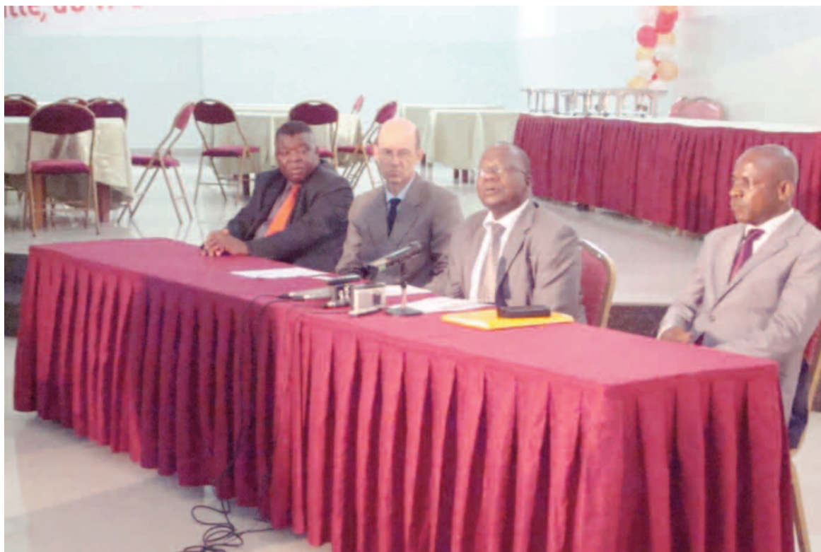
Le présidium des travaux.

nombrement du RGA est étroitement lié à une meilleure coordination et supervision du travail du personnel sur le terrain. « Coordonnateurs superviseurs nationaux membres du BCRGA ; le bureau de coordination et