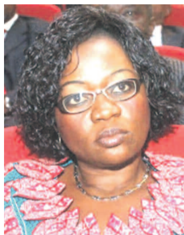
La ministre Geneviève Inagosi transmission de la mère à l'enfant demeure encore une préoccupation », reconnaît-elle.

Quant à l'amélioration de la santé maternelle, le taux de la mortalité maternelle demeure encore élevé, la consultation prénatale a connu une progression entre 1998 et 2010, passant de 67,2% à 87%. Pour ce qui est de la lutte contre le sida, Geneviève Inagosi a souligné que le chef de l'État congolais s'est engagé en décembre 2010 en faveur d'une génération sans sida d'ici 2015. « L'élimination de la