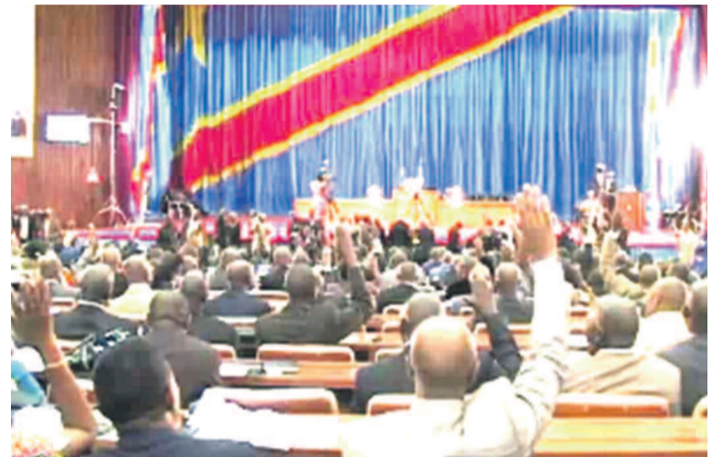
L'Assemblée nationale en plénière

L'Assemblée nationale a la lourde responsabilité de lever des options au temps opportun sur les outils importants et déterminants qui doivent orienter le travail de l'organisme de gestion des élections en RDC.