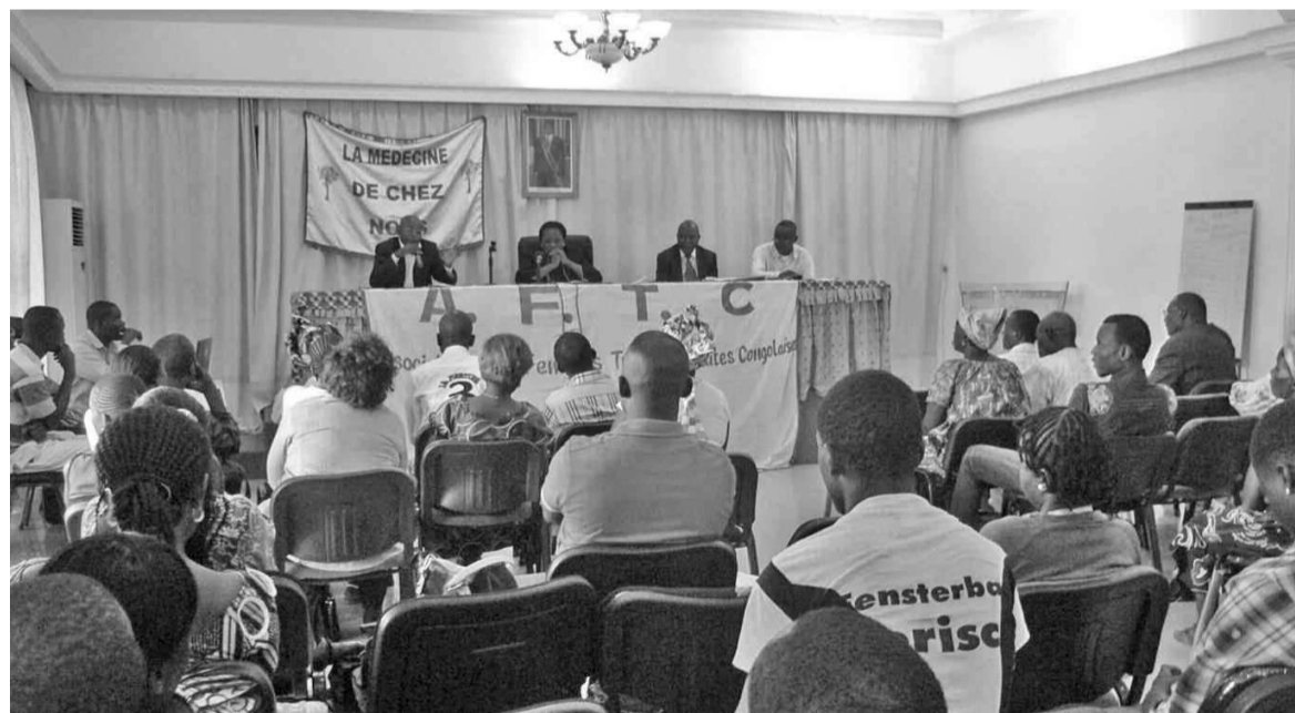
Les participants à l'assemblée générale.