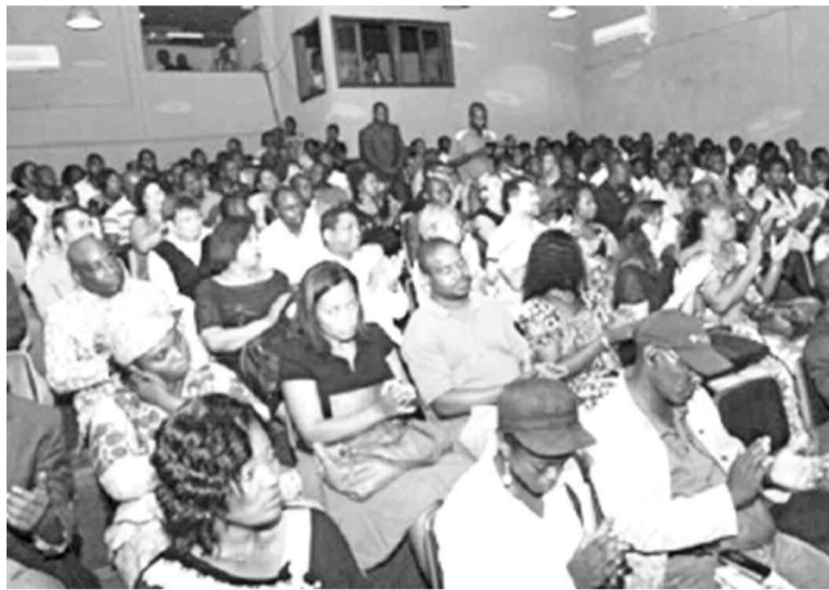
Une vue partielle du public lors du concert de INA-Vijana

L'entrée en matière, un aveu patriotique, ne pouvait être mieux exprimé que par Congo avenir. Interprété par une voix féminine, le désormais très célèbre air de feu Tabu Ley n'a pas manqué de faire effet sur le public cette fois encore. La version offerte, un extrait de slam et un grand chœur féminin inclus, a rajouté une note plutôt agréable à l'œuvre qui n'en a été que plus appréciée. Nzinzi, rendu avec la complicité d'un chœur mixte a remis à vif le souvenir du King Kester porté en terre presque deux semaines plus tôt. Budje d'Eddy Mboyo et Partage de Ray Lema ont