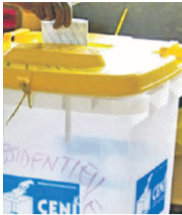
Les locales pointent à l'horizon

La deuxième phase comprend 10 provinces dont la ville province de Kinshasa. Comme au Bandundu, le travail consistera à la formation des préposés à la collecte puisés dans base des données de la CENI et à la dite collecte des données. La tâche s'annonce difficile dans les parties du pays où règne l'insécurité notamment au Nord-Katanga et au Kivu ainsi que dans certains territoires dits à problème. Le fichier électoral des locales dépendra énormément de l'opération de fiabilisation du fichier électoral et stabilisation des cartographies.