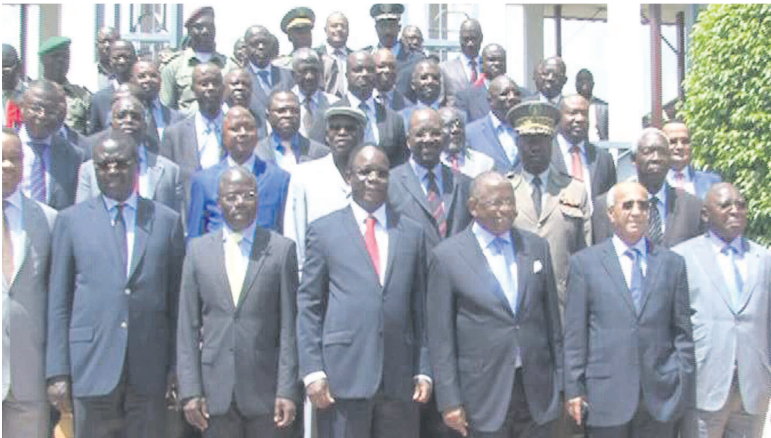
Les délégations ministérielles à la fin des travaux

Deux délégations ministérielles, du Congo et de l'Angola, réunies le 15 mars dans la province angolaise du Cabinda, se sont accordées sur le tracé de la frontière, reconnaissant unanimement l'appartenance du village de Pangui à la République du Congo.