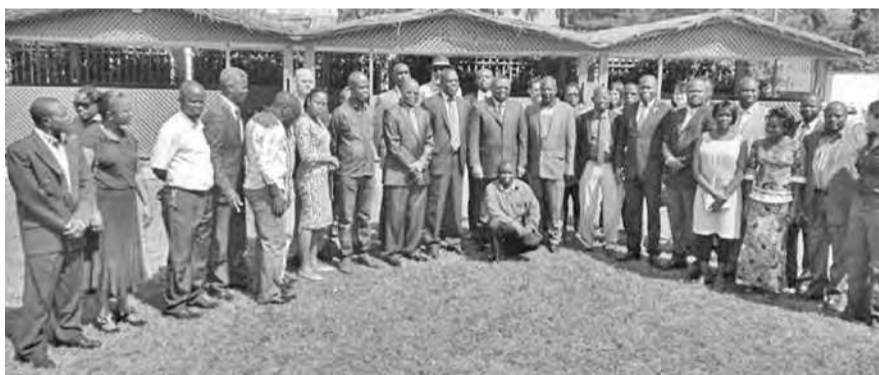
Les participants à la réunion et des ministres

L'atelier de restitution de la présentation de la Note d'idée du programme de réduction des émissions (ER-PIN) de la RDC à la neuvième réunion du Comité de participants du Fonds carbone tenue du 9 au 11 avril à Bruxelles, faite le 18 avril au restaurant Le Resto, à Kinshasa-Gombe, a permis aux participants de se rendre compte des efforts fournis pour permettre à la RDC d'être admise au Fonds carbone et d'avoir la même compréhension sur la démarche et les attentes. « La validation de sa note d'idée d'un programme de réduction des émissions par les partenaires au développement ouvre ainsi la voie à de futures compensations financières des efforts de la RDC pour contribuer à la lutte contre le changement climatique », a souligné la coordination nationale Redd (CN-Redd), dans un communiqué publié à cet effet. Ces travaux soutenus par le Fonds mondial de l'environnement (WWF) ont été une occasion pour les cent cinquante participants venus du gouvernement central et provincial du Bandundu, des ONG locales, nationales et internationales, du secteur privé et des partenaires au développement, de suivre la présentation de l'ER-PIN et la résolution du neuvième comité des participants du Fonds carbone, de discuter des étapes à suivre et d'élaborer une feuille de route préliminaire.