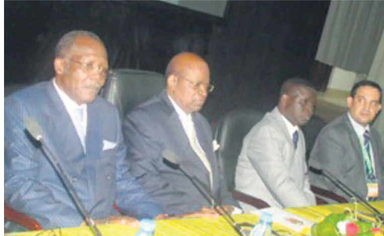
Les officiels à la clôture de la conférence

particulier a été mis sur sa partie scientifique qui a permis aux cadres congolais et étrangers de développer une dizaine de thématiques.