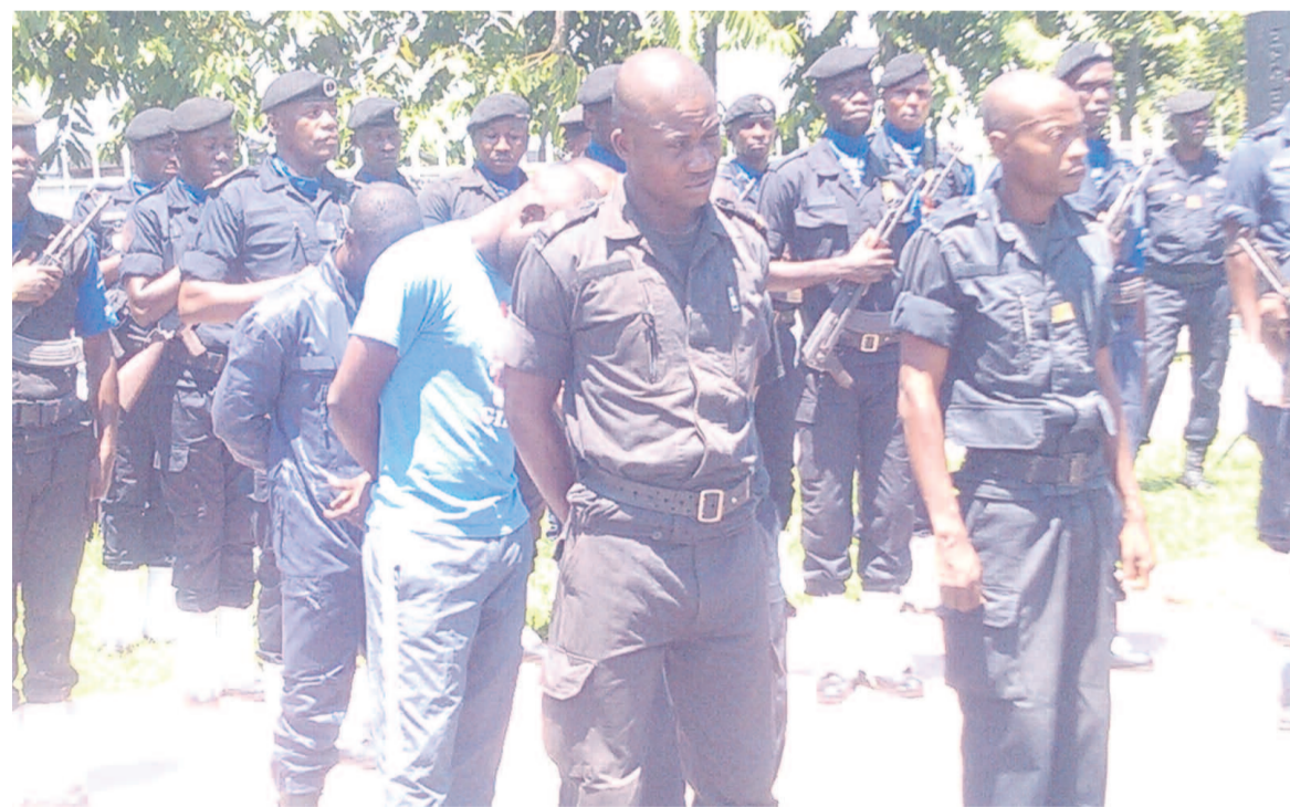
Ci-devant, un échantillon des agents radiés

Par décisions n°00417 ; 0629 et 0630 portant cassation et rétrogradation de la direction générale de la police, 17 sous-officiers ont été radiés des effectifs de la police nationale pour faute contre l'honneur et l'autorité morale de cette corporation. Ces agents, auteurs des pratiques négatives pendant le déroulement de l'Opération «Mbata ya