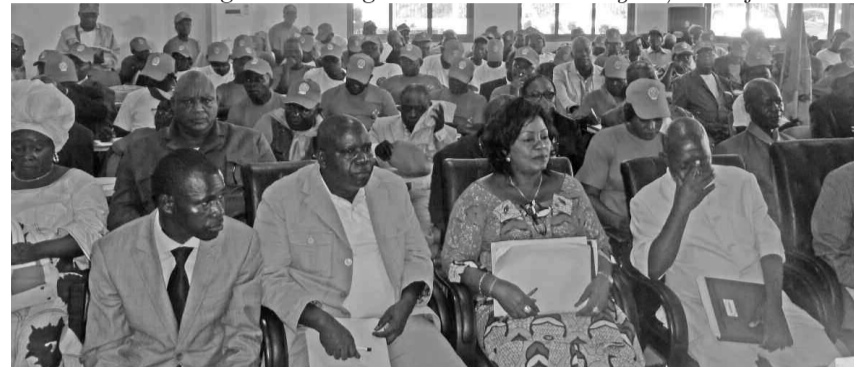
Une vue des militants du Pool

Auparavant, le président du PCT-Pool a rappelé les différentes activités entreprises par sa fédération au cours de l'année 2013. Entre autres, la participation aux congrès constitutifs des deux organisations affiliées au PCT : la Force montante congolaise et l'Organi-