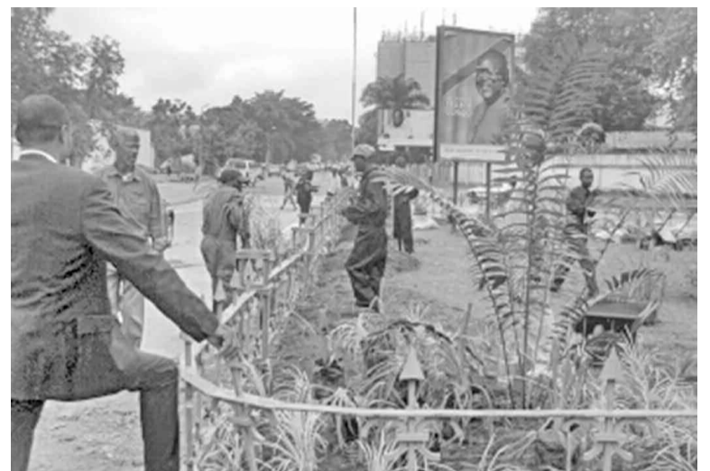
Aménagement de l'espace du monument La Pleureuse, en face de la Cour suprême de Justice des ferrailles parsemés ça et là le long des artères », a déploré l'exécutif urbain.

Plusieurs études ont, en effet, démontré que des véhicules qui utilisent le mazout dégagent des particules cancérigènes. Déjà, en son temps, le gouvernement provincial avait découragé ces cultures le long des artères. À cette époque, ces mesures ont expressément visé les abords du Boulevard Lumumba, à Limete, avant sa modernisation, ainsi que le long de l'avenue Kasa-Vubu, à côté du camp Kokolo, à Bandalungua. Mais il y avait également d'autres endroits où la population s'adonnait à la culture le long de la voirie. Comme le suivi avait fait défaut, cette décision avait eu l'effet d'une rumeur.