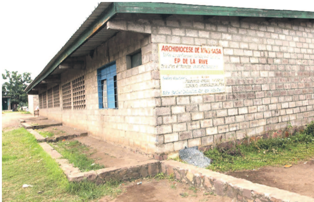
École primaire située à l'enceinte de l'hôpital de la Rive à Kinshasa