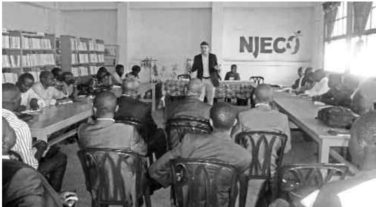
L'assistance de jeunes leaders du Congo.