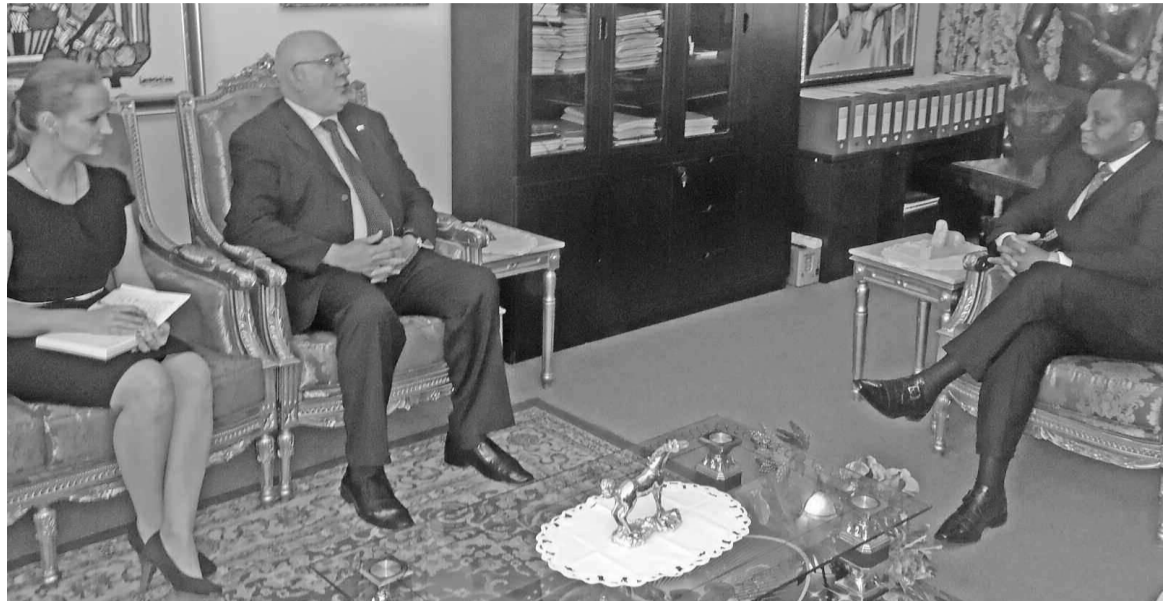
Le face à face entre le ministre de la Culture et des arts du Congo et le diplomate russe.