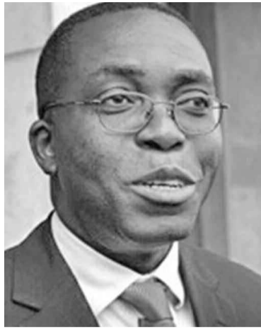
Le Premier ministre Matata Ponyo