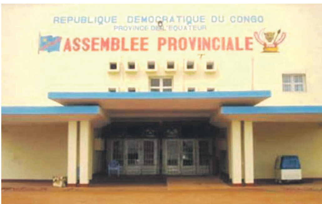
Assemblée provinciale de l'Équateur

Le gouvernement a suspendu toutes les activités de l'Assemblée provinciale de l'Équateur mardi à l'issue du dernier conseil des ministres. Le compte-rendu fait état d'une nouvelle crise en gestation au sein de cet organe délibérant et de l'exécutif de la province, sans en dire plus. Tout en brandissant des raisons liées au maintien de l'ordre public, le gouvernement pense maintenir sa décision d'application jusqu'à la clarification de la situation.