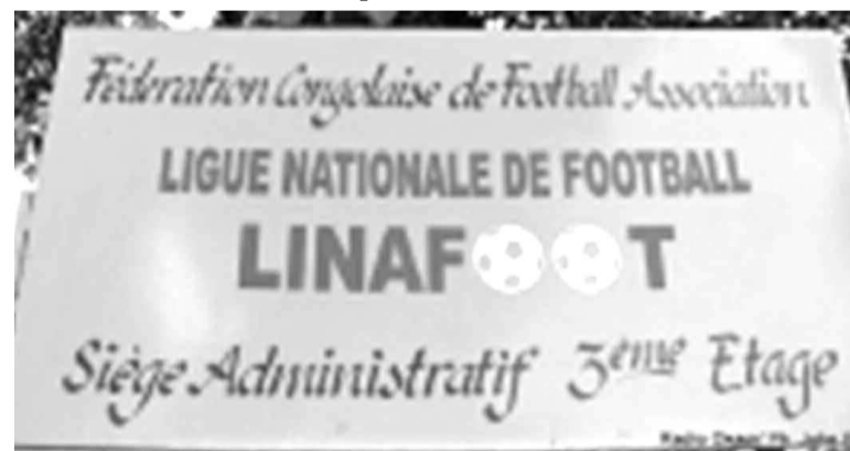
Panneau indiquant le siège de la Linafoot dans la commune de Gombé à Kinshasa.

Pour rappel, le classement du groupe A indique que Mazembe a terminé en tête (31 points, goal différence de +28), ayant la meilleure attaque (31 buts marqués) et la meilleure défense (3 buts encaissés). Don Bosco arrive à la deuxième place, avec le même nombre des points que Mazembe (31 points) mais avec un goal différence de +20. Le FC Saint-Éloi-Lupopo est troisième, avec 29 points,