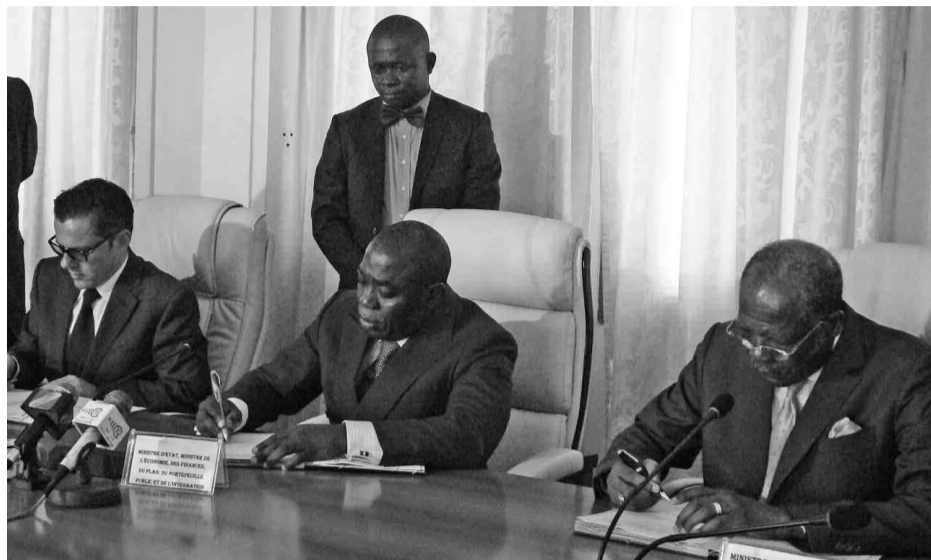
Les signataires de la convention de prise de participation de l'État.

Notons qu'Avima Fer exerce au Congo depuis le 2 août 2007 sous un autre nom. La société s'appellera désormais Avima Fer à la suite de la participation de l'État dans ses actions. « Notre partenaire a suggéré que nous augmentions la part de l'État dans ce projet. La question a été étudiée par nos experts en matière