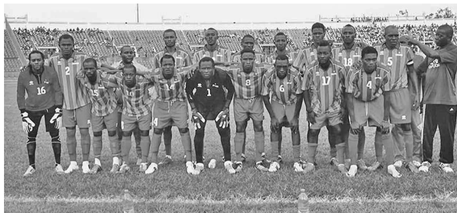
Étoile du Congo figure parmi les cinq premiers du championnat

Le match qui a plus marqué le public sportif est celui ayant opposé Patronage à V.Club au stade Alphonse-Massamba-Débat. Dès le premier quart de la rencontre, en effet, Patronage ouvrait la marque grâce à Sylver Nga-