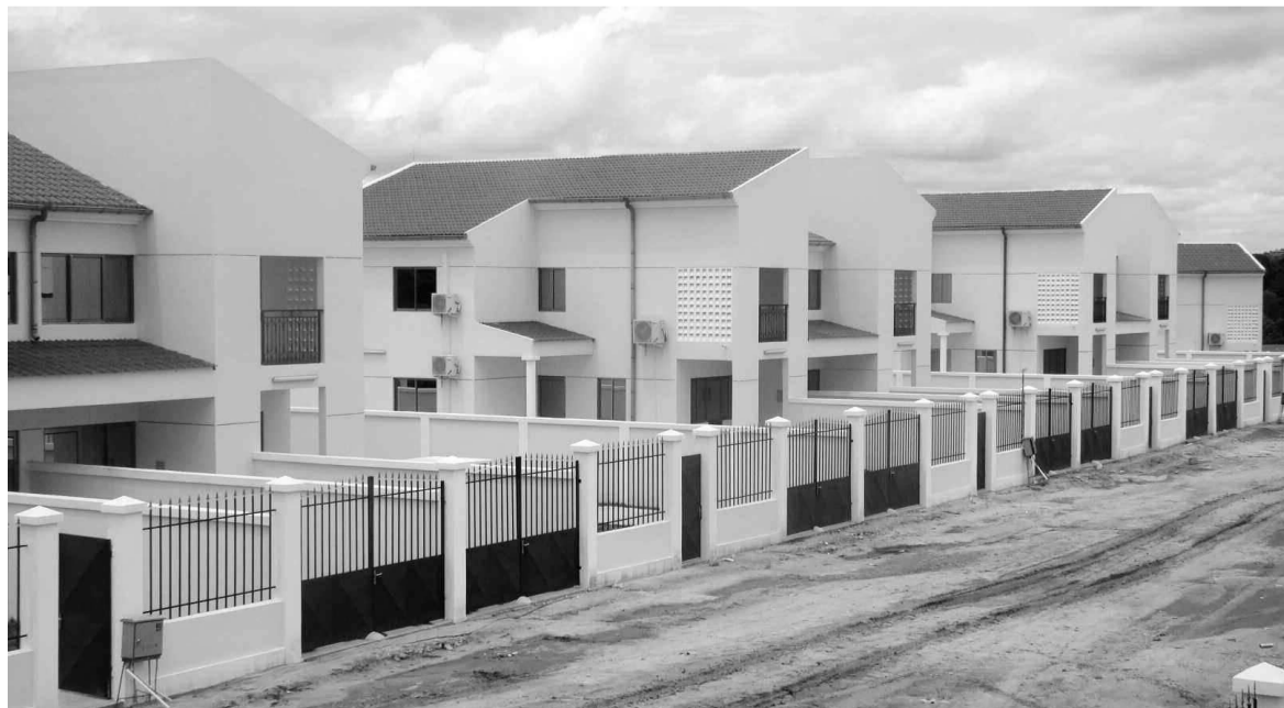
Des logements sociaux de type Saka-saka à Kinkala.