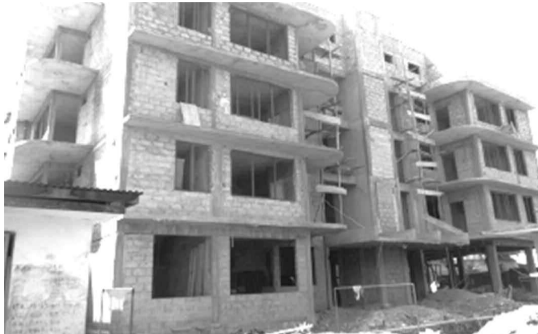
Un bâtiment en construction à Kinshasa, réalisé par des architectes congolais

Afrique du mois d'avril, la SAC dénonce une violation flagrante de la loi relative aux marchés publics et ses textes d'application, qui consacrent la libre concurrence comme principe élémentaire de passation des marchés publics. Cette structure voudrait, en effet, être fixée sur la modalité d'engagement des cabinets Atepa et Atelier 3, nonobstant le préfinancement consenti, qui ont présenté les projets d'architecture « KinTech 2020 » et « Kin Mic City », pour lesquels le gouvernement de la RDC, à travers la BM aurait mobilisé les fonds de développement. L'estimation établie à un milliard de dollars de réalisation est tirée de quelle étude de faisabilité préalable ? La mise en place des technopoles s'accroche à quelle réalité socioéconomique de la RDC, en général et de