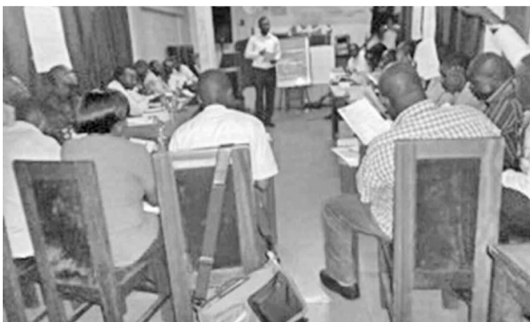
Les délégués des structures de protection des enfants de la rue pendant la formation