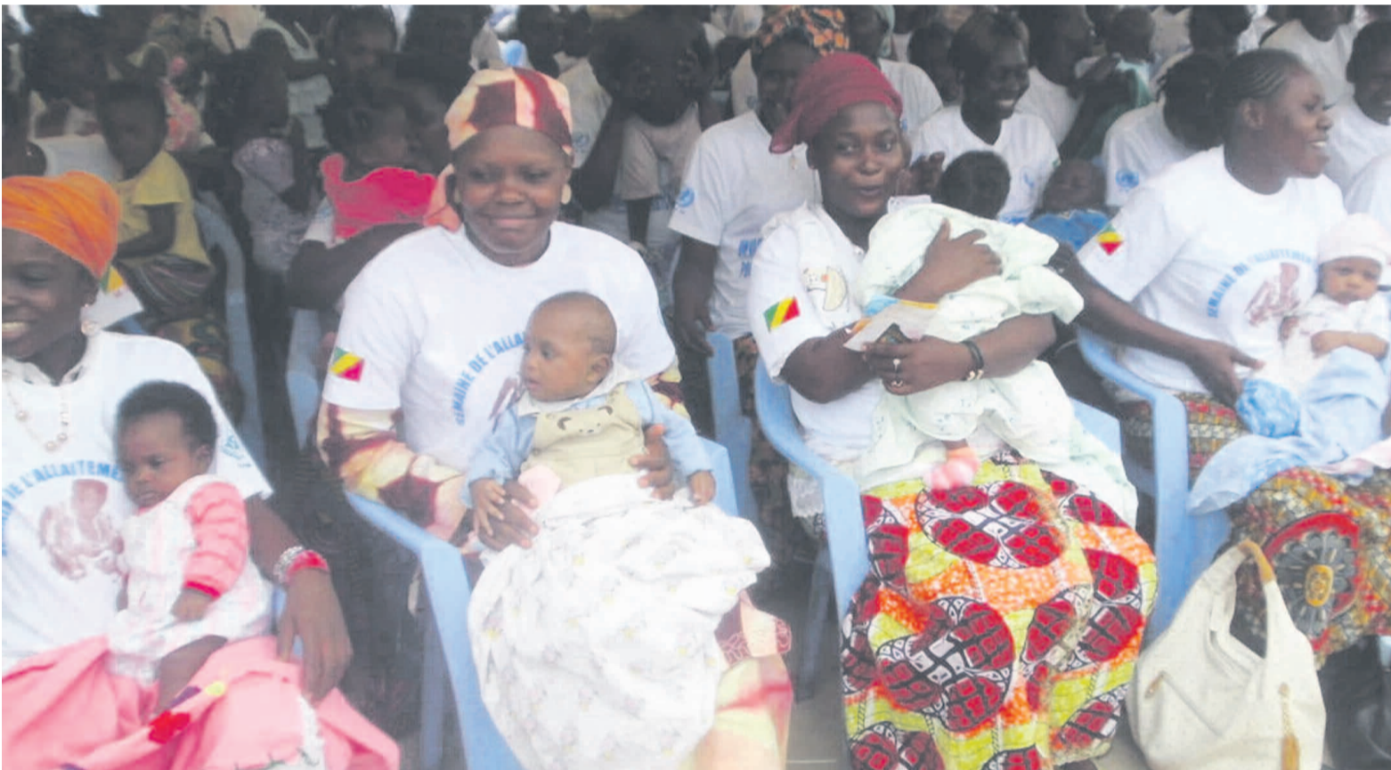
Des mamans et leurs tout-petits hier, lors du lancement de la vaccination à Brazzaville

En partenariat avec l'Unicef et l'Oms-Afro, le gouvernement a lancé hier la 4 e édition de la Semaine africaine de vaccination placée sur le thème «La vaccination, une responsabilité partagée».