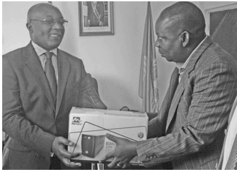
Le représentant de la CICOS remettant un échantillon de dons au DG de l'ANAC

Dans le cadre du projet Congo-Hyco pour une gestion durable de l'environnement, la Commission internationale du Bassin Congo-Oubangui-Sangha (Cicos) a apporté un appui substantiel à la direction nationale de la Météorologie et à l'Institut de recherche en sciences exactes et naturelles de la République du Congo.