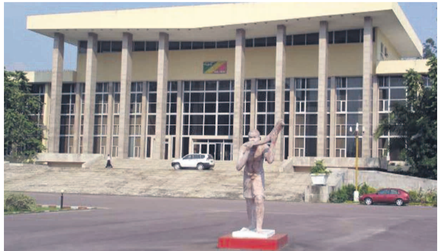
Le siège du palais des Congrès

Elle interdit le trafic des personnes et le passage clandestin des migrants, le trafic illégal des armes, des munitions, des explosifs et des matériaux nucléaires, biologiques, chimiques, radioactifs et toxiques, la contrefaçon de monnaie, de passeports, de visas et