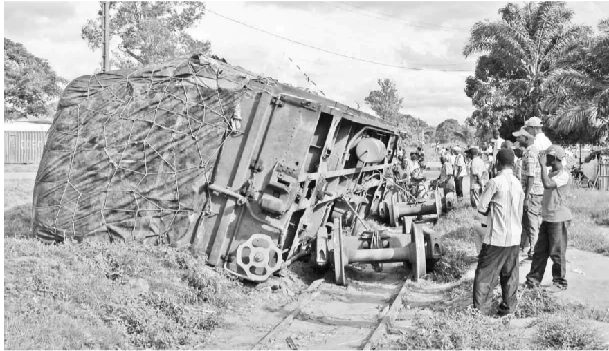
Les accidents de train sont assez fréquents en RDC dont le réseau ferroviaire date de l'époque coloniale

Plus les jours se sont égrenés, plus le bilan