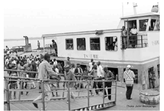
Débarquement des passagers d'un des navires faisant le trafic entre Kinshasa et Brazzaville

Cette ONG a, par ailleurs, exhorté les autorités du Congo/Brazzaville à « cesser immédiatement et sans délai toutes les expulsions des ressortissants de la RDC, ainsi qu'au respect de la dignité inhérente à la personne humaine et des instruments juridiques régionaux et internationaux en matière des droits humains ».