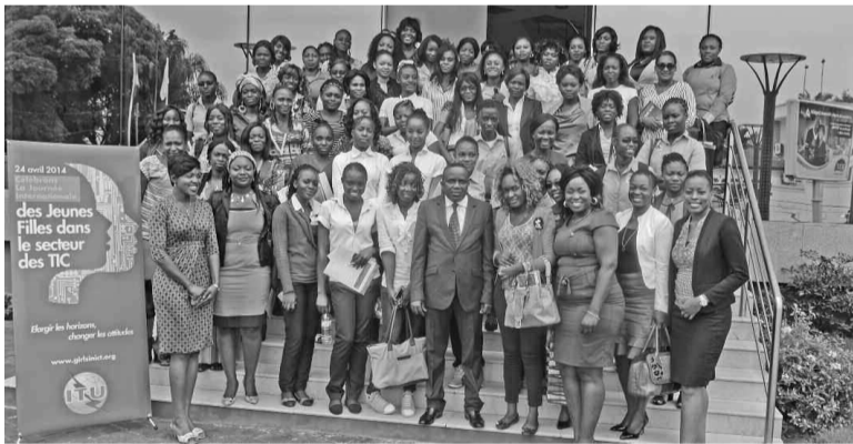
Photo de famille des participants

Cette invite en direction de la jeune fille congolaise s'est faite à l'occasion de la célébration, ce jeudi 24 avril, de la première édition au Congo de la Journée internationale des jeunes filles dans le secteur des Technologies de l'information et de la communication (TIC).