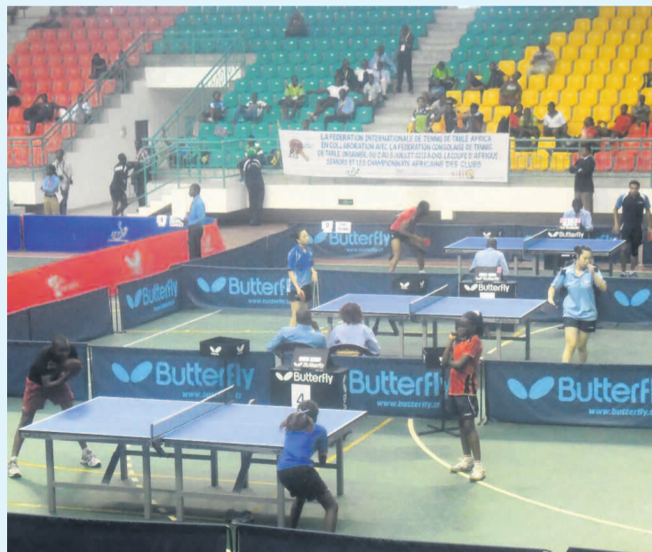
Une série de rencontres de tennis de table

Pour atteindre les objectifs fixés, la FCTT a retenu les cali-