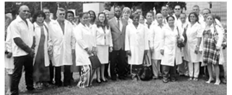
Le ministre entouré des médecins cubains.