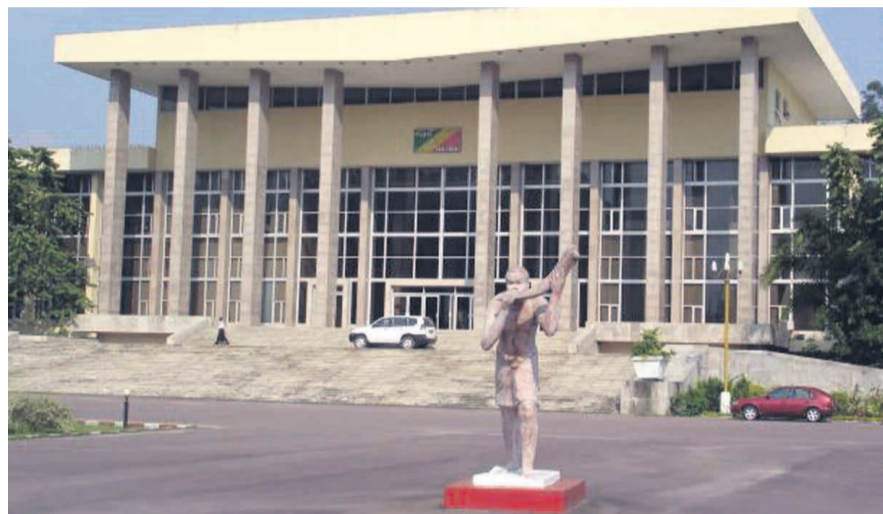
Le siège du palais des Congrès

Elle interdit le trafic des personnes et le passage clandestin des migrants, le trafic illégal des armes, des munitions, des explosifs et des matériaux nucléaires, biologiques, chimiques, radioactifs et toxiques, la contrefaçon de monnaie, de passeports, de visas et