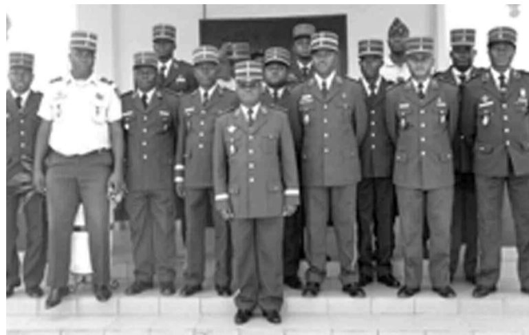
Les commandants d'unités et officiers d'état-major posant avec le colonel Placide Ngombé.

Organisée sous l'instruction du général de brigade Paul-Victor Moigny, commandant de la gendarmerie nationale, cette conférence, la première du genre au Kouilou, est