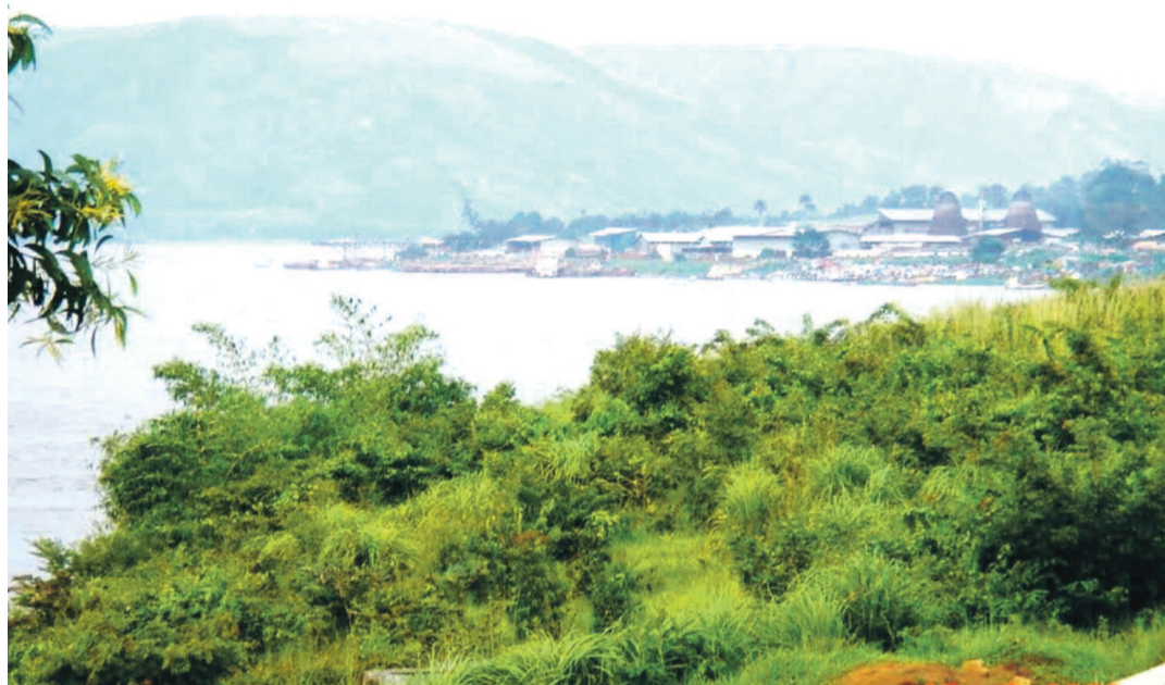
Vue lointaine du port de Maluku