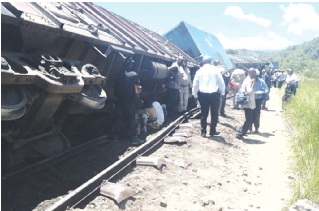
Les accidents de train sont très fréquents en RDC

Les chiffres avancés initialement faisaient état d'une cinquantaine de morts, ou précisément de cinquante-sept victimes, comme l'avait indiqué le ministre des Médias et porte-parole du gouvernement, Lambert Mende, au lendemain des faits. Le ministre de la Santé qui est arrivé sur les lieux du drame a dénombré quarante-huit victimes. À cela s'ajoutent cent soixante-deux blessés dont onze se trouvent dans un état critique. L'ONG des droits de l'Homme Justicia en a dénombré une centaine. Plusieurs sources concordantes tablent sur une quarantaine des victimes en plus d'une cinquantaine des blessés graves. Le bilan pourrait s'alourdir si l'on considère les corps enfouis sous les décombres en attente d'y être tirés. En attendant les mesures à prendre qu'aura à formuler l'équipe d'enquêteurs dépêchés sur place, des hypothèses sont émises pour expliquer les circonstances de cet accident ferroviaire.