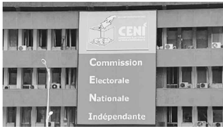
Le siège de la Céni, sur le Boulevard du 30 Juin