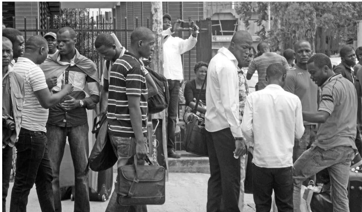
Les étudiants congolais à la sortie du Beach de Brazzaville

L'amplication et la distorsion que la presse kinoise a faites dans le traitement de l'opération "Mbata ya Bakolo" ont chauffé les esprits des populations de Kinshasa qui ont décidé de s'en