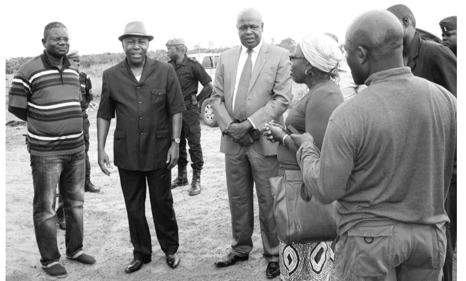
Les différentes parties sur le terrain