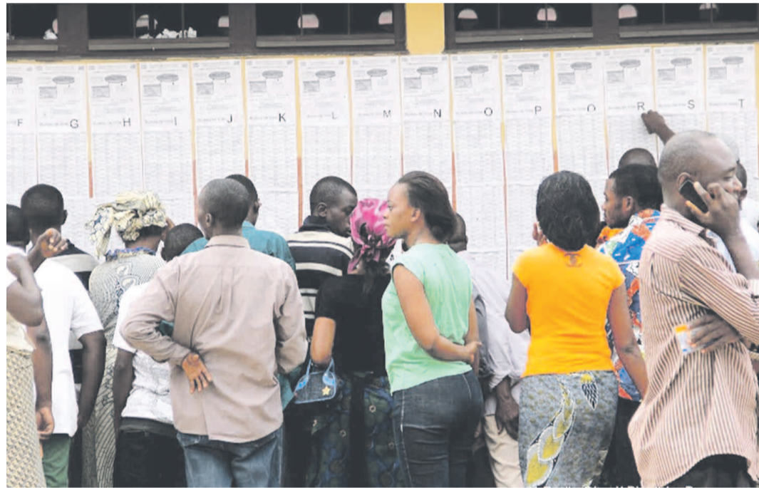
Des électeurs devant un bureau de vote à Kinshasa

L'on semble se diriger droit vers une répétition des événements qui ont favorisé la crise politique vécue après les élections de novembre 2011. À huit mois de la date envisagée dans la feuille de route de la Céni pour l'organisation des élections urbaines, municipales et locales, la situation semble avancer à pas de tortue. Ni le financement nécessaire aux différentes opérations prévues ni les lois attendues ne sont produits pour enclencher le processus.