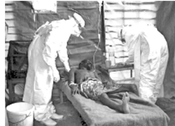
Prise en charge d'un malade de choléra