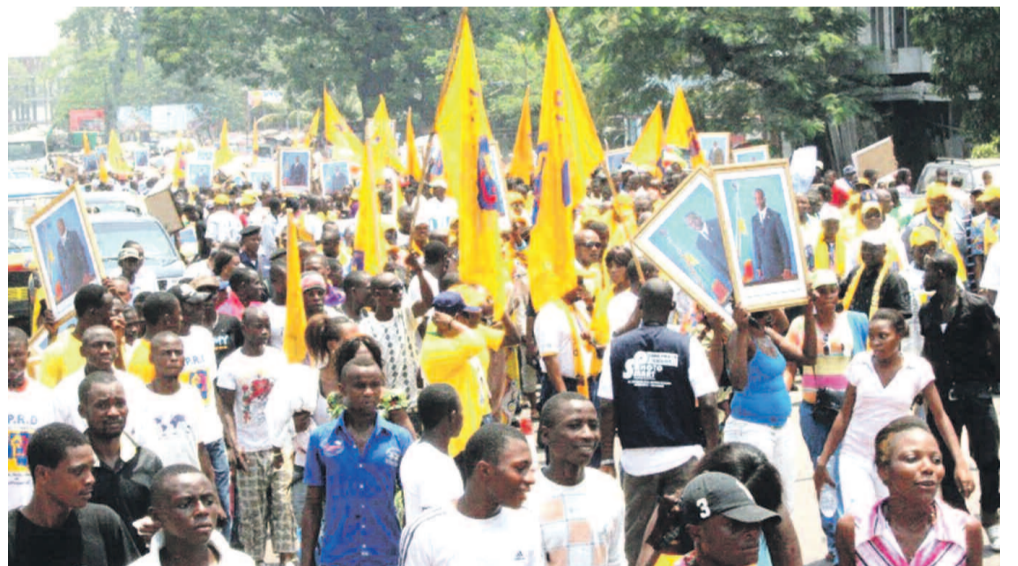
Une manifestation du PPRD, un des partis phares de la majorité présidentielle