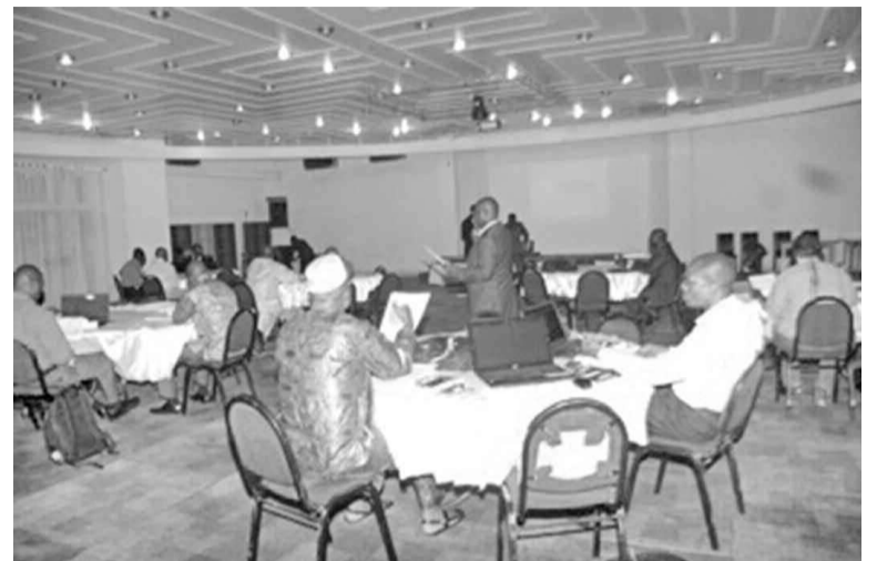
Un temps fort de l'harmonisation

L'atelier d'harmonisation de la maison des élections a regroupé les experts de la Céni et de l'unité électorale de la Monusco dans le but d'harmoniser les aspects pédagogiques et produire la note du facilitateur et de présenter, dans les contenus des modules de formation, les amendements tirés de recommandations de l'atelier d'évaluation à mi-parcours. Il avait entre autres objectifs de valider les différents programmes de formation élaborés