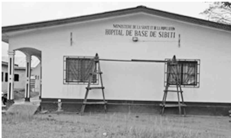
L'hôpital de base de Sibiti.