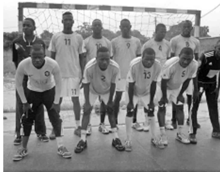
L'équipe de Patronage Sainte-Anne de Pointe-Noire.

Les joueurs du club ponténégrin se préparent à Brazzaville avant de rejoindre la ville d'Oyo, à plus de 400 km de Brazzaville (département de la Cuvette), où aura lieu la trentième édition de la Coupe des vainqueurs de coupes prévue du 20 au 29 mai.