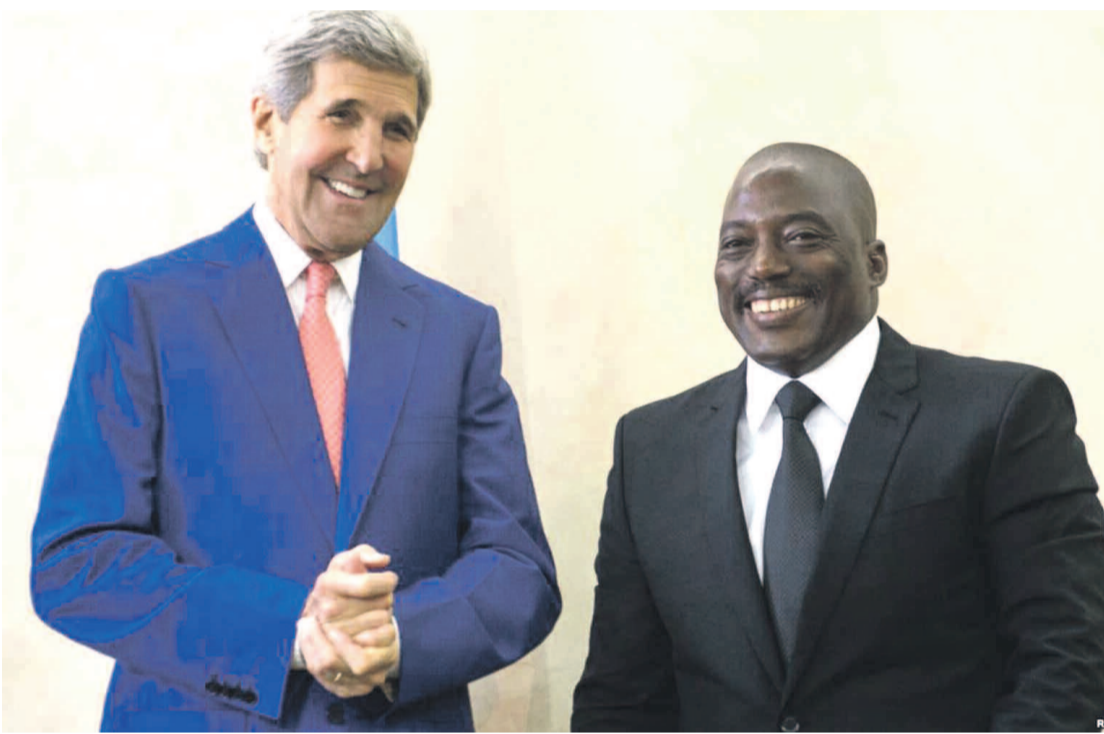
Joseph Kabila et John Kerry