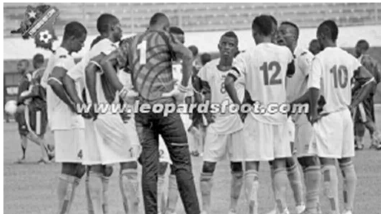
Les Léopards U20 en 2012 à Yaoundé (image d'archives - photo Léopardsfoot.com)

Sur les vingt et un Léopards juniors convoqués par la Fédération congolaise de football associations (Fécofa), six joueurs évoluent en Europe. Six autres sont pensionnaires du CS Don Bosco de Lubumbashi, trois de Mazembe, deux de l'AJ Jogari de Kinshasa, un de Shark, un de Dragons, un de Shark XI FC, un autre de Rojolu et un dernier dont le club n'est pas spécifié.