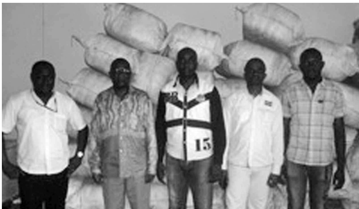
Les membres de la JCI-Congo devant les colis de moustiquaires imprégnées d'insecticide.

Le paludisme demeure un problème de santé publique compte tenu des nombreux décès enregistrés chaque année dans le pays. La JCI-Congo en a fait l'une de ses priorités afin d'accompagner le gouvernement congolais dans la lourde tâche de lutter contre cette maladie mortelle.