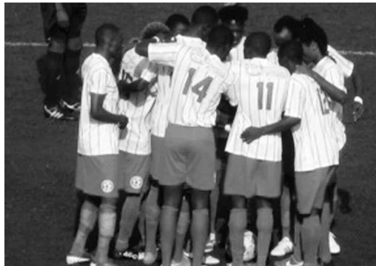
L'AS Cheminots lors du match contre Cara.

À la reprise, les Cheminots se sont mis en confiance avant d'enfoncer le clou à la 70e sur le coup-franc de Patrick Gaty qui inscrit le troisième but de l'AS Cheminots, mettant son équipe à l'abri du danger. Du côté des Aiglons, tout était encore possible car, à la 82e minute, Cara a réduit le score à 3-2. Les Brazzavillois ont poussé en-