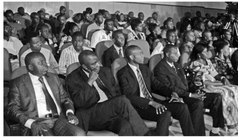
Des professionnels des médias.