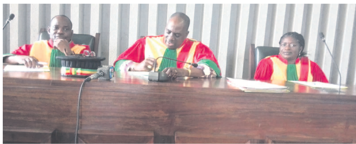
La CCAS mettant en délibéré les quatre affaires