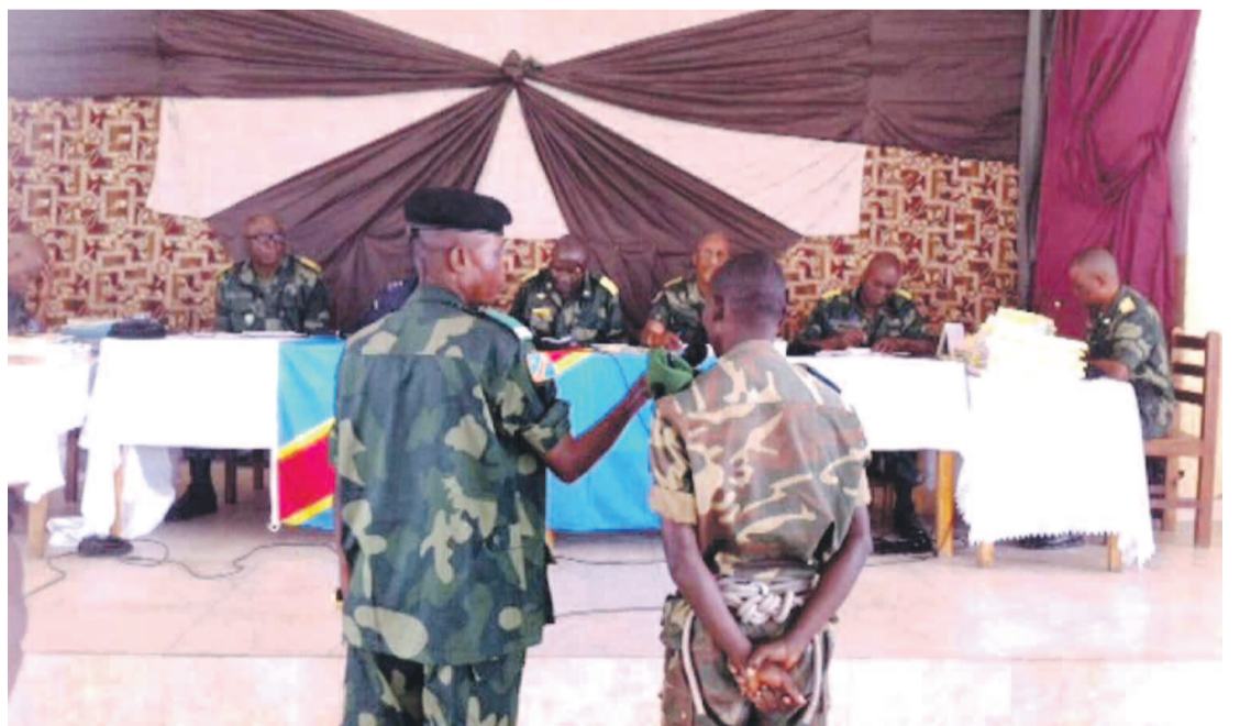
Une séquence du procès à Goma