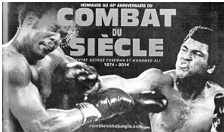
L'affiche de présentation de l'Hommage au 40e anniversaire du Combat du siècle