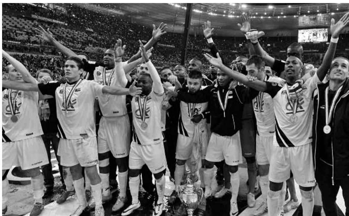
La joie de Guingampaise au stade-de-France