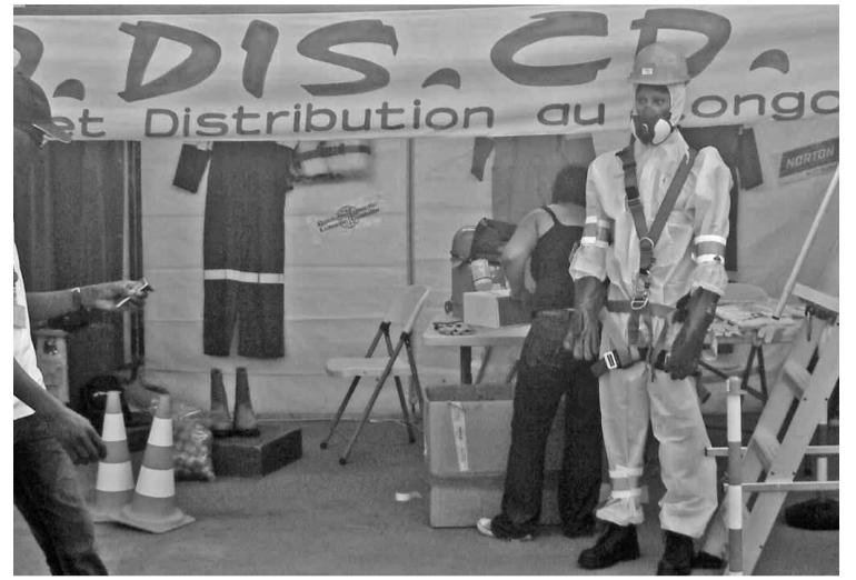
Une vue du stand de CODISCO

Se félicitant de l'affluence constatée dans son stand, elle a ajouté