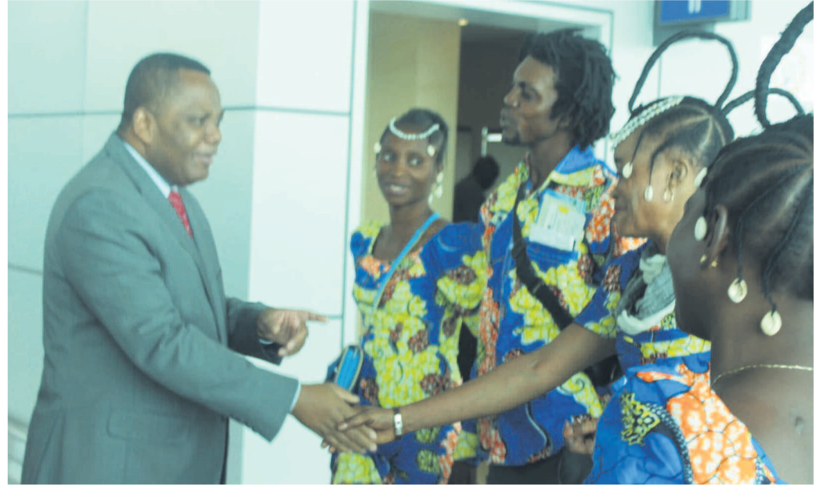
Le ministre saluant les artistes

tistes congolais accompagnés de trois membres de la délégation ministérielle ne s'envolent pour Pékin, le ministre de la Culture et des Arts, Jean-Claude Gakosso, est venu personnellement à l'aéroport pour leur souhaiter un bon séjour en Chine et leur dire de défendre le drapeau congolais au cours du festival culturel chinois. «Défendez le symbole de la République. Je vous attends. Et surtout n'oubliez pas que vous allez avec l'onction du président de la Répu-