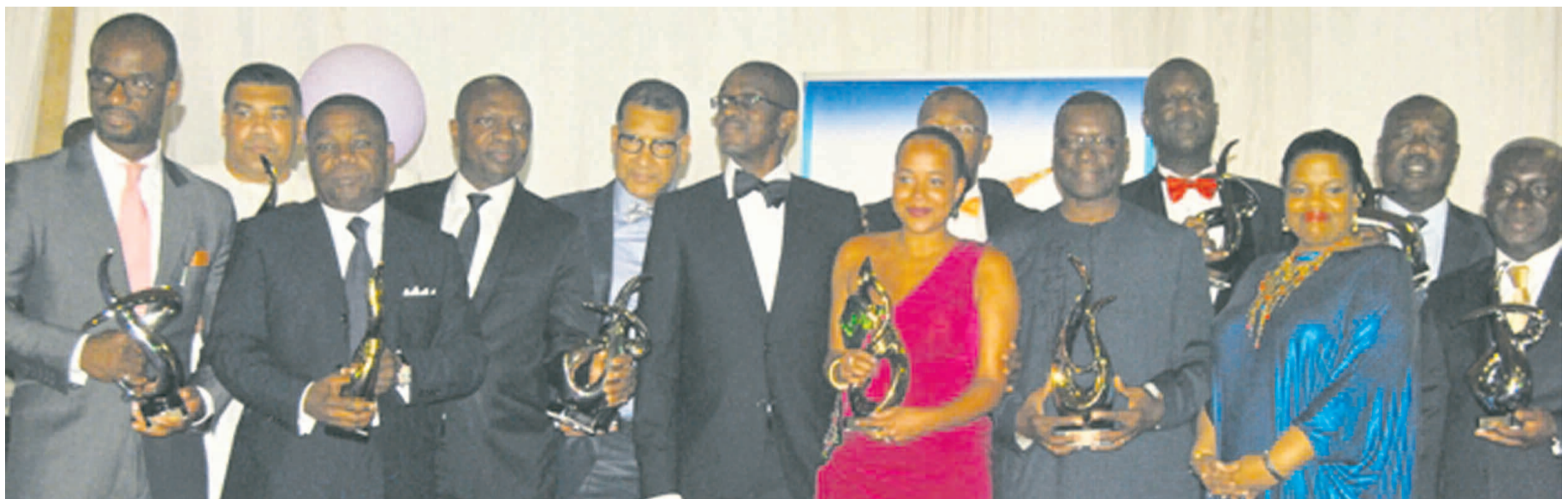
Les lauréats de la 5 e édition des Bâtisseurs de l'économie africaine

JMA : Le port autonome de Pointe-Noire est un pilier important de l'économie congolaise. D'année en année, des efforts sont faits pour qu'il soit davantage performant. Tenez, de 200 000 conteneurs par an, il y a encore quelques années nous passerons, dans trois ans, à 600 000 conteneurs. Cependant, nous ne dormons pas sur nos lauriers, puisque nous travaillons à l'aménagement des dessertes terrestres inter États et au développement des corridors, conformément au Népad, à la valorisation du transport multimodal. Nous associons à ces chantiers la création de plateformes logistiques et ports secs qui prolongent les quais vers l'Hinterland et rappo-