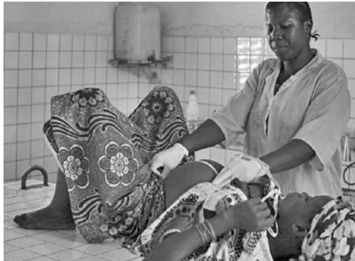
La sage femme contribue à la réduction de la mortalité maternelle