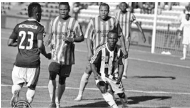
Vue du match Mazembe contre Sanga Balende (3-0)

Trois buts à brosse, c'est la gifle de Mazembe à Sanga Balende en guise de revanche après la défaite subie à Mbuji-Mayi à la troisième journée de play-off, la première déconfiture des Corbeaux du Katanga au 19e championnat national de football.