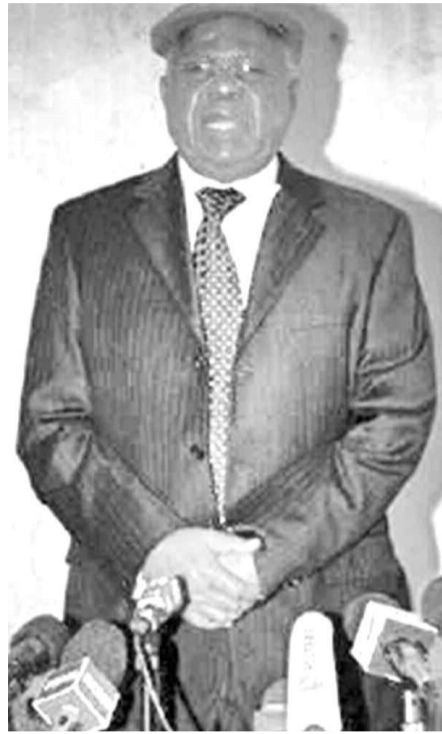
Étienne Tshisekedi wa Mulumba