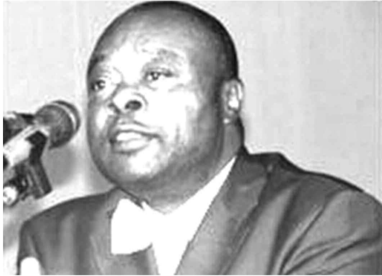
Le ministre des Sports, Baudouin Banza Mukalayi

Un rapport produit par une commission mise en place par le prési-