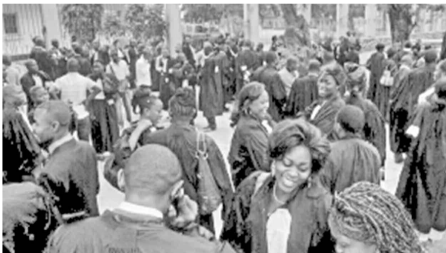
Des magistrats congolais lors d'une manifestation devant la primature

L'ONG a, en effet, rappelé que les députés nationaux ont examiné, le 6 mai, en débat général le projet de loi modifiant et complétant la loi organique N° 13/011-B du 11 avril 2013 portant organisation, fonctionnement et compétences des juridictions de l'ordre judiciaire en matière de répression des crimes de génocide, des crimes contre l'humanité et des crimes de guerre et le projet de loi modifiant et complétant la loi N° 23/2002 du 18 novembre 2002 portant Code de justice militaire.