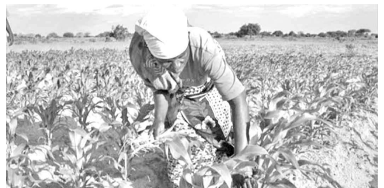
L'agriculture est essentielle dans la réduction de la pauvreté en Afrique

Stratégie axée sur la « chaîne de valeur » L'analyse du programme de semences de l'Agra, indique un communiqué de presse, montre que les réussites suivantes peuvent être attribuées à une stratégie axée sur le traitement des