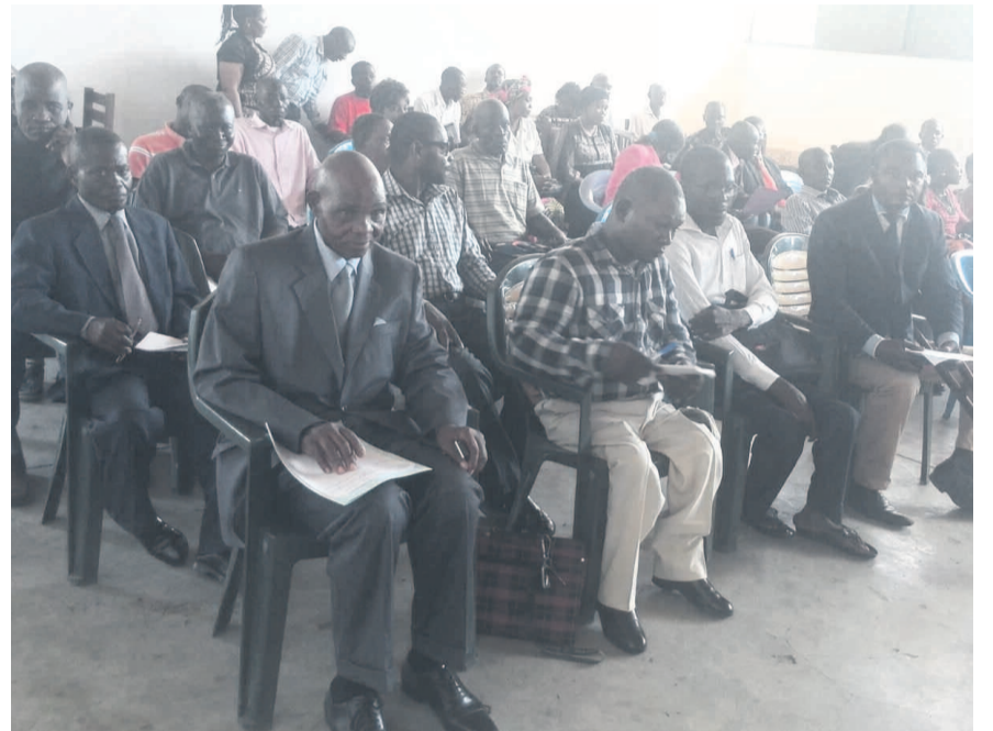
Les séminaristes