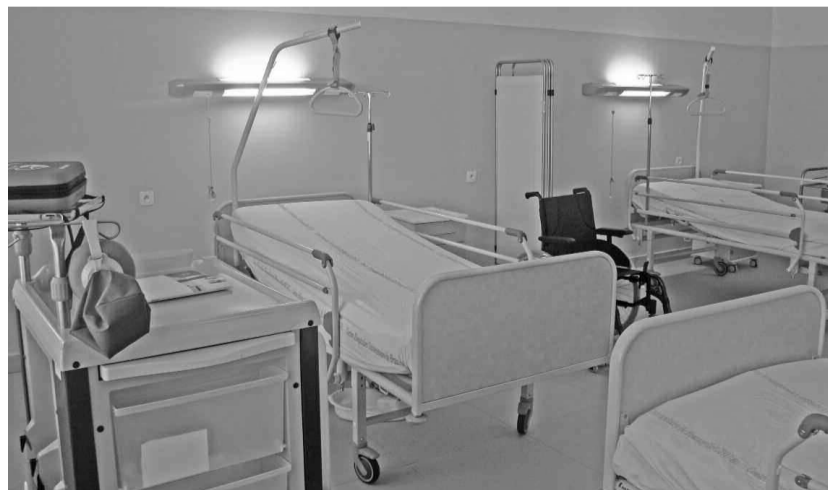
Une nouvelle salle d'hospitalisation