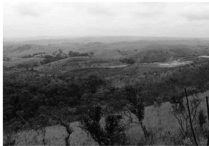
une vue du paysage dans le Pool