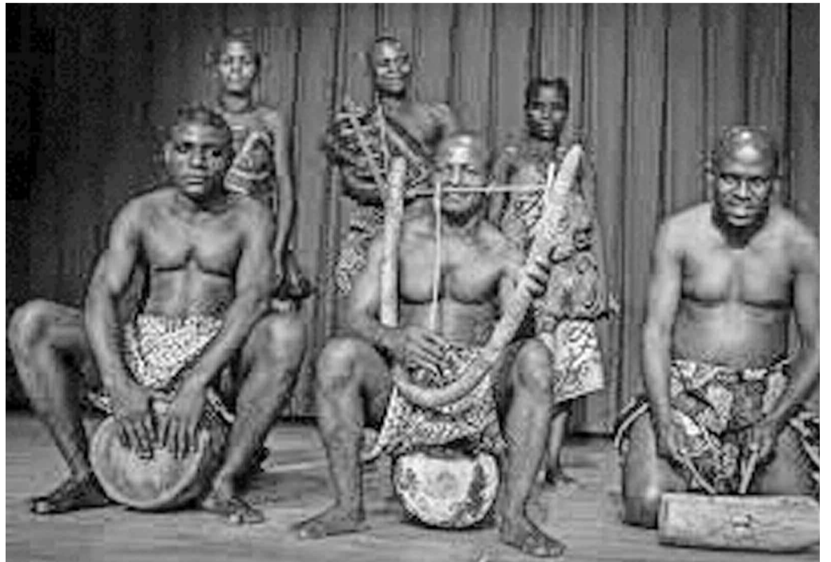
Le groupe Ndima composé d'autochtones

Ce groupe folklorique, composé essentiellement des artistes issus du milieu autochtone de la Likouala, a livré un spectacle à l'Institut français du Congo (IFC), le 7 mai, prélude à la prestation qu'il entend présenter lors de sa prochaine tournée européenne, prévue le 14 de ce mois.