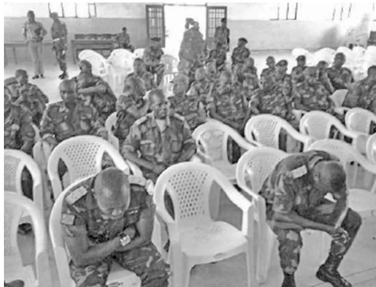
Les prévenus pendant le procès

Cette sentence a soulevé le tollé des organisations de la société civile locale et des différentes organisations des droits de l'Homme à l'instar de la Fédération internationale des droits de l'Homme (FIDH). Cette ONG a, dans un communiqué publié au lendemain du jugement, dénoncé une « justice expéditive et bâclée qui décourage davantage les victimes de crimes de violences sexuelles de porter plainte ». Tout en militant pour que les victimes de violences sexuelles obtiennent justice et réparation, l'association demande à la communauté internationale de repenser son soutien à la justice congolaise pour qu'elle devienne crédible