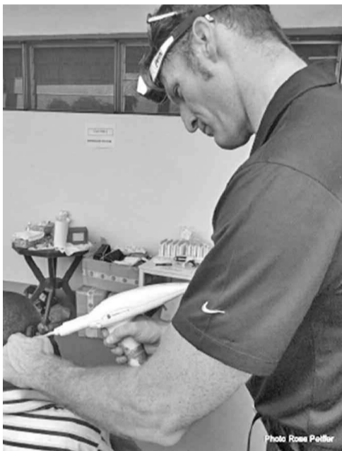
Traitement d'un patient par un médecin de l'équipe de la Starkey Hearing Foundation

Deux mille deux cents sourds et malentendants ont reçu du 7 au 8 mai à l'hôpital Biamba-Marie-Mutombo (HBMM), des soins gratuits. Pendant deux jours, les médecins de la Starkey Hearing Foundation ont diagnostiqué les problèmes des patients. Les infections ont été soignées aux antibiotiques alors que ceux qui ont présenté l'obligation du port d'implants auditifs ont été calibrés pour la fabrication des prothèses auditives aux États-Unis. Il s'agit notamment, pour cette dernière situation, des cas de surdité. « Chaque patient est soigné selon le problème diagnostiqué », a expliqué le chef du staff médical de l'HBMM.