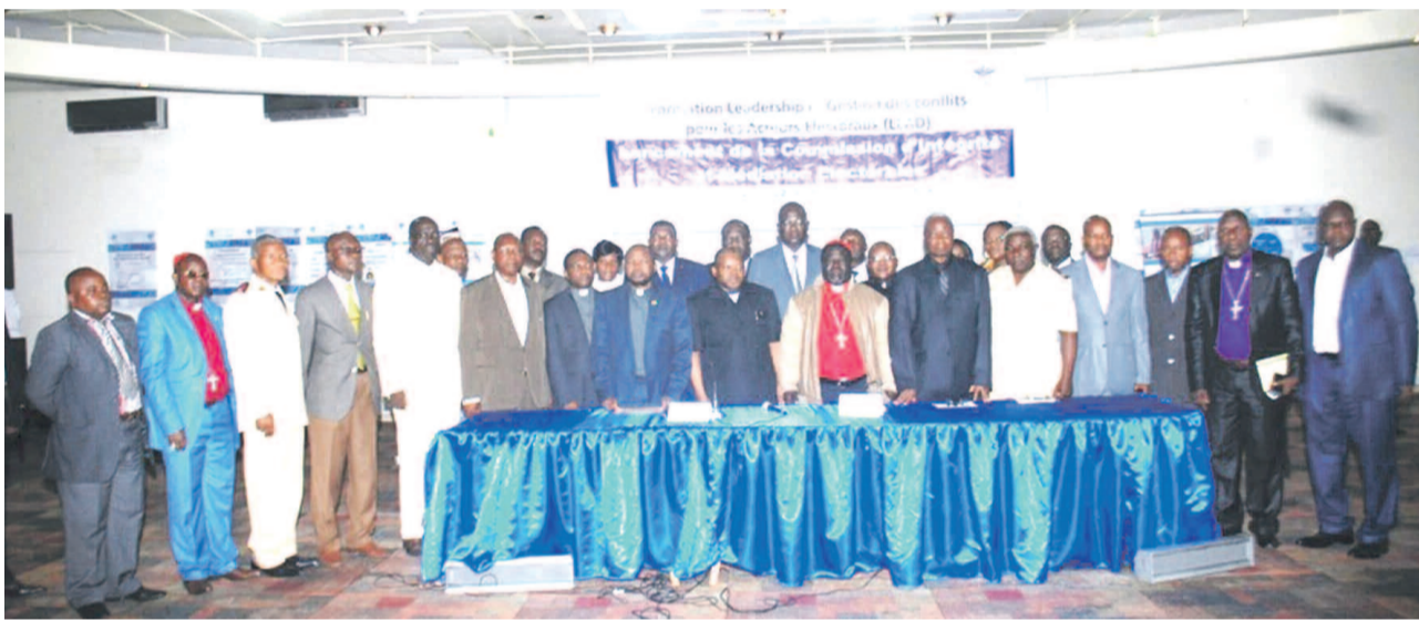
Photo de famille des membres de la Céli et de la Commission d'intégrité et de médiation

Les différents acteurs de la plate-forme des confessions religieuses ont bénéficié du 8 au 11 mai d'une formation en leadership et gestion des contentieux électoraux axée sur les techniques et pratiques de la médiation pour des élections crédibles, indépendantes, transparentes et honnêtes. L'objectif de cet atelier a consisté à doter les participants des outils nécessaires pour mener à bien leur mission. Initiative des confessions religieuses, cette structure est appelée à accompagner toutes les parties prenantes au processus électoral. Elle doit s'occuper du volet médiation électorale et faire triompher la vérité des urnes. La plate-forme des confessions religieuses entend contribuer à l'émergence d'un pays bâti sur des lois certes, mais en se basant sur les valeurs que prône la parole de Dieu, à savoir l'amour, la justice, la recherche de la paix, l'honnêteté, l'unité.