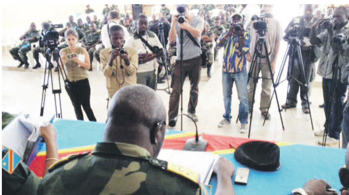
Le prononce du jugement sous le regard de la presse internationale

Au gouvernement, l'on estime que ni la FIDH encore moins les organisations internationales n'ont qualité pour juger la justice congolaise. Cette dernière « ne peut pas condamner des innocents pour faire plaisir aux associations des