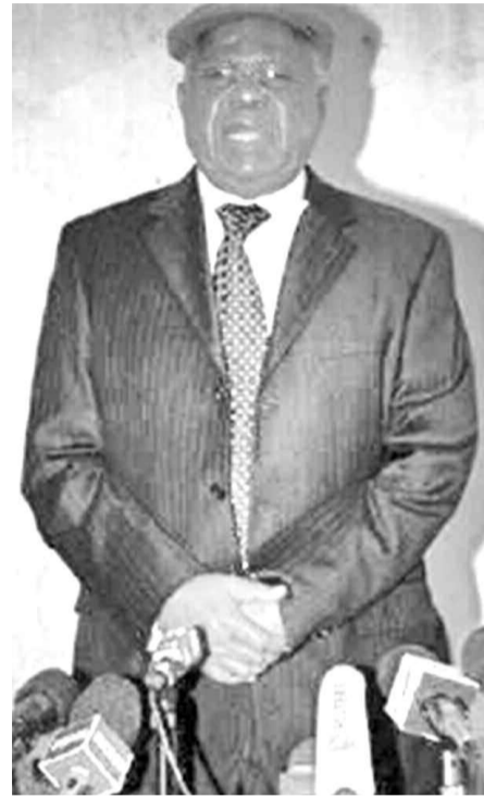
Étienne Tshisekedi wa Mulumba