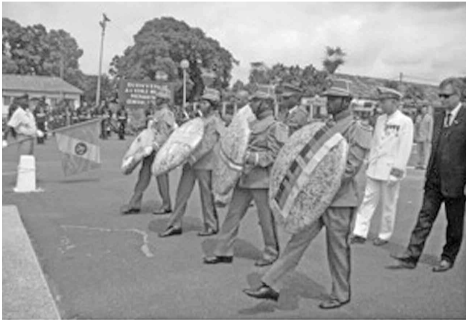
Dépôt des gerbes de fleurs