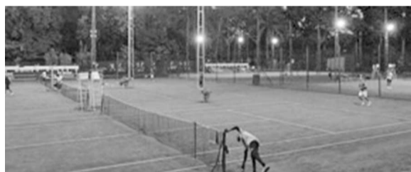
Match de tennis à Kinshasa

sponsors comme la Banque commerciale du Congo, du Cercle de Kinshasa, de la Société Soco, du Groupe Ledya, de la Bralima avec son produit Heineken, de l'Office de gestion et de fret multimodale (Ogefrem). D'autres sponsors sont en attente de confirmation comme Orange RDC et Congo Futur. L'on a appris que soixante-quatre tennismen sont attendus à ce premier Open des seniors masculins. Des athlètes viendront d'autres pays comme Momo du Gabon, de l'Ouganda, du Sénégal. Au pays, l'on notera la participation des joueurs de Kinshasa, du Katanga, de la province du Bas-Congo. Le secrétaire exécutif Tamise a parlé de la participation d'un jeune tennis-