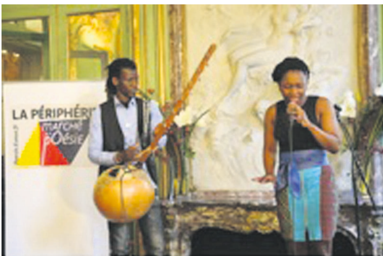
La chanteuse Helmi Bellini interprète une chanson.