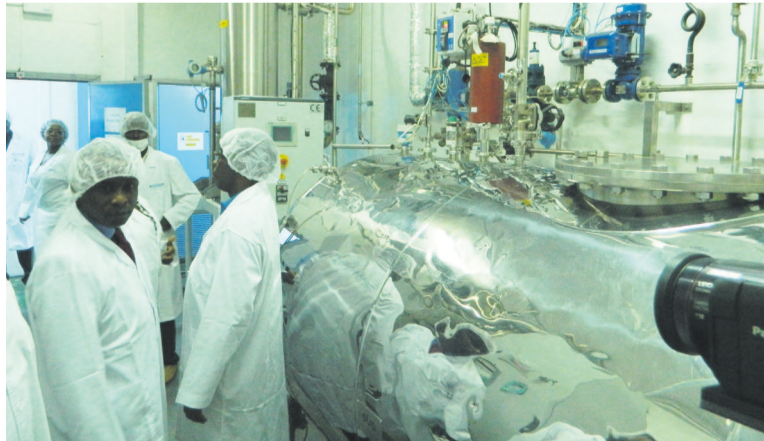
Les techniciens dans le laboratoire

D'une capacité de production de 16.000 poches par jour, avec un parc de machines pharmaceutiques de dernière génération employant des technologies très sophistiquées, le laboratoire Biocare a été implanté en 2012-2013 dans le but de répondre aux besoins des hôpitaux.