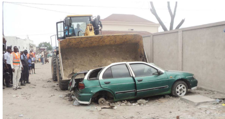
Destruction des épaves de véhicules à Brazzaville

L'objectif de cette opération est de nettoyer toutes les voies publiques de la ville capitale en vue de réaliser les travaux d'adduction d'eau exécutés par la société Sade. L'opération fait suite à l'appel lancé depuis le mois de mai dernier, par les responsables du ministère des Affaires foncières et du Domaine public, du