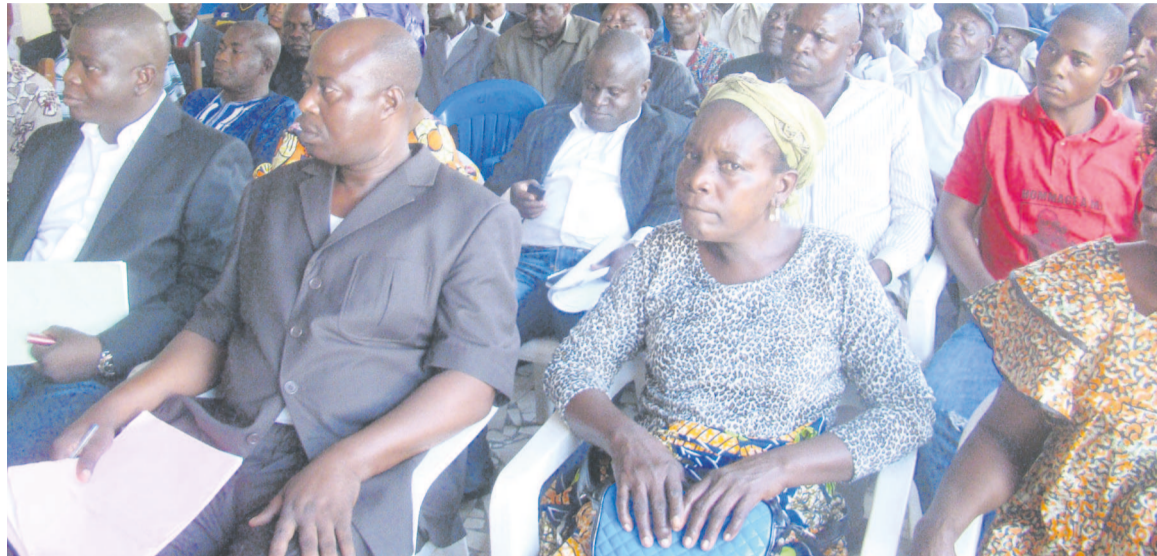
Les participants à l'assemblée générale de l'APT-Mfoa.

Réunis en assemblée générale le 31 mai à Nkombo, dans le 9 e arrondissement de Brazzaville, Djiri, les membres de l'Association des propriétaires terriens de Mfoa (APT-Mfoa) se sont engagés à garantir les transactions foncières entre les pouvoirs publics et les propriétaires terriens.