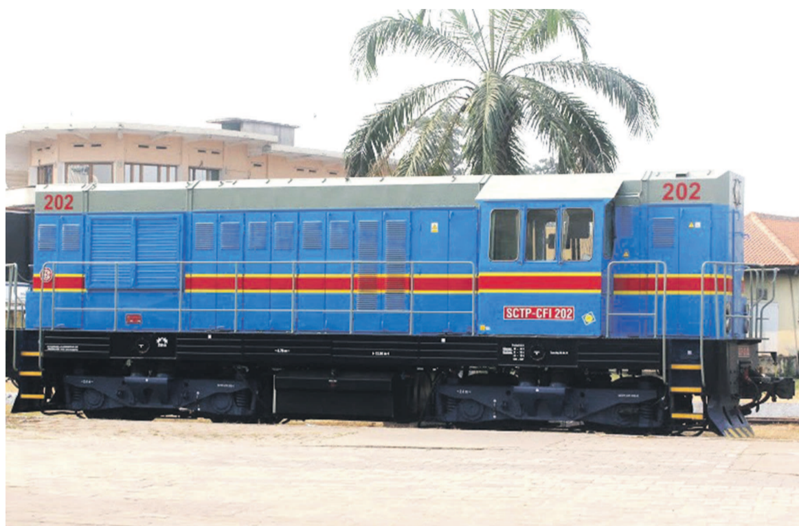
Une locomotive de la SNCC

Les autorités du Katanga ont tenu à mettre un accent particulier sur le lancement des travaux visant la sécurisation de la voie reliant Lubumbashi à Sakania. Il s'agit d'un tronçon stratégique estimé à quelque 230 km qui apportera un nouveau souffle au géant des transports. En effet, le gouverneur Moïse Katumbi a effectué en locomotive tout le trajet pour se rendre compte de l'effectivité des travaux qui touchent, il faut le rappeler, le cœur même de la province : les mines. Cependant le chemin de fer constitue le moyen le plus adapté de transport des produits miniers pour leur exportation, et la réhabilitation de la SNCC permet aussi de récupérer le transport des minerais. L'autorité provinciale a invité le personnel à soutenir les efforts en cours pour redresser la société commerciale qui bénéficie des financements de la Banque mondiale. Ces travaux visent à conforter la voie ferrée sur le tronçon Sakania-Baya à partir de la gare de Lumata. Page 12