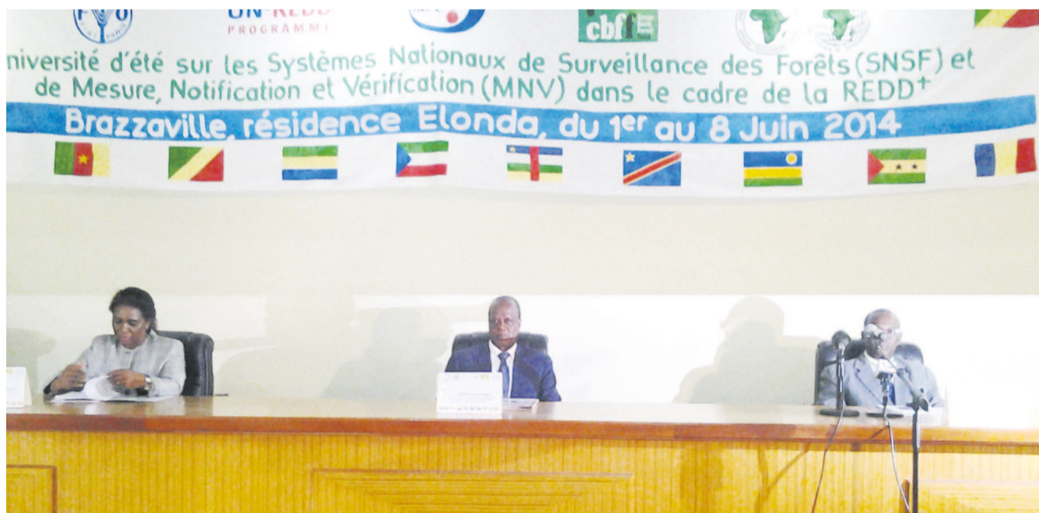
Au centre, le ministre Henri Djombo, lors du lancement de la formation

Venus des dix pays membres de la Commission des forêts d'Afrique centrale (Comifac), ils participent du 2 au 8 juin à Brazzaville, à une formation sur les systèmes nationaux de surveillance de forêts et de mesure,