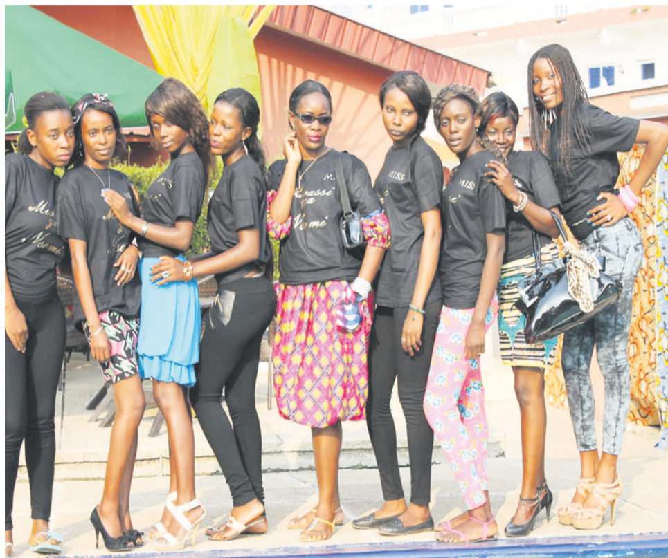
Les prétendantes Miss Mwasi ya Nsomi

L'événement, organisé par Fleur de Lys dans la ville océane, concerne toutes les belles filles, femmes élégantes et souriantes, de toutes tailles et âgées entre 18 et 40 ans.