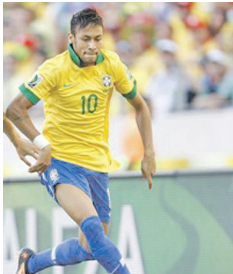
Auteur d'un doublé face aux Lions Indomptables, Neymar répond aux attentes placées en lui depuis le coup d'envoi de la compétition