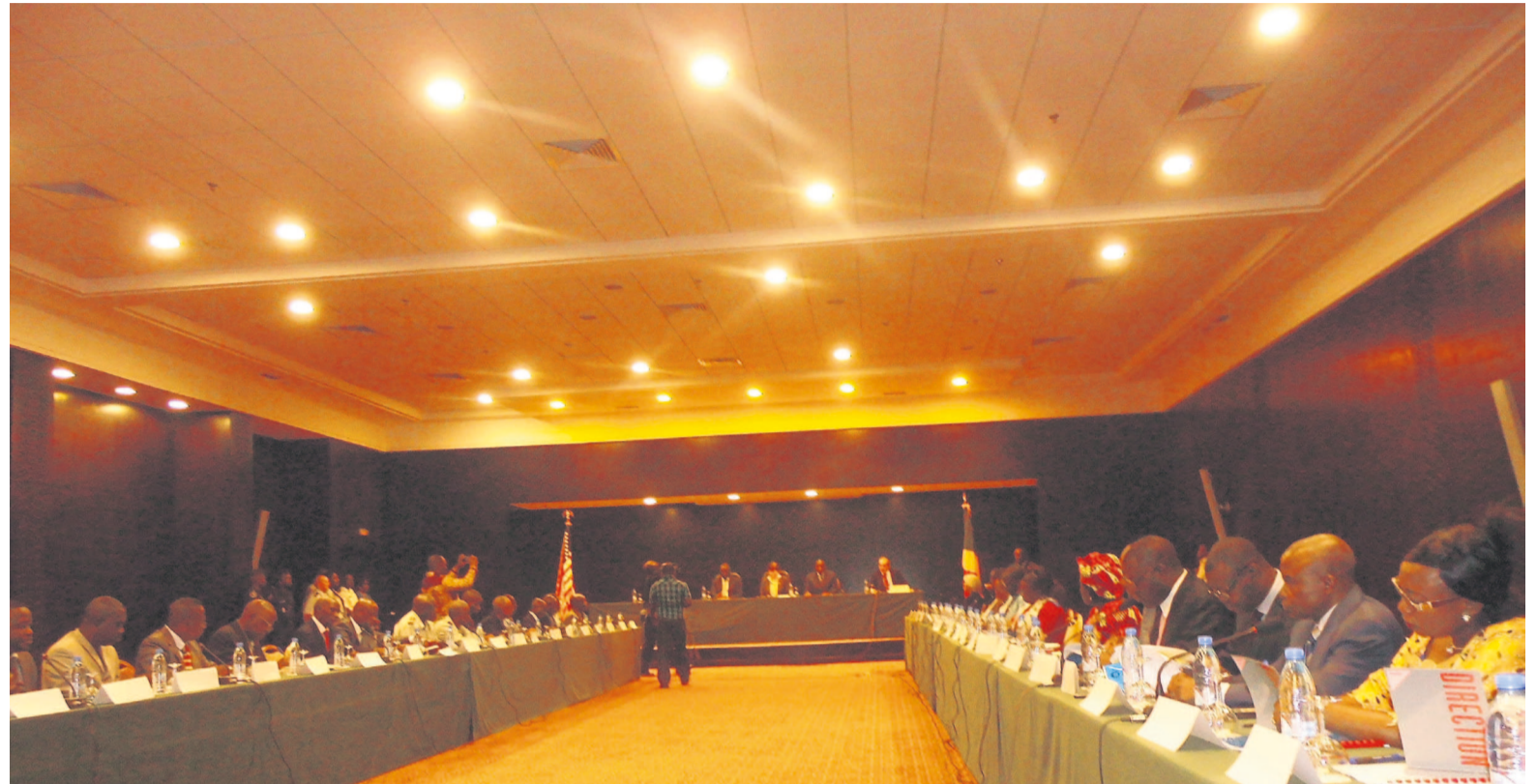
Les participants à l'atelier sur les relations entre les civils et les militaires.