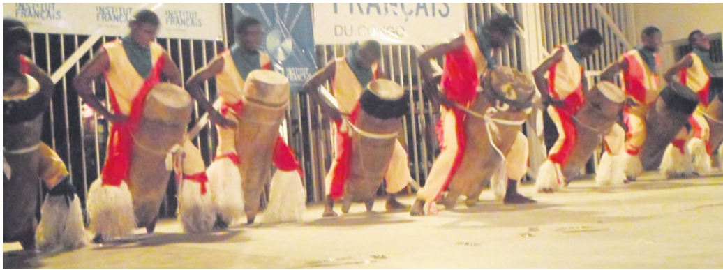
Un groupe tradi-moderne en plein spectacle à l'IFC

Si à l'IFC la fête s'est bien déroulée, cela n'a pas été le cas pour le Centre sportif de Makélékélé dans le premier arrondissement où, un méga-concert a été organisé par le Festival panafricain de musique (Fespam) en collaboration avec les Brasseries du Congo. L'erreur, s'il y a lieu de le dire, a été commise par ces deux partenaires en organisant un tel événement dans un endroit où avait déjà été planté