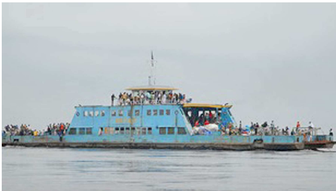
Un navire assurant la traversée entre Kinshasa et Brazzaville.

La Voix des sans voix pour les droits de l'homme (VSV) demande au gouvernement de mettre sur pied des mesures d'accompagnement à l'arrêté interministériel du 19 juin 2014, portant suspension de la multiplicité des taxes. Pour l'ONG, cette disposition constituera une garantie effective de l'impact de cette décision gouvernementale sur terrain au plan social et économique. La VSV a également exhorté le gouvernement à préconiser des sanctions sévères allant jusqu'à la révocation des contrevenants ainsi que d'autres agents et cadres de l'Etat habitués à s'enrichir illicitement sur le dos des opérateurs économiques et de la population. L'ONG a, par ailleurs, souligné que la multiplicité des taxes et les gravissimes tracasseries ainsi générées ont toujours entretenu en conséquence la flambée des prix des vivres dans les différents ports à l'intérieur du pays tout comme à Kinshasa et constituent la source non