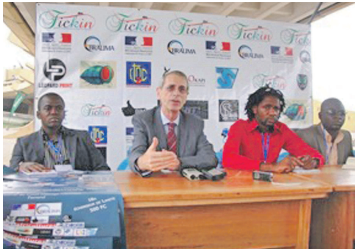
Les organisateurs du FICKIN pendant la conférence de presse