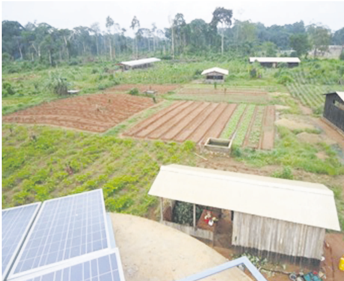
Le site du projet Bomoko

Situé à Ouesso dans le département de la Sangha, « Bomoko » repose sur la logique de l'histoire du développement, qui a prouvé que la meilleure manière de lutter contre la pauvreté est celle d'aider le pauvre à devenir pro-