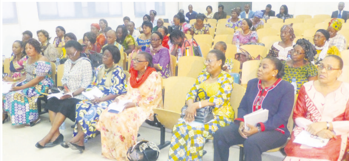
Des femmes à l'ouverture de la session de formation des candidates aux prochaines élections locales.

La présidente du Centre de promotion de la femme en politique, également ministre des Affaires sociales, Émilienne Raoul, a procédé le 24 juin à l'ouverture de la session de formation des femmes candidates aux prochaines élections locales.