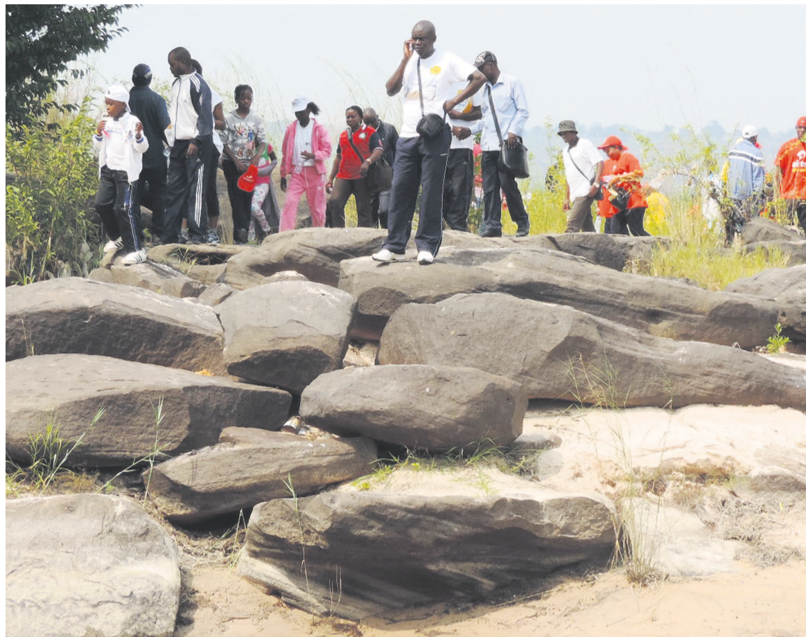
Le site accueille de nombreux visiteurs

Dans l'idée de poursuivre sa politique d'aménagement et d'animation de sites touristiques longtemps abandonnés, le gouvernement congolais a résolu de construire près des cataractes du Djoué, à Madibou dans le 8e arrondissement, un hôtel de classe internationale ainsi qu'un complexe touristique de haut niveau et une galerie d'objets d'art.