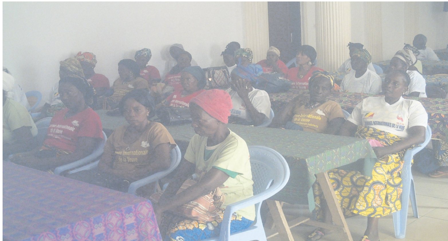
Des veuves présentes à Saint-Pierre-Cathédrale.

Des témoignages faits par les veuves, il ressort que ces dernières subissent des maltraitances pendant les veillées mortuaires sous forme de tortures morales et physiques, des humiliations de toutes sortes et des privations de droits fondamentaux. Des cotisations exorbitantes leur sont imposées pour les obsèques du conjoint décédé et ne peuvent aussi jouir des droits de succession et d'héritage tels la pension, le capital décès et les biens laissés par le défunt. Pour les représentants des affaires sociales, les problèmes de succes-