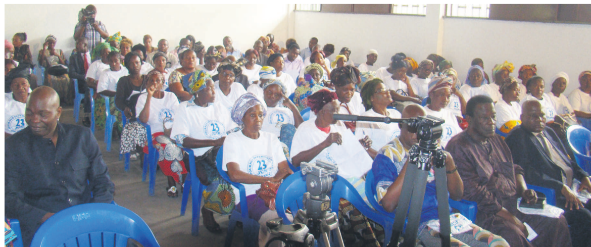
Les participants à la journée de sensibilisation

À l'occasion de la journée internationale des veuves, célébrée le 23 juin, le ministère des Affaires sociales et de l'action humanitaire a appelé le gouvernement à tout mettre en œuvre pour favoriser un plus grand accès des femmes à la pension de veuvage.