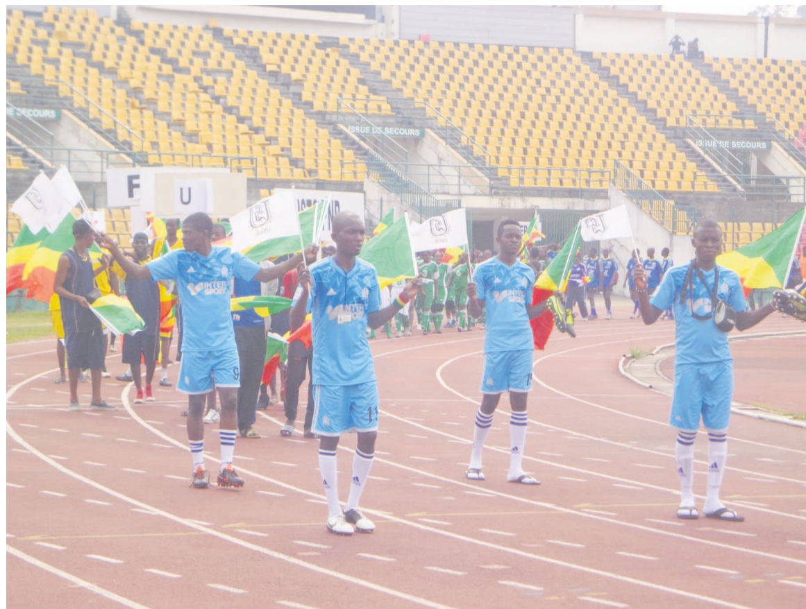
Les athlètes pendant le défilé

Pour cette deuxième édition, les équipes vont donc en découdre dans les disciplines comme le football, le handball, le basket-ball, le volley-ball, la gymnastique et l'athlétisme, dans les versions hommes et dames. La ville capitale, avec cinq