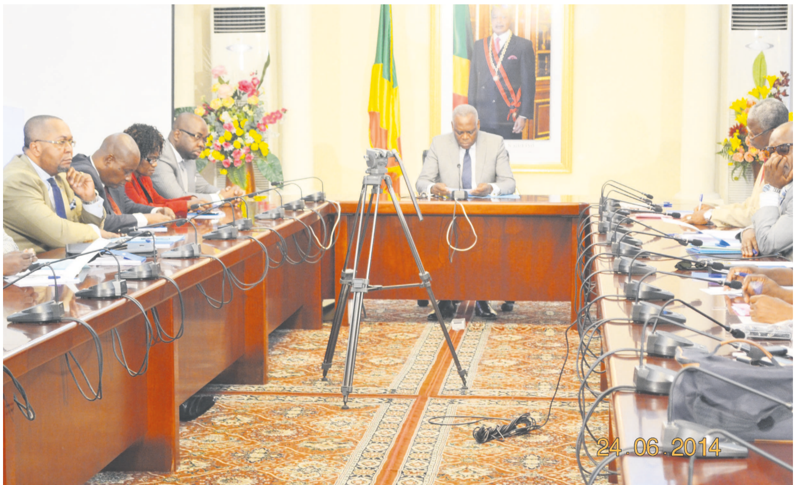
Lancement de l'atelier sur la propriété intellectuelle

Cet atelier de formation devra déboucher sur la création du réseau de compétences Fapi en République du Congo. « Je souhaite que les enseignements, les échanges et les débats qui auront lieu à l'occasion de la présente rencontre aboutissent à la formulation d'une approche concrète sur la mise en place du réseau de compétences du Fapi dans