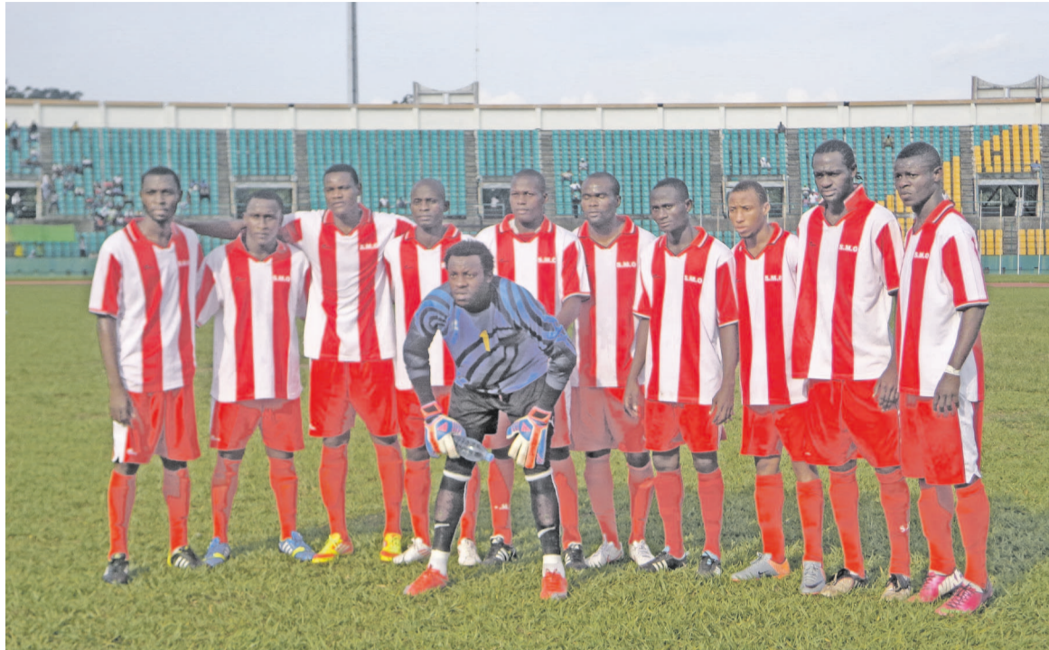
L'équipe de Saint-Michel de Ouenzé n'a pas fait le poids devant les Fauves du Niari.

Face à cette équipe, les Fauves du Niari se sont régalés comme s'ils affrontaient une équipe de troisième division. Score final de la rencontre : 4-1 en faveur des Léopards de Dolisie. Les Fauves du Niari aborderont la manche retour le 9 juillet à Dolisie avec un avantage psychologique conséquent pendant que le SMO tentera de sauver, pourquoi pas, sa réputation de l'équipe qui a déjà représenté le Congo sur l'échiquier continental à Dolisie. Depuis la finale du championnat national perdue par les Vert-et-Blanc en 2010, 2-3 face à SMO, l'AC Léopards de Dolisie n'a plus