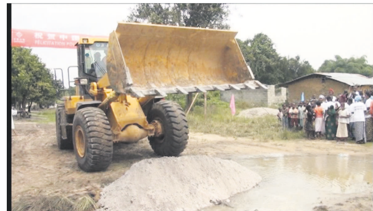
Le lancement des travaux

La population n'a pas manqué de manifester sa satisfaction.