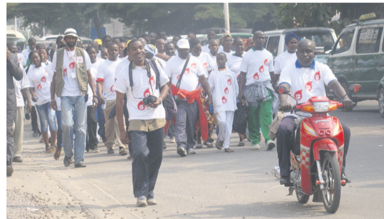
Une marche des donneurs de sang

techniques organisées, à l'occasion de cette journée, du 11 au 30 juin, comprenaient, entre autres, des collectes