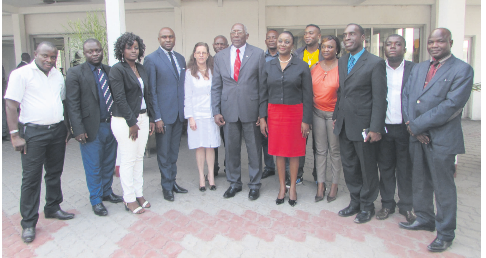
Photo de famille à l'issue de la visite du musée-galerie

quand il s'agit de la Salsa. Nous sommes partout dans le monde, mais l'origine se trouve ici en Afrique. La