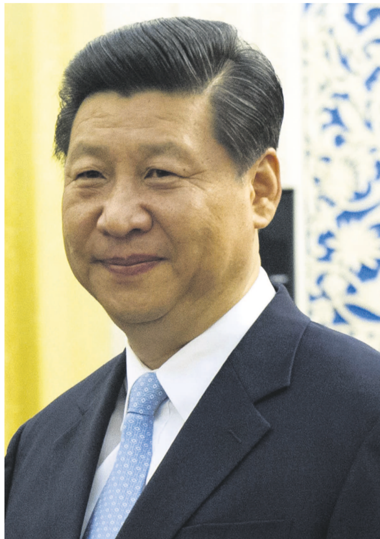
Le président Xi Jinping

Le président chinois a indiqué que ces principes étaient devenus les normes fondamentales régissant les relations internationales