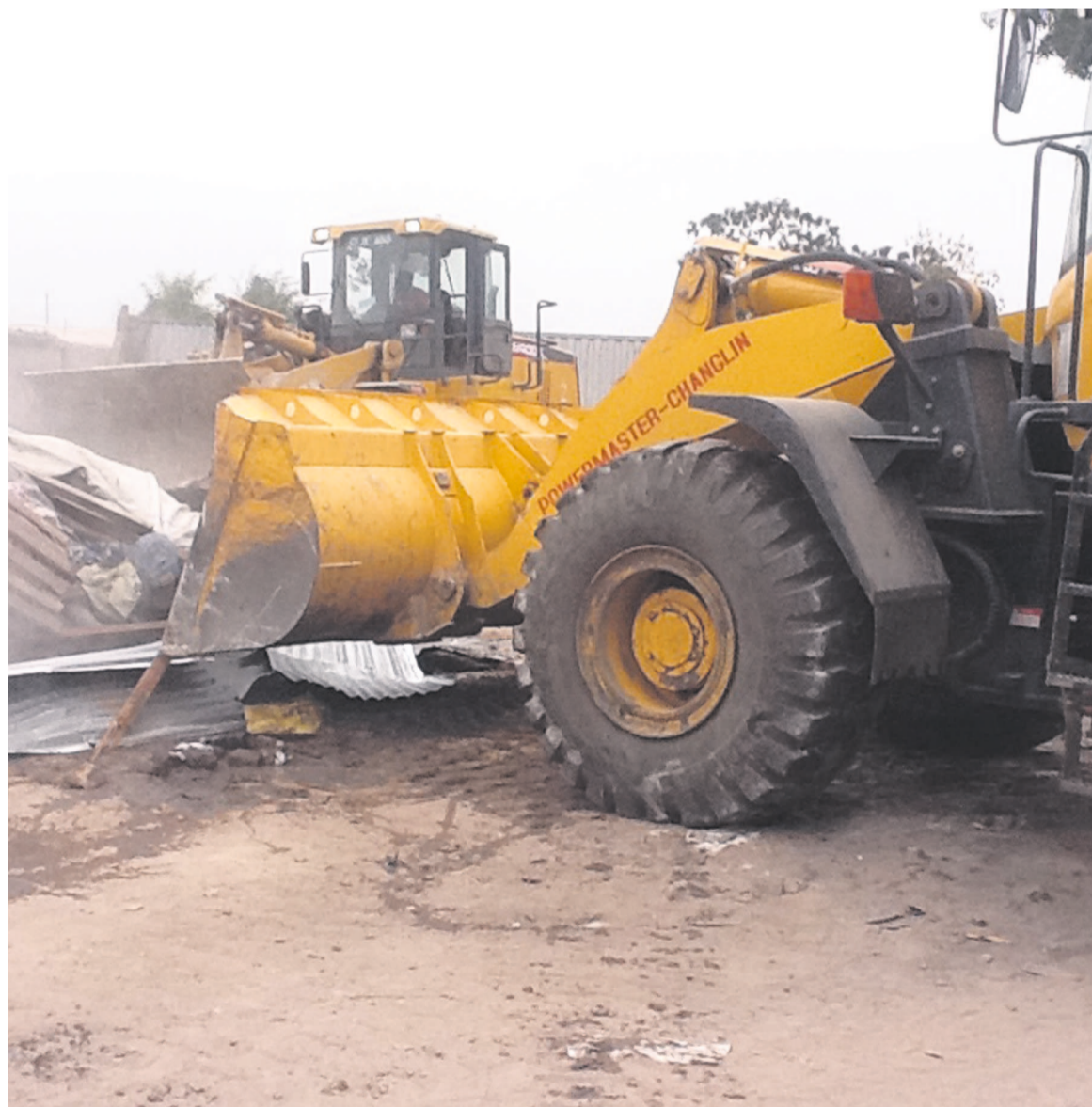
L'opération de guépérisement