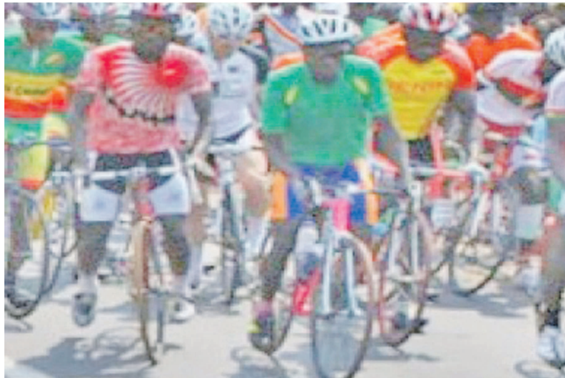
Coureurs au Deuxième Tour cycliste de la RDC

Les coureurs ont remercié la Fécoy pour le geste, tout en invitant l'exécutif national à s'impliquer dans l'amélioration des conditions de préparation des cyclistes congolais pour une prestation de qualité dans les compétitions internationales de cyclisme. « Que les autorités puissent multiplier des compétitions à travers le pays et organiser des stages pour nous permettre de s'améliorer et de relever notre niveau. Il est