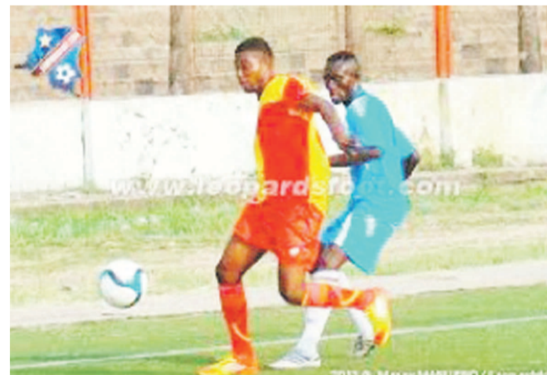
Vue d'un match du championnat de l'Epkin

L'Entente provinciale de football de Kinshasa (Epkin) a tenu, le 29 juin, en la salle Le Siège située sur l'avenue Masimanimba dans la commune de Kasa-Vubu, son assemblée générale ordinaire.