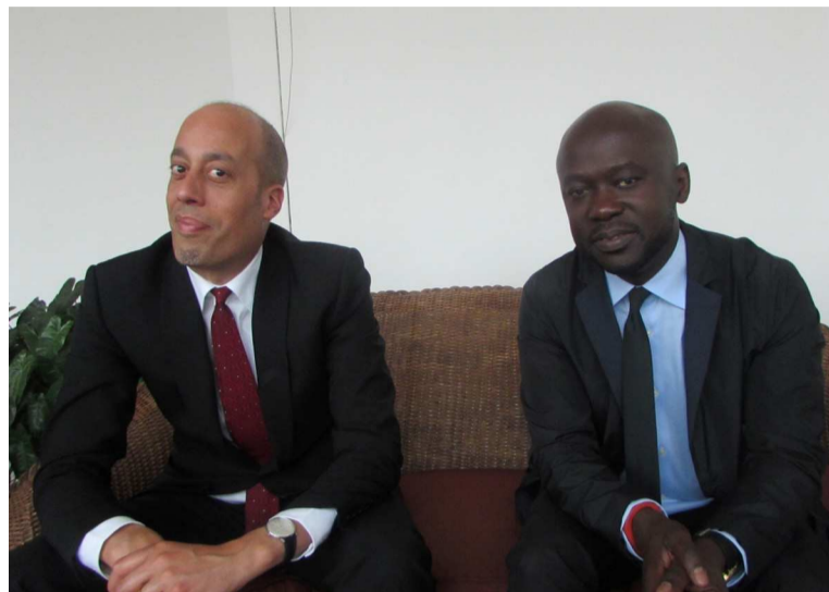
L'architecte ghanéen David Adjaye (à droite) et son assistant

L'architecte ghanéen exerce partout dans le monde mais surtout en Afrique dont il veut contribuer au développement. Ses projets sont très variés et concernent, entre autres, aussi bien le