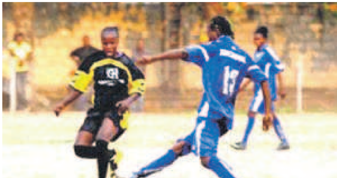
Un match de football féminin à Kinshasa

Organisé dans le cadre des festivités de l'Indépendance de la RDC célébrée le 30 juin de chaque année, le Tournoi de football féminin organisé par la Commission nationale de football féminin de la Fécofa a été remporté par Force Terrestre.