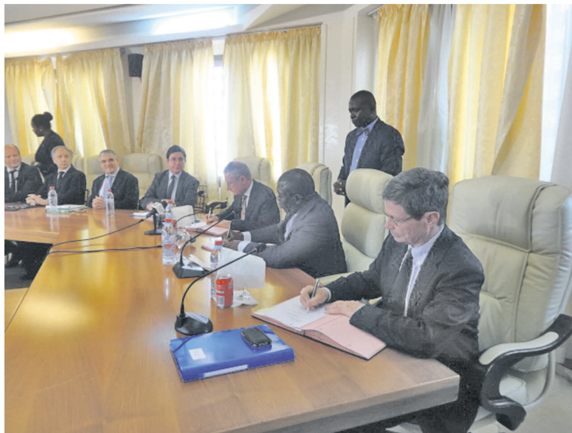
La signature des conventions

Il a souligné que les fonds du C2D étaient mobilisés pour des investis-