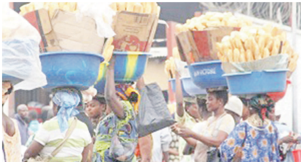
Des vendeuses de Pain Victoire

Le collectif des ONGDH, qui se dit préoccupé par la dégradation de leur état de santé, a noté que de ces demandeurs d'asile font la diarrhée et certains d'entre eux sont hospitalisés à Kinshasa.