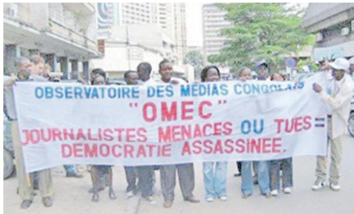
Une banderole de l'Omec lors d'une activité pour la défense de la liberté de la presse

L'Asadho a également noté que précédemment, la journaliste avait introduit une demande d'obtention du certificat de protection de la marque de son émission « Journal d'informations judiciaires » auprès du ministère de l'IPME depuis plusieurs mois, soit le 6 janvier, avant de recevoir le procès verbal de dépôt de la demande, le 9 du même mois. Par ailleurs, après avoir payé tous