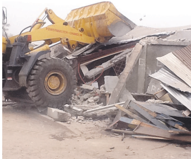
Un engin en pleine opération