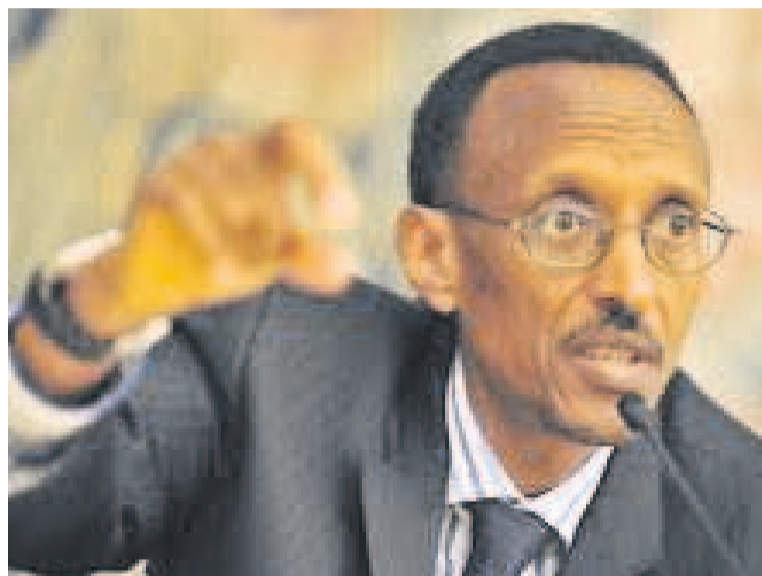
Le président Paul Kagamé

Au cours d'une conférence de presse organisée le 1 er juillet à l'occasion de la fête de l'indépendance du pays, le président rwandais Paul Kagamé n'a pas du tout apprécié la façon dont les FDLR sont traités. « Le monde est cynique