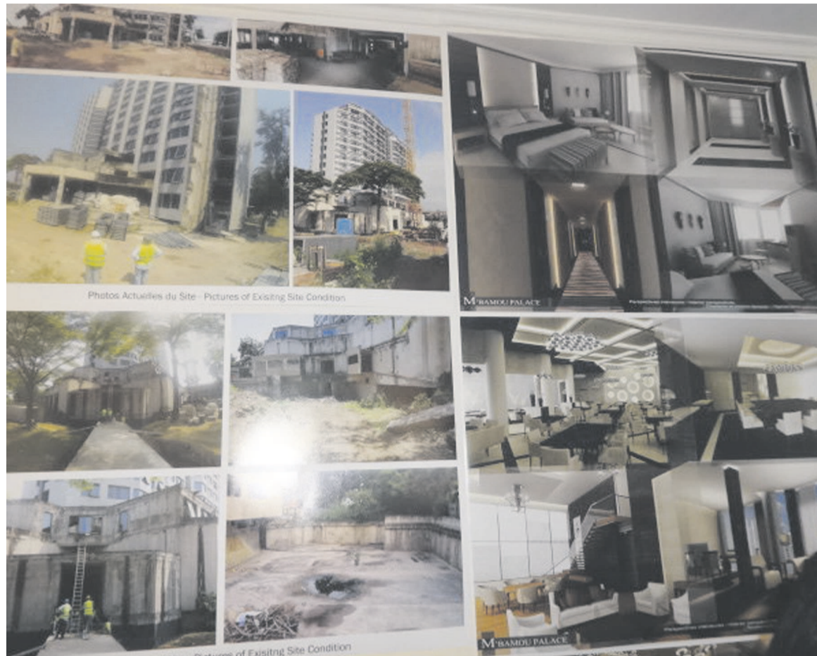
Les maquettes du Mbamou Palace.

La filiale d'un important groupe turc a expliqué que l'état actuel de l'hôtel ne s'apparentait pas à un 5 Étoiles. À la suite d'après discussions et de concertation avec des hôteliers de renom, la décision a été prise de l'adapter aux exigences internationales. Les modifications apportées par l'architecte de la société concernent également le fonctionnement et la gestion de l'hôtel tout en prenant en compte l'existant. Le design de l'hôtel sera revu. En outre, près de 4.250m 2 devront être rajoutés à la superficie actuelle, pour obtenir une infrastructure aux normes d'un 5