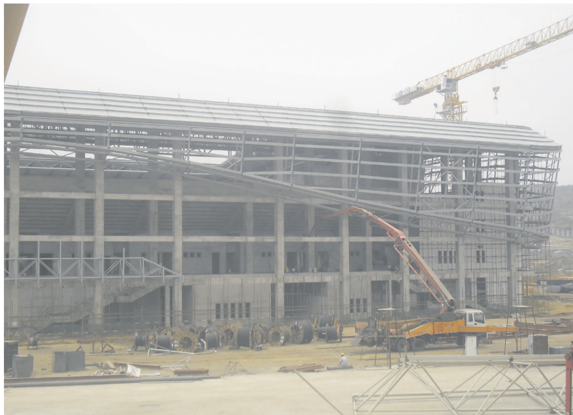
Une façade de la toiture du complexe nautique

Au niveau du terrain de football (60 055 places assises), la toiture est moins avancée que le palais des sports et le complexe nautique. Un petit retard qui s'explique par le fait que la charpente métallique du stade, complètement à terme, est plus large que les deux premières infrastructures. La vitesse de la pose de la toiture ne peut donc être la même. « Le souhait est de voir ces travaux finir à temps