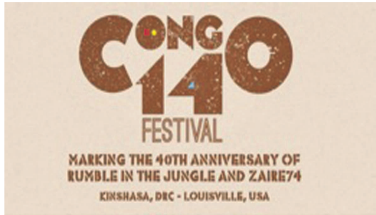
L'affiche-annonce de Congo14

Cette fois, il n'est pas uniquement question de sport car, pour