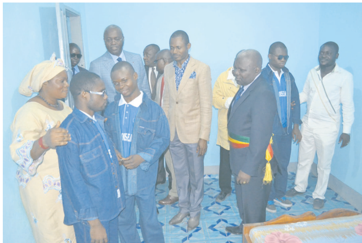
Le maire de Brazzaville, Hugues Ngouélondélé, en compagnie des artistes musiciens non-voyants

La résidence des artistes musiciens non-voyants est un cadre composé essentiellement de quatre chambres, une cuisine, une salle de bain et une salle de répétition. Le cadre est équipé d'instruments de musique par la mairie de Brazzaville et d'un groupe électrogène visant à pallier les délestages du courant électrique. Outre ces tournées en perspective, plusieurs actions encourageantes sont envisagées dès la production de l'album. L'œuvre va être dupliquée, de grands posters vont être conçus tout comme de grands spectacles vont se produire