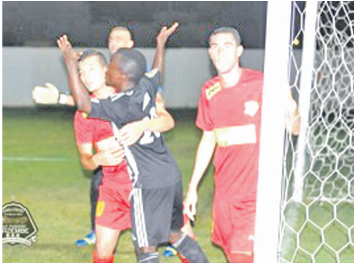
Vue du match amical Hussein Dey d'Algérie vs Mazembe à Tunis