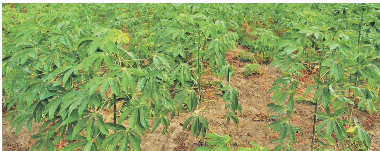
La priorité sera donnée à la culture des légumes et autres produits maraichers

L'ouvrage qui entre dans le cadre de la révolution de la modernité prônée par Joseph Kabila se veut le symbole du dynamisme d'un Congo en mouvement en route vers l'émergence. La cérémonie inaugurale de lancement des travaux a eu lieu le 15 juillet en présence du chef de l'État qu'accompagnaient quelques officiels et du gouverneur de la province du Bandundu. Sur les 75000 hectares prévus sur le site, près de dix mille devront à terme être consacrés à la culture de légumes et de produits maraichers. Quatre-vingt-trois millions de dollars ont été mobilisés sur fonds propres par l'exécutif national pour matérialiser cet important projet qui sera relayé dans d'autres provinces du pays.