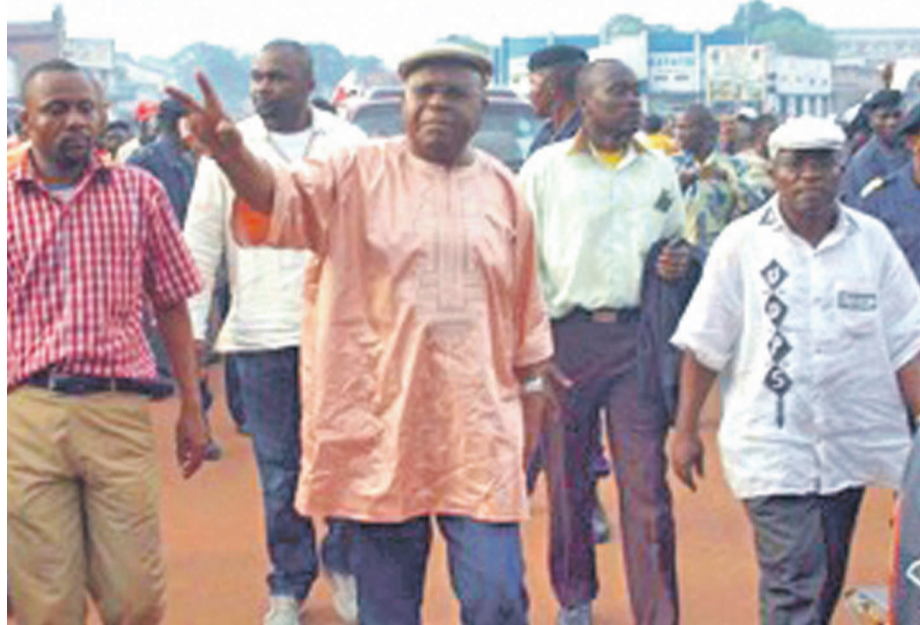
Étienne Tshisekedi à Isiro pendant la campagne présidentielle de 2011