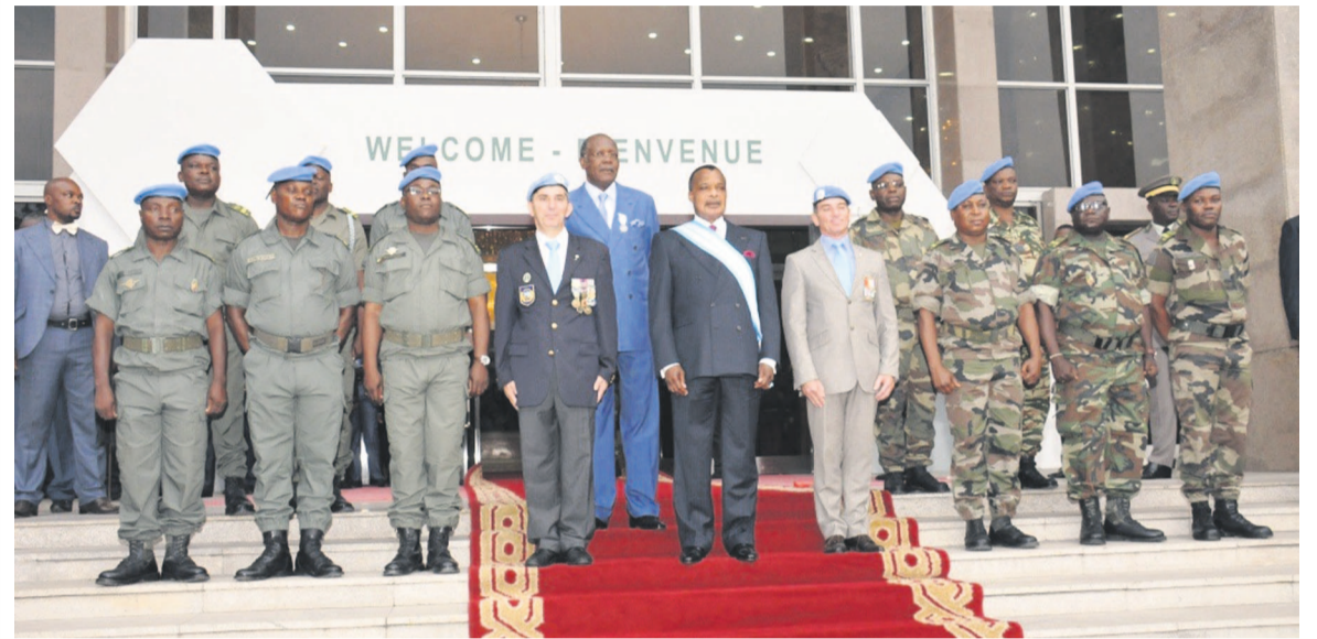
Les soldats de la paix posant avec Denis Sassou N'Guesso

L'Association internationale des soldats de la paix (AISP) a honoré ce 15 juillet à Brazzaville, le président de la République, Denis Sassou N'Guesso, en l'élevant à la dignité de Grand-Croix de la commémoration de la paix.