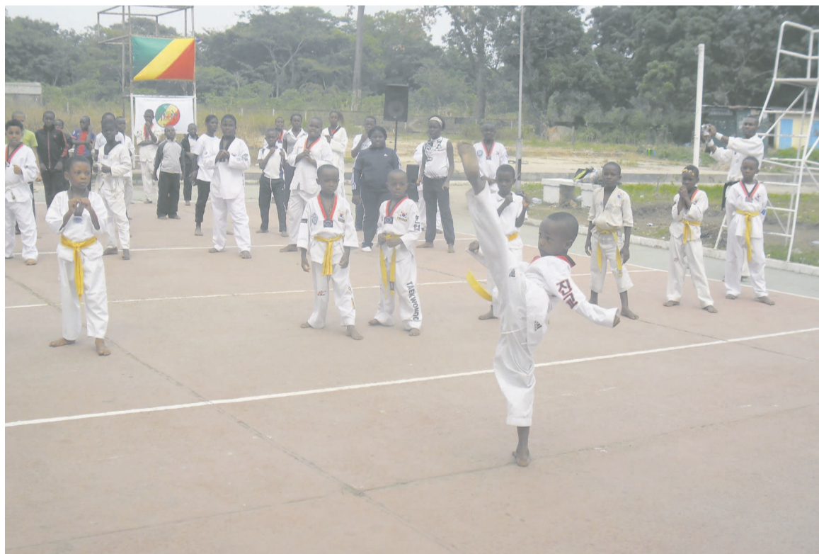
Un athlète de six ans en démonstration

Pour lier l'utile à l'agréable, la Fécotae a mis tous les enfants autour d'une table où ils ont bu et mangé dans un grand élan de fraternité. Ceci avant de recevoir leurs diplômes de participation à cette séance