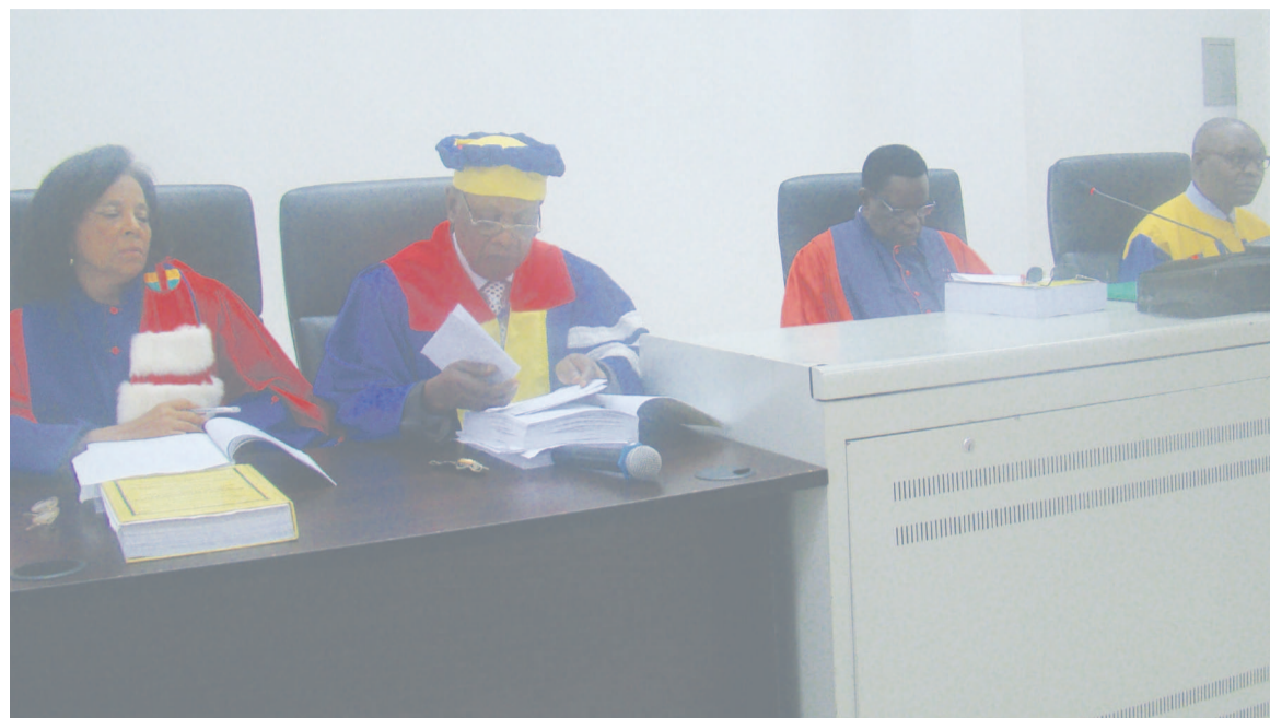
Les membres du jury