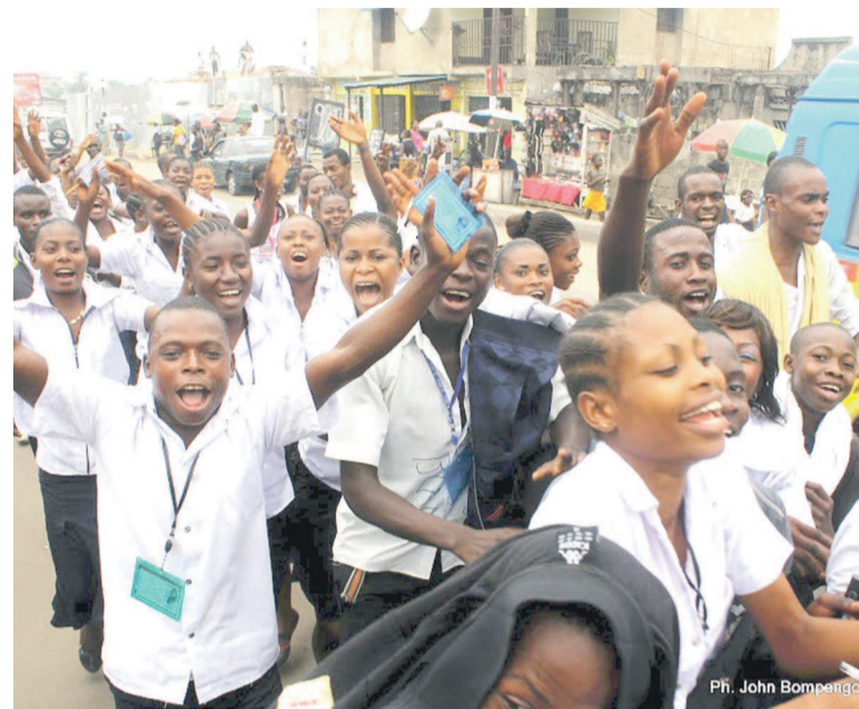
Des élèves en pleine jubilation après la publication des résultats

Chose promise, chose due. Le ministère de l'Enseignement primaire, secondaire et professionnel (EPSP) a débuté le lundi tard dans la soirée la publication des résultats des examens d'État pour l'édition 2014. Tous les résultats de toutes les filières sont, en effet, disponibles sur le site du ministère de l'EPSP. À Kinshasa, des scènes de joie et d'hystérie collective étaient enregistrées un peu partout au point de mettre toute la ville sens dessus-dessous. Avec un total de 120.258 participants à cette épreuve nationale, l'on note un taux de réussite avoisinant les 58%, soit une augmentation de 4% par rapport à l'année passée. Tôt dans la matinée du 15 juillet, des lauréats ont pris d'assaut les différents carrefours de la ville pour extérioriser leur joie. La voie publique a été littéralement inondée par ces jeunes diplômés qui allaient dans tous les sens chantant et dansant à grand renfort gestuel. Visages saupoudrés, ils étaient carrément incontrôlables. Des scènes de débordement étaient enregistrées à certains endroits au grand dam des agents de l'ordre qui avaient du mal à maîtriser la fougue des lauréats. Perchés sur des véhicules réqui-