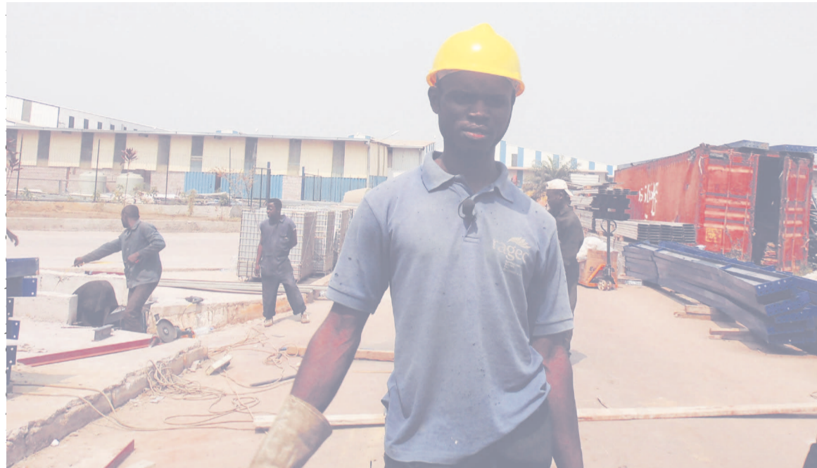
Des jeunes congolais en plein travaux de soudure à Ragec.jpg

Au marché Total, les chargeurs et déchargeurs de marchandises, tout comme les pousseurs, font recette. De 15 à 20.000 FCFA par jour, explique un jeune Congolais qui décharge un camion d'oignons. « Quand la journée n'a pas trop marché, j'ai au moins 7.000 FCFA. Mais quand ça a vraiment donné, je me retrouve avec entre 15 et 20.000 FCFA », témoigne