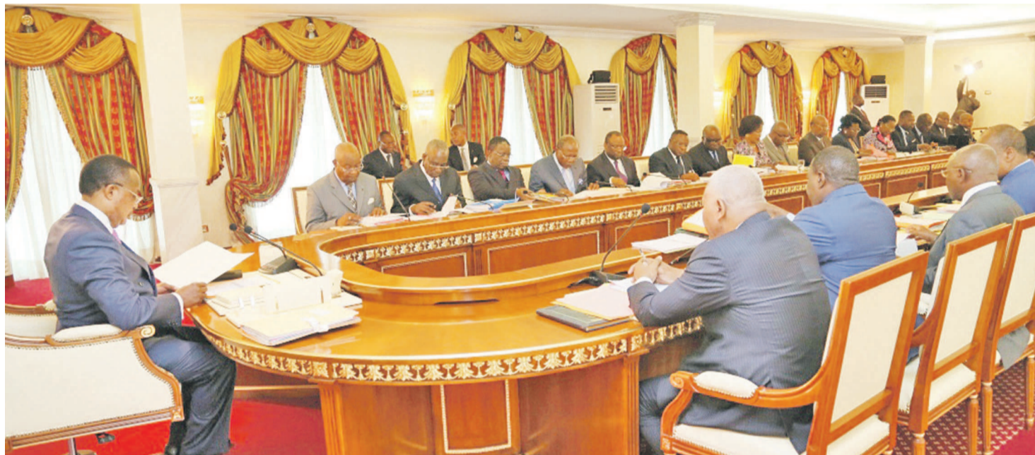
Le Conseil des ministres

Initialement fixé à 4152 milliards 920 millions francs CFA, en recettes et à 3141 milliards 878 millions 190 mille FCFA en dépenses, le budget de l'État exercice 2014 a été réajusté par le Conseil des ministres du 16 juillet dernier. Les prévisions de recettes sont abaissées à 3932 milliards 932 millions FCFA alors que les dépenses sont rehaussées à 3647 milliards 897 millions FCFA. Des changements expliqués par le recul des recettes pétrolières, qui ne correspondent plus aux premières hypothèses, et la révision à la hausse de certains investissements en infrastructures. La réunion présidée par le chef de l'État, Denis Sassou N'Guesso, a également adopté le projet de loi modifiant et complétant certaines dispositions de la loi électorale et celui portant création de l'Institut national du travail social. Pages 4,5