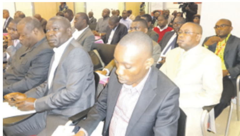
Une vue des participants

deviennent : le E-gouvernement (services et contenus TIC pour le gouvernement et administrations publiques) ; le E-business (amélioration des infrastructures de base pour les acteurs du secteur privé) ; et le E-citoyen (services et contenus pour le grand public). La stratégie se décline en axes tactiques pour chaque pilier et chaque axe comporte une série de projets. En définitive, les acteurs pu-