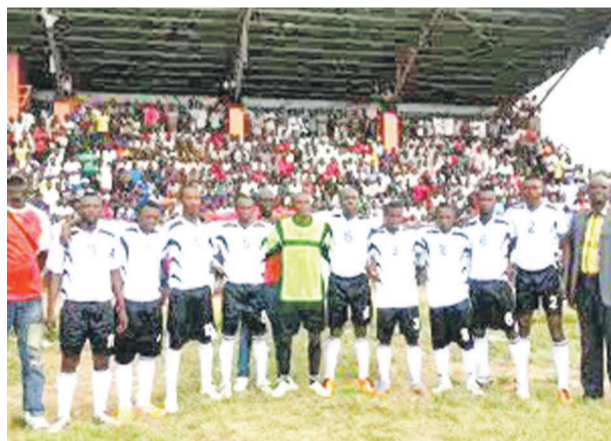
AS Bantous de Mbuji-Mayi