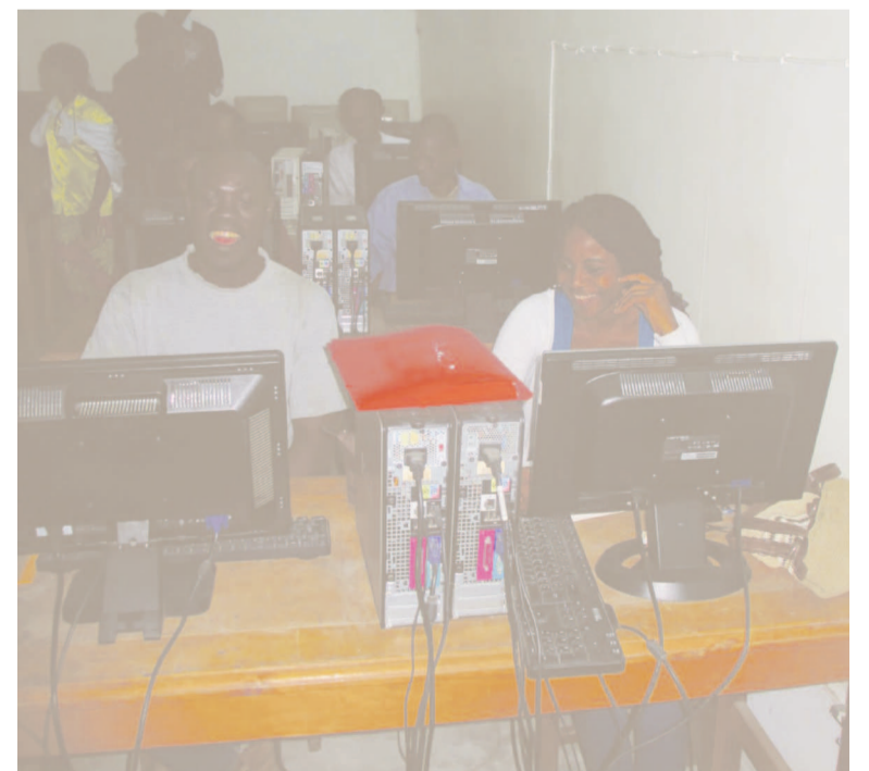
Des participants au séminaire d'initiation et de perfectionnement à l'informatique dispensé par l'AIP.

né la quintessence de cette activité : « L'informatique occupe aujourd'hui une place de choix dans notre société, rien ne se fait sans elle, ici nous formons tout le monde, des travailleurs, des enfants et nous les aidons à développer le génie qui est en eux à travers des techniques