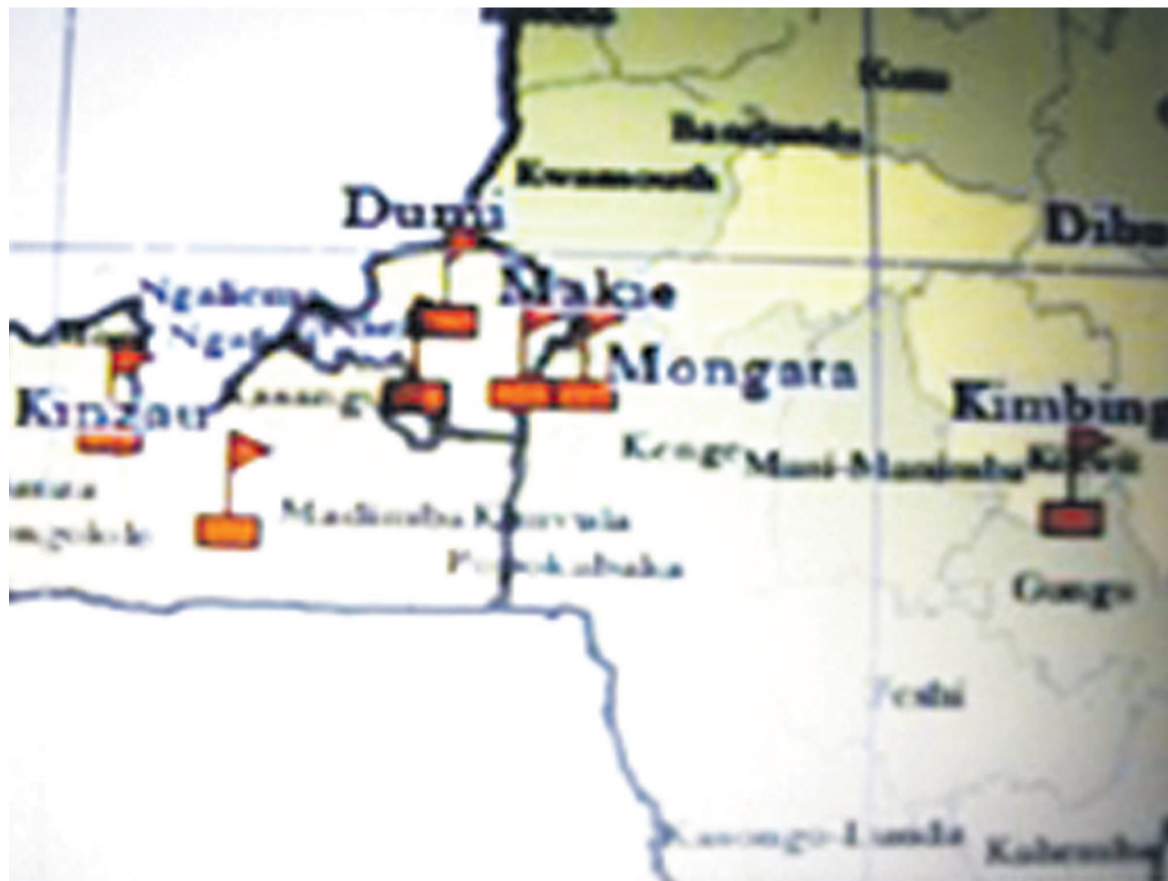
Quelques sites ciblés à Kinshasa, au Bas-Congo et au Bandundu (avec des drapelets)

La dépendance en constante hausse aux produits importés justifie la multiplication des initiatives dans le cadre de la relance du secteur agro-industriel pour aider la RDC à mieux profiter de ses 80 millions de terres arables après une chute drastique de la production nationale dans toutes les filières confondues.