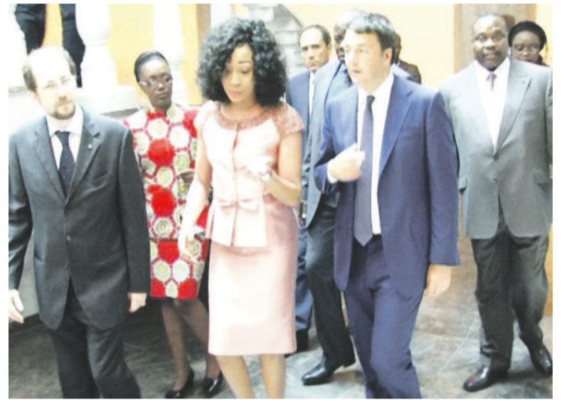
La visite du Premier ministre d'Italie au Mémorial Pierre-Savorgnan-de-Brazza

Matteo Renzi, a profité de son passage à Brazzaville pour aller s'incliner sur la tombe de Pierre Savorgnan de Brazza.