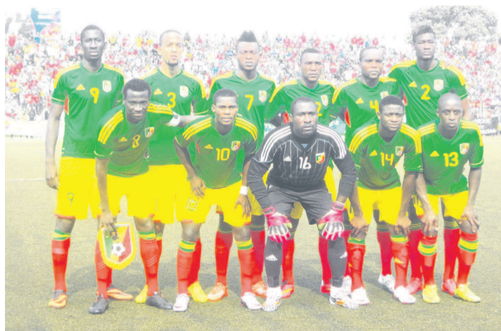
Le onze de départ contre les Rwandais après la victoire de ses poulains.

Le coach des Diables rouges, Claude Le Roy, entend y aller pour attaquer. « Nous savons que si nous parvenons à marquer un but, il faudrait qu'ils en mettent quatre pour nous éliminer », a-t-il estimé