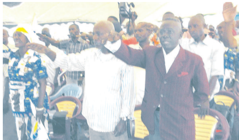
Les militants du MCDDI