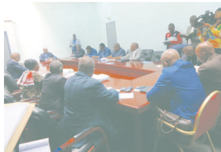
La réunion de la CAPA