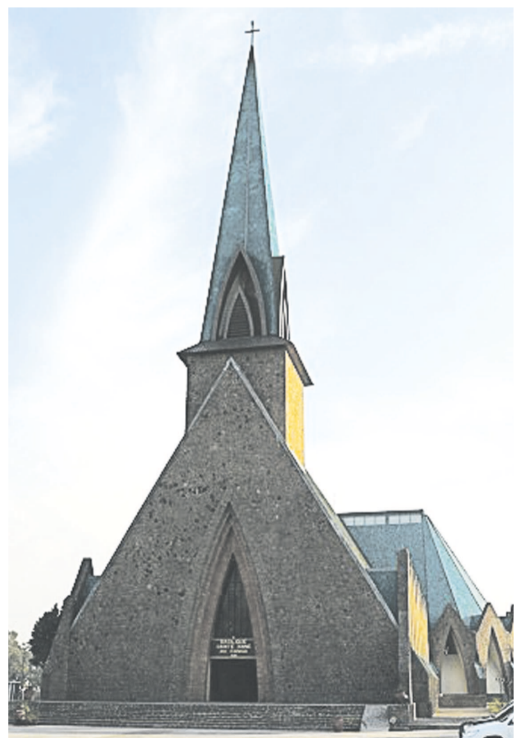
La basilique Sainte-Anne du Congo

Thierry Nougou, en partenariat avec la Direction générale du patrimoine et des archives