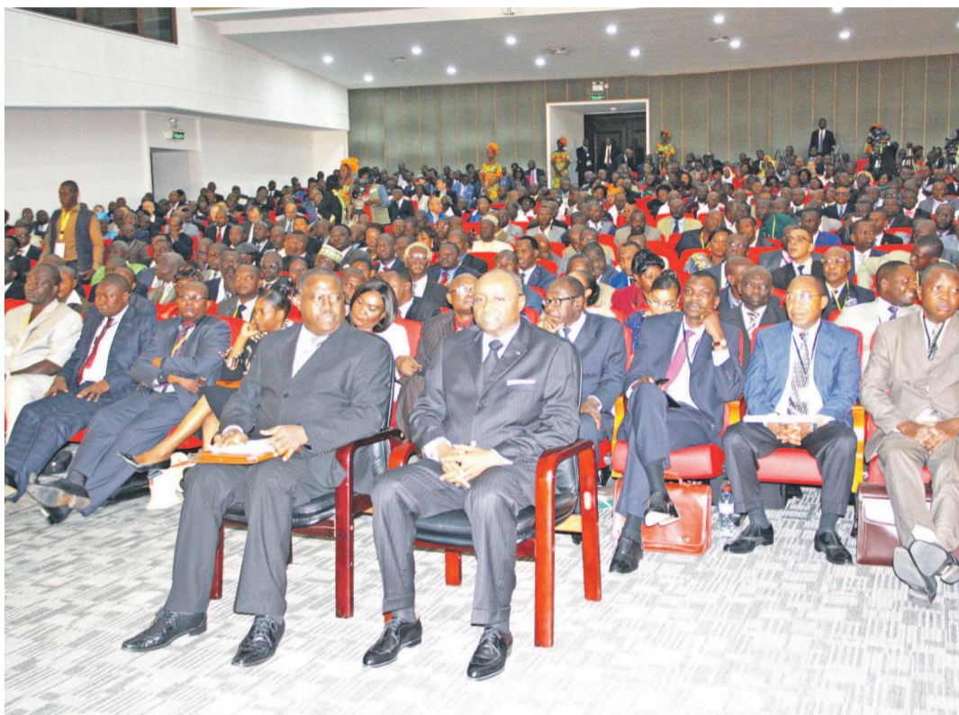
Les participants au forum

La communauté internationale, sous l'égide du médiateur Denis Sassou N'Guesso, a plaidé lundi à Brazzaville en faveur d'un dépassement de soi de chacun des acteurs impliqués dans la crise centrafricaine afin de restaurer le dialogue politique et la réconciliation dans ce pays. Regroupant 169 participants issus de toutes les sensibilités parmi lesquelles des représentants des Anti balakas et des ex-Séléka, le forum de Brazzaville vise à créer les conditions d'un retour définitif à la paix en RCA. « Le moment est venu de tirer les leçons de toutes les expériences passées. La décision vous revient et, de plus en plus, nous ne cessons de mettre l'accent sur la nécessité pour vous de vous approprier le processus de retour à la paix, à la sécurité, à l'unité et à la réconciliation nationale », a lancé le chef de l'État congolais, Denis Sassou N'Guesso, à l'ouverture du forum. Page 9