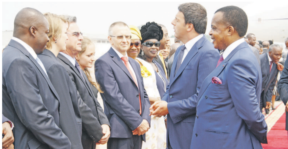
Le premier ministre italien à son arrivée dimanche à l'Aéroport Maya-Maya

La visite du Premier ministre italien au Congo a permis aux deux pays de signer deux accords dont l'un ayant trait au renforcement de leur coopération dans le domaine pétrolier et l'autre consacrant la construction d'un quartier dit modèle à Kintélé, dans la banlieue nord