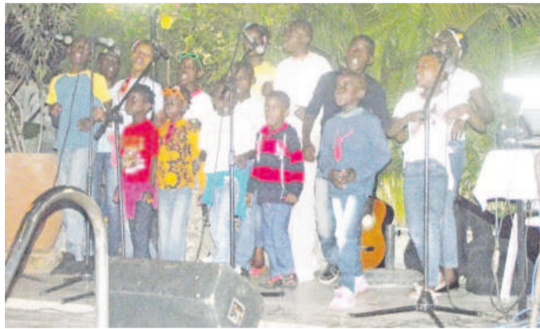
Les enfants en pleine prestation