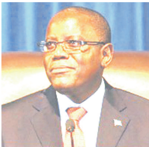
Le président de l'Assemblée nationale, Aubin Minaku

« La majorité estime que le projet de société qui est le sien, c'est le meilleur pour la révolution de la modernité destinée à amener la République démocratique du Congo au stade d'un État émergent ». Ces propos du président de l'Assemblée nationale tenus le 17 juillet devant un parterre des journalistes traduisent la volonté de la majorité présidentielle à être aux commandes de la République au-delà de 2016. Dans son intervention médiatique, Aubin Minaku n'est pas allé par le dos de la cuillère pour réaffirmer l'engagement de la famille politique du chef de l'État à réitérer l'exploit de 2006 et de 2011. Tout est mis en œuvre pour que l'actuelle majorité au pouvoir puisse tenir le gouvernail du pays après les scrutins de 2016, a déclaré Aubin Minaku tout en se gardant de ne pas dévoiler le nom du futur candidat à la présidentielle qu'aura à soutenir son camp politique. « Le président Joseph Kabila a été réélu en 2011. Il est en plein mandat en train de se battre pour trouver les moyens, les dispatcher correctement et aider le peuple congolais à aller de l'avant, notamment à travers ce que nous avons vécu il y a quelques heures, le parc agricole de Bukanga Lonzo. Au-delà de ce parc dans la province du Kwango, il s'est décidé à étendre les parcs sur toute l'étendue