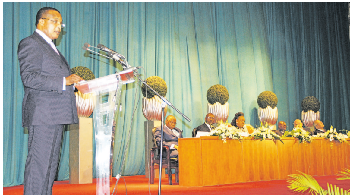
Le président Denis Sassou N'Guesso ouvrant les travaux du forum inter-centrafricain à Brazzaville

En effet, première phase d'un processus de réconciliation initié par les chefs d'État de la sous-région d'Afrique centrale en marge du sommet de l'Union africaine tenu le 17 juillet à Malabo (Guinée Équatoriale), les assises de Brazzaville permettront aux protagonistes de la crise centrafricaine d'exposer leurs préoccupations