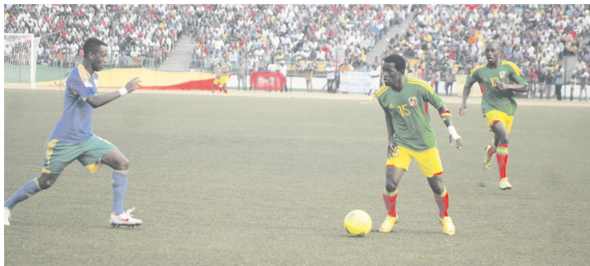
L'équipe des Diables rouges partira à Kigali avec l'avance de deux buts