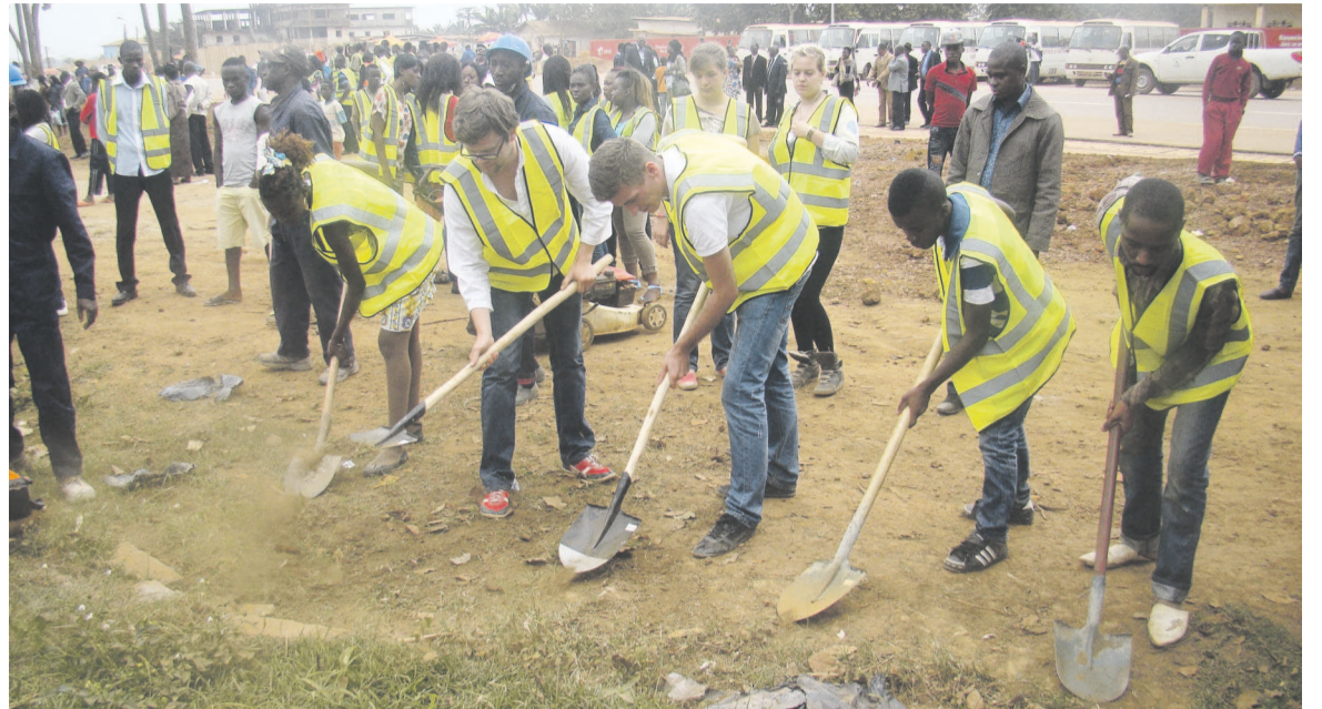
Les jeunes volontaires assainissent le siège de la sous-préfecture

lançant les activités du chantier vacances devant les autorités locales et départementales, le ministre Anatole Collinet Makosso a souligné que cette première expérience avait un caractère international et permettait un réel brassage des cultures et une véritable intégration des peuples. Il a rappelé aux participants qu'ils étaient les premiers d'un