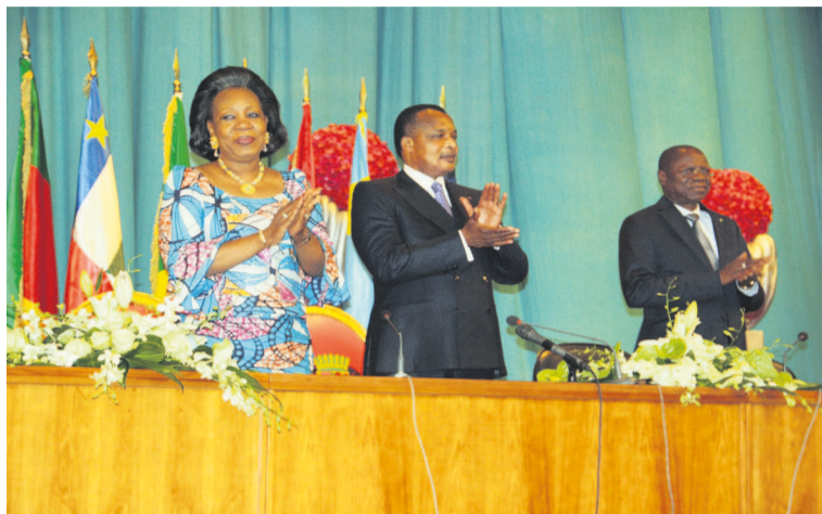
Denis Sassou N'Guesso et Catherine Samba Panza

« Sans détours nous disons que s'agissant du DDR nous sommes disposés à le faire. Mais pour le moment nous