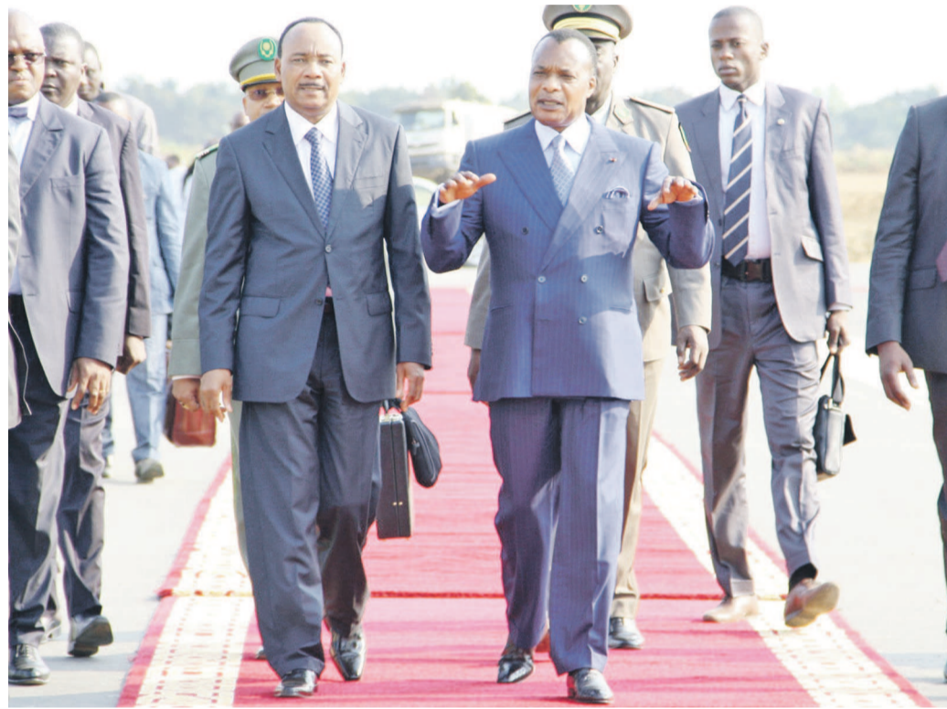
Le président nigérien Mahamadou Issoufou et son homologue congolais, Denis Sassou N'Guesso