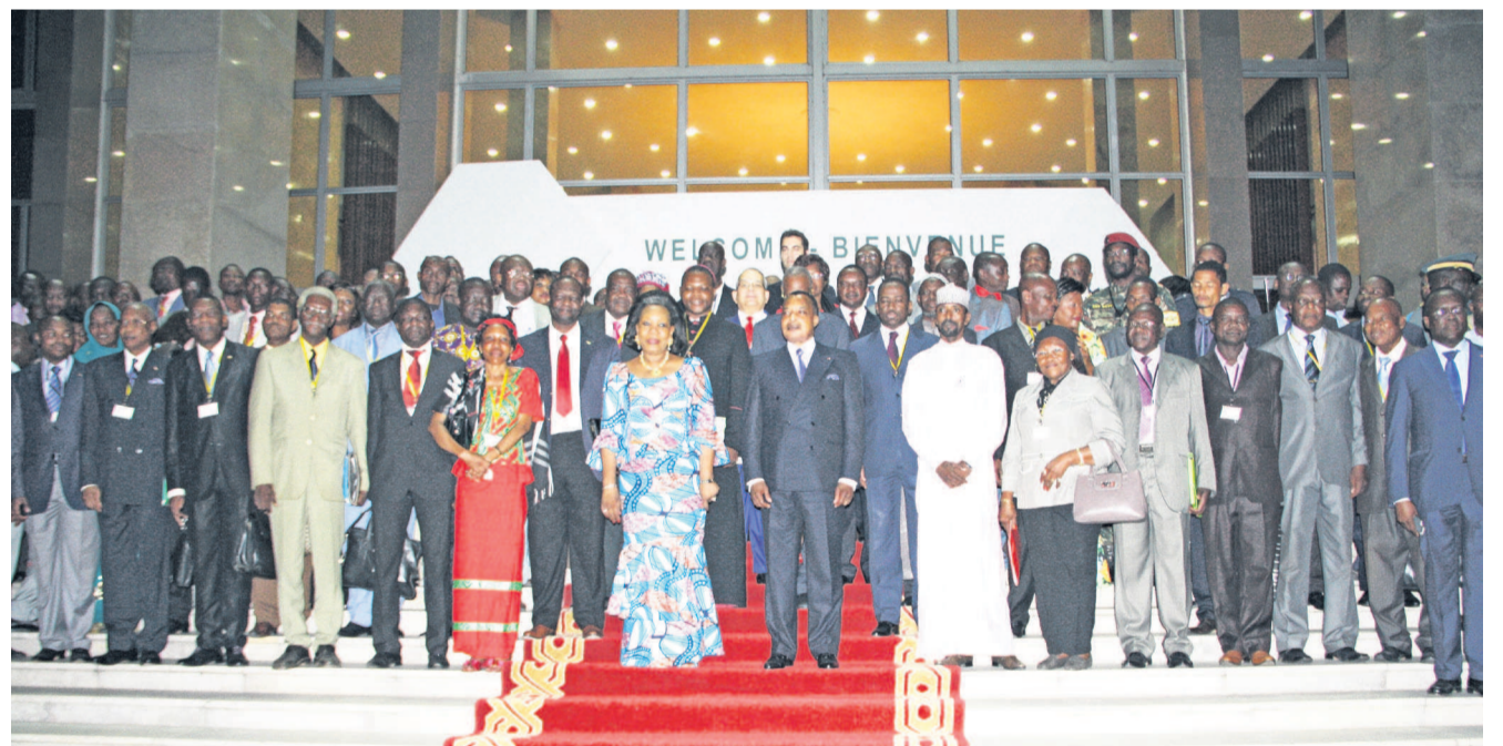
La photo de famille des participants au forum inter centrafricain à Brazzaville

L'accord signé par une trentaine d'acteurs ouvre ainsi la voie à une deuxième phase devant permettre d'amorcer le processus de désarmement et de dialogue politique en vue de tourner définitivement la page noire que connaît la Centrafrique. « La réconciliation nationale ne se décrète pas, ne s'arrête pas un jour, mécaniquement. Elle est un long fleuve qu'il faut sans cesse alimenter, entretenir. Le but étant d'ancrer dans tous les cœurs, dans tous les esprits, la culture de la paix, de tolérance, du respect de la différence, des valeurs partagées, d'une gouvernance inclusive », a indiqué le médiateur international, Denis Sassou N'Guesso, précisant que le plus long voyage commence par le premier pas. Page 7