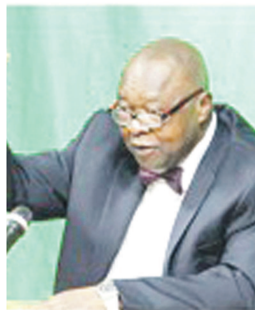
Le ministre des Sports, Banza Mukalay

vau de constructions et de réhabilitations des stades devant accueillir ces matchs ainsi que d'autres infrastructures connexes.