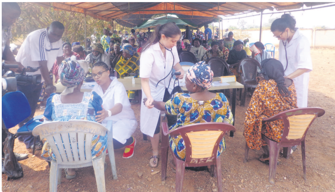
Des patientes se faisant dépister.