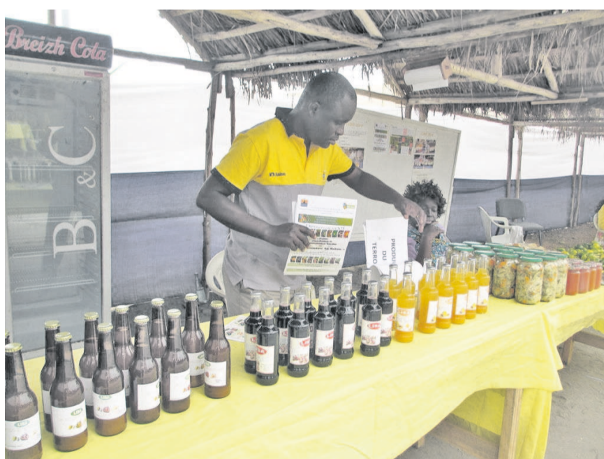
Des jus locaux fabriqués à base de produits naturels.

Cette quinzaïne commerciale est l'occasion pour les Ponténégrins de découvrir les produits locaux bio qui favorisent une bonne santé. De nombreux exploitants locaux, à savoir, des maraîchers, agriculteurs, éleveurs de volailles, de