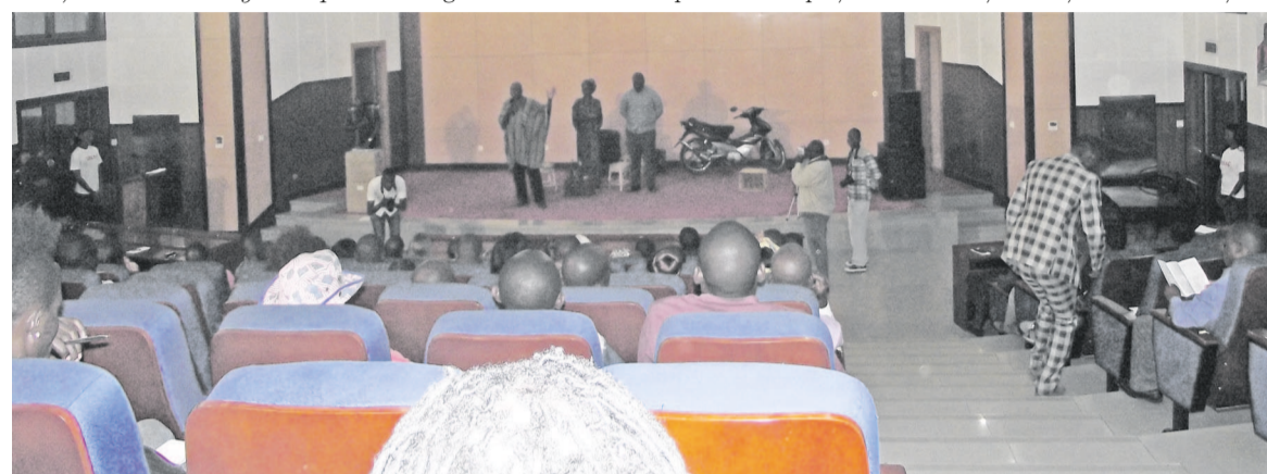
Une vue de la salle lors de la représentation

a voulu prolonger cette expérience émouvante de dire, dire les fièvres et les blessées, dire des idioties. Peu importe. Qu'importe les esprits en déconfiture et autres porteurs d'esprits endormis. « Dire des idioties, de nos jours où tout le monde réfléchit profondément, c'est le seul moyen de prouver