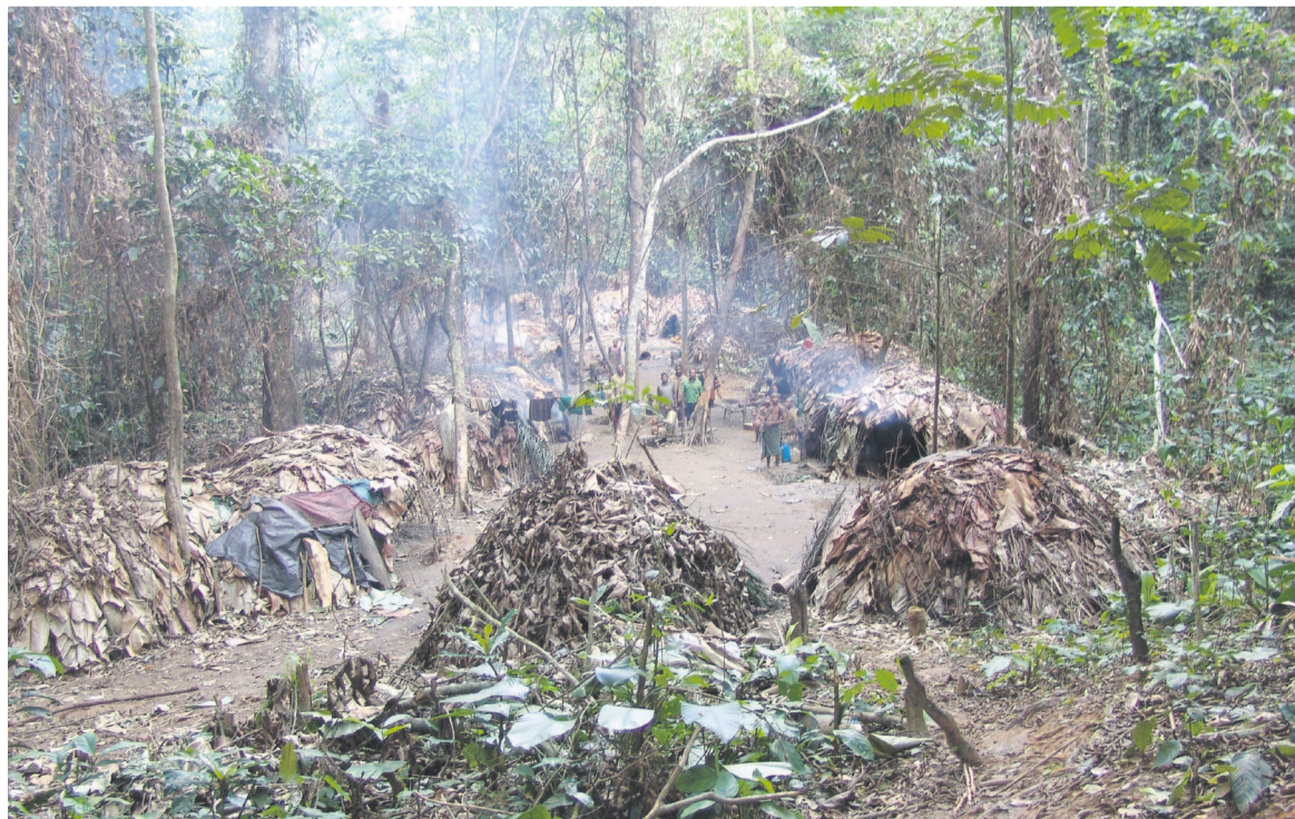
Un campement autochtone dans la forêt du Nord Congo