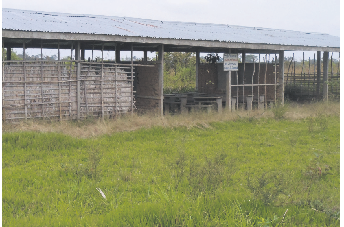
Le hangar qui sert d'école aux enfants autochtones de Lifouri dans le Pool

Il faut attendre l'après-midi pour voir la majorité des habitants de cette contrée, enfants compris, sortir de la forêt. Pendant que l'équipe médico-sociale profite de vacciner contre la polio, certains Autochtones nous expliquent les difficultés qu'ils rencontrent au quotidien. Lorsqu'on demande à l'un des autochtones s'il n'avait pas ramené du gibier, il nous laisse comprendre que la forêt ne rapporte plus. Il explique que les produits de la