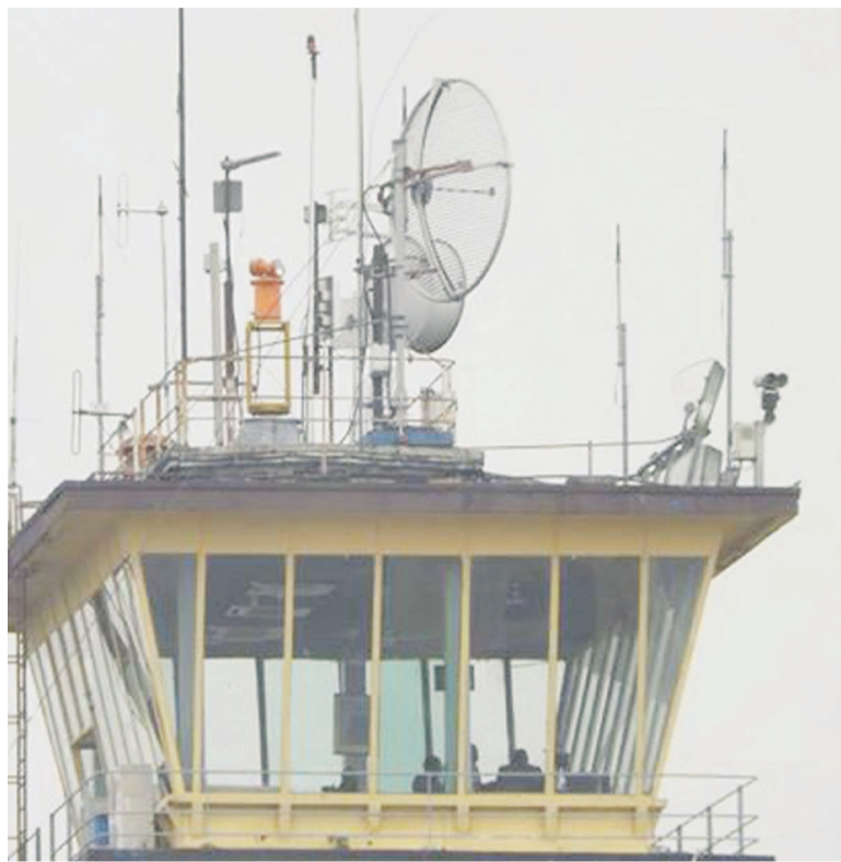
Tour de contrôle de l'aéroport international de N'Djili

Les travailleurs de la Régie des voies aériennes (RVA) ont lancé un ultimatum de quarante-huit heures au gouvernement afin de satisfaire à leurs revendications.