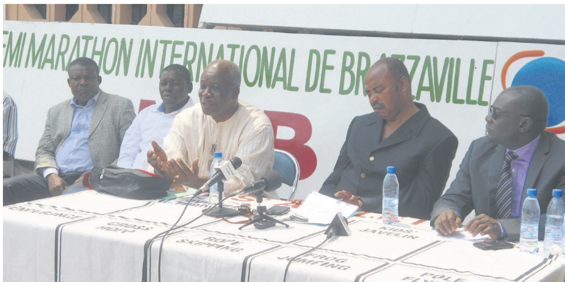
Le comité de direction du SMIB en conférence de presse Adiac

Chaque travail a un prix. Ce semi-marathon aussi. Ainsi, l'athlète qui s'imposera à la première place, pour les compétiteurs étrangers, aura droit à une enveloppe de 2.500.000FCFA. Le deuxième empochera 2.000.000FCFA et le troisième se contentera de 1.500.000FCFA. Par contre, le premier des nationaux aura 2.000.000, le deuxième 1.500.000FCFA, le troisième 1.000.000FCFA. Même ceux qui occuperont la 50 e place,