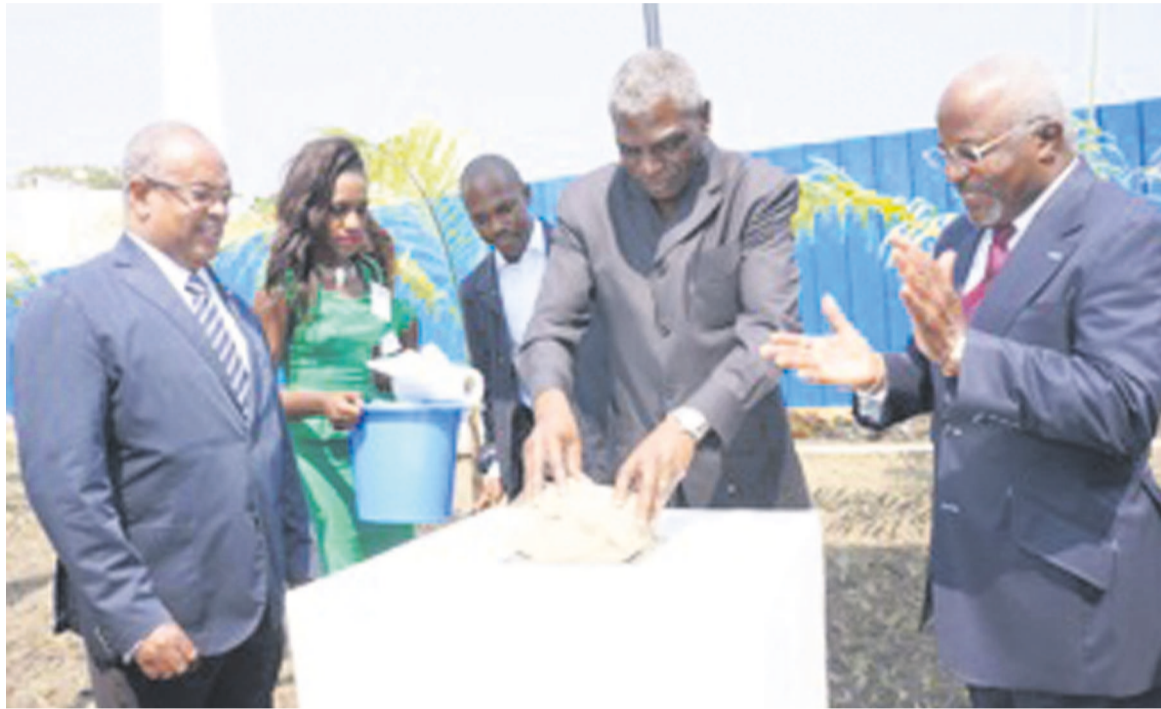
Le maire de Pointe-Noire, à côté du directeur général de Maisons sans frontières Congo, posant la première pierre pour la construction du rond-point à la place Antonetti

Ainsi selon la fiche technique des travaux de construction de ce carrefour, ceux-ci dureront six mois environ et seront supervisés par des représentants des administrations publiques compétentes. Ce carrefour dans son aménagement actuel prévoit l'ouverture de l'artère principale du lotissement Roc de Tchikobo sur le boulevard Charles de Gaulle et deviendra un carrefour à sept voies. En effet, il est prévu sur cette artère la construction de 16 immeubles à usage d'habitation, de commerces, de banques et des services dont le seuil moyen est