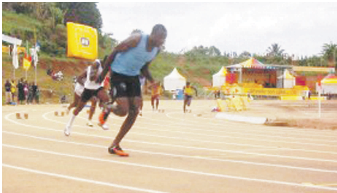
Vue d'une course

Les Léopards athlétisme de la RDC prennent part à la compétition continentale dans la ville ocre du Maroc avec treize athlètes.