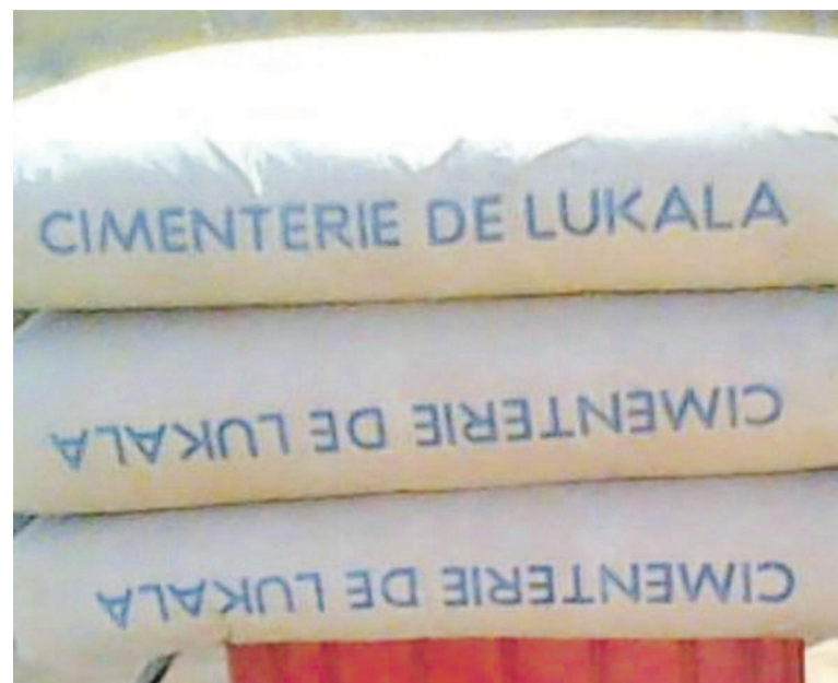
Des sacs de ciment