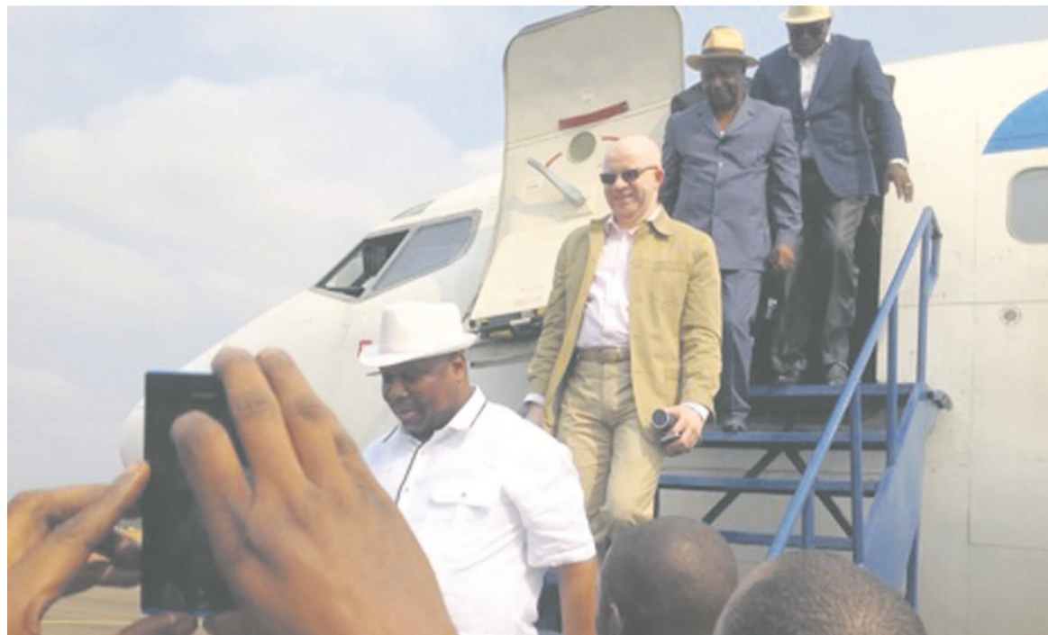
Les ministres Jean-Jacques Bouya, Thierry Mougalla, Henri Ossebi et Léon-Alfred Opimbat descendant de l'avion

L'appareil de référence pour cet aéroport, le Boeing 737 - 300, s'est posé, le 8 août en début d'après-midi, sur la nouvelle piste de Sibiti, après seulement 20 minutes de vol au départ de Brazzaville.