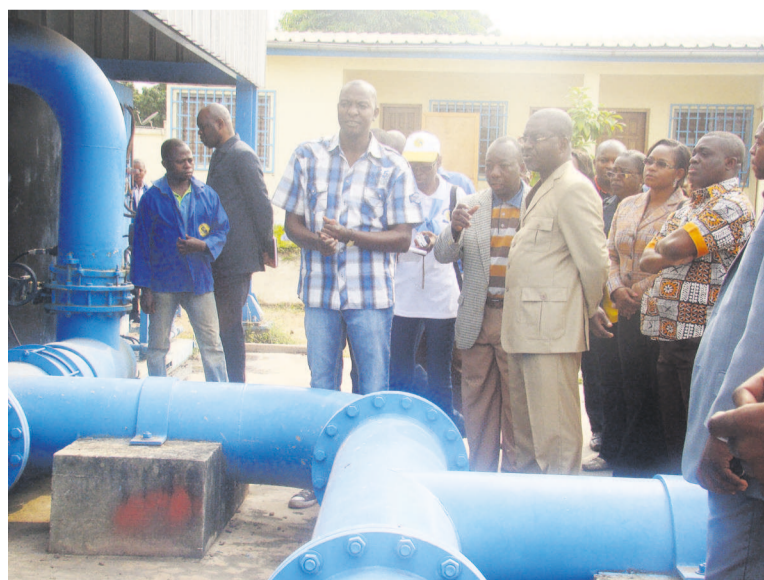
La visite guidée

Le nouveau directeur général de la Société nationale de distribution d'eau (SNDE) a effec-