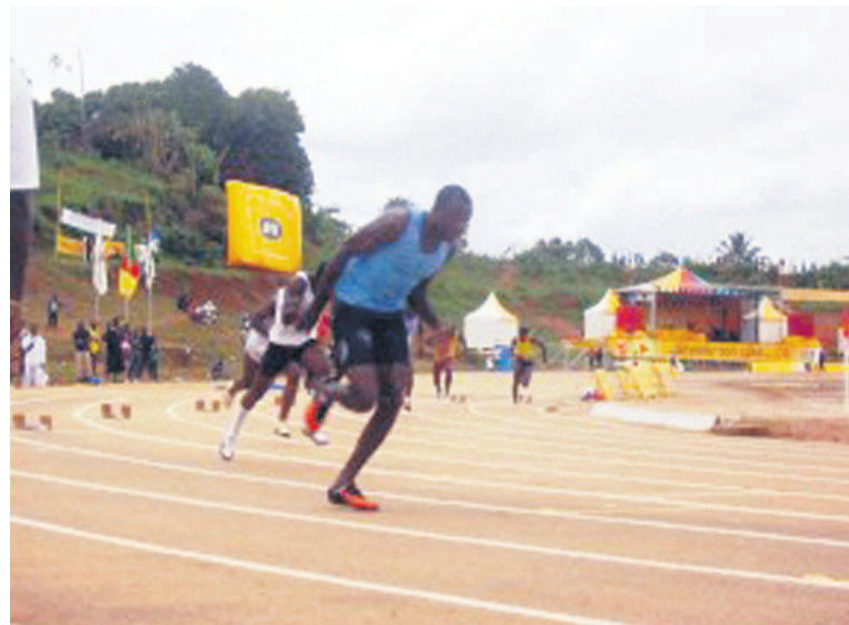
Vue d'une course

Les athlètes congolais n'ont rien glané à ces championnats qui se sont achevés, le 14 août, dans la capitale marocaine.