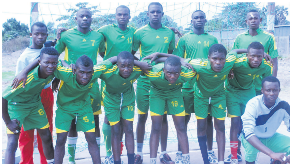
L'équipe de CTAHB