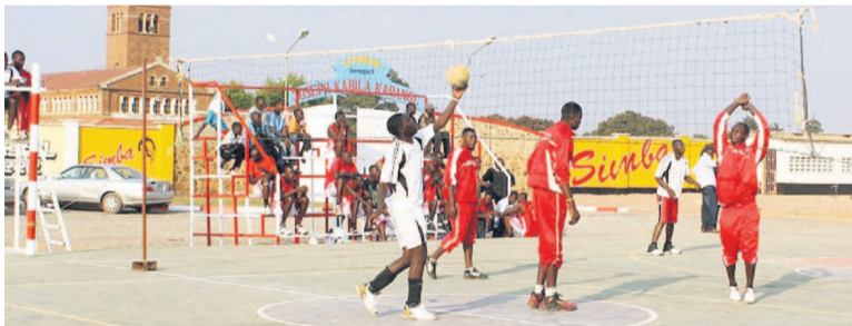
Un match de volley-ball messieurs

Les dames de Canon de Ndjili de Kinshasa ont conservé leur titre de championnes du Congo de volley-ball au terme de la 11 e édition de cette compétition organisée à Bandundu ville. En version masculine, la palme est revenue au VC Espoir de Kinshasa qui succède à Force terrestre qui avait remporté en 2013 la 10 e édition de la Coupe du Congo de volley-ball.