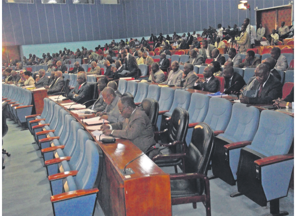
Une vue des parlementaires lors de la plénière du 21 août

Mais au regard de toutes ces dispositions, le ministre de l'intérieur et de la décentralisation a fait savoir « qu'il sied de reconnaître que cette législation mérite d'être actualisée en tenant compte des phénomènes nouveaux liés à l'extrémisme religieux et