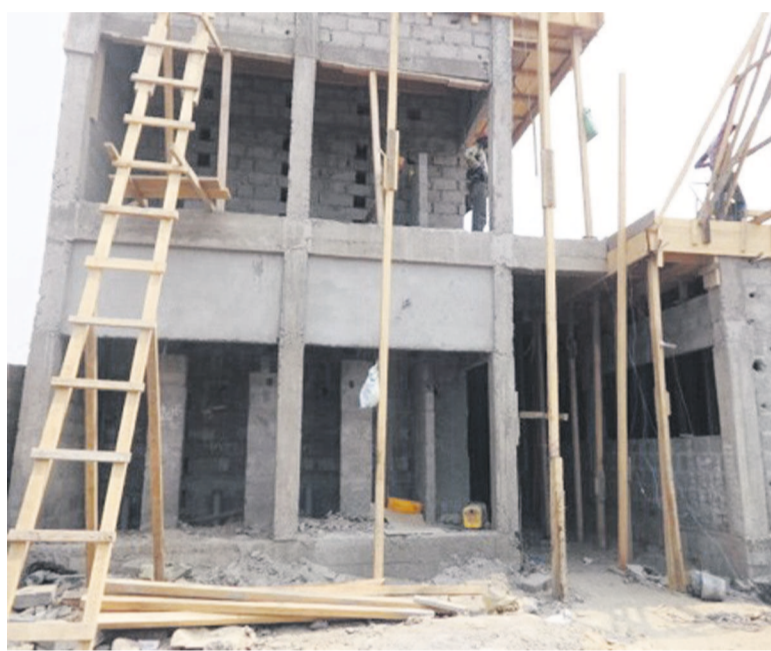
Le chantier en cours, (photo Adiac)

L'institut Henri Lopes sera dissocié de l'université d'ici à l'année prochaine. Les étudiants auront des locaux à leur entière disposition, sur le nouveau site, situé à Bacongo (deuxième arrondissement de Brazzaville) où des ouvriers sont à pied d'œuvre pour offrir de meilleures conditions d'étude aux jeunes.