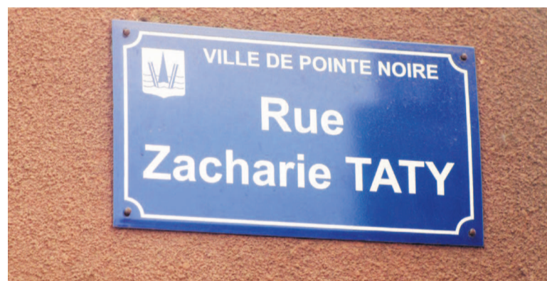
Une plaque d'adresse

vent confrontés aux caprices que leur offre la géographie de certains quartiers mal lotis ou presque pas lotis. Afin de remédier à cette anomalie longtemps constatée dans la circulation, la municipalité de Pointe-Noire avait officiellement