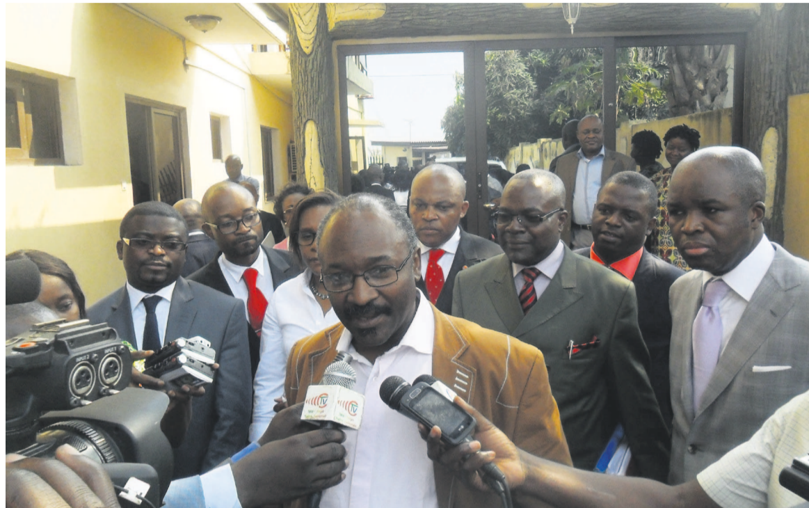
La délégation de la diaspora

La fédération de France du Parti congolais du Travail (PCT), qui a été mise en place en juin dernier, s'est engagée à dynamiser cette formation politique afin de s'affirmer dans le combat politique.