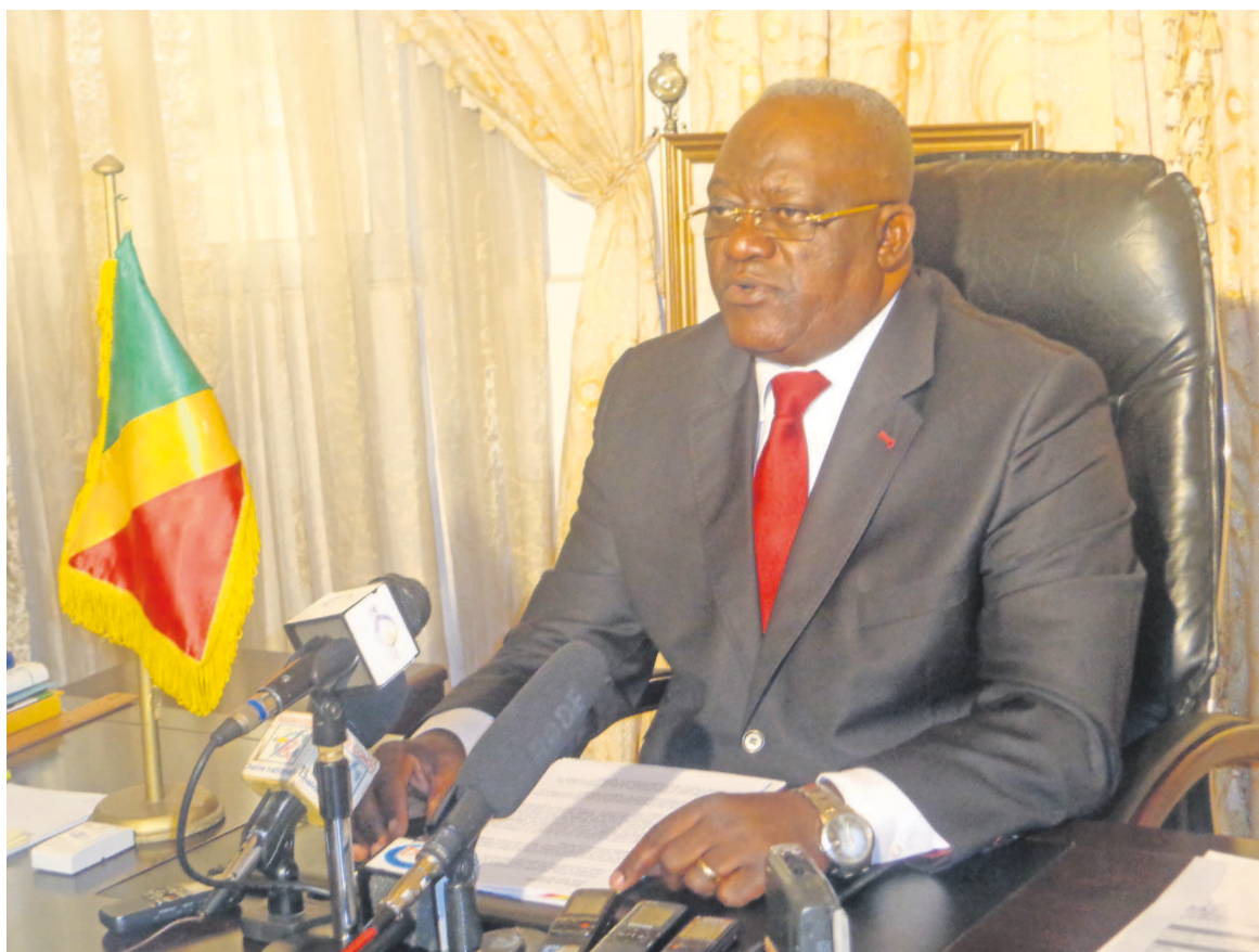
Léon Alfred Opimbat délivrant son message

Il a également apprécié la qualification sur tapis vert des Diables rouges seniors pour les éliminatoires de la CAN Maroc 2015 : « (...) Nous pouvons en conséquence être réconfortés par ces positions qui nous placent dans la perspective de redevenir africain. Il s'agit bien d'une tendance, pourvu que ce cap soit maintenu, pour que, après avoir atteint le fond, le principe d'Archimède nous contraigne à retrouver la surface », a commenté le ministre des Sports et de l'éducation physique.