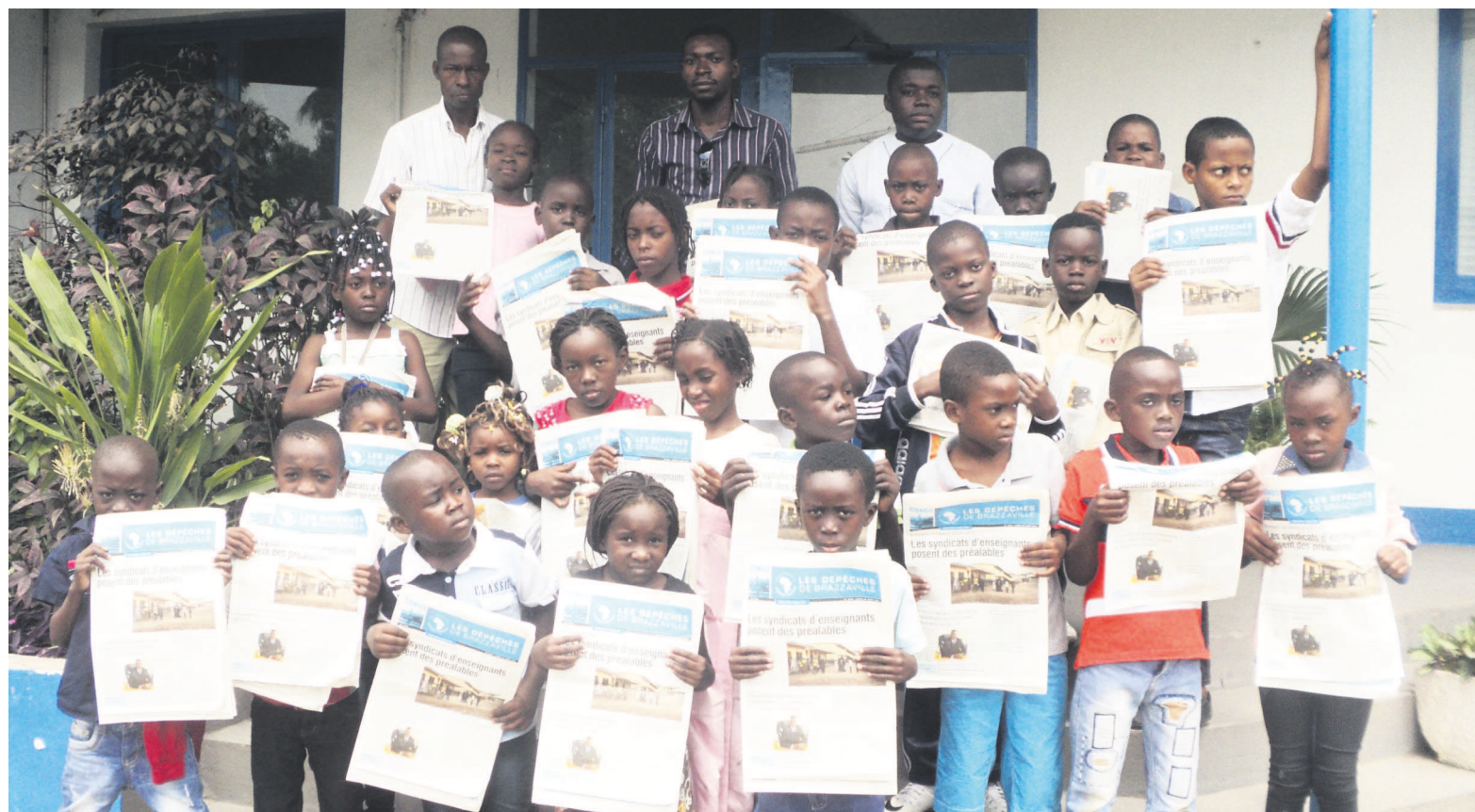
Une vue des élèves et encadreurs à l'issue de la visite

À l'imprimerie, les enfants ont découvert d'impressionnantes machines. Ils ont bouclé la visite par la galerie qui se trouve dans l'enceinte « Des Dépêches de Brazzaville », où sont exposés des milliers d'objets d'art, issus de la culture congolaise mais aussi bantoue, répandue sur l'Afrique entière. « Nous sommes venus ici pour voir comment on fabrique le journal Les Dépêches de Brazzaville, nous avons visi-