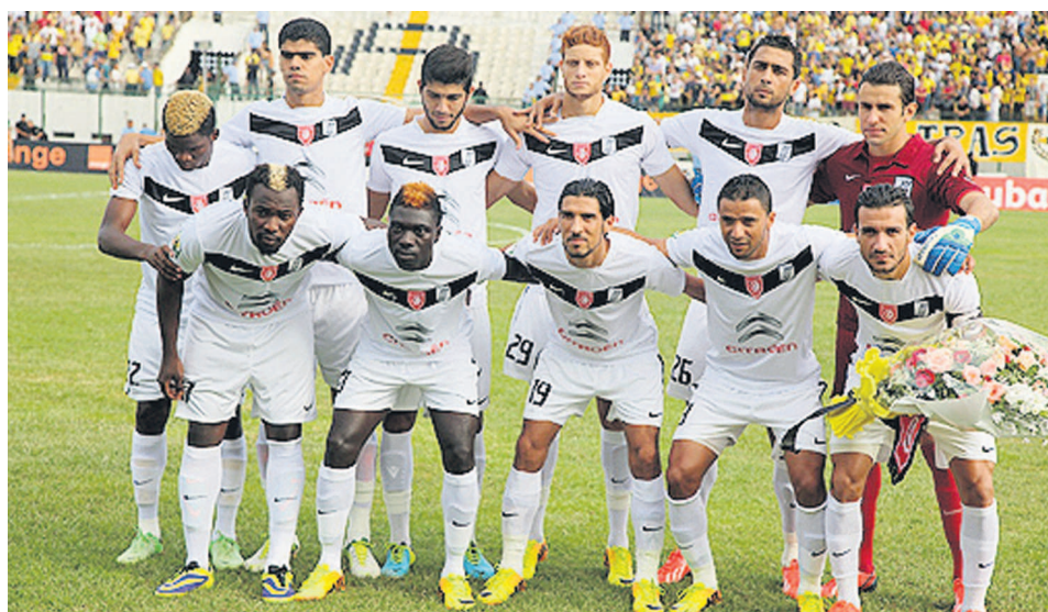
CS Sfaxien à Kinshasa

aux vols en provenance de l'Afrique de l'Ouest où a récemment resurgi l'épidémie. Le ministre de la Santé publique de la RDC, Félix Kabange Numbi a, dans une adresse à la Nation via les médias, insisté que le virus Ébola, certes présent dans la province de l'Équateur (à plus de 1000 km de la capitale), n'est pas à Kinshasa. Malgré cette annonce, une certaine psychose a gagné la capitale, mais sans gravité. Et la FTF a donc sauté sur l'occasion pour exiger la délocalisation du match contre V.Club qui a atteint la demi-finale de la Ligue des champions après plusieurs décennies. Mais à Kinshasa, l'opinion sportive fustige la démarche