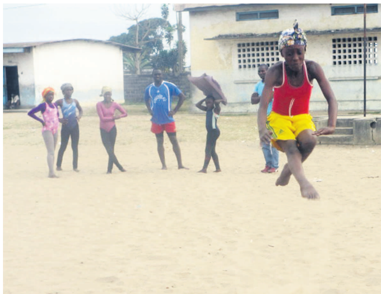
Une gymnaste en suspension pendant la réalisation d'un saut «adiac»

Dans l'objectif de défendre valablement le département de Pointe-Noire et du Kouilou au championnat national prévu en septembre à Brazzaville, les animateurs des clubs de gymnastique de la ville océane s'activent dans la préparation afin de faire les dernières corrections.