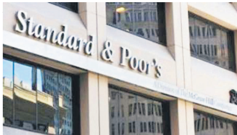
Le bâtiment de l'agence américaine Standard & Poor's

L'analyse de l'agence de notation Standard & Poor's concerne une vingtaine de pays dont elle assure la notation, notamment le Cameroun, le Nigéria, le Sénégal, la RDC et le Burkina Faso. Cette mise au point pour le moins inattendue faite le 27 août arrive au moment où les projections les plus crédibles confirment une révision à la baisse de la croissance économique dans les pays les plus touchés. Certes, les morts se comptent par milliers depuis le début de l'épidémie en décembre 2013, mais cela « n'a eu aucun impact immédiat sur la notation des vingt pays africains couverts par l'agence, notamment le Nigéria et la RDC où des cas d'infection ont été détectés ». Aussi l'épidémie est-elle « sans conséquences immédiates sur les notes souveraines attribuées aux