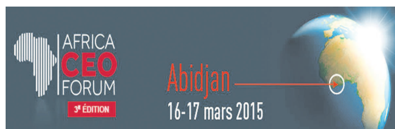
Le logo d'Africa CEO Forum

Abidjan, capitale économique ivoirienne, accueillera les 16 et 17 mars 2015 la troisième édition d'Africa CEO Forum, à l'occasion du cinquantième anniversaire de la création de la Banque africaine de développement et du retour de son siège en Côte d'Ivoire.