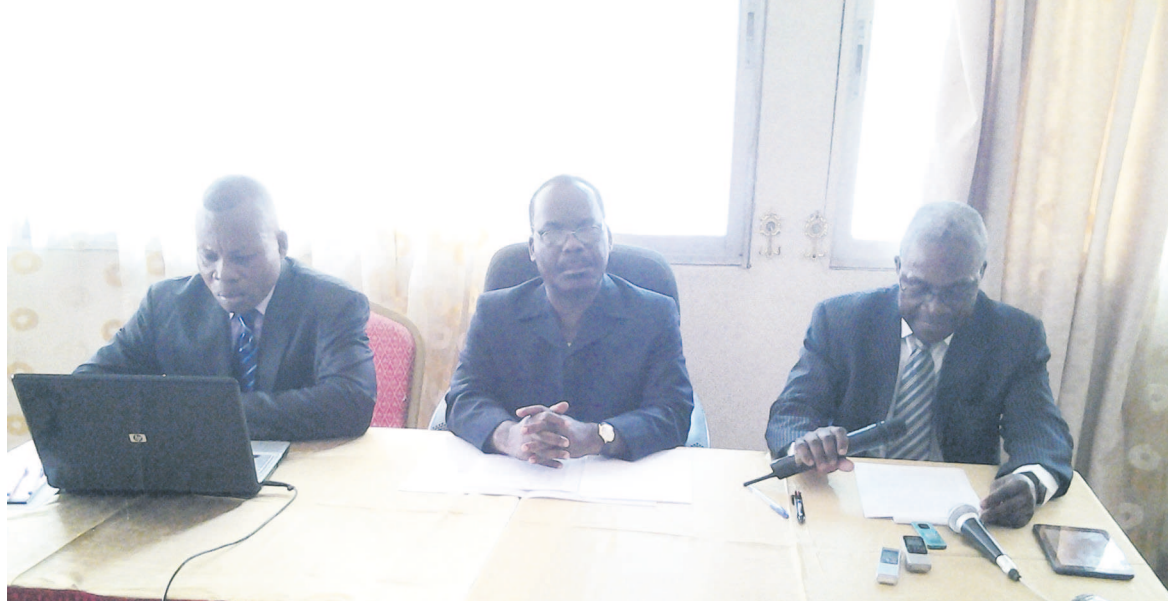
Le directeur de cabinet du ministre de l'Économie forestière au centre présidant la séance de travail

thème de « La lutte concertée contre le crime sur la faune et la flore en Afrique. »