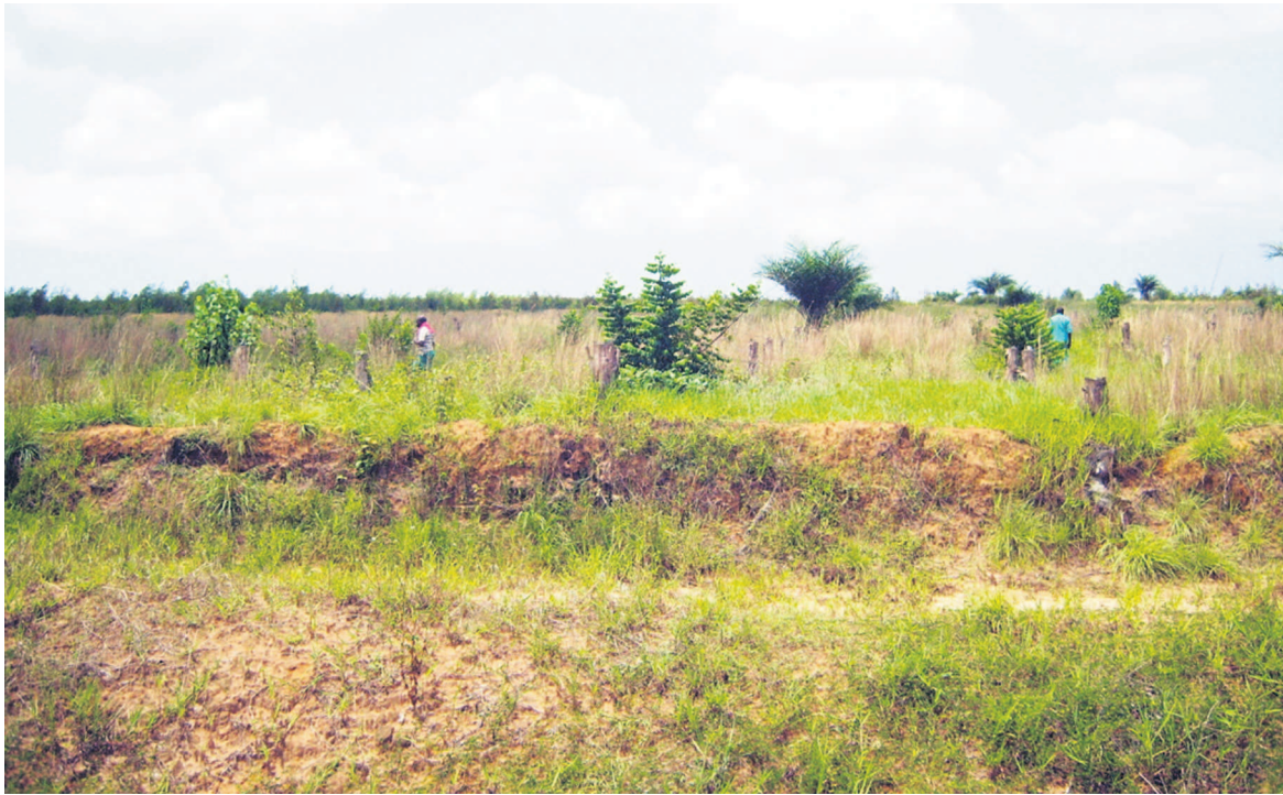
Une forêt victime de la déforestation à Pointe-Noire

Les femmes du RDHD ont pris l'engagement de se constituer Femmes leader dudit processus. Elles ont pris part à la séance de restitution de l'atelier REDD+ /Sauvegardes faite par Majep Obama, coordonateur du Réseau Développement Humain Durable (RDHD), le 24 août à Pointe-Noire.