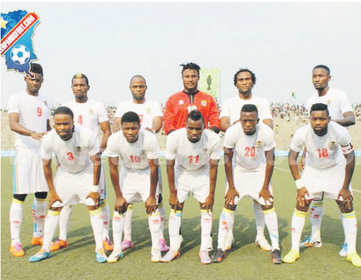
Les Léopards en match de préparation contre V.Club