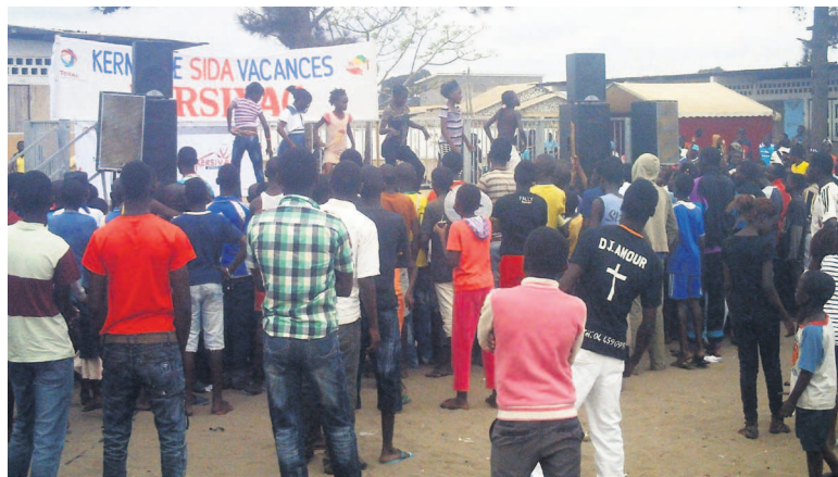
Les jeunes lors d'une scène de danse à la kersivac

Ouverte le 22 Août dernier, la 8e édition de la Kermesse sida vacances (kersivac) a pris fin le 31 Août au Collège Pierre Tchicaya de Boampire de Mpaka dans le 6e arrondissement Ngoyo à Pointe-Noire.