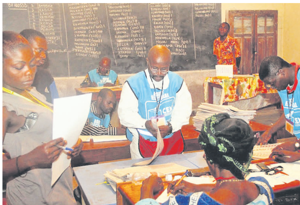
Dépouillement des bulletins dans un bureau de vote à Kinshasa

La Commission électorale nationale indépendante (Céni) est en passe de publier un calendrier global prenant en compte les scrutins de 2016. Tout serait déjà fin prêt, à en croire une source proche de l'institution. Si tout se passe bien, il est fort probable que ce calendrier soit publié entre fin septembre et début octobre. Toutefois, il y a encore des options qui doivent être levées par le Parlement par rapport à la feuille de route de la Céni, mais aussi par rapport aux quatre projets de loi que le gou-