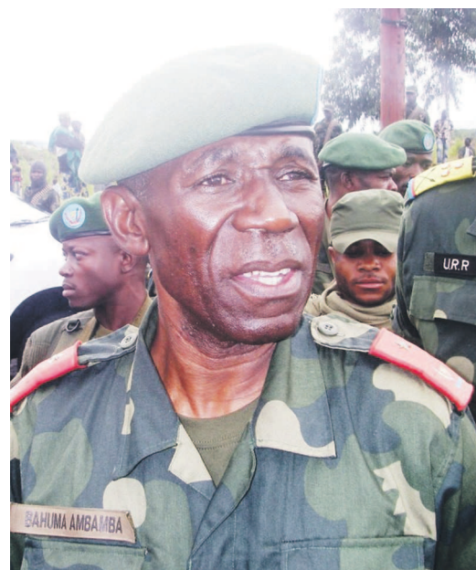
Le Général-major Lucien Bahuma Ambamba

Alors qu'il participait, avec son homologue ougandais, à une rencontre dans le cadre des consultations périodiques mixtes pour l'évaluation de la situation sécuritaire à la frontière commune, le général Bauma a été terrassé subitement par un accident cardiovasculaire cérébral dans la nuit du 28 au 29 août. Il a finalement rendu l'âme à l'hôpital sud-africain de Pretoria où il avait été évacué d'urgence à bord d'un avion médicalisé. Cette mort brusque a jeté le Nord-Kivu dans l'émoi, d'autant plus que cet officier supérieur était de toutes les opérations militaires initiées dans la province en vue de sa pacification. À la suite des épouses des militaires qui ont manifesté en improvisant une marche, les étudiants de l'Université de Goma ont investi les rues lundi pour exiger l'ouverture d'une enquête afin d'élucider les circonstances de la mort du commandant de la huitième région militaire. Page 12