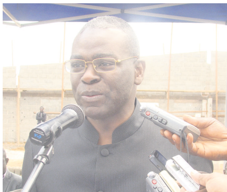
Le ministre Anatole Collinet Makosso

jeunes de Sibiti et l'assainissement de la ville de Sibiti en partenariat avec la mairie. En marge de cette activité, il a été organisé deux séminaires à l'in-