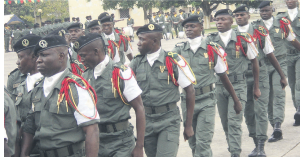
Les sous-lieutenants en pleine exercice de la parade militaire

La cérémonie marquant la fin de formation des soixante stagiaires venus du Bénin ; de la Centrafrique (RCA) et du Congo a été célébrée le 4 octobre, à l'académie militaire Marien Ngouabi, sous le patronage du général de brigade et commandant de la gendarmerie nationale, Victor Mouagni.