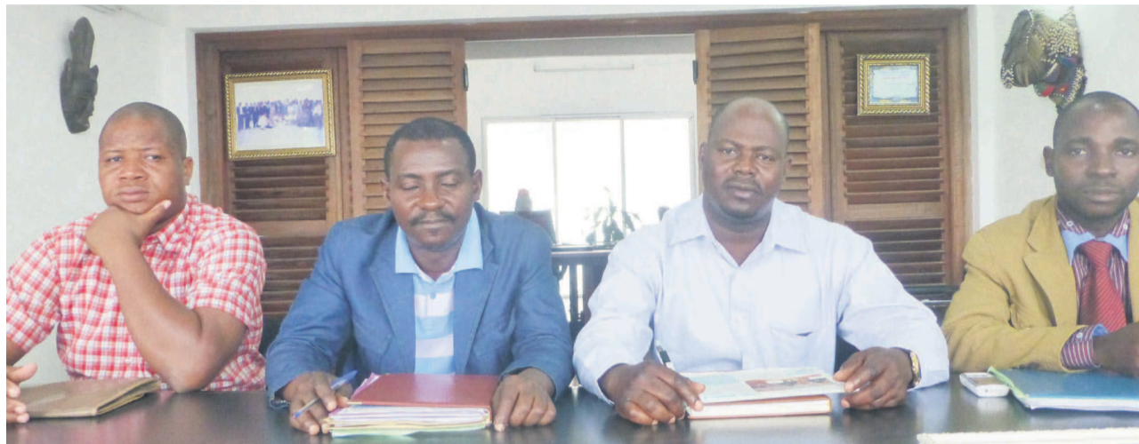
Des observateurs internationaux

Trois Organisations non-gouvernementales (ONG) du Togo ont dépêché une mission pour observer et évaluer le processus électoral au Congo, au regard des normes internationales. Cette mission a fait une déclaration préliminaire le 3 octobre à Brazzaville.