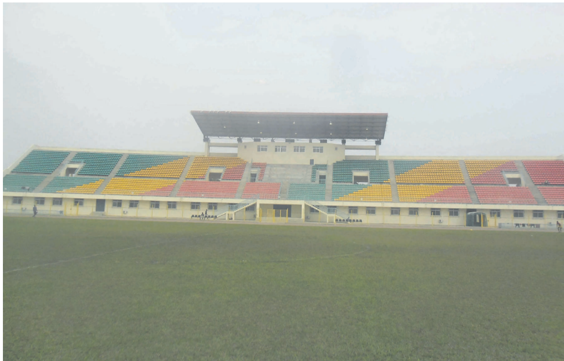
Le stade d'Ewo

« On a fait un super match sur un terrain très difficile qui ne permet pas de jouer au football comme on devrait le jouer. C'est une pelouse synthétique indigne du haut niveau international. Il y a de faux rebonds. Ceux qui n'ont pas joué au football ne peuvent pas se rendre compte. C'est très difficile pour les joueurs de football qui aiment jouer sur une touche pour pratiquer le football qu'on veut développer. On est obligé de contrôler parce qu'il y a tellement de mauvais rebonds. C'est des terrains qui compliquent les équipes locales dans les matches à domicile », s'indignait Claude Le Roy après la victoire 3-0 contre la Namibie. Même constat au stade Denis-Sassou-N'Gouesso à Dolisie. Alors, quelle pièce de rechanges pour ces trois stades, si l'on n'accorde pas du crédit à d'autres infrastructures existantes ? Des initiatives pour homologuer d'autres stades s'imposent. Les aires de jeu de ces enceintes obéissent à des normes. Leur utilisation fera de telle sorte que le football soit vécu partout. L'équipe de France par exemple ne se contente