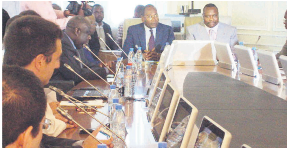
Les deux ministres entrain de suivre la présentation du projet

L'étude a permis de recueillir des informations nécessaires pour permettre surtout aux collectivités locales de disposer d'un outil de gestion du foncier et du cadastre. La séance de travail a eu lieu le 3 octobre à Brazzaville.