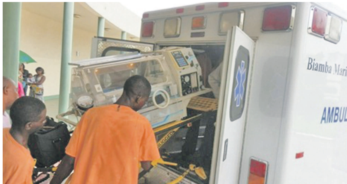
Installation d'une couveuse dans une des ambulances médicalisées de l'HBMM