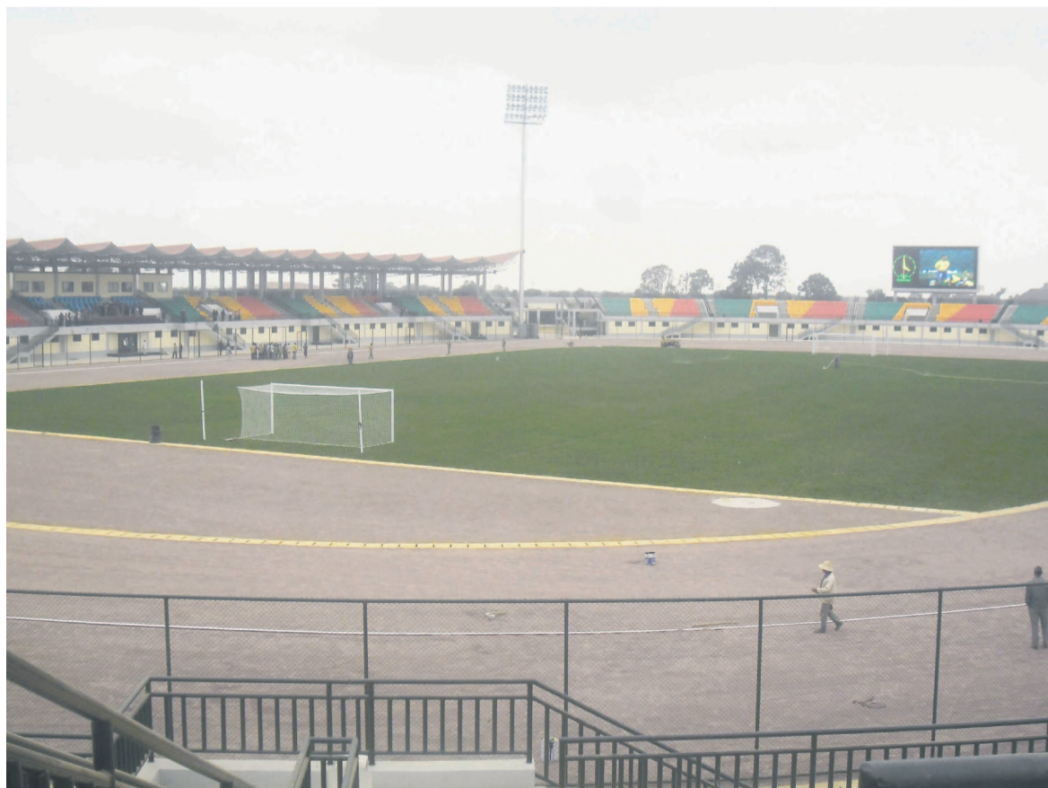
LE stade de Djambala