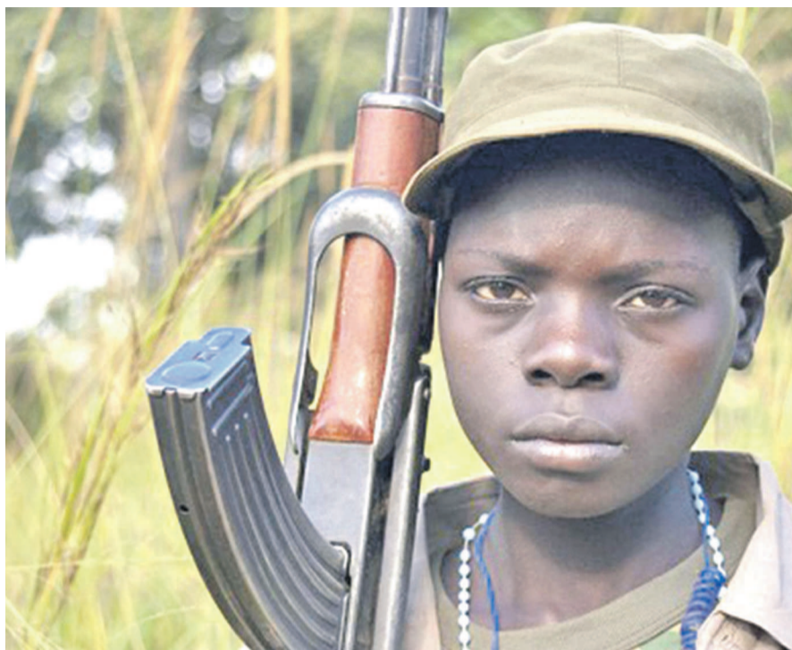
Un enfant soldat

Les États-Unis d'Amérique viennent de décider d'alléger ses sanctions à l'encontre de quelques pays d'Afrique accusés de recrutement présumé d'enfants soldats. La rupture d'aide militaire de la première puissance mondiale à l'endroit de ces pays les a desservis au point d'affecter leurs armées respectives. Conscient de cet état de chose et pour contribuer à l'émergence des armées africaines en proie aux forces négatives, les États-Unis ont opté pour un régime allégé des sanctions à l'encontre notamment de la République centrafricaine (RCA), de la République démocratique du Congo (RDC) et du sud-Soudan. Le département d'État américain qui a annoncé