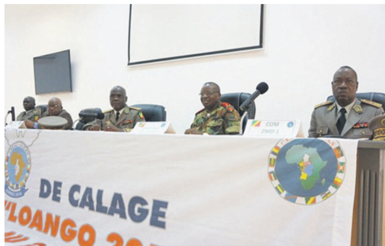
Tribune officielle de la réunion

Le communiqué final des travaux de cette réunion stipule que l'objectif général de ces assises était de vérifier et de s'assurer avant le début de la projection des troupes, de la cohérence globale