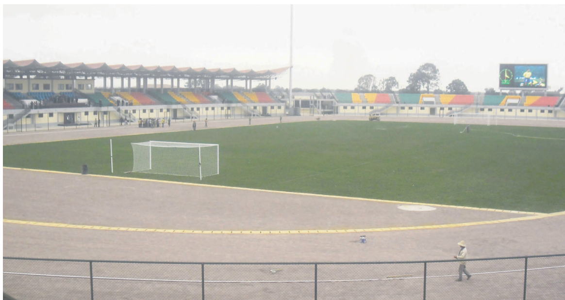
Le stade de Djambala

Malgré des investissements remarquables dans la construction d'infrastructures ayant porté le nombre de stades modernes de deux à huit, le sport congolais ne tire jusqu'ici pas un grand bénéfice de ces efforts de l'État. Les plaintes ne cessent de fuser sur le mauvais état des terrains de football de Brazzaville, Pointe-Noire et Dolisie, les seuls homologués par les instances du football international. Les attermoissements du processus d'homologation des stades et les insuffisances dans la mise en valeur de ces infrastructures devraient préoccuper à plus d'un titre les autorités sportives nationales. Page 16