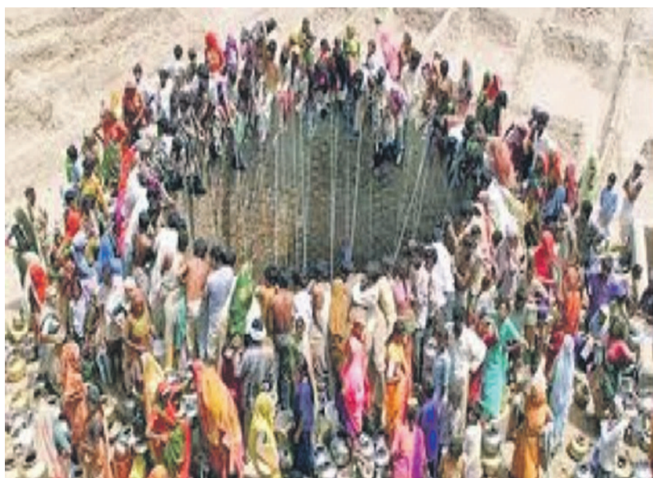
L'accès à l'eau devenu difficile à Luozi

L'eau c'est la vie, dit-on, mais à Luozi, cette denrée vitale ne coule plus des robinets des habitants de cette cité située dans le district des Cataractes dans la province du Bas-Congo.