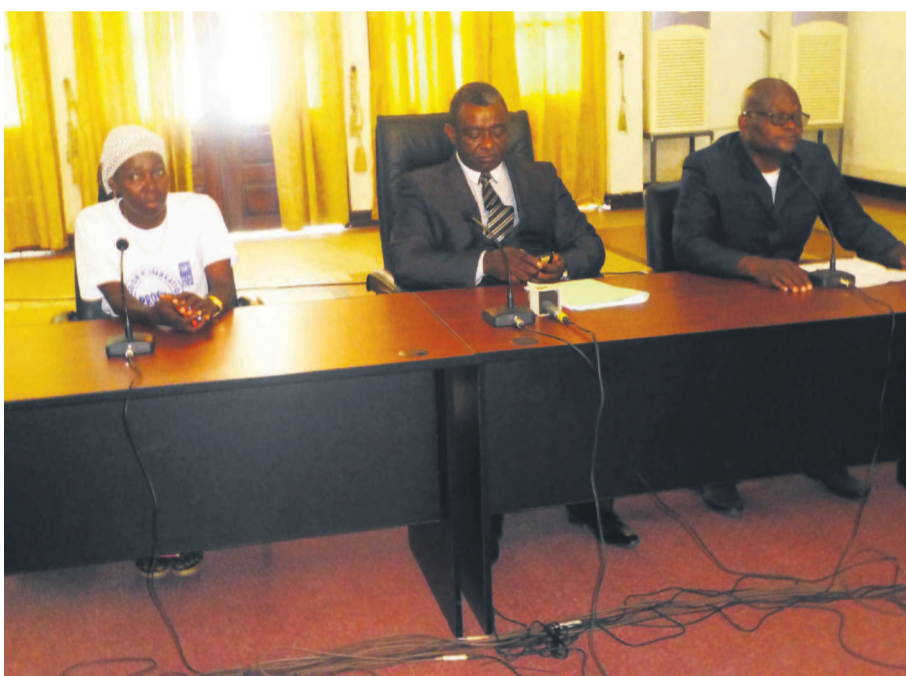
Les observateurs de la Proseac

consultation électorale du 28 septembre a été libre, transparente et relativement équitable. Par ailleurs, elle a exhorté les institutions compétentes à assurer avec la dernière rigueur les opérations de compilation et de proclamation des résultats, ainsi que la gestion rationnelle, le cas échéant, du contentieux électoral. Dans le but de susciter à l'avenir les taux de participation plus élevés du corps électoral, la