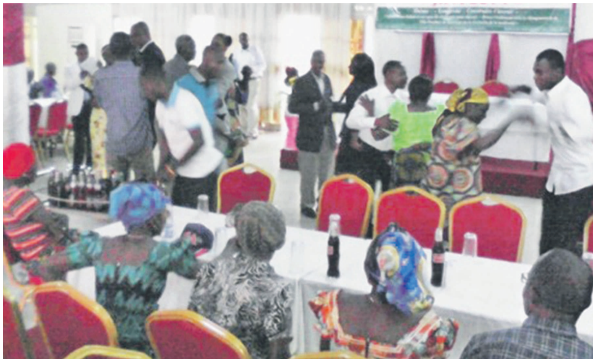
Des pas de danse pour manifester la joie

Vieillesse heureuse, qui s'est appuyée sur les rapports de ses enquêteurs socio-sanitaires dans les zones post-conflit, a noté que l'exposition des personnes âgées à plusieurs dangers, menaces et tracasseries. C'est pourquoi la fin de la guerre a été considérée comme une occasion de fêter. « Aujourd'hui, sous l'impulsion et la détermination du chef de