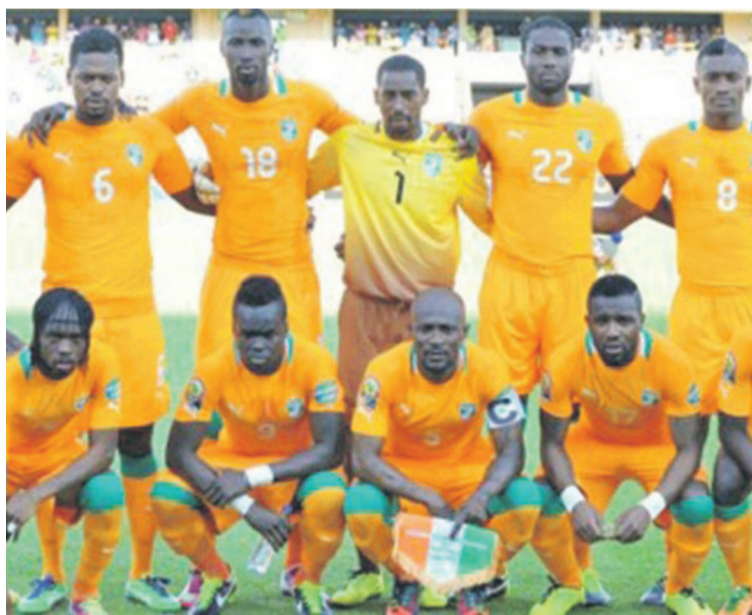
Les Éléphants de la Côte d'Ivoire

Les Léopards de la RDC accueillent, le 11 octobre, au stade Tata Raphaël de Kinshasa les Éléphants de la Côte d'Ivoire, en match de la troisième journée du groupe D des éliminatoires de la Coupe d'Afrique des Nations (CAN) Maroc 2014. Et la quatrième journée aura lieu quatre jours plus tard, soit le 15 octobre, à Abidjan. Alors que l'on attend encore la publication officielle de la liste des Léopards qui aurait déjà été élaborée (et publié dans la presse récemment) par le staff