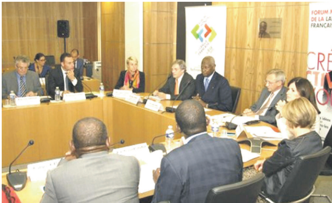
Une vue de la réunion à Paris

La première réunion du comité d'orientation du 2e Forum mondial de la langue française, qui aura lieu à Liège (Fédération Wallonie-Bruxelles) du 20 au 23 juillet 2015, s'est tenue au siège de l'OIF le 29 septembre. Le Forum mondial se déroulera sur le thème « Francophonie créative » qui se déclinera en cinq axes : l'éducation, l'économie, la culture et les industries culturelles, la relation entre langue et créativité et la participation citoyenne. À ce sujet, Abdou Diouf a rappelé les actions menées en matière d'innovation au sein de la Francophonie et le potentiel créatif des francophones que le Forum permettra de mettre en lumière. Il a également souligné l'importance de la société civile et des jeunes pour que l'avenir puisse être pensé en français. Le comité, indique l'OIF, aura pour mission d'examiner et de valider le projet de programmation du Forum.