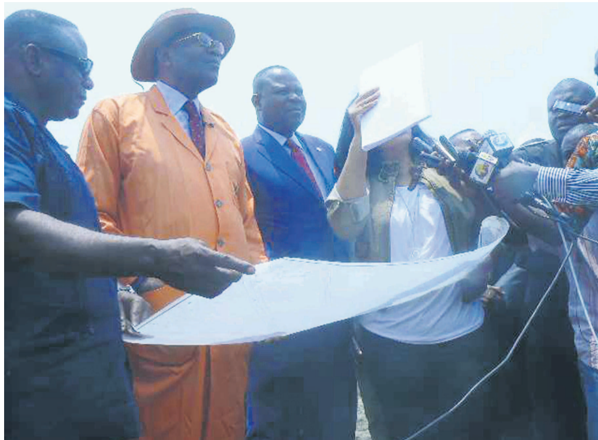
Visite par des ministres du site devant abriter le «projet Terre École»

Le ministre des Affaires Foncières et du Domaine Public, Pierre Mabiala, a déguerpi, le 2 octobre à Kintélé, dans la sous-préfecture d'Ignié, sur un espace terrien de quatorze hectares, des délinquants domaniaux ayant occupé le site du projet Terre Ecole