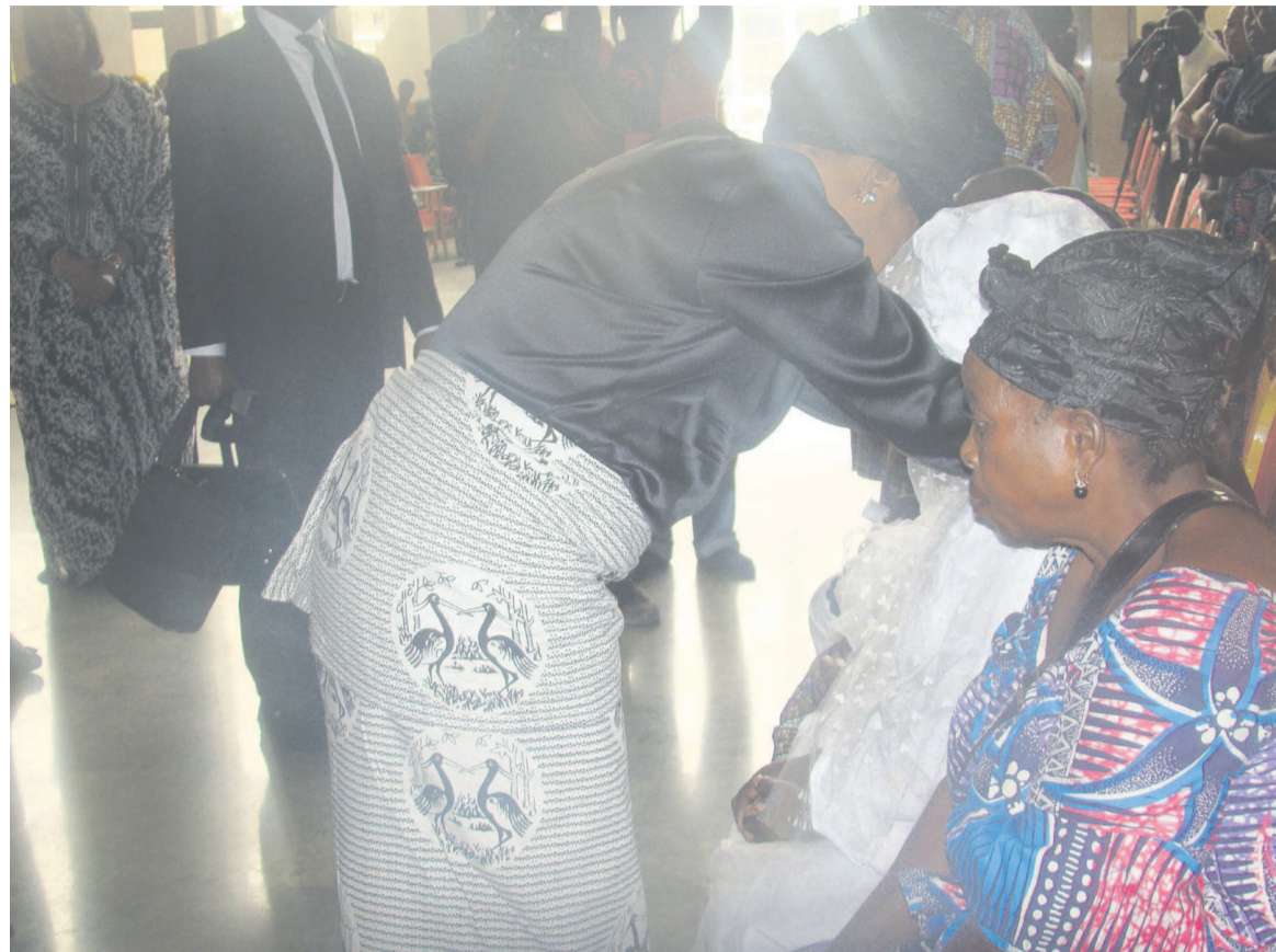
Antoinette Sassou N'Guesso réconfortant la veuve et les enfants de l'illustre disparu