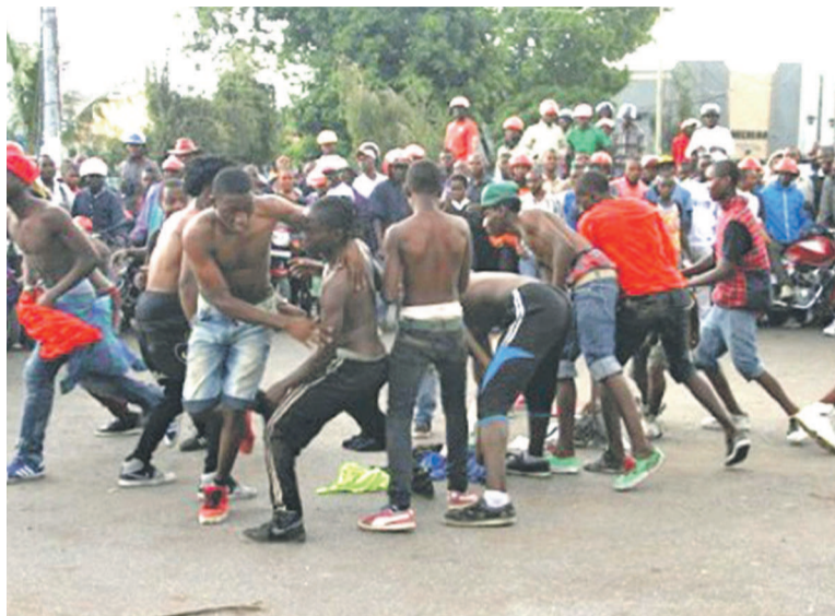
Des jeunes danseurs dans la rue de Goma lors du «Flash Mob de Danse»

Au total, trente danseurs ont été mobilisés dans les grandes artères de Goma. Sur l'axe Saké-Goma, ils se sont postés à Ndoshu, Katindo (entrée du musée). D'autres se sont produits au rond-point Insti-