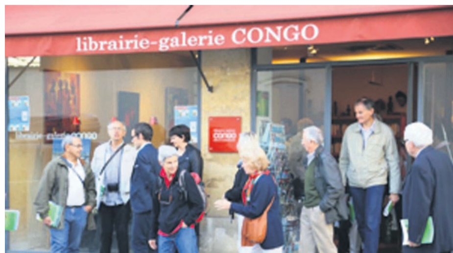
Membres du Comité de jumelage Reims-Brazzaville après la visite de la Librairie galerie Congo

Lors d'une visite exceptionnelle samedi 27 septembre, la délégation du Comité de jumelage Reims-Brazzaville a pu découvrir un échantillon de la dimension littéraire, artistique et culturelle du Bassin du Congo.