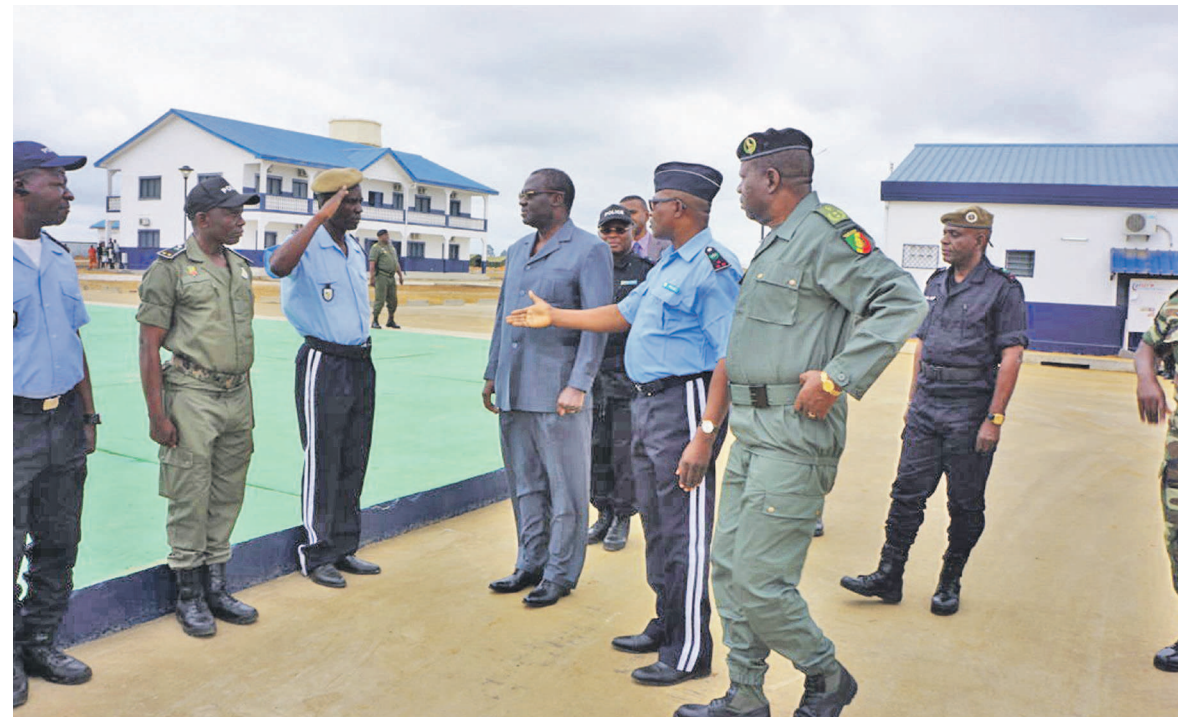
Le ministre et sa suite visitant les infrastructures de la gendarmerie et de la police

Dans le cadre des préparatifs de l'exercice militaire Loango 2014, prévu dans quelques jours dans le département du Kouilou, le ministre de la Défense nationale, Charles Richard Mondjo, est descendu le dimanche 5 octobre sur les différents sites devant abriter les contingents militaires attendus pour cet exercice.