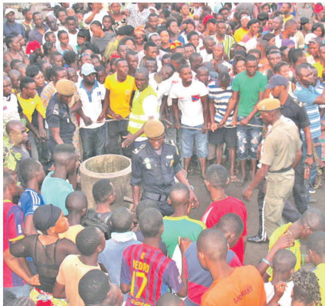
Les gens autour du puits pendant le drame

L'accident qui a coûté la vie à l'infortuné Nzaka Magué s'est produit le 3 octobre en fin de journée au quartier Mbota Rock dans le 4 e arrondissement Loandjili, à Pointe-Noire.