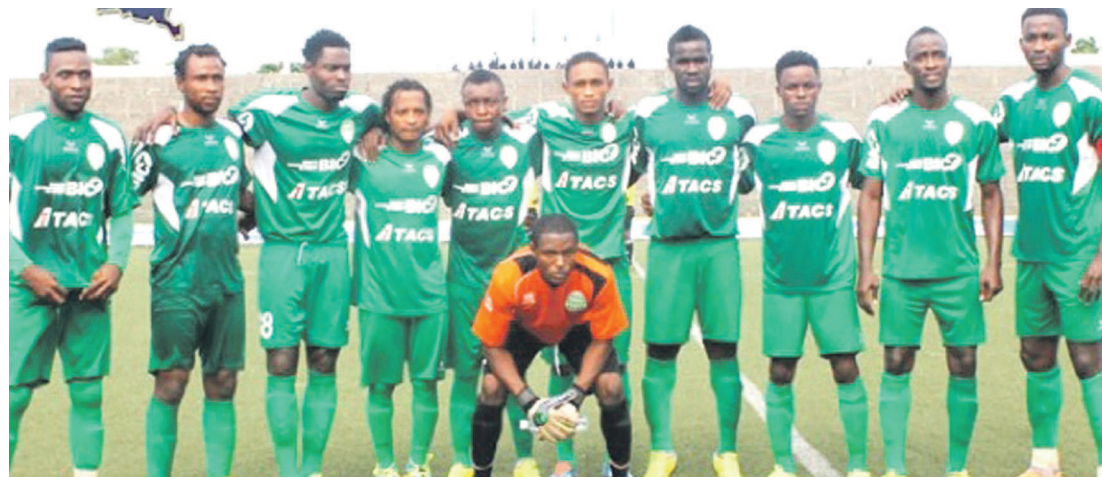
DCMP victorieux de Rojolu en première journée de la Division 1

Les Immaculés du DCMP ont remporté leur premier match de la Division 1 pour la saison 2014-2015 dans le groupe A, en dominant SC Rojolu par trois buts à un. Dans le groupe B, c'est la formation de Groupe Bazano de Lubumbashi qui est allé s'imposer à Kisangani en Province Orientale face à l'AS Nika par deux buts à un.