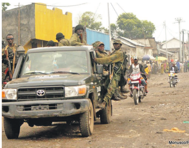
Les ex-rebelles du M23 à Goma

Nonobstant les appels incessants des ONG des droits de l'Homme exhortant le Parlement congolais à adopter un avant-projet de loi relatif à la création des chambres spécialisées mixtes chargées de juger les responsables d'atteintes graves aux droits humains, ces structures tardent encore à être mises en place. Aujourd'hui près de quatre ans viennent de s'écouler depuis la publication du Mapping Report de l'ONU, sans que ces entités ne puissent voir le jour en RDC. Il a été