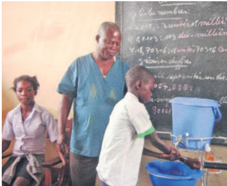
Un élève de 4 e primaire en plein exercice pratique de lavage des mains sous l'œil vigilant du relais communautaire

Sachant que le lavage des mains au savon se révèle comme « le moyen le plus efficace et le moins coûteux de prévenir les maladies diarrhéiques et les pneumonies », Save the children a voulu encourager 5 000 élèves à adopter cette pratique. L'opération menée dans les écoles primaires, notamment à l'EP Matadi Mayo située dans l'aire Mosalisi avec le concours des relais communautaires, répétée dans plusieurs autres établissements scolaires de la même zone de santé périurbaine visait à le faire savoir. Ce d'autant plus que, apprend-on, « les enfants demeurent les premières victimes des maladies liées au manque d'accès à l'eau potable, au manque d'assainissement adéquat et à l'insuffisance d'hygiène ». Save the children a initié sa campagne sur base de deux études significatives de