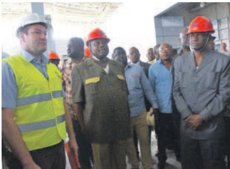
Le ministre et sa suite visitant les travaux du nouveau siège de l'aéroport de Pointe-Noire

Nous disposons de films et de photos qui illustrent qu'avant la construction de ce poste de péage, ces alentours furent uniquement constitués de forêts ar-