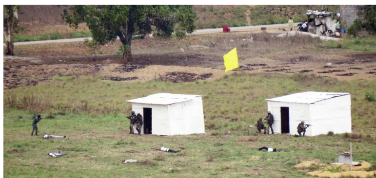
Démonstration d'une manœuvre par les soldats de la FOMAC