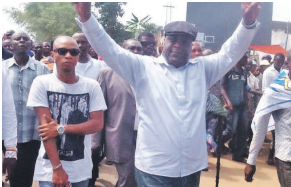
Félix Tshisekedi en tournée de redynamisation du parti à l'intérieur du pays