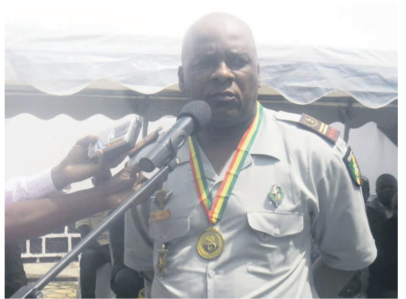
Le directeur général de la sécurité présidentielle, président de la commission d'organisation de la compétition

La Direction de la Protection (DP) s'est mesurée à la coalition DT, DAAF, DD, DRH, et DVP. Lors de la finale de cette discipline, la force de la coalition n'a pas suffi à vaincre la DP qui a su stopper les offensives de la coalition pour finalement s'imposer 14 à 4. Le ballon militaire, soulignons-le, diffère du football. Il est plutôt proche du rugby. Le ballon militaire se joue certes sur un terrain de football avec les mêmes dimensions, le même ballon et les mêmes buts. Seulement, tout se joue à la main à l'image du rugby. Les touches de ball par les pieds sont des fautes. C'est ce qui ex-