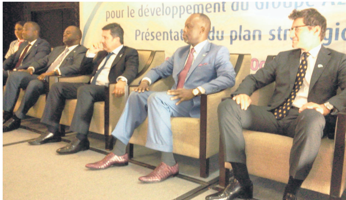
Le président directeur général du groupe Azur Télécom Congo (costume bleu) entouré des autres directeurs

La rencontre a été organisée dans l'objectif de présenter le plan stratégique du réseau unique Azur Télécom en République centrafricaine (RCA), Gabon et au Congo. Elle visait également d'annoncer le souhait d'acquisition des nouvelles technologies aux investisseurs afin d'offrir les meilleurs services à ses clients. Étaient à ce forum, les investisseurs afin de solliciter leur appui, les directeurs du groupe Azur de la RCA, du Gabon et du Congo ainsi que leur partenaire Monaco Télécom International. Il a été marqué des communications portant sur les volets