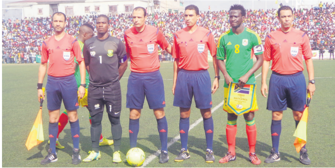
Senzo Robert Meyiwa et Delvin Ndinga avec les officiels du match Congo-Afrique du sud à Pointe-Noire

Senzo Robert Meyiwa, le gardien capitaine des Bafana-Bafana avait 27 ans lorsqu'il a trouvé la mort le 26 octobre lors d'une attaque à main armée.