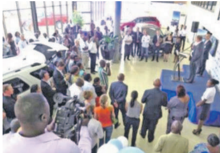
Installation de Katanga Motors

Les modèles en compétition sont adaptés à la particularité de la province minière très prisée avec la croissance qu'enregistre le secteur minier ces dernières années. En effet, plusieurs nouveaux sites miniers vont entrer en production, et les prospections se poursuivent. Face aux perspectives