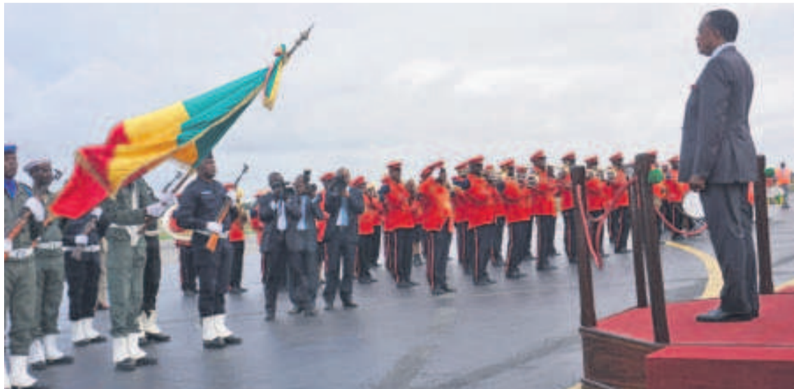
Le président de la République recevant les honneurs militaires; le président de la République saluant le foule à sa sortie de l'aéroport

C'est exactement à 16 heures 30 minutes que Denis Sassou N'Gouesso a foulé le sol ponté-negrin où un accueil chaleureux