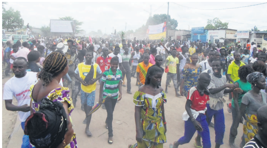
La foule suivant le cortège