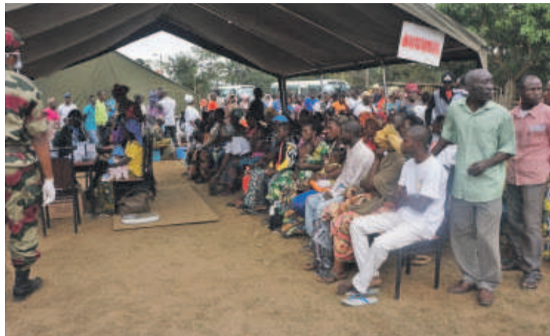
Les malades en plein consultation à l'hôpital érigé pour la circonstance

Dans le cadre des actions civilo-militaires de ladite opération, un hôpital médico-chirurgical de campagne a été mis en place au village Matombi, dans le Kouilou, en vue de subvenir aux besoins sanitaires des populations locales. Cette structure a été visitée ce lundi 27 par l'ensemble des autorités civiles et militaires des pays membres de la Communauté économique des États de l'Afrique centrale (Céecac).