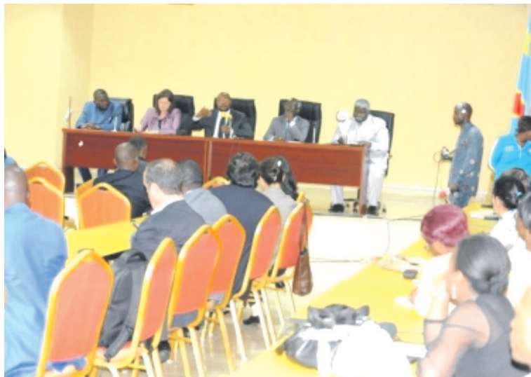
Le ministre de la Santé publique (au milieu) annonçant la fin de l'épidémie

Malgré que la RDC ait vaincu le virus Ebola, le ministre de la Santé appelle à la vigilance. « La fin de l'épidémie que j'annonce ce jour ne signifie pas que le danger est totalement écarté, la RDC reste comme tous les autres pays du monde, sous la menace des cas d'importation de la maladie à virus Ebola sévissant en Afrique de l'Ouest. En plus, notre écosystème nous oblige à être en permanence en alerte dans le pays »,