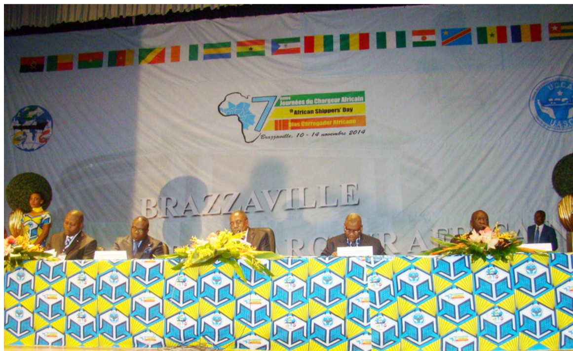
Une vue des responsables lors des 7 es journées du chargeur africain

La recommandation figure parmi les neuf adoptées par les 7 es journées du chargeur africain qui se sont achevées le 14 novembre à Brazzaville. L'objectif étant de faciliter les échanges au sein du continent et développer le commerce extérieur interafricain.