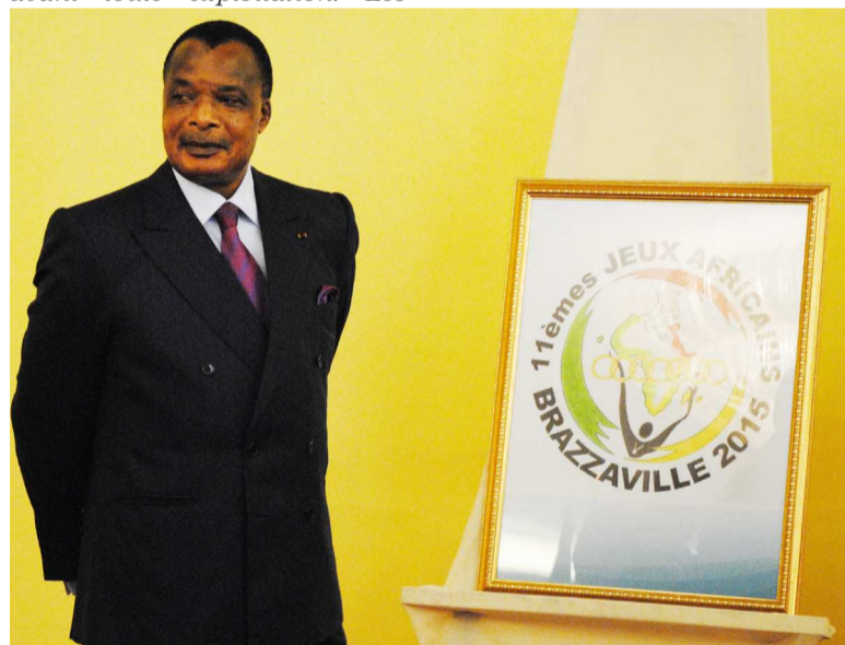
Le logo des Jeux africains dévoilé par le président de la République

Cette cérémonie s'est déroulée en marge de l'ouverture de la réunion conjointe réunissant la Commission de l'Union africaine, l'Acnoa, l'Ucsa et le Coja Brazzaville qui se tient du 17 au 19 novembre. Les experts font le point sur les préparatifs des 11e Jeux africains. Ils vont visiter des installations prévues pour les jeux et procéderont à l'approbation des disciplines à retenir pour les jeux, des effectifs des officiels techniques, des règlements techniques des disciplines retenues.