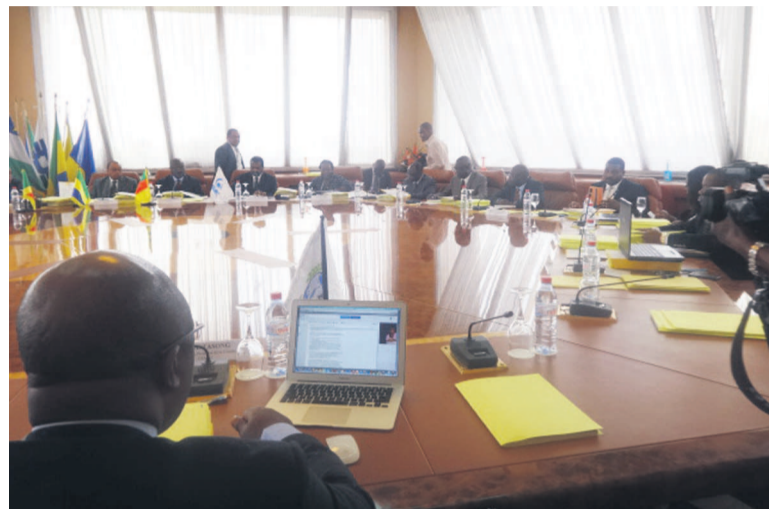
La réunion du conseil d'administration, photo Adiac

La Banque de développement des États de l'Afrique centrale (BDEAC) a reçu mandat d'organiser une table ronde pour le financement des infrastructures, car la sous-région a un grand besoin d'infrastructure de base.