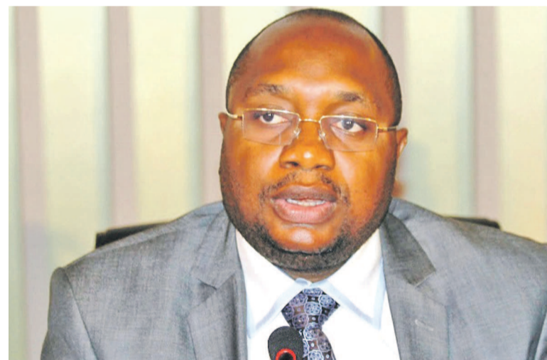
Félix Kabange Numbi, ministre de la Santé

(Liberia, Sierra Leone et Guinée-Conakry) où l'on a enregistré plus de cinq mille morts. « Depuis le 4 octobre 2014, aucun nouveau cas confirmé de la maladie à virus Ebola n'a été enregistré dans le territoire de Boende, soit quarante-deux jours de recherche active des cas, quarante-deux jours de surveillance intense et quarante-deux jours de sensibilisation des communautés », a déclaré le ministre. Page 20