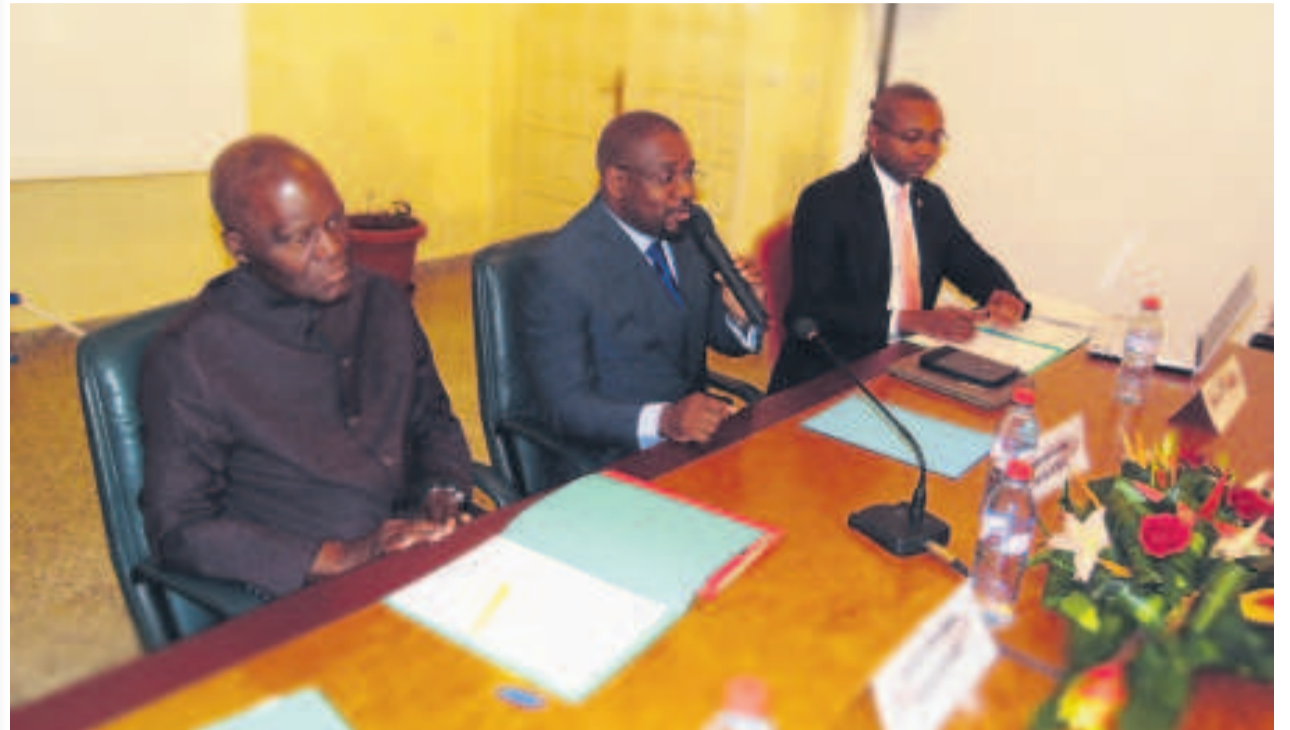
Le présidium du secrétariat permanent lors de la réunion

Réuni en session ordinaire le 14 novembre à Brazzaville, le secrétariat permanent du Club-2002 PUR (Parti pour l'Unité et la République), a fait son bilan post-électoral après examen du rapport sur lesdites élections.