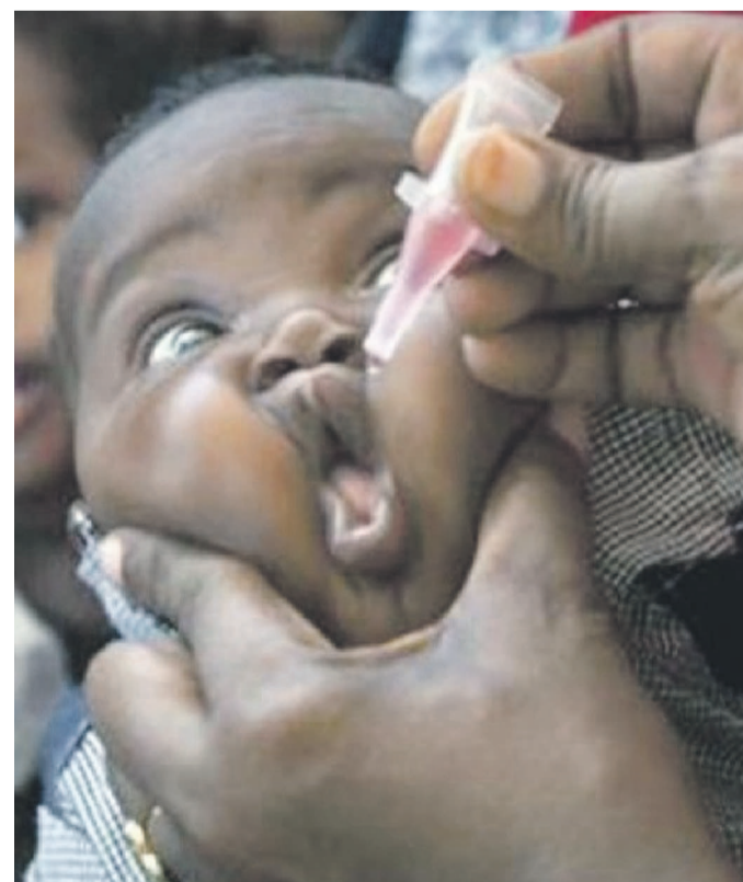
Un enfant en plein vaccination