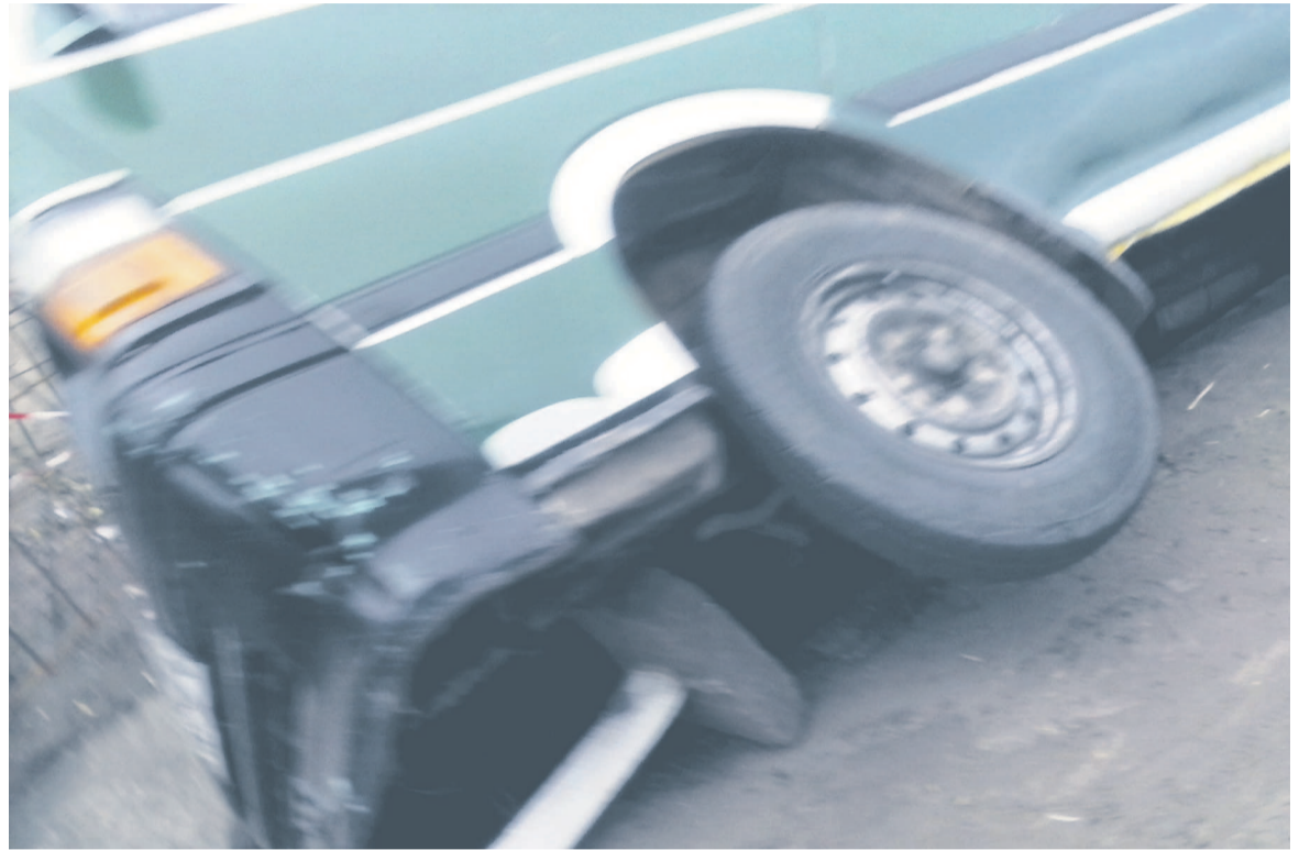
Un bus tombé dans le caniveau à la hauteur de l'arrêt La Ferme à Mikalou II

La DGTT mène actuellement une campagne de sensibilisation et de conscientisation à l'endroit des automobilistes. Cette sensibilisation vise à éduquer les chauffeurs afin qu'ils adoptent des comportements responsables, en interdisant entre autres, l'utilisation