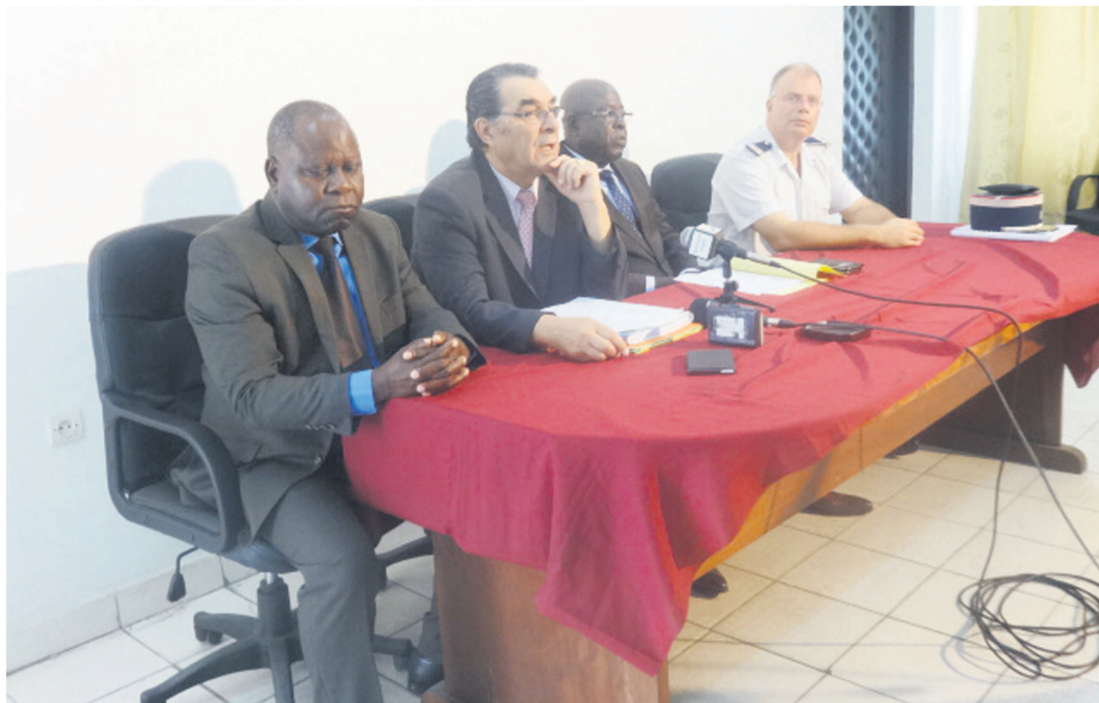
Les organisateurs de la formation photo Adiac