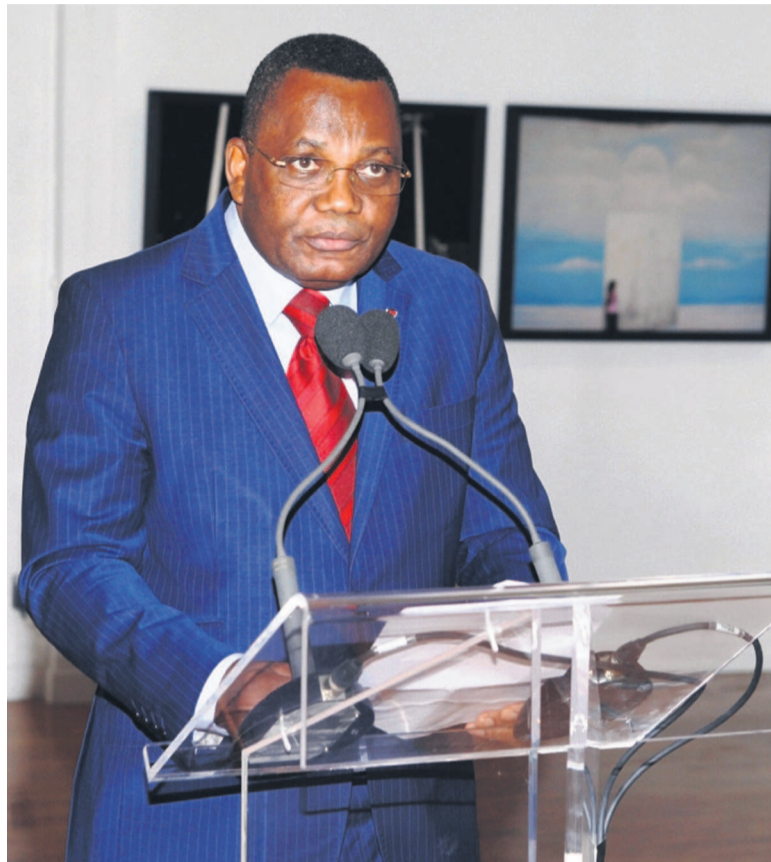
Le ministre Jean-Claude Gakosso