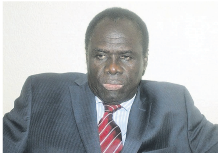
Michel Kafando

Proposé par l'armée aux côtés de l'archevêque Paul Ouédraogo et de