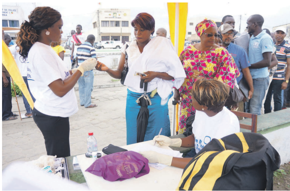
Vue des personnes en plein dépistage

Le club sportif La Colombe a organisé, le vendredi 14 novembre, des tests gratuits de dépistages du diabète auprès des habitants de la ville océane. Objectif : maîtriser le taux de glycémie ou de sucre chez chacun des patients consultés.