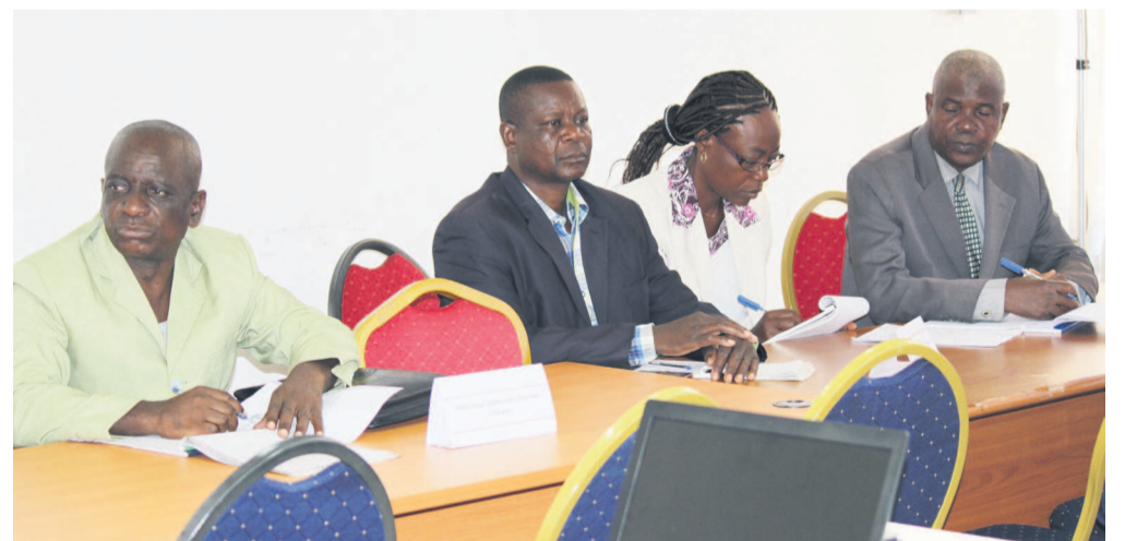
Les participants du ministère du Sport

Les directeurs des études et de la planification (DEP), les membres des Cellules de gestion des marchés publics (CGMP) et les gestionnaires de crédits des ministères se forment à la préparation et la planification des marchés publics.