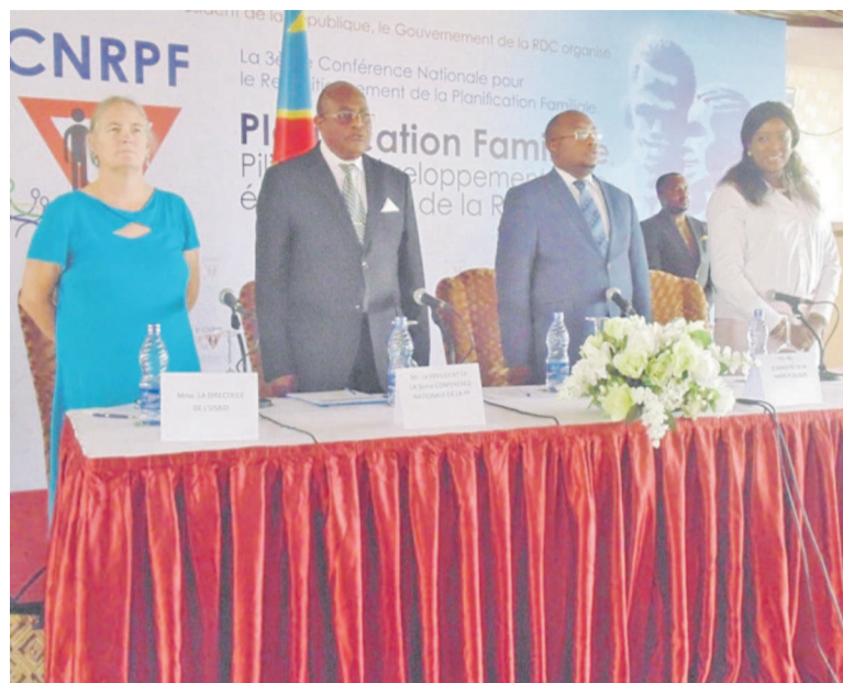
Cérémonie d'ouverture de la 3 e conférence sur le repositionnement de la planification familiale

Durant quatre jours, soit du 2 au 5 décembre, la question de la planification familiale retiendra l'attention de tous les participants à cette troisième conférence. Trois sous-thèmes seront ainsi décortiqués, à savoir Planification familiale et dividende démographique, Jeunes et planification familiale, Secteur privé et religion. L'importance de la planification familiale dans le développement du pays et, par ricochet, dans la lutte contre la mortalité infantile et maternelle pour la réalisation des objectifs du millénaire pour le développement n'est plus à démontrer. Tous les orateurs qui ont tour à tour succédé à la tribune l'ont reconnu. Pour la représentante de l'UNFPA, Diene Keita, considérée comme un achat recommandé parmi les investissements dans le secteur de la santé, la planification familiale est l'une des interventions les plus rentables. Selon elle, les pays qui investissent dans la planification familiale récoltent des avantages immédiats dans le domaine de la santé et de l'éducation avec des bénéficiaires qui couvrent aussi bien le domaine social que celui de l'environnement qui ont des répercussions bien au-delà d'une seule génération. Pour soutenir les activités de la planification familiale en RDC, l'UNFPA, souligne-t-elle, alloue annuellement dix millions de dollars américains