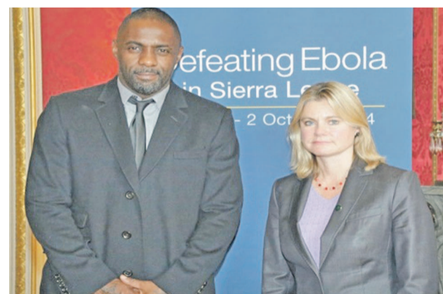
Idris Elba et Justine Greening, secrétaire d'État britannique au Développement international lors d'une conférence sur Ebola

de sensibilisation et à la création de la campagne « Unis pour l'Afrique », nous aiderons, quelque peu, les agents de santé à recevoir le soutien dont ils ont besoin et assurerons la diffusion des messages de prévention auprès des populations. Nous allons vous soutenir », a déclaré Idris Elba, acteur et la force créative derrière le développement de la campagne de sensibilisation. S'entraîner pour vaincre Ébola Dans un autre spot de la campagne intitulé « L'Afrique de l'Ouest contre Ébola », l'acteur britannique joue le rôle d'un entraîneur de football s'adressant à son équipe ouest-africaine juste avant leur match décisif contre Ébola. L'initiateur de la campagne décline ainsi les symptômes du virus Ébola et les tactiques requises pour le vaincre, y compris le travail en équipe et une communication accrue. « J'ai voulu soutenir cette campagne pour de nombreuses raisons. Je ne pouvais pas rester les bras croisés et ne rien faire pour aider à lutter contre Ébola. Il est important que nous ne traitions pas Ébola comme un sujet de discussion