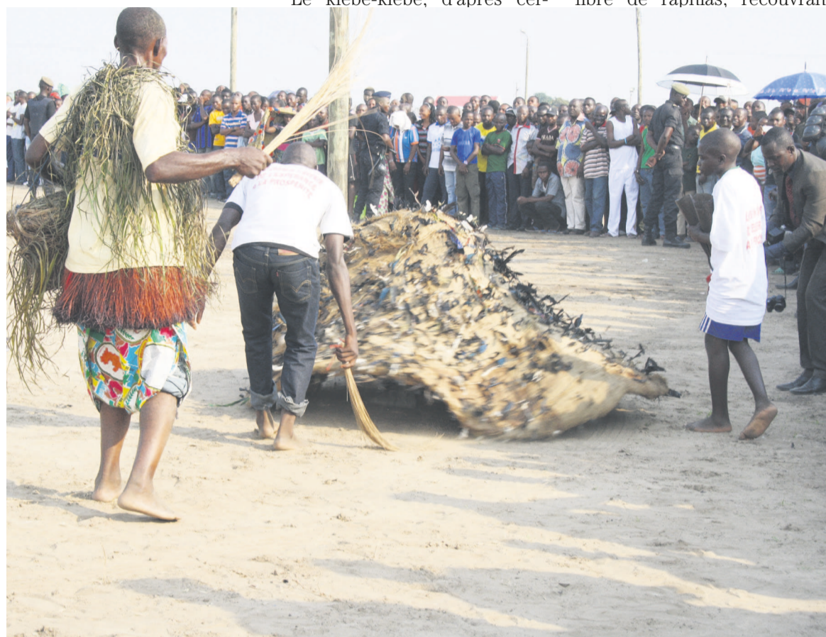
Une exhibition de la danse Kiébé-Kiébé à Brazzaville

Présent à l'ouverture de cette exposition, le ministre congolais de la Culture, Jean Claude Gakosso a présenté et défini le choix de Cuba pour cette exposition comme un moment de consécration des liens cultu-