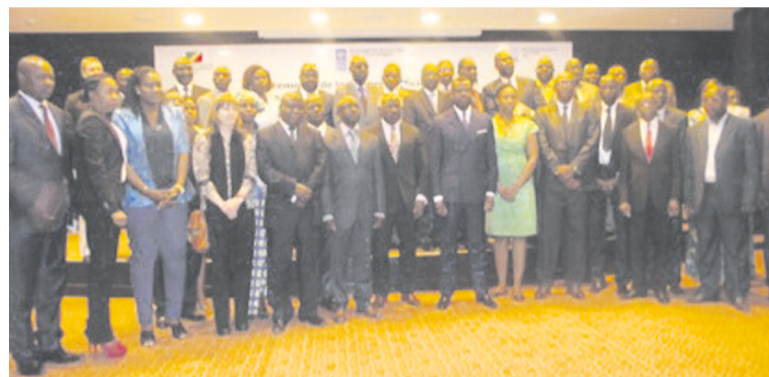
La photo de famille à l'issue de la cérémonie de lancement officiel du projet

Lançant le projet, le ministre du Tourisme et de l'Environnement, Josué Rodrigue Nguonimba, a reconnu qu'au Congo, avec moins de 500.000 visiteurs par an et, en dépit de l'accroissement enregistré par cette demande touristique ces dernières années, le niveau de fréquentation touristique reste encore faible. Très largement en