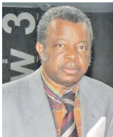
Le Pr Jean-Jacques Muyembe

Pour célébrer son trentenaire, à en croire le directeur général de cet institut, le Pr Jean-Jacques Muyembe, au cours d'un point de presse qu'il a tenu dans la salle de conférence de l'INRB, il est prévu l'organisation d'un congrès sur les pathologies émergentes et réémergentes d'origine infectieuse et non infectieuse. Ce congrès se tiendra du 4 au 6 décembre à Kempinski fleuve Congo Hôtel. Le programme de ce trentenaire prévoit également l'organisation d'une table ronde au cours de laquelle les chercheurs nationaux et internationaux échangeront sur les résultats de leurs recherches. À trente ans, révèle