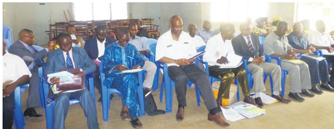
Les membres du Bureau exécutif national du RDD