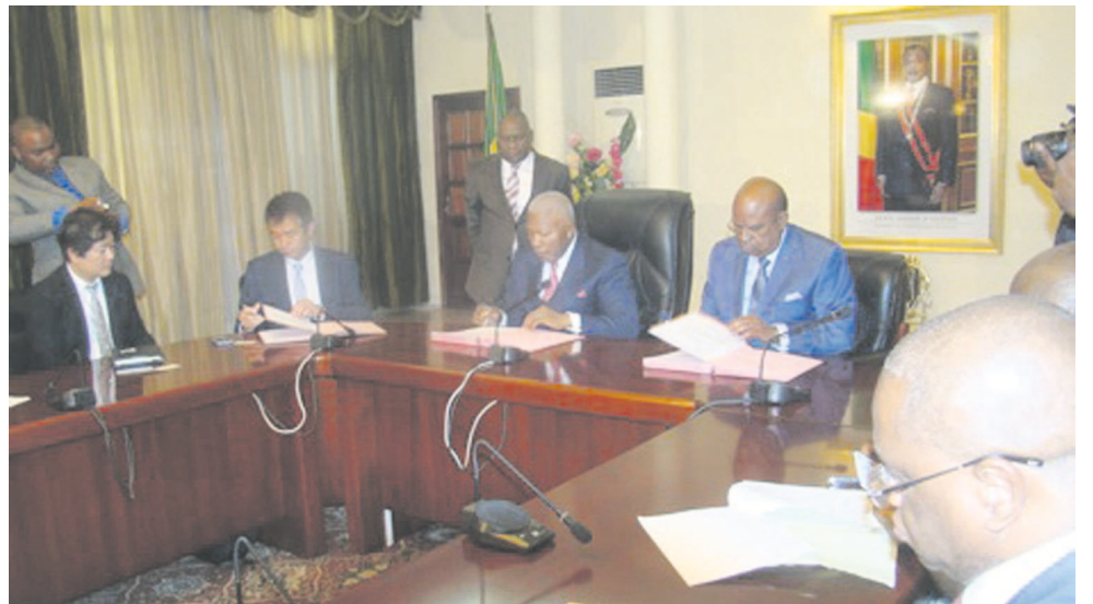
Les ministres Isidore Mvouba, André Raphaël Loemba et les investisseurs japonais signant le mémorandum

tion du méthanol, un produit chimique de grande importance, fabriqué à base de gaz naturel. Il sert à la fabrication de nombreux produits à usage domestique, tels que les parfums synthétiques, les vernis ainsi que de plusieurs autres produits dérivés.