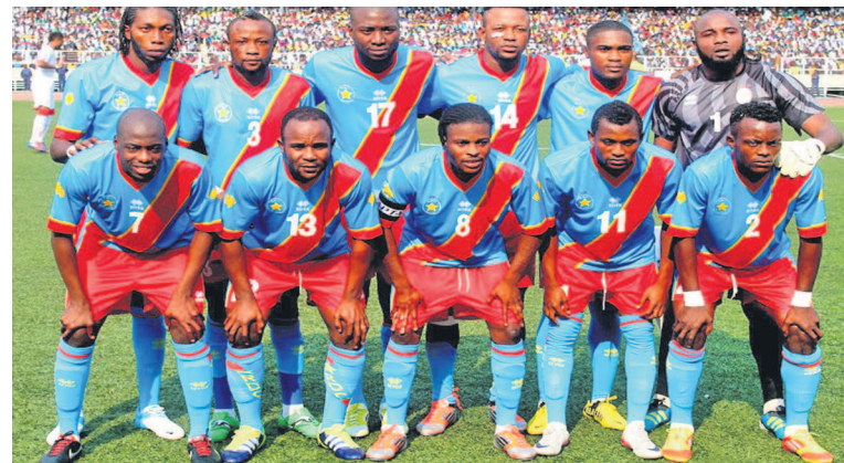
L'équipe des Léopards

Le tirage au sort s'est déroulé le 3 décembre à Malabo en Guinée Équatoriale.