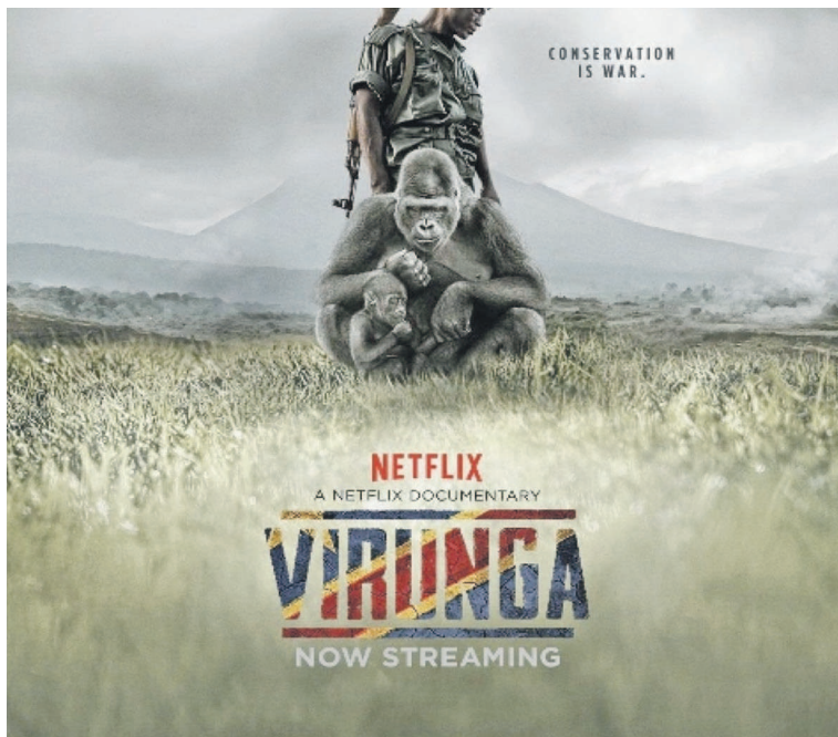
L'affiche du film

focalisé sur les gardes forestiers chargés de la protection des gorilles. Le film réalisé par Orlando von Einsiedel montre notamment comment le directeur du parc national des Virunga, Emmanuel de Merode, se bat contre les projets d'une société pétrolière. « Virunga raconte l'incroyable histoire de personnes qui risquent leur vie pour bâtir un meilleur futur dans une partie de l'Afrique que le monde a oublié. Dans les profondeurs boisées du Congo oriental se trouve le parc national des Virunga, un des endroits les plus riches en biodiversité du monde et la maison des derniers gorilles de montagne. Dans cet environnement sauvage mais enchanté, un petit groupe de personnes engagées dans des combats tente de sauvegarder ce parc. Ils veillent