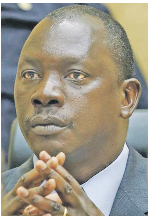
Thomas Lubanga Diyilo

Pour la Voix des sans-voix pour les droits de l'Homme (VSV), la confirmation de la peine infligée à Thomas Lubanga par le juge d'appel constitue un signal fort et vigoureux de la Cour pénale internationale (CPI) en direction d'autres seigneurs de guerre ainsi que de divers groupes armés qui persistent et continuent à commettre des crimes imprescriptibles dans la province du Katanga et dans l'est de la RDC. Cette ONG dit, par ailleurs, espérer que les autres crimes commis dans le pays, en général et tout récemment à Beni, en particulier où des massacres ont été perpétrés ne demeurent pas impunis.