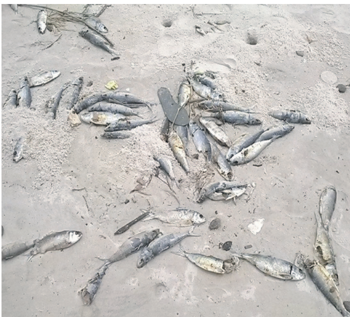
Des poissons que l'eau refoule sur la plage

La zone de la raffinerie de Mbotia présente un spectacle sans commentaire avec de nombreux poissons qui viennent échouer sur la plage, refoulés par les eaux de mer.