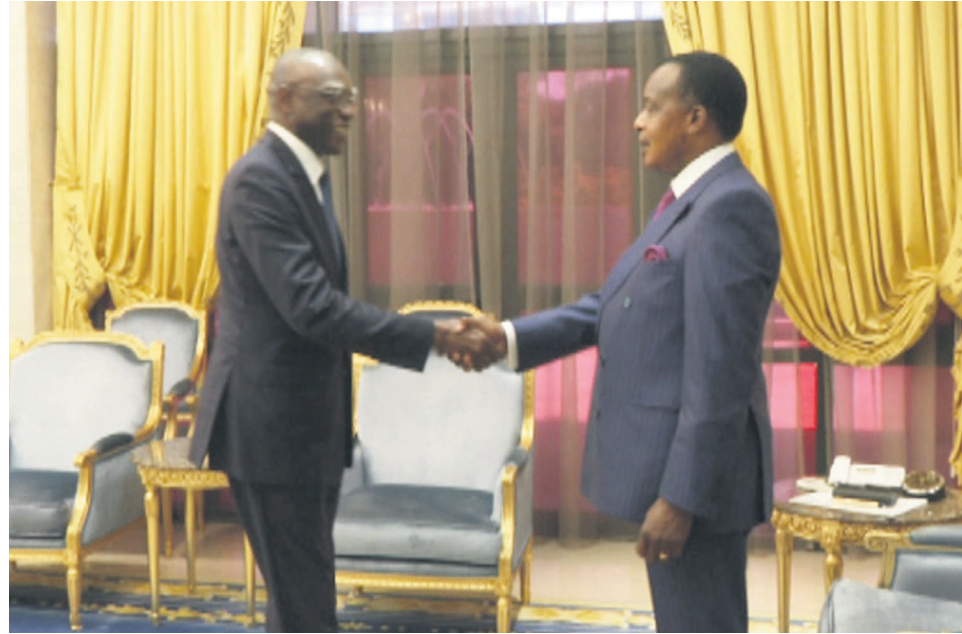
Denis Sassou N'Guesso et Babacar Gaye

Abordé à sa sortie d'audience, Babacar Gaye a indiqué que les Centrafricains semblent s'être dorénavant engagés pour la paix malgré des violences qui sont signalées quelques fois dans le pays. « Depuis, il y a beaucoup de développement, un engagement des différents groupes armés à participer au forum de Bangui, à choisir la voie du développement et du DDR », a-t-il déclaré. « Nous tenons à ce qu'il y ait une appropriation de ce processus par la partie centrafricaine », a insisté le chef de la Minusca, ajoutant que la présidente de la transition, Catherine Samba-Panza va mettre sur pied un comité chargé de la préparation du forum de Bangui. Lequel aura la mission de baliser le chemin et fixer la date exacte des assises. « Nous avons lancé l'idée qu'il y a à la fin de l'année à Bangui de nouveau une revitalisation de l'accord de Brazzaville qui est un excellent accord », a poursuivi le représentant spécial du secrétaire général de l'ONU, qui a, par ailleurs