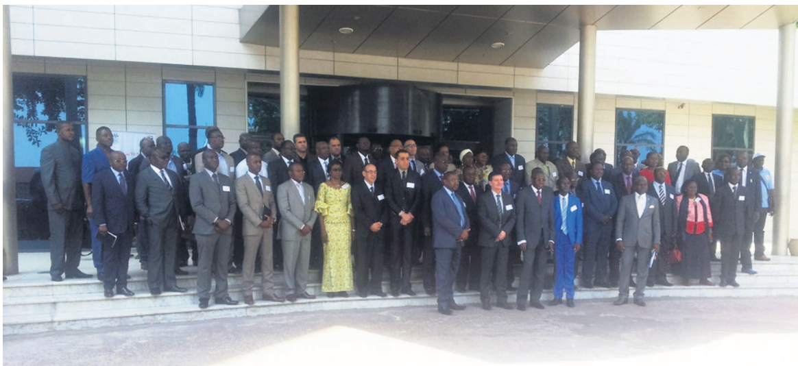
Les membres du Crédaf, photo Adiac

séminaire à savoir : Algérie, Bénin, Burkina Faso, Cameroun, Comores, Côte d'Ivoire, Guinée, Mali, Maroc, Niger, République