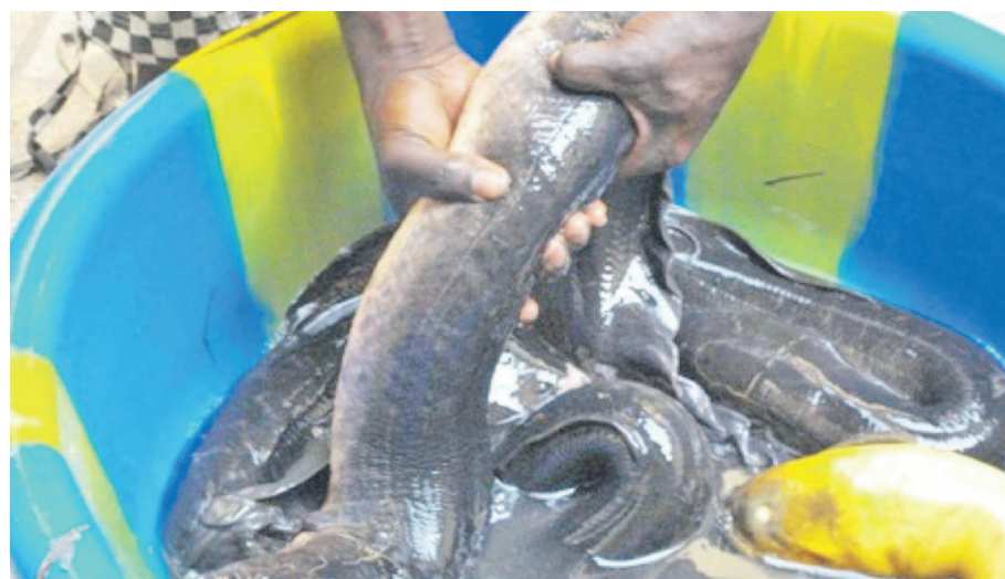
Hausse légère du prix des poissons

Sur instruction de la Troïka stratégique, les ministères de l'Économie nationale et des Finances devront arrêter des dispositions appropriées pour la gestion des stocks et prix de denrées alimentaires de première nécessité.