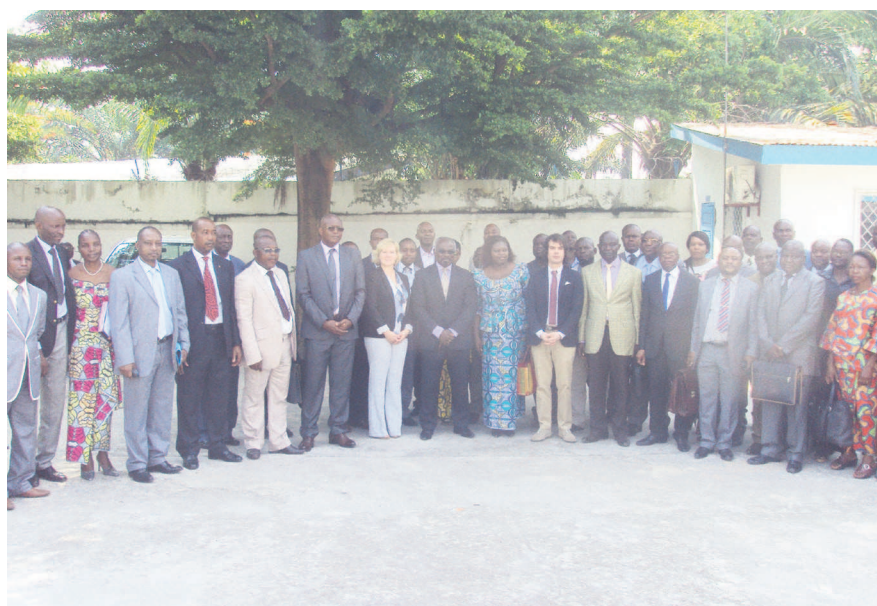
Les officiels posant avec les participants ; crédit photo Adiac

Dans le but de promouvoir l'amélioration et l'efficacité de l'action de son administration, le ministre du Tourisme et de l'environnement, organise du 8 au 19 décembre, avec l'appui technique du Programme des Nations unies pour le développement (PNUD) au Congo, un séminaire dit de renforcement des capacités de ses cadres et agents.