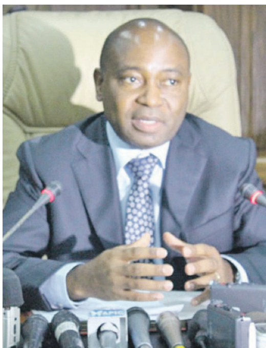
Le gouverneur de la BCC

est une priorité pour la BCC autant la performance des finances publiques est également une priorité pour le gouvernement. S'adressant à ceux qui mijotent de spéculer sur le prix et le change, le gouverneur de la BCC leur met en garde : « Ils écoperont des pertes énormes ». À l'issue de la réunion du comité de politique monétaire, laquelle réunion a passé en revue l'évolution de la conjoncture économique à fin novembre 2014, au niveau national et international, et échangé sur le dispositif de la politique monétaire à mettre en place au regard des évolutions observées, il a été décidé de maintenir inchangé le dispositif actuel de la politique monétaire. C'est ainsi que le taux directeur demeure à 2%. Quant aux coefficients de la réserve obligatoire, ils sont maintenus à 8% et 7% sur les dépôts en devise à vue et à terme ainsi qu'à 5% et 0% pour les dépôts en monnaie nationale à vue et à terme. Pour Deogratias Mutombo Mwana Nyembo, l'analyse de l'évolution récente de la conjoncture économique aussi bien nationale qu'in-