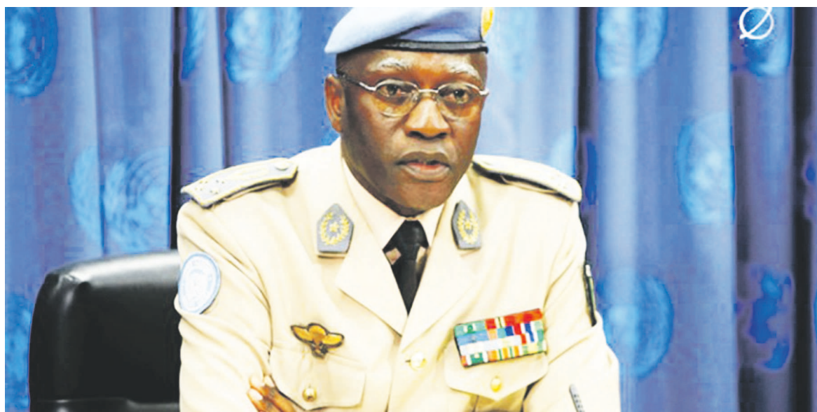
Le chef de la Mission multidimensionnelle intégrée des Nations unies pour la stabilisation en RCA (Minusca), Babacar Gaye

Le chef de la Mission multidimensionnelle intégrée des Nations unies pour la stabilisation en RCA (Minusca), Babacar Gaye, a annoncé, hier, l'idée de revitaliser l'accord de cessation des hostilités conclu le 23 juillet à Brazzaville.