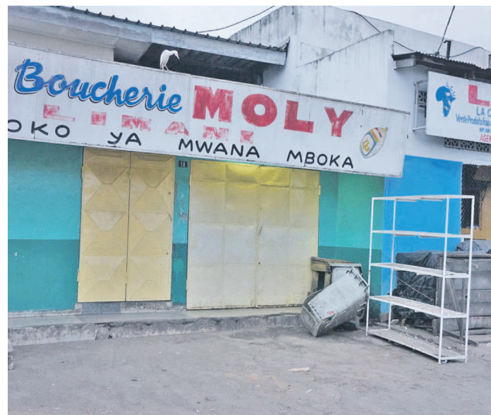
Vue de quelques boucheries temporairement fermées au grand marché de PN

et véreux n'obéissant pas à l'affichage des prix, et qui persistent dans la commercialisation des sacs en plastique et d'autres produits interdits ou dépourvus des dates limites de consommation et de péremption ont été temporairement fermés. Les propriétaires ont été convoqués à la direction départementale de la concurrence et de la répression des fraudes.