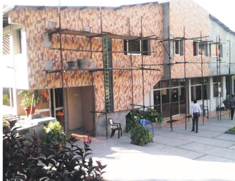
Le temple en cours de construction

L'église a été dédicacée de manière simple par le pasteur Barthélemy Masuaku qui a juste fait une prière à genoux devant la chaire face à la grande assemblée des fidèles et des hôtes réunis. La configuration du temple est assez originale. La salle dédiée au culte attenante à la salle de fête occupe le rez-de-chaussée du bâtiment à deux niveaux dont les étages composent les bureaux administratifs. À lui seul, l'édifice couvre le gros de la superficie de la parcelle qui l'abrite soit 1 245 m 2 sur 1 500 m 2 . L'architecte Arnold Ndongala, plus que ravi d'avoir mené à terme la tâche confiée par son pasteur, a estimé le coût global des travaux à 1 250 000 $. Les fidèles du CET ont contribué centime par centime pour l'érection de leur temple. Ils sont fiers d'y être parvenus sans apport extérieur. À Kinshasa, ce ne sont pas les églises qui manquent mais, le plus