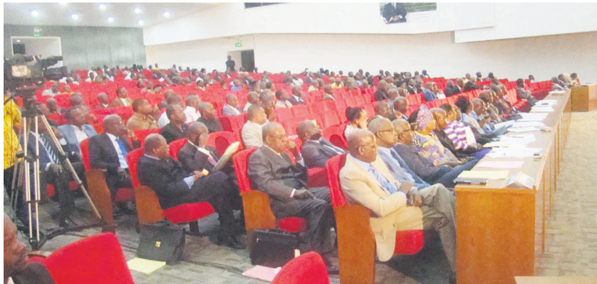
Une vue des sénateurs