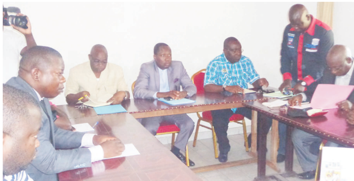
La Fécofoot échangeant avec les secrétaires généraux des clubs

Le démarrage du championnat national édition 2014-2015 annoncée pour le 20 décembre était au cœur des débats le 8 décembre entre les secrétaires généraux des clubs et les responsables de la Fédération congolaise de football.