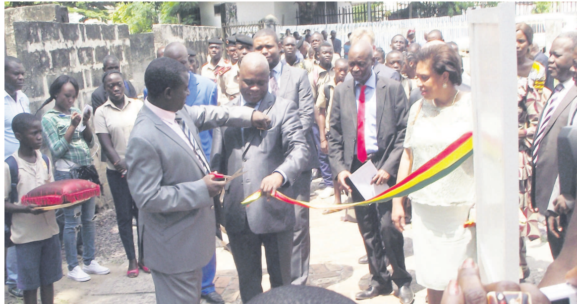
Le directeur de cabinet du ministre de la culture et des arts coupant le ruban symbolique

Ils sont nombreux, les vestiges, les témoins du temps, sur le territoire congolais, du littoral jusqu'aux massifs forestiers de l'extrême nord, en passant par le massif du Chaillu, les savanes des vallées du Niari, du Pool et des Plateaux. Ces témoins du temps qui constituent la plus value que les Congolais ont en partage, consciemment ou tacitement. Ces témoins du temps qui taisent toutes les basses discriminations égoïstes et parfois matérialistes : racisme, ethnocentrisme, sexisme, intégrisme,