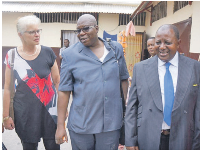
Visite guidée des autorités à la maison d'arrêt de Pointe-Noire

A cette occasion, Paul Morossa, directeur général de l'Administration pénitentiaire du Congo a exprimé, au nom du gouvernement sa gratitude à l'Union européenne, avant d'indiquer qu'il s'agit là de la preuve d'une coopération dynamique entre son pays l'institution occidentale. « La volonté du gouvernement est de moderniser l'espace judiciaire en général et le régime pénitentiaire en particulier. Construire une prison n'est donc pas dénué de signification et de portée politiques ; c'est fournir à une communauté humaine de